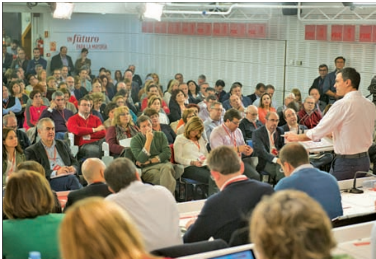
Pedro Sánchez, durante una intervención en el Comité Ejecutivo del pasado sábado