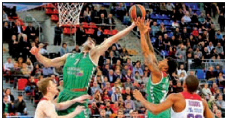
El Baskonia vuelve a estar en los puestos altos

biendo superado salidas complicadas al Palau blaugrana y al Barclaycard Center, el feudo del Real Madrid. El cuarto en discordia de la competición doméstica, el Laboral Kutxa Baskonia, será el próximo conjunto que ponga a prueba a los pupilos de Pedro Martínez. La cita será este domingo (19