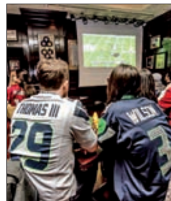
Superbowl en Hard Rock Café

fiestas privadas o que se reúnen en locales de temática típicamente americana para seguir el partido y, sobre todo, para empaparse del ambiente que se crea en torno a este evento. El lugar con más solera en esta costumbre es el Hard Rock Café de la plaza de Colón, que se engalana para la ocasión desde hace varias década-