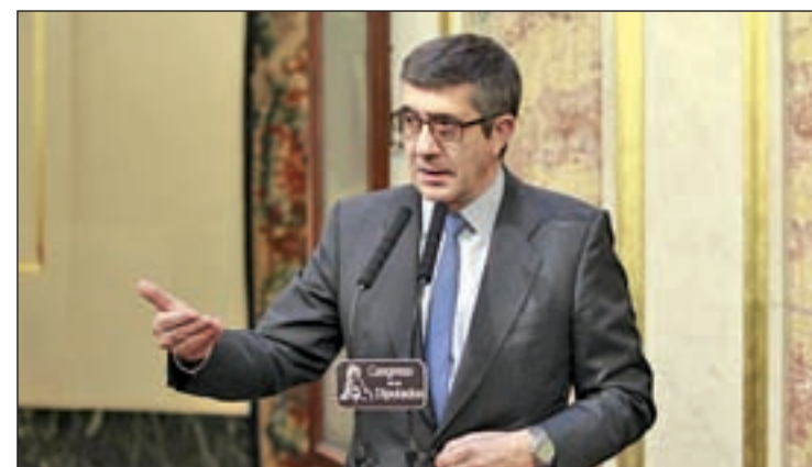
Patxi López, presidente del Congreso de los Diputados

Los dos vicepresidentes y los dos secretarios saldrán de sendas votaciones, ocupando la Vicepresidencia Primera quien tenga más votos, la segunda quien quede en