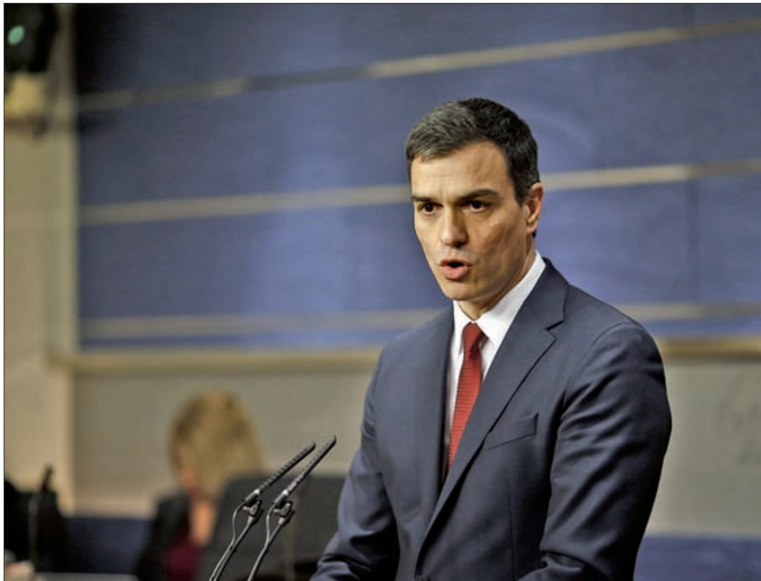
Pedro Sánchez compareció en el Congreso de los Diputados tras aceptar el mandato del Rey

El secretario general del PSOE acepta el encargo de Felipe VI y se someterá a la investidura, que puede retrasarse un mes • El líder socialista asegura que mirará "a izquierda y a derecha" PÁG. 2