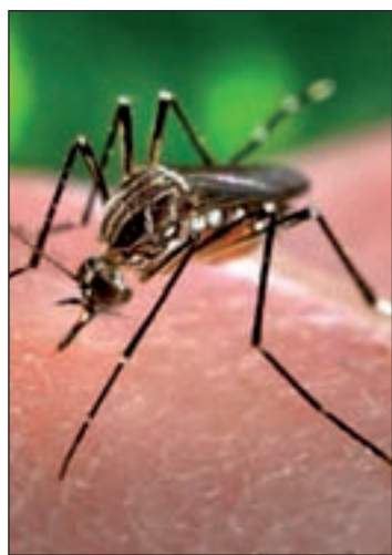
El mosquito del virus Zika