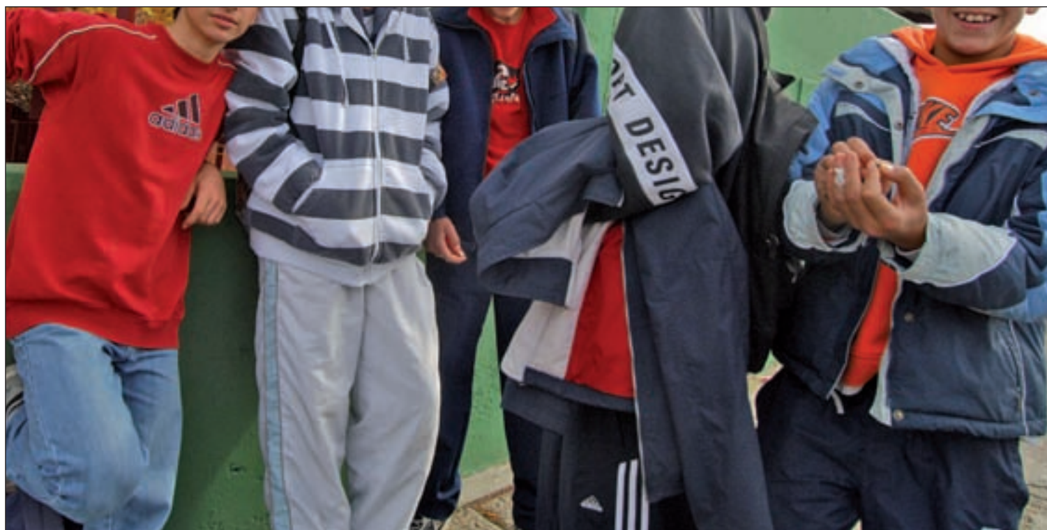
Jóvenes en la puerta de un instituto