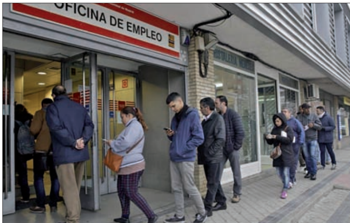
Cola de desempleados en una oficina de trabajo

Por provincias, el paro bajó en siete de ellas, principalmente en Huelva (-3.106 desempleados) y Las Palmas (-1.042). Por el contrario, subió en 45 de ellas, lideradas por Madrid (+7.978) y Sevilla (+4.403).