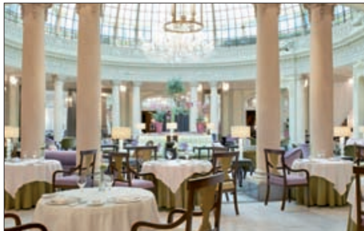
En el Palace se podrá degustar el menú del chef Da Dong

Dichos restaurantes ofrecerán un menú especial elaborado para la ocasión desde el 8 de febrero hasta el 6 de marzo, mediante los cuales pretenden acercar los platos típicos chinos a un precio asequible. La participación en esta fiesta cuenta con un valor añadido, y es que por cada menú se