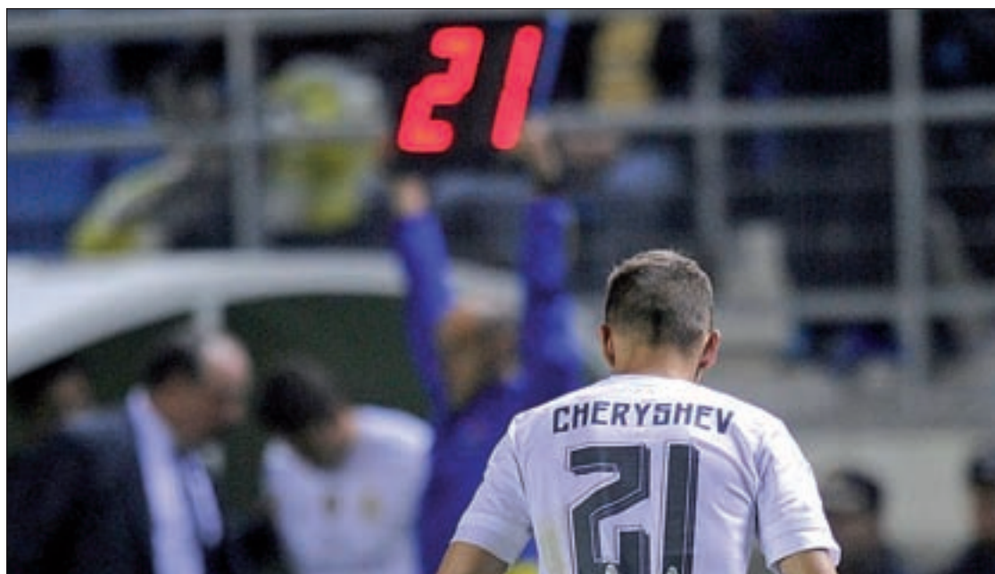
Cheryshev, uno de los jugadores que cambió de equipo a última hora

Pocos días después habrá una nueva fecha en el calendario, ya que el retorno de las competiciones europeas hará que hasta tres partidos se disputen el próximo miércoles día 10.