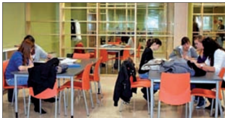
Un grupo de alumnos en el colegio

Junto con España, los países donde los alumnos estudian menos lenguas son Hungría (6,3%), Irlanda (7,9%), Austria, (9,5%), Bulgaria (17%) y Bélgica (26,1%), mientras que, por el contrario, los