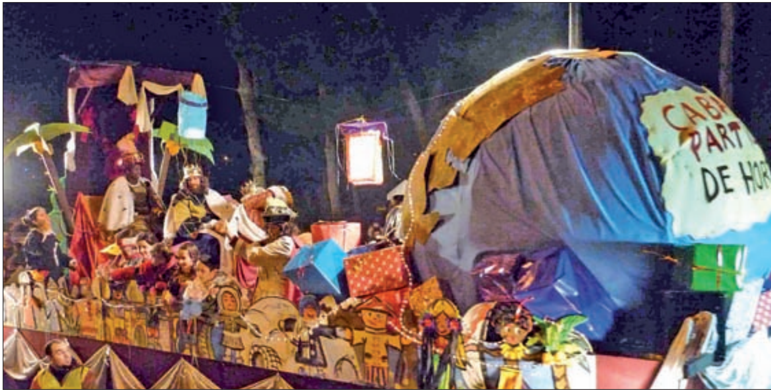
Sus majestades, Melchor, Gaspar y Baltasar en la cabalgata de Hortaleza