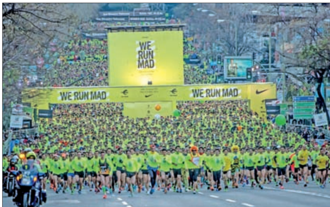
La marea amarilla inundó las calles de la capital el año pasado

La alta demanda que ha caracterizado en los últimos años a una de las carreras con más fama, tanto a nivel nacional como internacional, ha animado a muchos municipios de los alrededores a organizar pruebas similares. La cercanía respecto a su hogar, la comodidad a la hora de inscribirse e incluso un horario más compatible con los compromisos familiares de estas fechas hace que va-