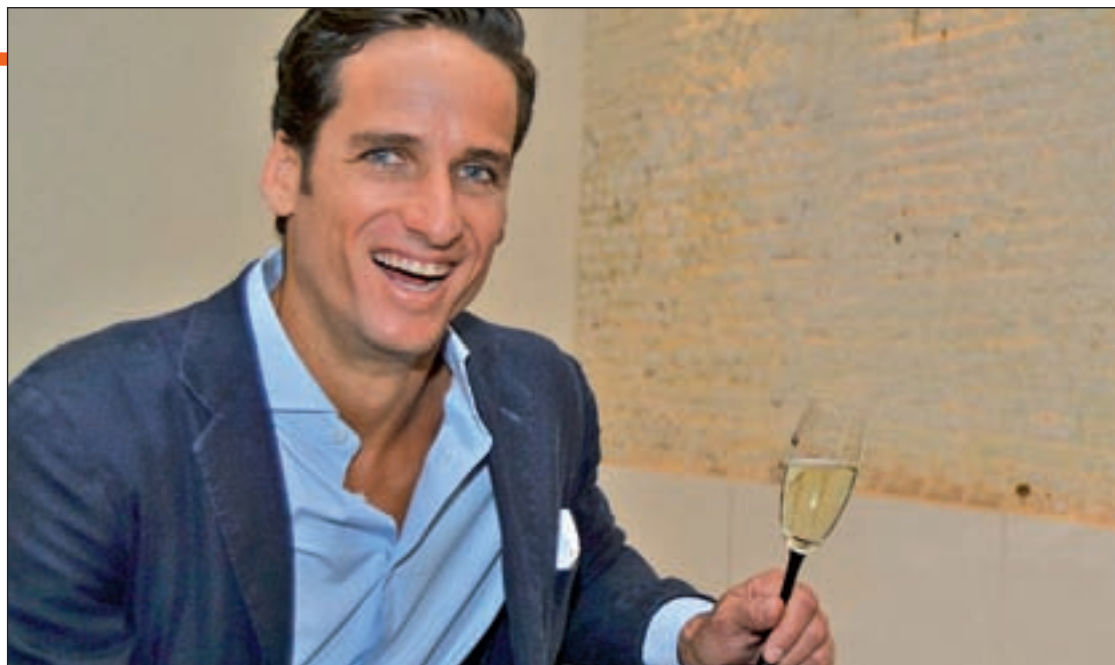
Feliciano López brindando por el Año Nuevo

Todo el mundo intenta inculcarle a sus hijos lo que a ti te han inculcado tus padres, aunque tengas tu forma de verlo. Yo intento hacerle ver al hijo de Alba que las cosas también cuestan y que hay muchos niños que no tienen regali-