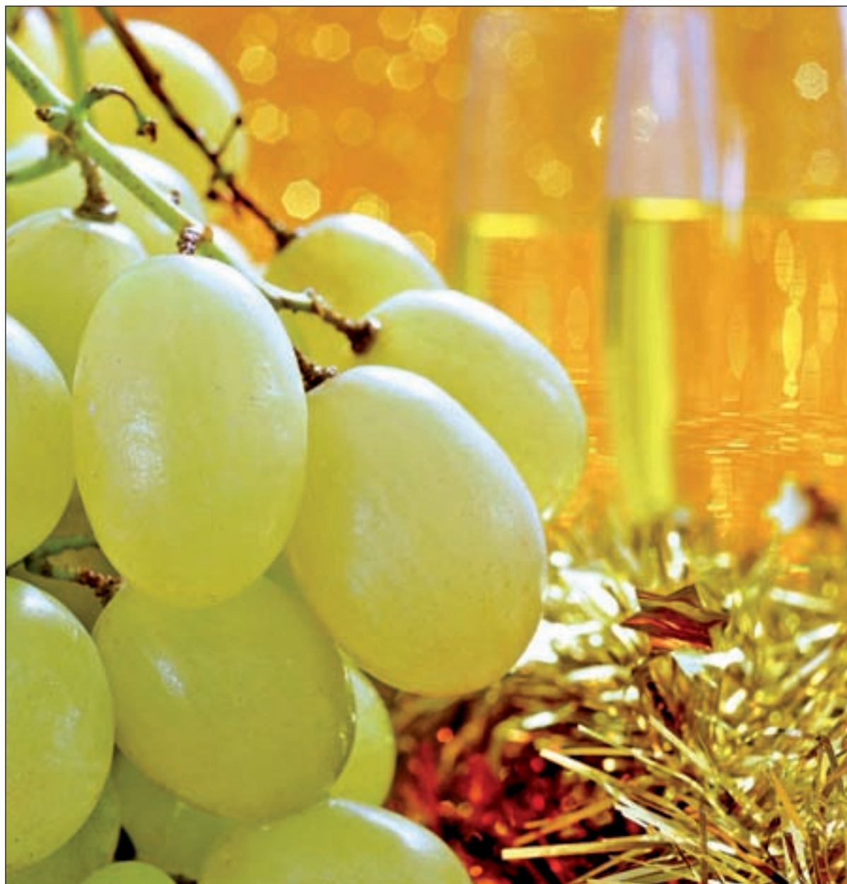
La crisis económica no ha provocado un descenso del consumo de uvas en Nochevieja

Con motivo de la Nochevieja se producen más de 2 millones de kilogramos y se crean cerca de 13.000 puestos de trabajo • La variedad embolsada del Vinalopó es la única con Denominación de Origen