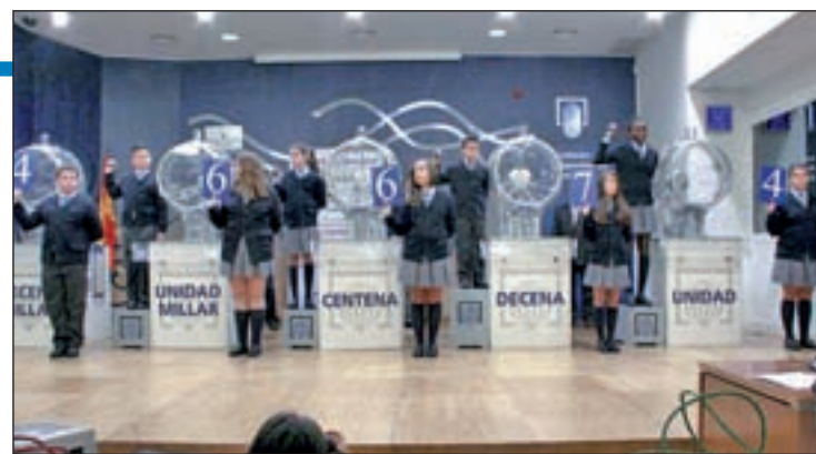
El sorteo tendrá lugar el próximo 6 de enero

59, 75 y 97, según datos de Ventura24. Por otra parte, el 0, el 7 y el 9 son los reintegros que más se han repetido en este sorteo que comenzó en el año 1941.