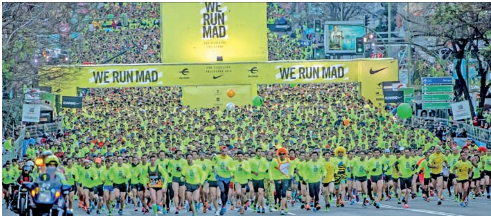
La marea amarilla inundó las calles de la capital el año pasado

Una de las que más tradición tiene es la San Silvestre de Móstoles, que este año celebró su vigésima edición. Una de las peculiaridades de esta carrera es que, a pesar de llevar el nombre del santo, no se disputa el 31 de diciembre, sino el 28, y además su recorrido no se extiende hasta los 10 kilómetros, quedándose en 8. Por su parte, la localidad de Getafe apuesta por la tradición y reserva la mañana del día 31 para esta prueba. A partir de las 11 de la mañana dará comienzo una carrera que está organizada por la Peña PCeros y que, tras 34 ediciones, está más que consolidada en el calendario regional. Collado Villalba, Bustarviejo, Alcobendas o Las Rozas también despedirán el año a ritmo de San Silvestre, formando una lista a la que este año se suma Colmenar Viejo.