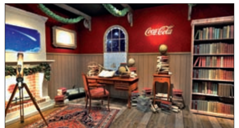
Biblioteca de la Casa de los Reyes Magos

La visita, que es gratuita, puede realizarse todos los días de 10 a 14 horas y de 16 a 21 horas, excepto el 24 de diciembre, que se reducirá el horario de 10 a 18 horas.