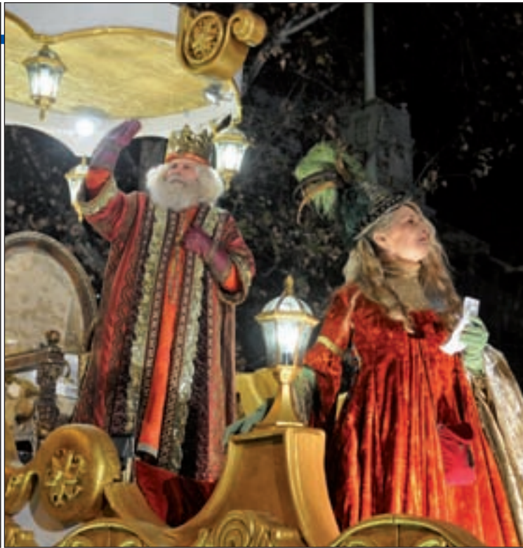
Un momento de la Cabalgata de los Reyes Magos de Madrid de la edición de 2015