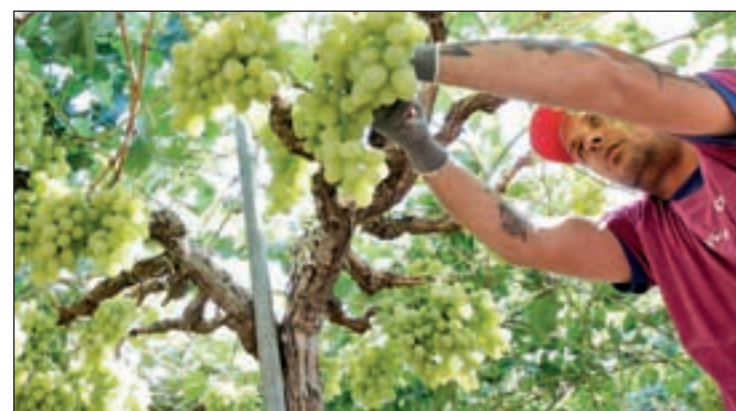
Tratamiento de la uva en la comarca del Vinalopó

No ocurre lo mismo con la novedad de las uvas en conserva, y es que los españoles prefieren la compra a granel o los 'packs' especiales de doce uvas que se preparan para la Nochevieja. Eso sí, siempre que sean frescas.