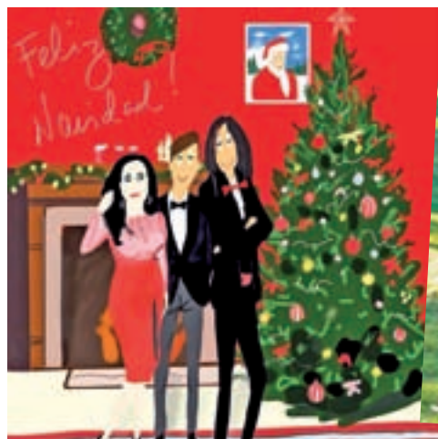
A la izquierda, la original felicitación de Alaska y Mario Vaquerizo. A la derecha, Jorge Javier Vázquez

Una de las felicitaciones que más ha sorprendido en el mundo