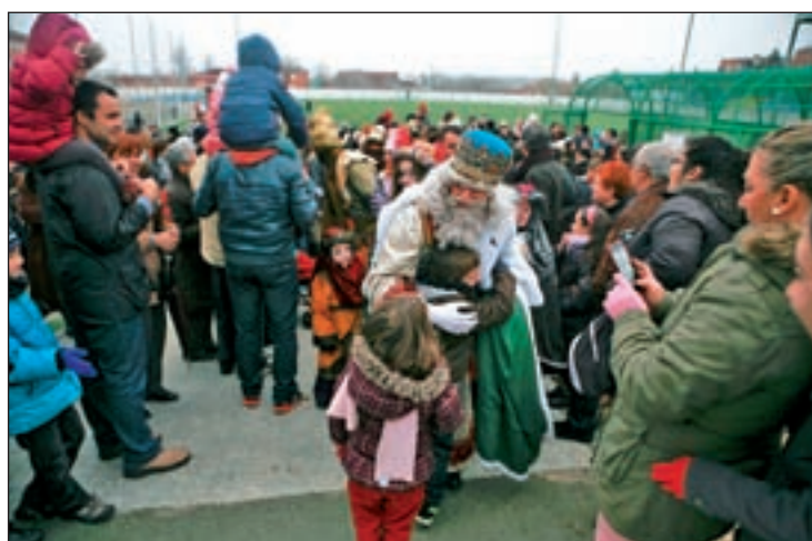
El rey Melchor saluda a varios niños en La Fortuna

Por otra parte, los castillos hinchables gratuitos o la pista de hielo sintético situadas en el bulevar que media entre las calles Jesús y Lisboa han marcado el ocio al aire libre del barrio a lo largo de estas fechas. Propuestas que han estado acompañadas por