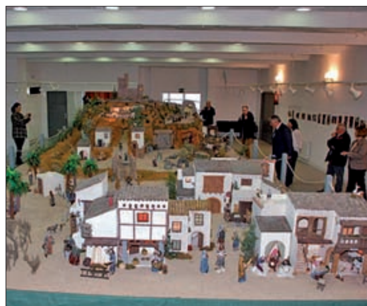
BELÉN MUNICIPAL: Este año, el nacimiento de Colmenar está constituido por 200 figuras y cuenta con una superficie de casi 40 metros cuadrados. Se encuentra ubicado en el salón de actos del Centro Cultural Pablo Neruda.