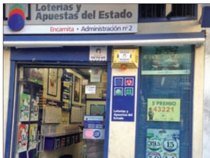
Administración agraciada en la calle Madrid

QUINTO PREMIO EL NÚMERO PREMIADO ES EL 43.221