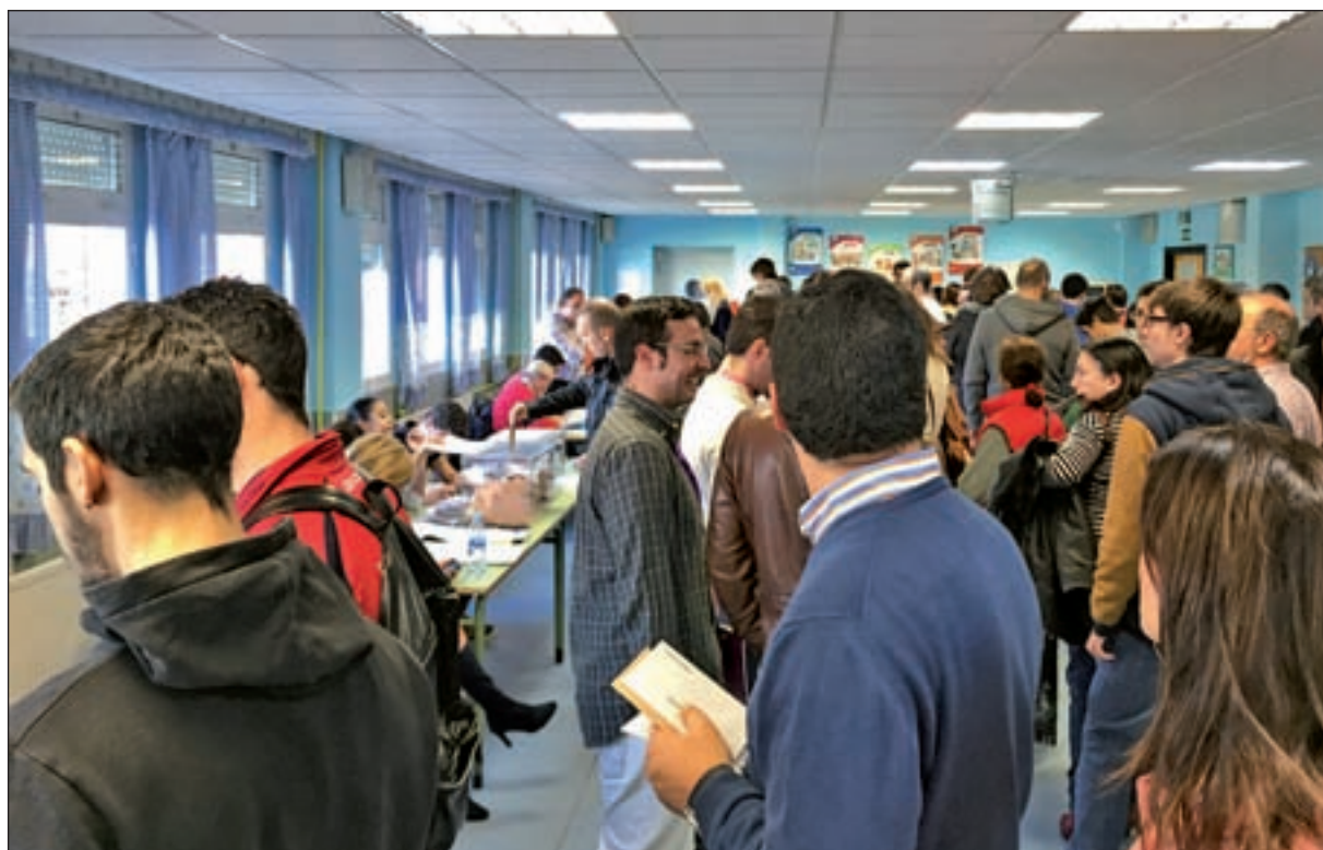
Colegio electoral de Tres Cantos

Sin duda, una de las grandes sorpresas de estas elecciones ha