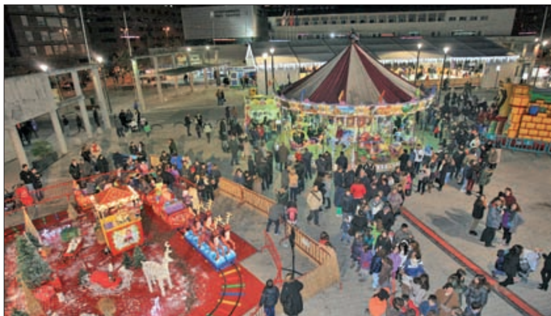
CIUDAD DE LA ILUSIÓN: Hasta el próximo 10 de enero, la Ciudad de la Ilusión de Tres Cantos, situada en la Plaza del Ayuntamiento, permanecerá abierta para los vecinos tricantinos con una amplia oferta de actividades, entre las que se encuentran un trenecito, castillos hinchables, un tióvivo y puestos venta de churros y otros productos.