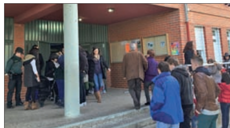
La abstención pasó en Colmenar de 7.310 personas a 7.488

No obstante, los dos municipios coinciden en la bajada de sufragios nulos; entre los dos, 191 menos que en el 2011. Por último, también se reducen las papeletas en blanco, con 215 menos que hace cuatro años entre ambas localidades.