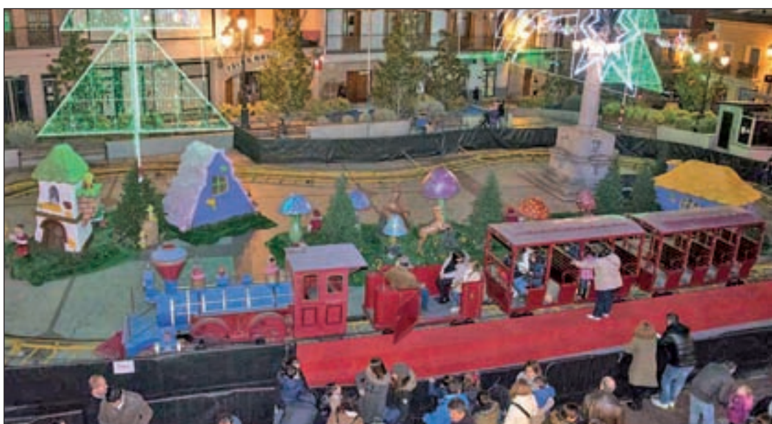
TREN EXPRESO: La Plaza del Pueblo de Colmenar Viejo albergará hasta el próximo 10 de enero el Tren Expreso de Navidad. Desde dos euros, los más pequeños del municipio disfrutarán de un animado recorrido, mientras que los comercios colmenareños podrán adquirir tickets desde solo un euro para regalar a sus clientes.