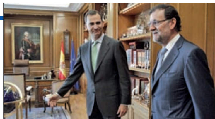
Felipe VI, en una reunión anterior con Rajoy

dría con obtener una mayoría simple. Si no hubiese acuerdo dos meses después de la primera votación de investidura se convocarían nuevas elecciones.