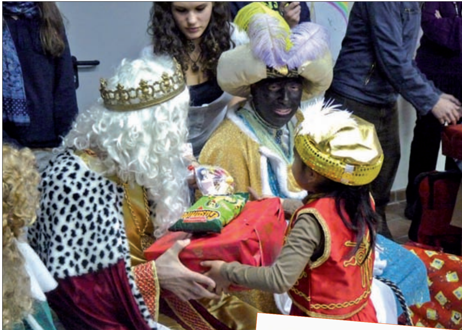
Algunos de los niños recibiendo sus regalos