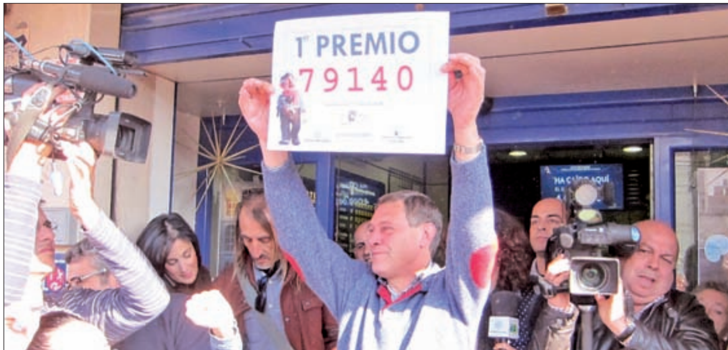
El lotero muestra el número agraciado en la localidad de Roquetas de Mar (Almería)