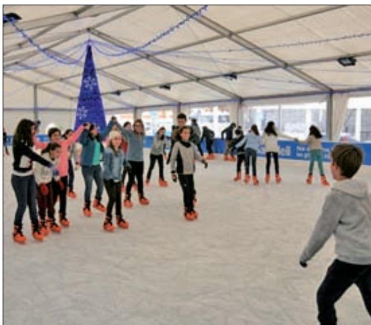
PISTA DE HIELO: Cerca de 600 alumnos de 5º y 6º de Primaria de los colegios públicos y concertados de Tres Cantos ya han podido disfrutar, en horario de mañana, de la pista de hielo ubicada en la Plaza del Ayuntamiento.