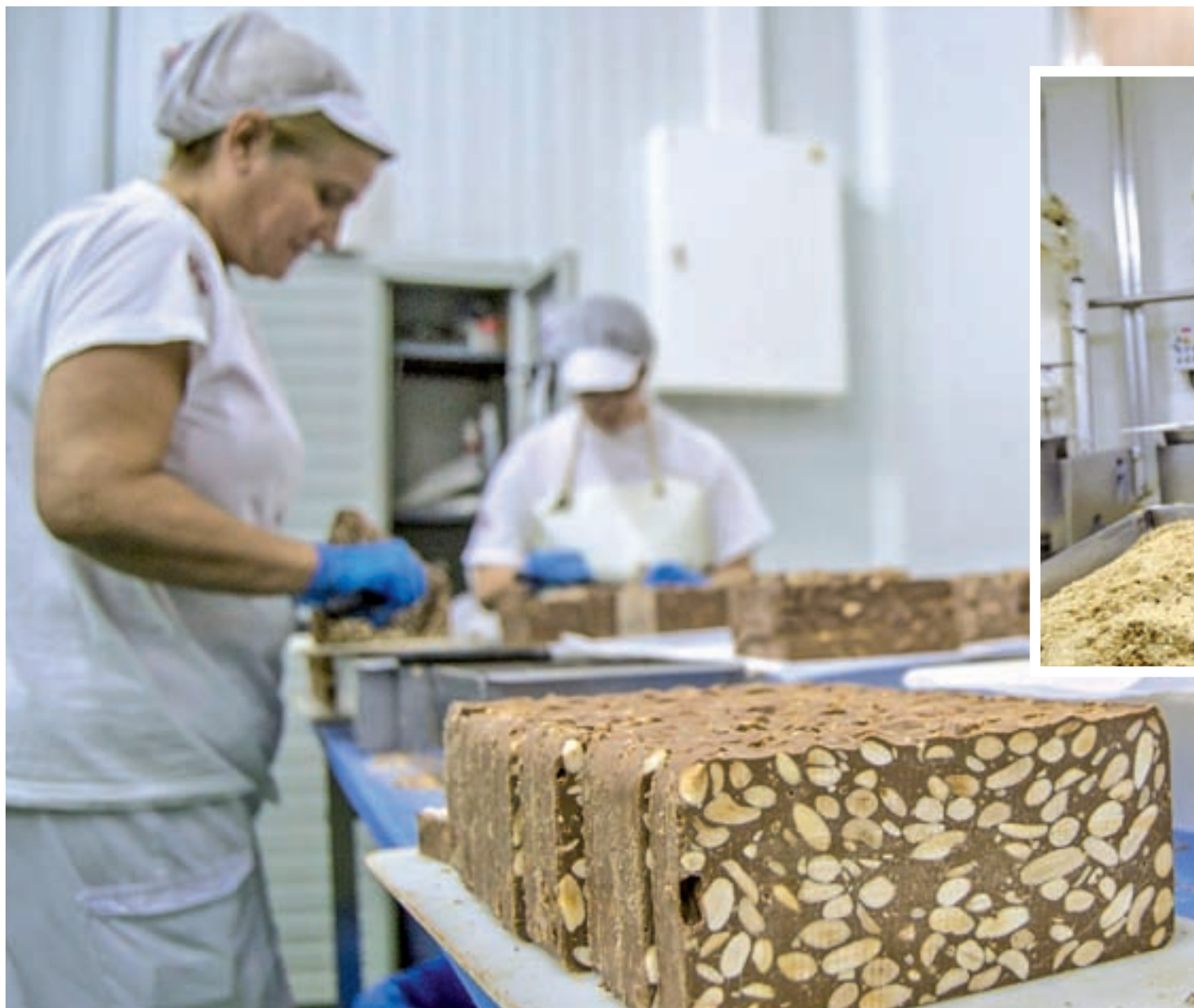
Personas en un obrador elaborando el turrón