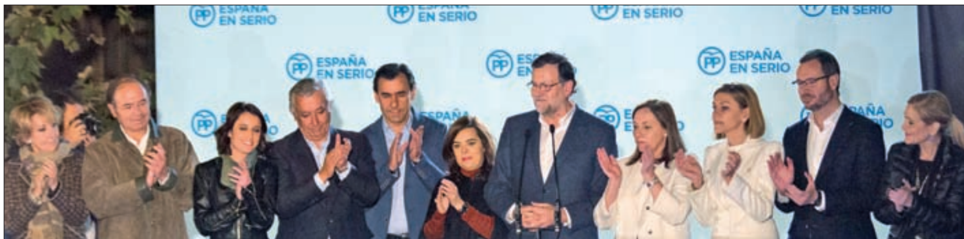
Mariano Rajoy, rodeado de los suyos, en el balcón de la sede de Génova el pasado domingo