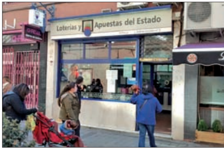
Fachada de la administración donde se ha vendido el número GENTE