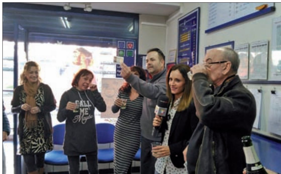
Las loteras y los agraciados, que se acercaron a la administración, celebrando el premio