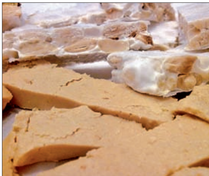
Turrónes duros y blandos