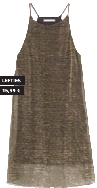
LEFTIES 15,99 €