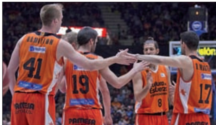
El Valencia Basket lidera la clasificación con autoridad

Por su parte, el último campeón sigue con su escalada en la clasificación y ya es segundo. El Real Madrid de Pablo Laso ha ido recuperando las sensaciones tras un inicio titubeante y ahora aspira a desbancar al Valencia Basket de lo más alto de la tabla. Para