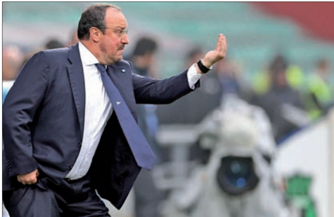
El entrenador madridista sigue en la cuerda floja

La particular cuesta abajo de los blancos vivió un nuevo capítulo el pasado domingo con la derrota por 1-0 ante el Villarreal. Más que la pérdida de los tres puntos, lo más notable fue la indolencia mostrada por los jugadores en el primer tiempo, una actitud que para algunos es un síntoma de la escasa sintonía que tiene Benítez con la plantilla. Con el equipo a cinco puntos de los dos líderes, el Madrid no puede permitirse un tropiezo este domingo (16 horas) con motivo de la visita del Rayo Vallecano. Vencer y convencer serán los objetivos de un conjunto que, mirando al pasado, ya sabe lo que es vivir una crisis importante tras una derrota con el Rayo en casa. Sucedió en la temporada 1995-1996, cuando el equipo franjirrojo se impuso