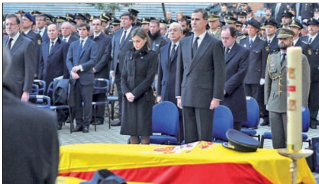
Un momento del funeral de Estado

Así, el IPC interanual encadena cuatro meses consecutivos en negativo después de haber registrado en agosto, septiembre y octubre tasas del -0,4%, del -0,9% y del -0,7%, respectivamente.