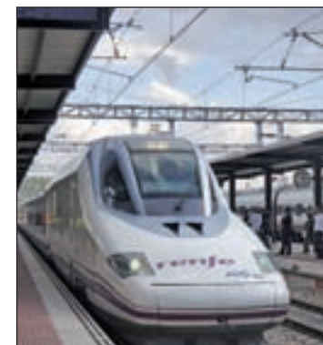
AVE a León

inauguraciones están prohibidas. Este tramo de 107 kilómetros de longitud entre Olmedo (Valladolid) y Zamora, que es el que se estrenó, permitirá reducir a una hora y media el viaje en tren entre Madrid y la capital zamorana, frente a las casi dos horas que supone actualmente.