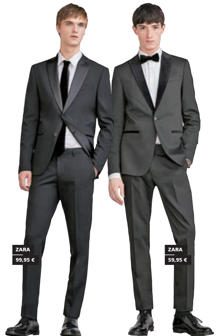
ZARA 99,95 €

Los 'looks' de Nochevieja para los chicos pueden parecer a primera vista más sencillos, pero si lo que buscas es diferenciarte del resto y aportar un punto de modernidad no es tan fácil. Cierto es que el traje se convierte en la prenda ideal para tomar las uvas y salir de fiesta con los amigos. Sin embargo para ir a la moda lo mejor es combinarlo con una pajarita. Si prefieres corbata, una que sea de pala estrecha porque es más juvenil y acentúa la figura. En cuanto a los colores del traje, el gris marengo, el azul medianoche y el negro serán los reyes. Otra opción para los que no quieren usar traje es vestir camisa de esmoquin y corte 'slim' con cuello básico y con una corbata alfiler.