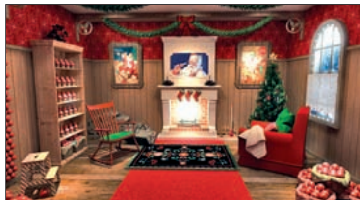
Casa de Papá Noel

que a la gran pantalla llegan películas como 'El viaje de Arlo', 'Go-co, el pequeño Dragón' o la segunda parte del film 'Hotel Transilvania'.