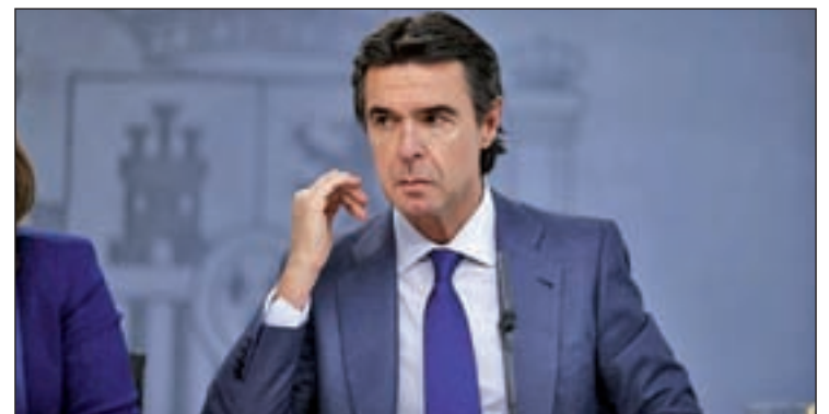
El ministro de Industria, José Manuel Soria

Este sistema de incentivos, indicó Soria, se tuvo que modificar porque resultaba "inviabile" y podía conducir "a la quiebra" del sistema energético en España, dando como resultado que se haya pasado de unos 400 millones anuales de déficit a tener superávit en 2014 y 2015.