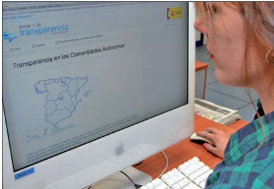
Portal de Transparencia de la Comunidad de Madrid

Pero además de esto, la ley obliga a que exista un órgano que resuelva las reclamaciones de los ciudadanos que consideran que