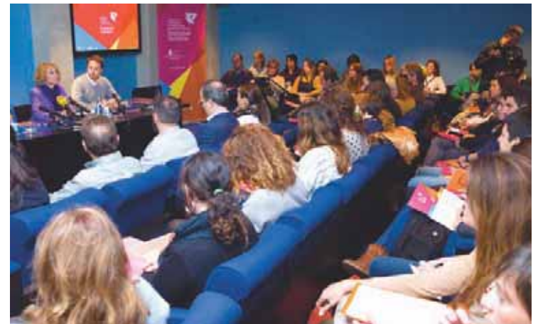
Díaz Tezanos durante la inauguración del Laboratorio.

La vicepresidenta anunció que Cantabria se sumará a la campaña internacional para la Década del Empleo Juvenil, "que va a aportar ideas y soluciones que tienen que ser consensuadas para la consecución de un empleo de calidad y estable".