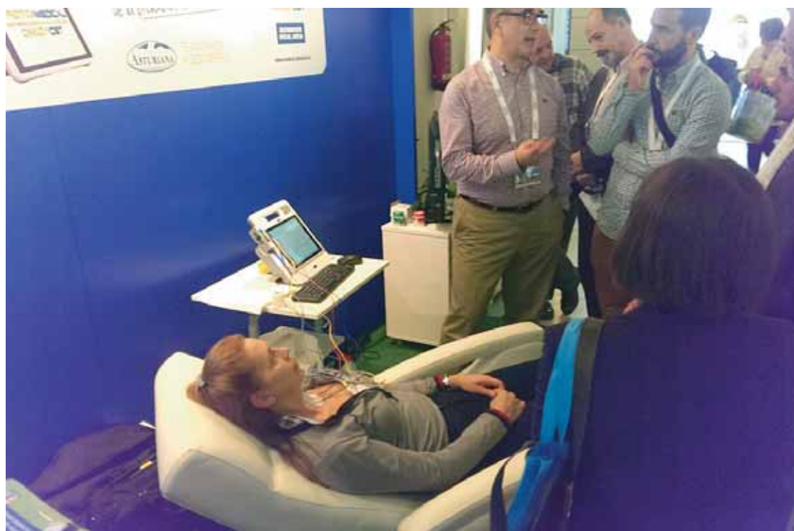
Demostración del funcionamiento del analizador ANESA.

Resultados fiables 100%. Sus certificaciones así lo avalan y el es-