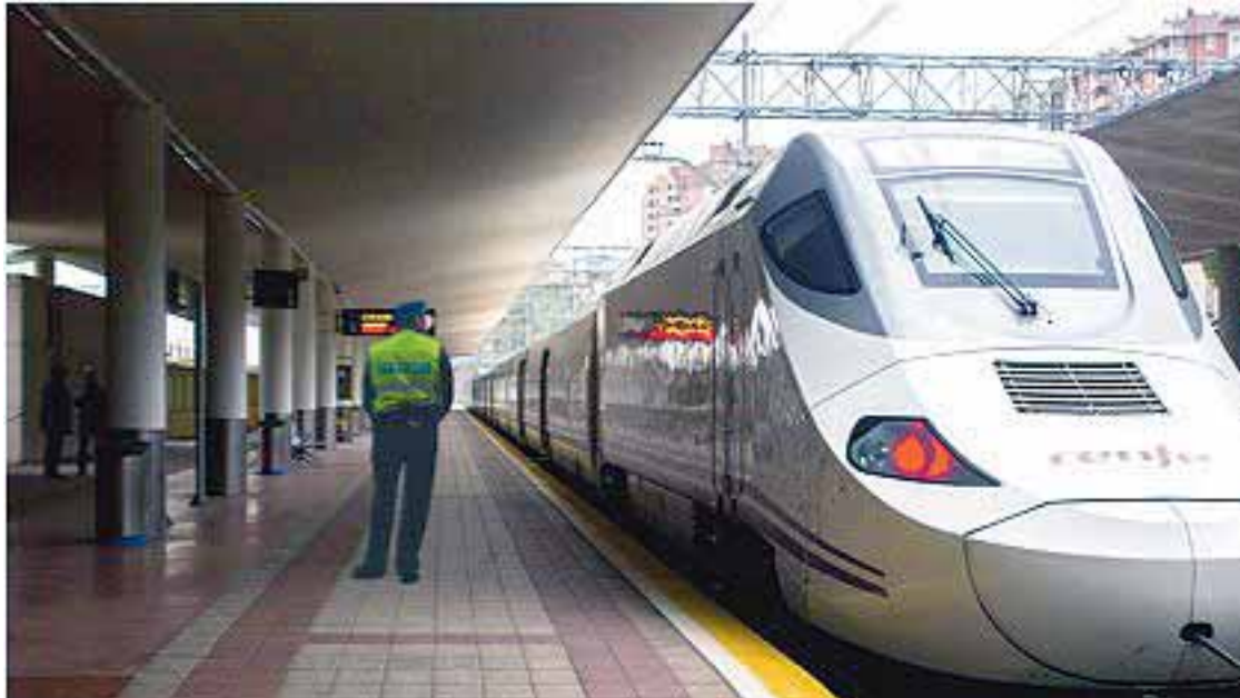
Vigilante de seguridad comprobando el estado del tren.