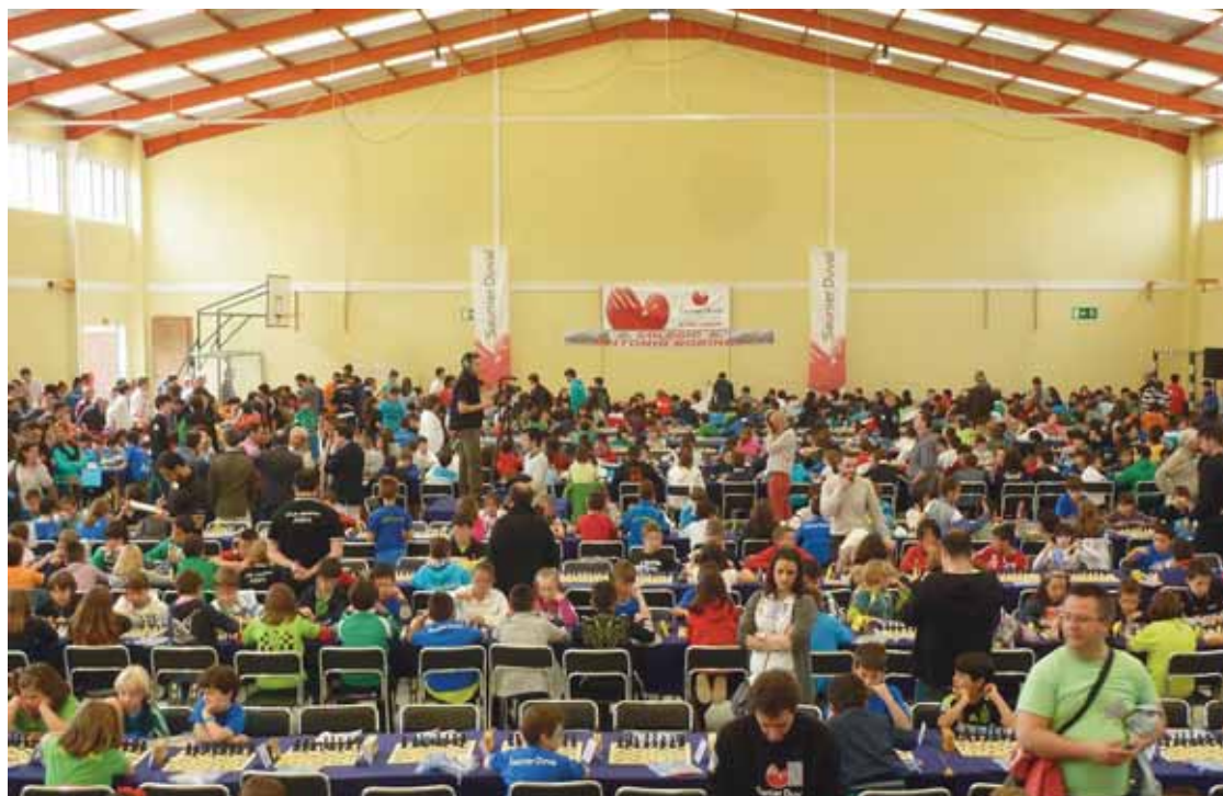
Exhibición de ajedrez en el Colegio Antonio Robinet de Vioño.

El Pabellón de Renedo acogerá el jueves, 17 de diciembre, de 18:00 a 20:00 horas, la Fiesta de Navidad y al día siguiente, el viernes, 18 de diciembre, a las 18:30 horas, exhibición de Hip-Hop y Funky House en el Pabellón de Liencres, donde también tendrá lugar el sábado, 19 de diciem-