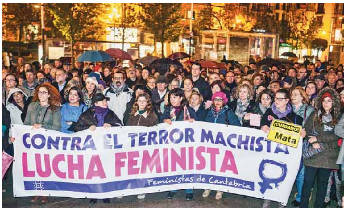
Miembros del Gobierno, como la vicepresidenta Díaz Tezanos, se sumaron a la protesta.

Varios cientos de personas desafiaron las inclemencias del tiempo para mostrar su condena a la violencia ejercida contra las mujeres y exigir ante las administraciones medidas que lleven a su erradicación. Precisamente, en el comunicado leído por miembros de la Comisión, plataforma que integra a agrupaciones de mujeres, así como secciones de la mujer de sindicatos y partidos políticos, al final de la manifestación, se responsabiliza, en parte, a los gobernantes de este problema social y se señala "responsables directos" de la "escandalosa" cifra de mujeres asesinadas por violencia machista a los gobernantes de las distintas Administraciones que "con