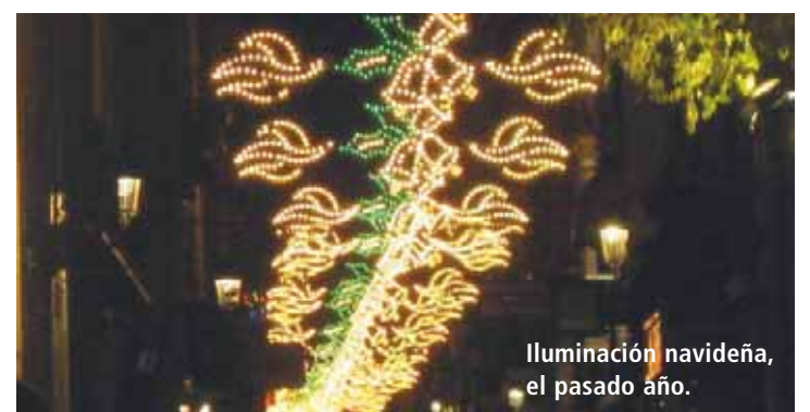
Iluminación navideña, el pasado año.

be destacar también que el próximo día 4 de diciembre se abrirán al público el tradicional mercado navideño y la pista de hielo, en la Plaza Alfonso XIII y la Plaza Porticada, respectivamente, contribuyendo a fomentar el ambiente festivo en toda la ciudad.