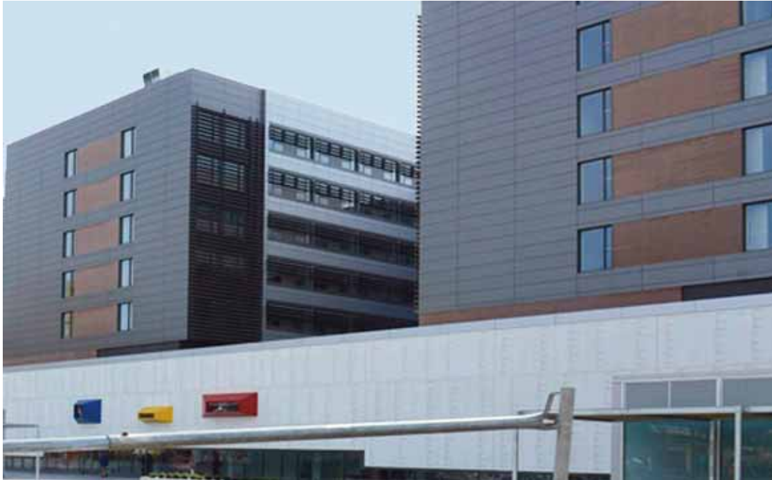
Dos de las tres nuevas torres del Hospital Universitario Marqués de Valdecilla.