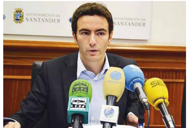
Pleno del Ayuntamiento de Santander.

Y Ganemos, que quería que la moción incluyese la supresión de la bonificación también a los lugares de culto, apoyó la iniciativa pero considerándola "insuficiente". Cree que "los ciudadanos no deberían pagar con sus impuestos el mantenimiento de edificios de culto" que, además, "obtienen beneficios por celebraciones y no los tributan".