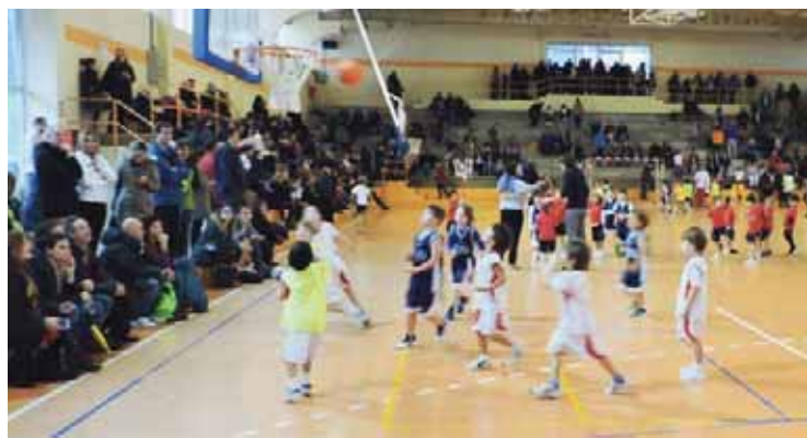
Colegio Las Esclavas de Santander.

14:00 horas, y de tarde, entre las 16:00 y las 18:30 horas, en el Pabellón de Renedo, Torneo de Fútbol Sala Base y el lunes 4 de enero, a las 10:00 y las 18:00 horas, también en el mismo emplazamiento, el VII Torneo de las Escuelas Municipales de Baloncesto.