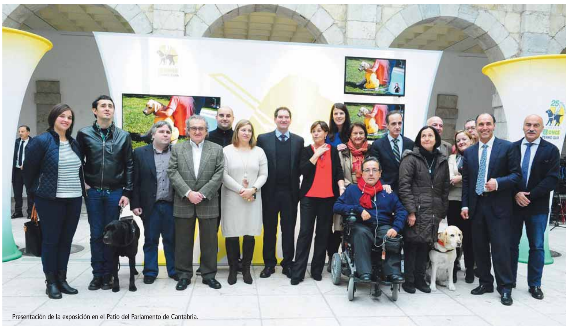
Presentación de la exposición en el Patio del Parlamento de Cantabria.

El Patio del Parlamento de Cantabria acoge, hasta mañana sábado, una exposición acerca del trabajo de los 24 canes de la Fundación ONCE del Perro Guía que están en activo actualmente en nuestra región