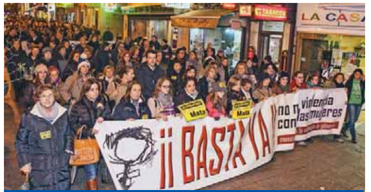
Cantabria grita contra el terrorismo machista Pág.5