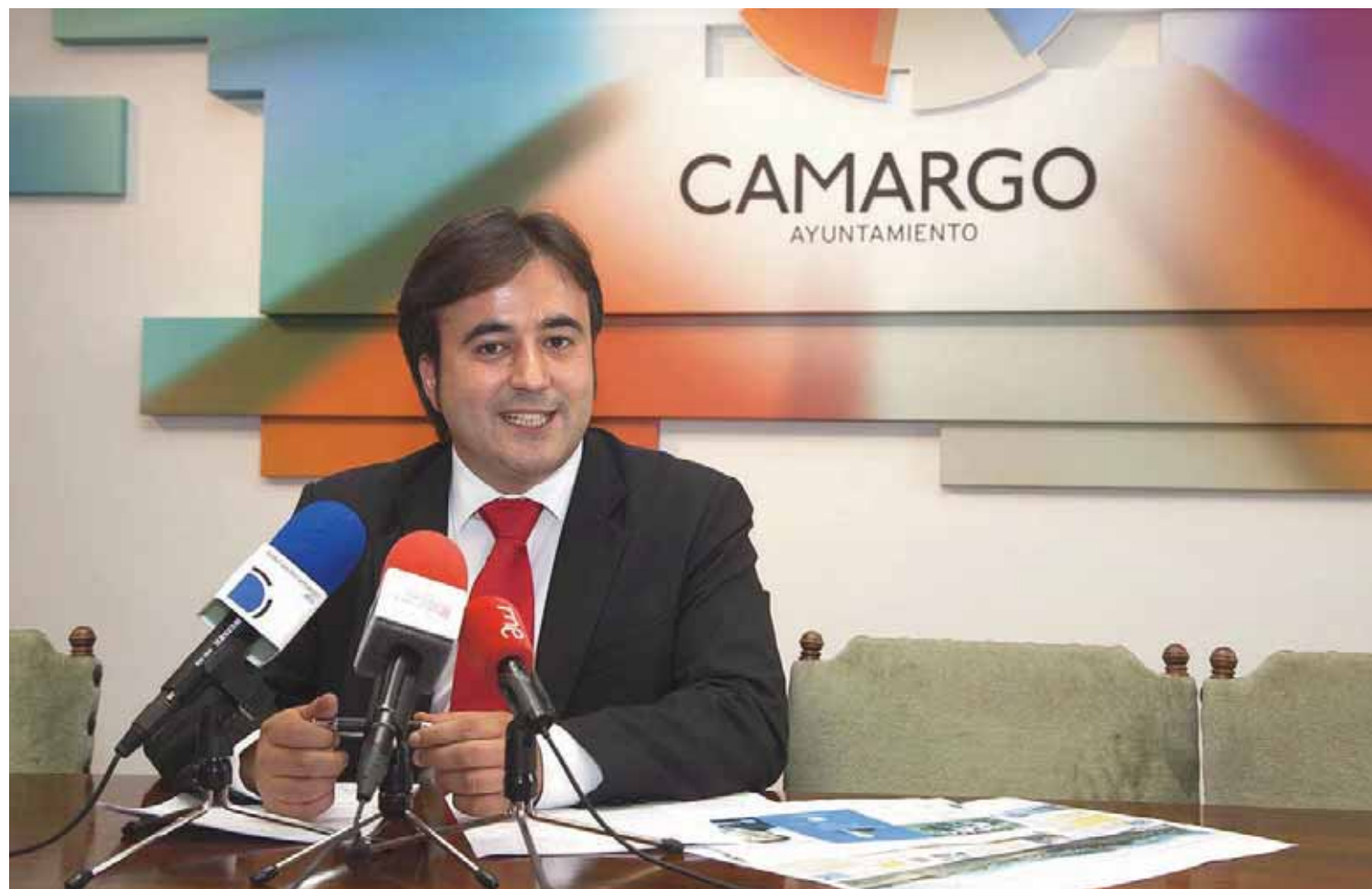
Diego Movellán, ex alcalde de Camargo y número tres de la lista del Partido Popular al Congreso de los Diputados por Cantabria.