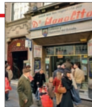
2.240 millones en premios GENTE

anterior y posterior al segundo premio y dos aproximaciones más premiadas con 9.600 euros para los que se acerquen al tercer premio.