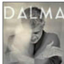
Dalma SERGIO DALMA WARNER MUSIC

Un álbum que recoge las dificultades de la vida personal de su autor.