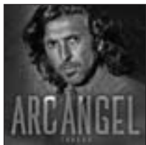
Tablao ARCÁNGEL UNIVERSAL MUSIC

'Black Magic' y 'Love me Like You' son algunos de los temas que incluye el disco.