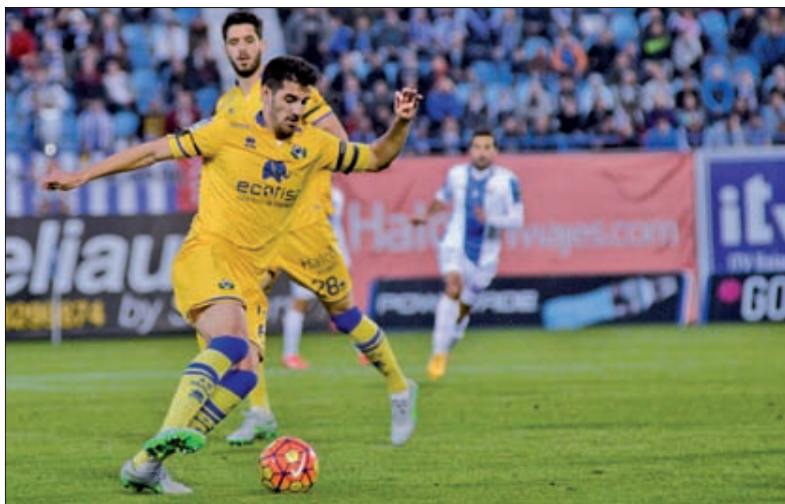
El Alcorcón, en uno de sus partidos

En cuanto al partido que enfrentó al Alcorcón y al Leganés en el derbi local del pasado sábado, los pepineros fueron quienes llevaron la voz cantante, mostrando su mejor cara y goleando a sus rivales por 3-0. El encuentro arrancó, tras dedicar un minuto de silencio a la memoria de las víctimas