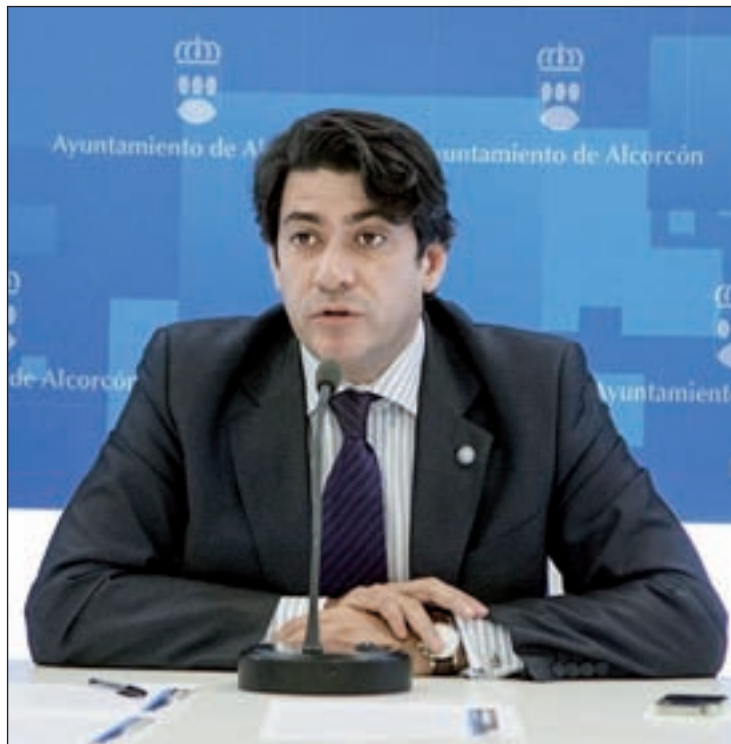
El alcalde de Alcorcón, David Pérez.

No obstante, el primer edil ha insistido en que, aunque es incompatible un puesto de diputado nacional con el autonómico, sí que se puede combinar ese cargo con el de alcalde, el cual sería su prioridad, según ha argumentado. “Si hay un puesto que me parece el más relevante de todos, y el que ahora estoy ejerciendo, es el de alcalde. Es un orgullo y un honor importantísimo, pero sobre todo una grandísima responsabilidad”, ha afirmado, aludiendo a que ha sido “la persona más vo-