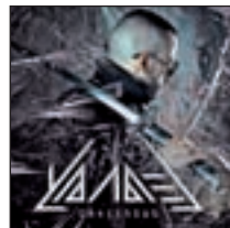
Dangerous YANDEL SONY MUSIC

Es el tercer disco de la británica con temas como 'My Mind' o 'Don't panic'.