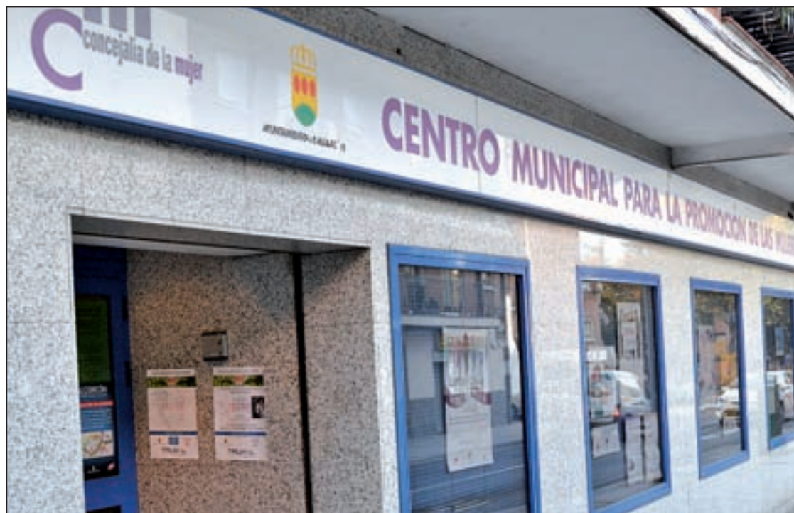
La Concejalía de Mujer acoge distintos programas para combatir la violencia de género C. MARTINEZ

Es en una primera fase donde se trata particularmente cada caso. “Hay un antes, un después y un durante de todo el proceso de violencia. No todas llegan con una denuncia interpuesta contra sus maltratadores, por lo que se les ayuda a que tomen realidad con su situación y que tengan asumida la toma de decisión. Pa-