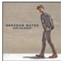
Are you ready? ABRAHAM MATEO SONY MUSIC

El artista se ha volcado en la elección de los temas. Es su trabajo más personal.