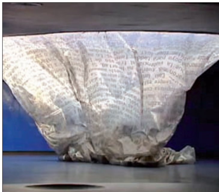
El monumento está deshinchado en Atocha

"El terrorismo yihadista ha regado con la sangre de los madrileños las calles de Madrid y podemos entender el dolor de la socie-