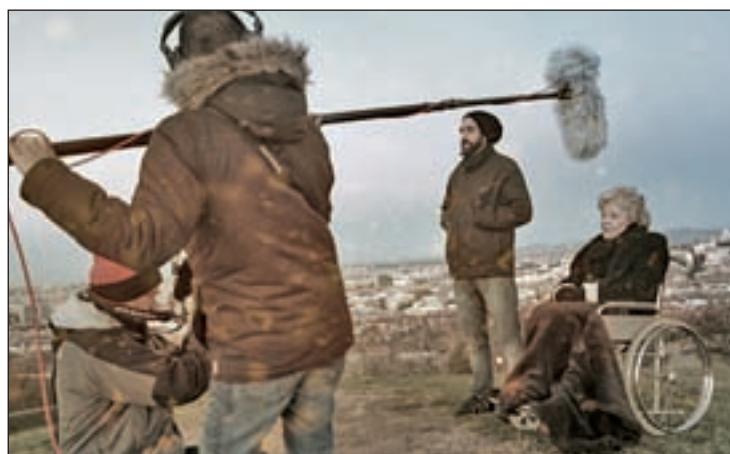
El equipo en plena grabación LOS LÍMITES DEL CIELO

¿Qué es 'Los límites del cielo'? Una película que se ha hecho con mucho amor, a nivel personal su-