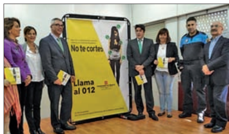
Un momento de la presentación

“Lo que buscamos es que sean conscientes de que no sólo está la agresión, sino que hay otras formas de comportamientos donde malas frases pueden incidir y ser