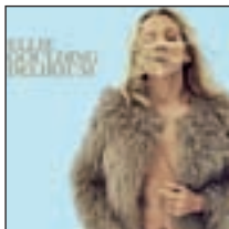
Delirium ELLIE GOULDING POLYDOR RECORDS

Un nuevo disco en directo del artista sobre su memorable gira 'Tour Terra'.