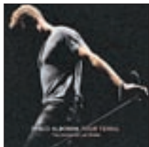
Tres noches en Las Ventas PABLO ALBORÁN WARNER MUSIC