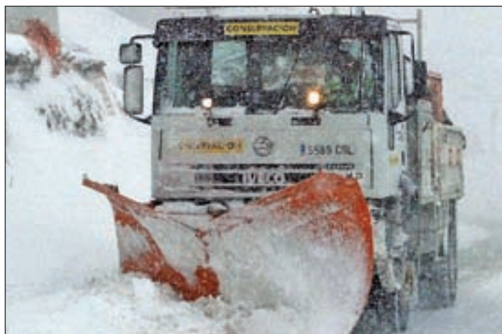
Trabajarán 167 máquinas quitanieves

Así lo anunció la delegada del Gobierno en Madrid, Concepción Dancausa, tras la constitución de la Mesa de Acuerdo de coordinación de actuaciones en las carreteras del Estado de la región. El Plan tiene como objetivo "garantizar la máxima fluidez posible de tráfico en los accesos por carretera a la capital y a los principales nudos de conexión con otros tipos de transporte, como aeropuertos y estaciones de ferrocarril" de los cerca de 900 kilómetros de red viaria del Estado a lo largo de la Comunidad. Por ello, habrá además