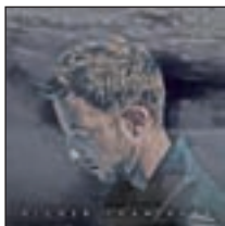
Higher than here JAMES MORRISON UNIVERSAL REPUBLIC

Un disco grabado en directo en los mejores y más aplaudidos tablao españoles.