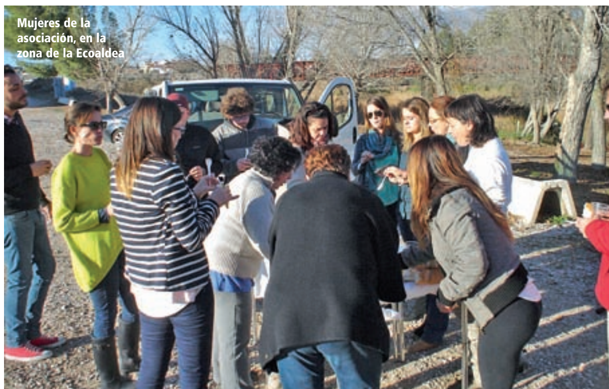
Mujeres de la asociación, en la zona de la Ecoaldea

Hasta 25 personas, u ocho familias monoparentales, podrá re-