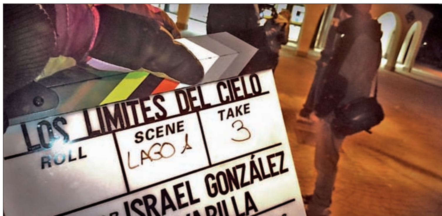
Un momento del rodaje LOS LÍMITES DEL CIELO