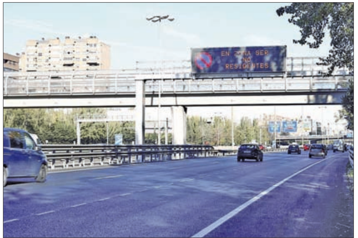
Panel informativo sobre el Protocolo contra la contaminación

Lo cierto es que, a pesar de que muchos han criticado la actuación del Ayuntamiento de Madrid, la medida ha llevado la calidad del aire al primer plano político y social. Nunca antes los madrileños estuvieron tan pendientes de los niveles de dióxido de nitrógeno como en los últimos días. Sin embargo, parecen que, por el momento, pueden estar tranquilos ya que, a pesar de que las previsiones eran pesimistas, finalmente, el equipo de Manuela Carmena no ha tenido necesidad de volver a limitar la velocidad en la M-30 ni el aparcamiento en la zona SER. Y parece que la buena racha continuará, ya que la Agencia Estatal de Meteorología prevé la llegada este fin de semana de una masa de aire que producirá una mejora notable en la calidad del aire.