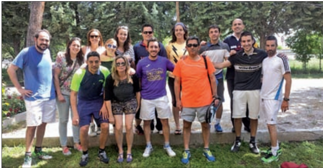
Finalistas de la I Liga Local de pádel del barrio