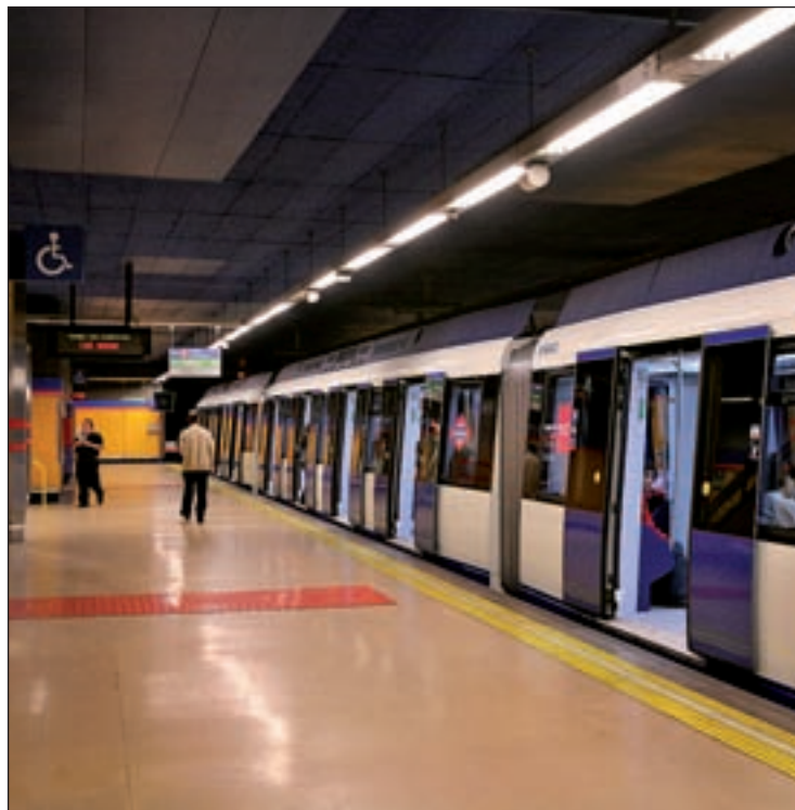
Las obras se hacen en verano ante el descenso de viajeros

Con la puesta en servicio de este tramo de la línea 6, concluyen todas las actuaciones de mejora en la red que se han llevado a cabo en la Comunidad de Madrid a lo