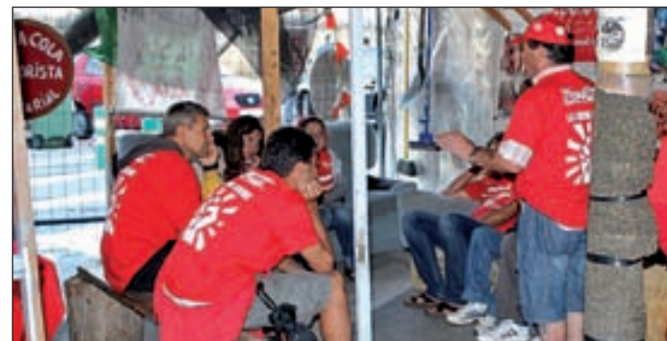
Los trabajadores han vuelto tras una lucha de 20 meses

El alcalde de Fuenlabrada, Manuel Robles (PSOE), acudió a las puertas de la factoría para escenificar su apoyo a los empleados. Mientras, en el campamento de la 'esperanza' habilitado a varios metros, en otra de las puertas de acceso a la empresa, el resto de compañeros se mostraban satisfechos con las incorporaciones.