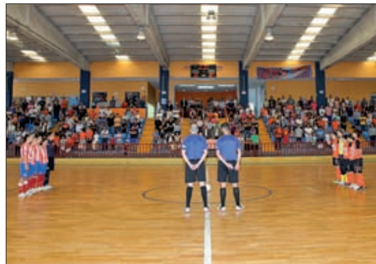
Imagen del partido de ida

línea de salida estará situada en San Lorenzo del Escorial, desde donde los ciclistas deberán afrontar una etapa de 175 kilómetros que incluye las ascensiones a dos puertos de primera categoría como Navacerrada, Morcuera (éste en dos ocasiones) y Cotos. Esas rampas serán las que podrán marcar las diferencias definitivas entre el holandés Tom Dumoulin y el italiano Fabio Aru, los dos ciclistas que salieron más reforzados de la contrarreloj individual disputada el pasado miércoles en tierras burgalesas. Joaquim Rodríguez, el español mejor situado.