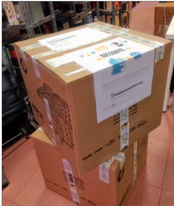
Uno de los envíos recibidos en la fundación