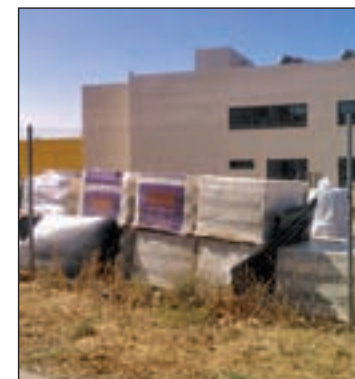
El colegio ya está abierto

Asimismo, la concejala socialista emplaza al Gobierno de Ahora Madrid a que ponga en marcha el acuerdo social y político logrado en el mandato anterior para cambiar el nombre de este centro, por lo que le pide a la presidenta de Barajas que realice las gestiones oportunas con la Comunidad de Madrid y el consejo escolar del centro, para cambiarle el nombre cuanto antes.