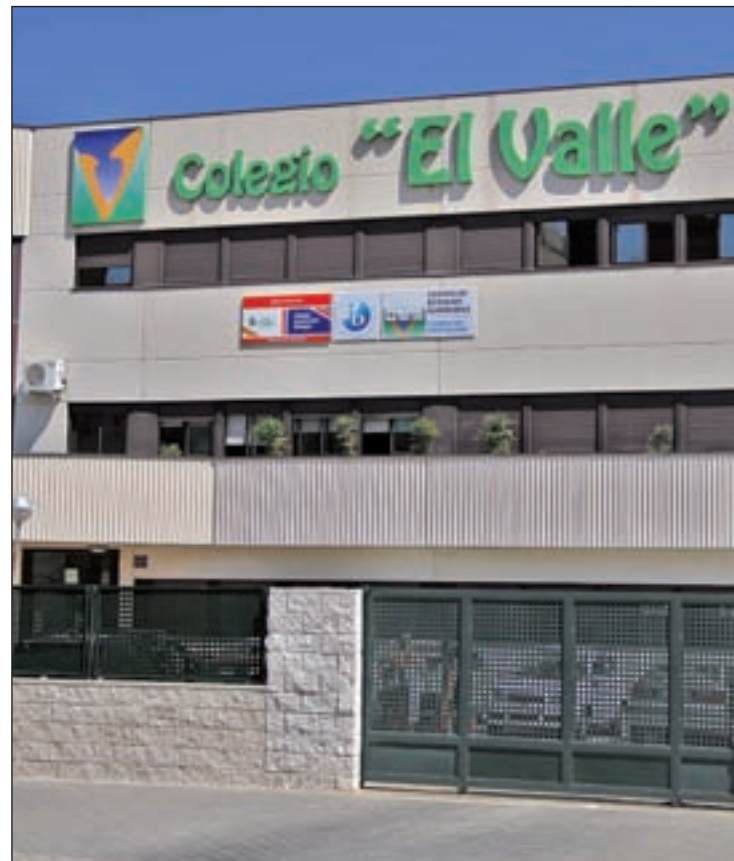
'El Valle', un referente en materia educativa GENTE

Estas novedades se suman a otras titulaciones que ya se comenzaron a impartir el año pasado. Se trata de curso de Técnico Deportivo tanto en grado medio (niveles I y II) como en el superior (nivel III) dentro de las especialidades de Fútbol 11 y Fútbol Sala en Grado Medio y Superior. Completan la oferta Técnico de Grado Superior en Actividad Física y Animación Deportiva (TAFAD), Técnico de Grado Superior en Educación Infantil y Técnico de Grado Superior en Desarrollo de Aplicaciones Multiplataforma. Esta amplia