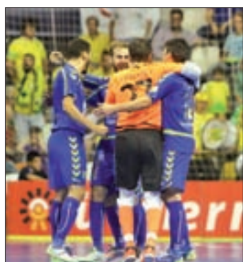
Nuevo título para el Movistar

La representación madrileña la completarán el F.S.F. Móstoles, el Ciudad de Alcorcón y el Majadahonda F.S.F./Afar 4. En el caso del conjunto alfarero, el objetivo será dar continuidad a la línea ascendente que le ha llevado en pocas temporadas de ser un recién ascendido a uno de los equipos más potentes del campeonato. En el caso de las mostoleñas y las majariegas, el reto es mucho más modesto, ya que el hecho de lograr la permanencia se consideraría un éxito.