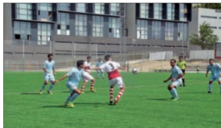
El Sanse, próximo rival de los rojinegros

En lo que respecta al Unión Adarve, los jugadores de Víctor Cea saldaron con triunfo su primera cita en la Vereda de Ganapanes. Los tantos de Cadete y Agus permitieron a los rojinegros colocarse con un cómodo 2-0 en el luminoso, aunque los últimos minutos estuvieron marcados por la incertidumbre derivada del gol visitante, obra de Cristian. A pesar de ese nerviosismo, los tres