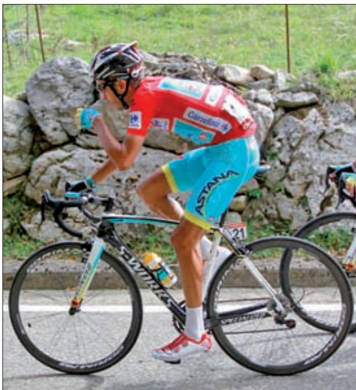
Fabio Aru, uno de los grandes protagonistas

Pero antes de bajar el telón de forma definitiva, los supervivientes deberán afrontar una última etapa en la que está prevista la salida en torno a las 17:35 horas desde Alcalá de Henares. La localidad Complutense dejará paso a otras del Corredor, como Torrejón de Ardoz, San Fernando o Coslada. Una vez recorridos estos municipios, el pelotón tomará la Avenida del Mediterráneo para después incorporarse a los paseos de Reina Cristina e Infanta Isabel. La estación de Atocha y el paseo del Prado serán la antesala del primer paso por la línea de meta. Después se darán diez vueltas a un circuito con puntos destacados como Colón, Cibeles, Callao y la Glorieta del Emperador. En función de la velocidad que empleen para cubrir los 98,8 kilómetros de esta etapa, la llegada a meta se producirá entre las 20:21 y las 20:40 horas. Por tanto, se recomienda no usar el coche particular para acceder a las calles más céntricas de la capital, dado que habrá importantes restricciones