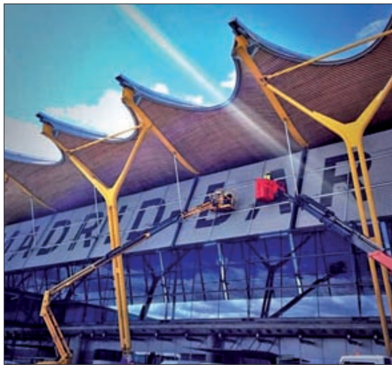
A la izquierda, el Apeadero de la Tenería en Pinto, a medio construir; a la derecha, el Aeropuerto Adolfo Suárez Madrid-Barajas