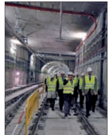
La nueva estación, más cerca

Antes de despedirse, el año 2015 será testigo de la puesta en marcha de una nueva estación de Cercanías. Los trabajos en la zona de Mirasierra avanzan a buen ritmo, lo que llevó a la ministra de Fomento, Ana Pastor, a anunciar que esta estación entrará en funcionamiento el próximo mes de noviembre, lo que supondrá un importante impulso para la zona Norte de la capital en lo que a transportes se refiere.