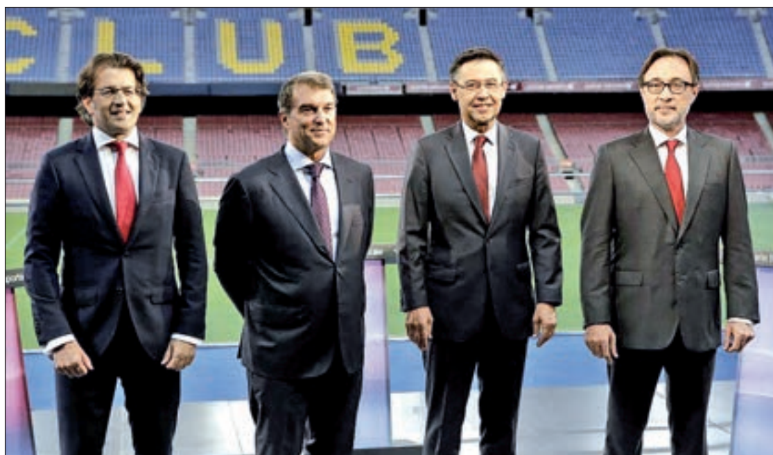
Los cuatro candidatos, en los momentos previos al debate

A pesar de ello, el resto de candidatos confían en que estos son-