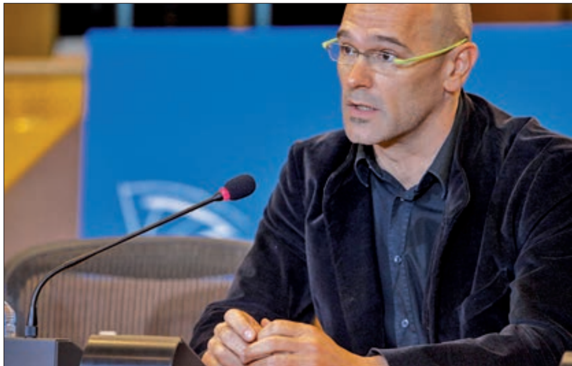
Romeva ha apuntat a la importància que el procés serà "clar, curt i ràpid". ACN

Romeva ha insistit que hi ha un objectiu que els uneix, i que el 27-S es tracta que el país es doti "de les eines perquè la gent escolli les majories que vol en el futur".