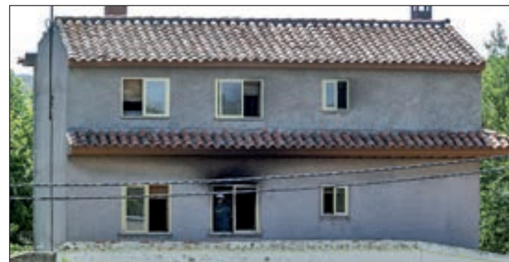
Residencia de Santa Fe

La consejera de Ciudadanía y Derechos Sociales constató que el centro de mayores, "desde el punto de vista de la tramitación y de todos los informes que tenían que ser favorables, no ha cumplido".