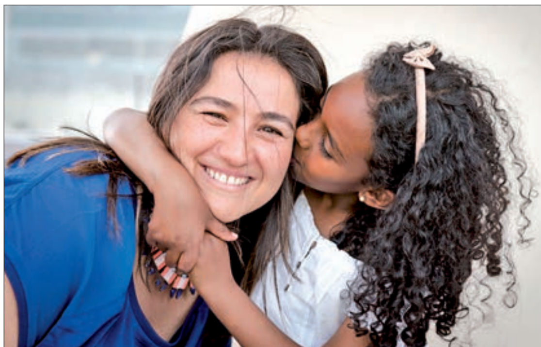
La muestra puede contemplarse en el vestíbulo principal del hospital Materno-Infantil