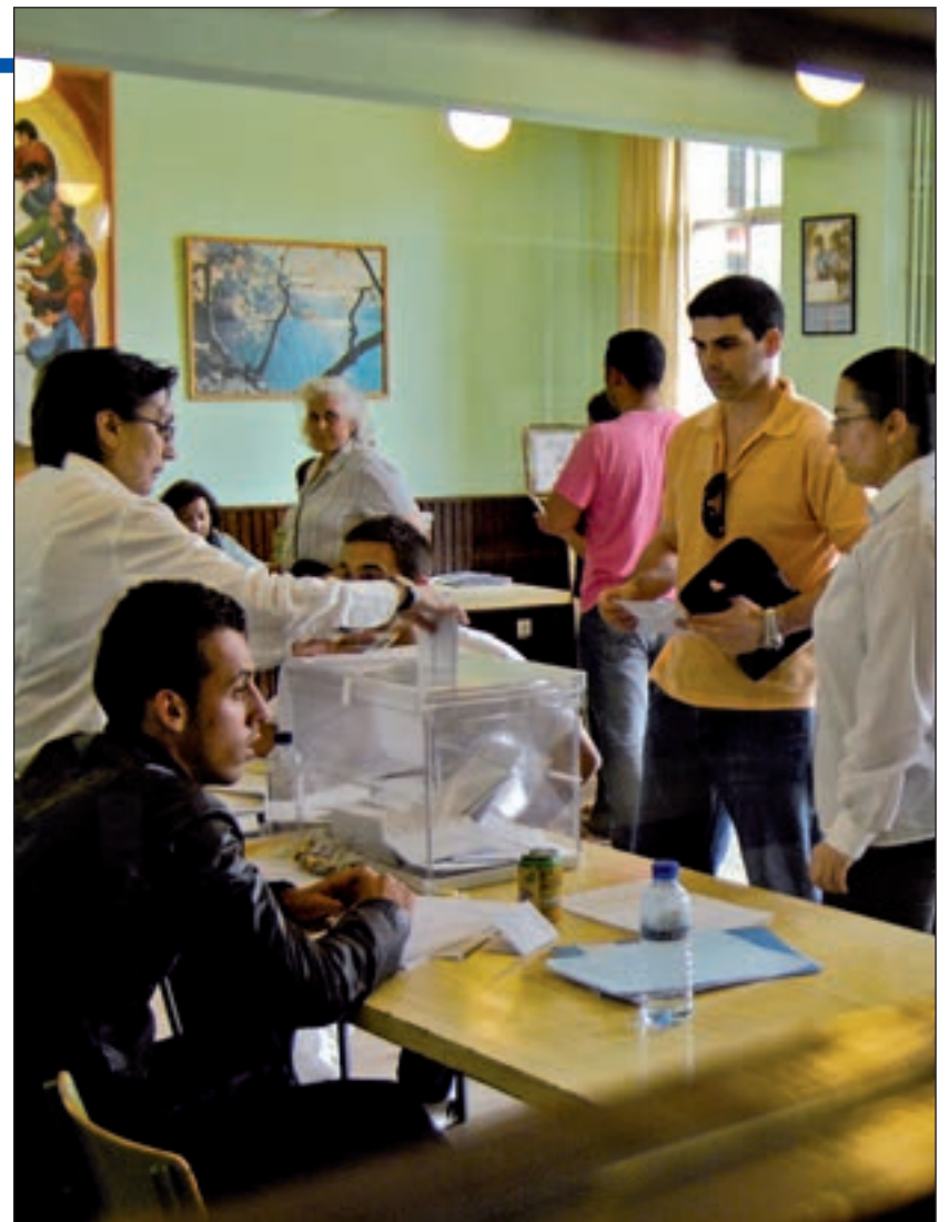
La propuesta se presenta a pocos meses de las elecciones generales

Otro aspecto en contra es el tiempo. Con las generales a la