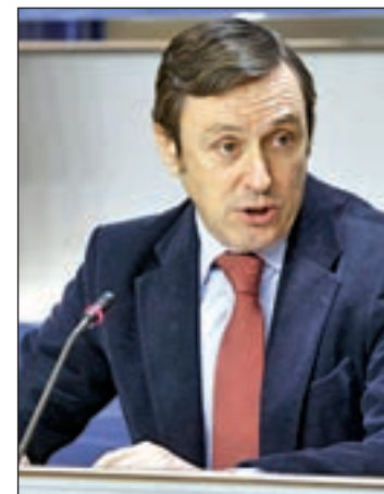
El popular Rafael Hernando

Tras las comparecencias de los altos cargos del Gobierno, el pleno extraordinario de finales de agosto y las enmiendas parciales, en ponencia y en comisión, la iniciativa se remitirá al Senado a finales de septiembre, donde tendría que repetirse toda la tramitación y