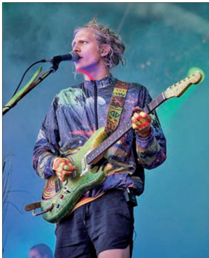
Els noruecs Disaster in the Universe.