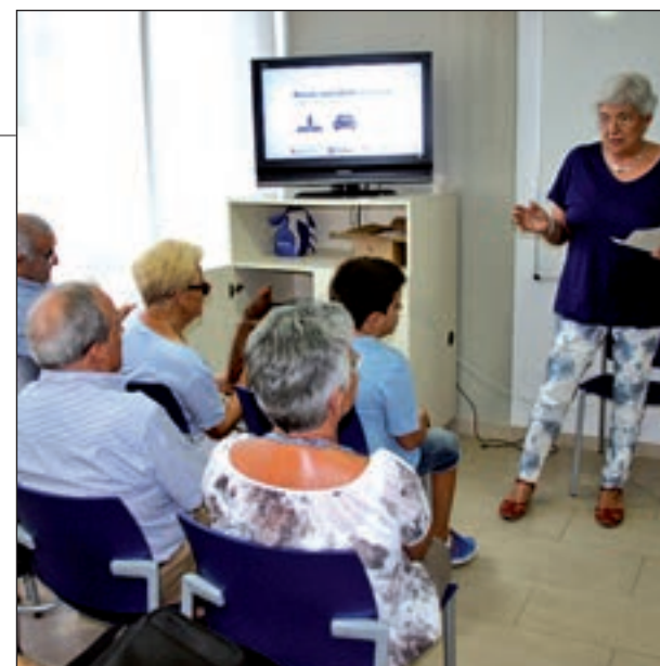
Un moment de la primera xerrada-taller.