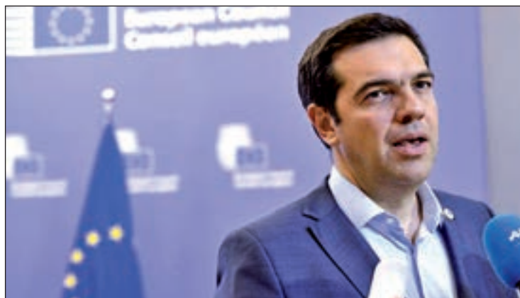
Alexis Tsipras, primer ministro griego

Lo cierto es que las medidas finalmente aceptadas por el Gobierno de Atenas van más lejos que las rechazadas por sus ciudadanos en referéndum, por lo que se abre ante Tsipras un escenario