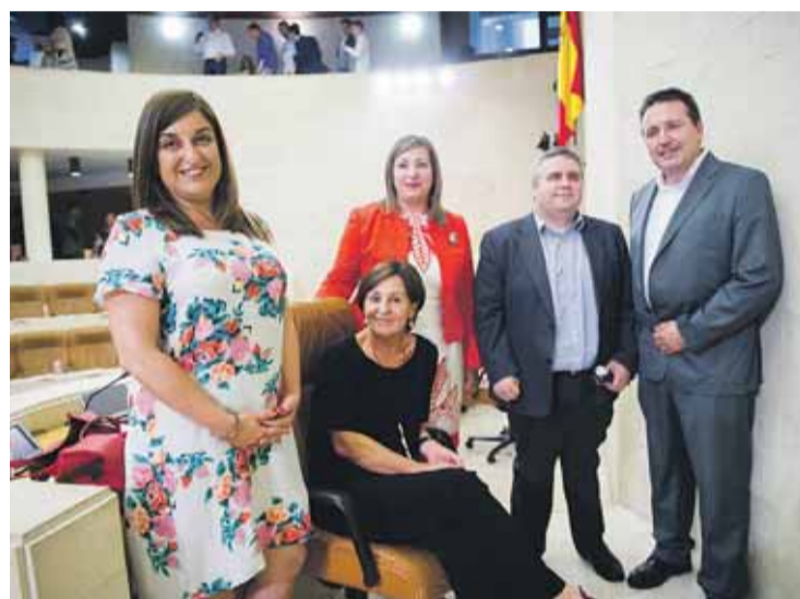
En la Mesa del Parlamento están representados los cinco partidos