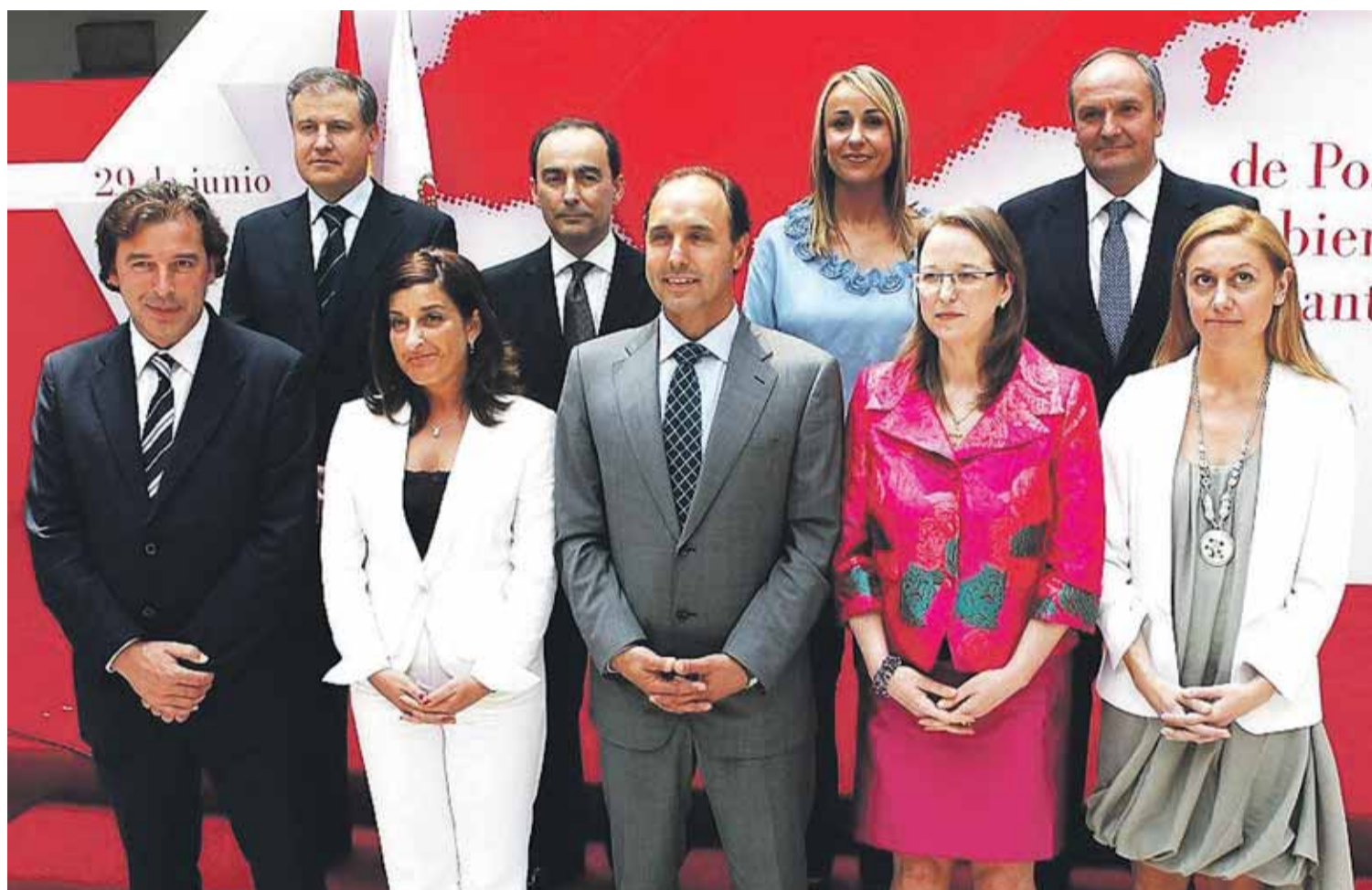
Foto de familia del Gobierno de Cantabria presidido por Diego. A su izquierda, Leticia Díaz y detrás, a la derecha, Miguel Ángel Serna.

El consejero Serna, la consejera Leticia Díaz y el director general de Justicia habían gestionado, con el apoyo del presidente regional en funciones, cobrar más de 100.000 euros de 'finiquito' al cesar en su actividad