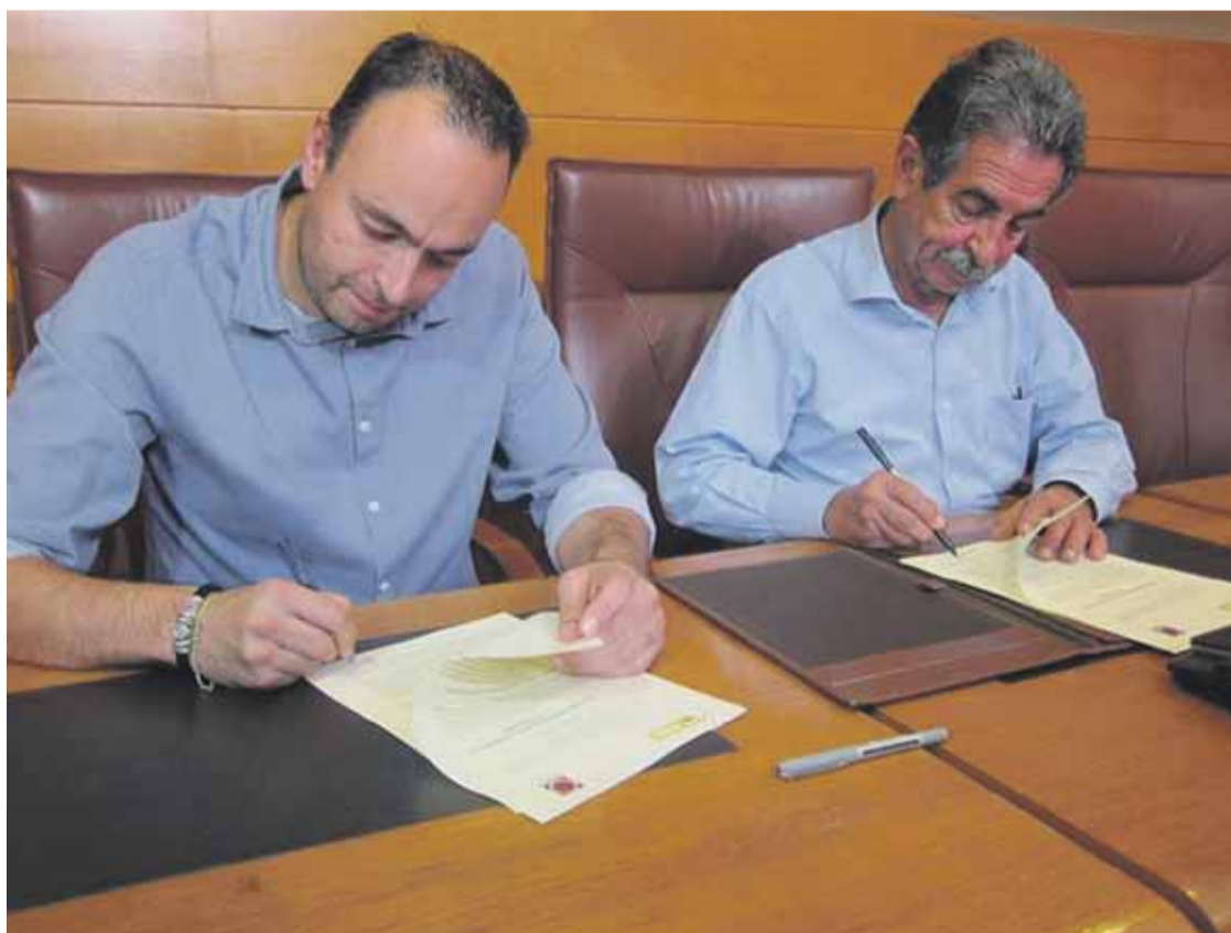
La misma tarde de ayer jueves Podemos firmó el acuerdo que posibilitará la vuelta de Revilla a la Presidencia de Cantabria