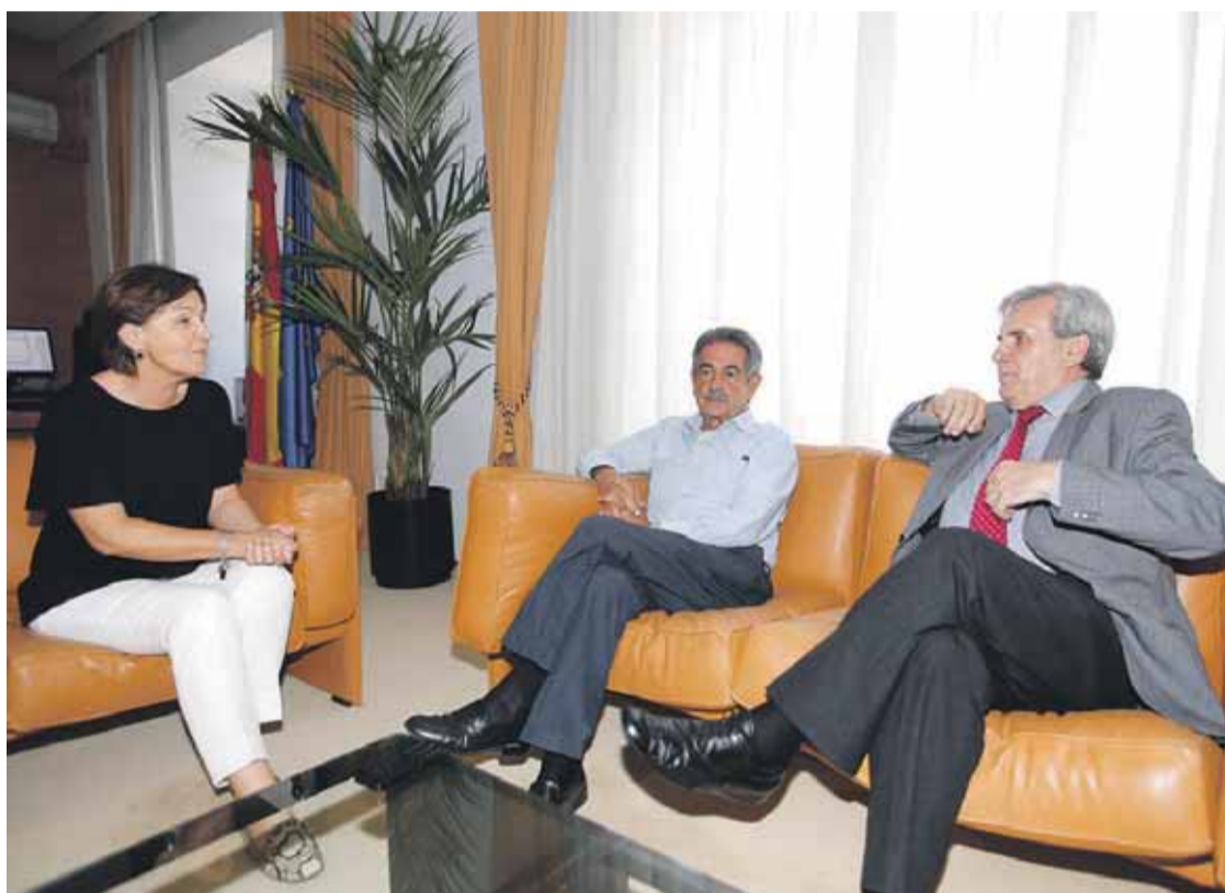
Tras la ronda de consultas con las diferentes fuerzas políticas, Gorostiaga propondrá hoy como presidente a Revilla

La presidenta del Parlamento autonómico, Lola Gorostiaga, propondrá hoy viernes, 26 de junio, a Miguel Ángel Revilla como candidato a la investidura para presidente de Cantabria después de la ronda de consultas celebrada ayer jueves. Revilla cuenta con el apoyo del PRC y PSOE. Ciudadanos y PP no esperarán a conocer el programa del candidato y, si no hay cambios de última hora, votarán en contra. El debate se celebrará, previsiblemente, el 30 de junio y 1 de julio. Podemos, que tiene tres diputados en la Cámara regional, ha anunciado que se abstendrá para facilitar que Revilla sea presidente tras firmar un acuerdo programático