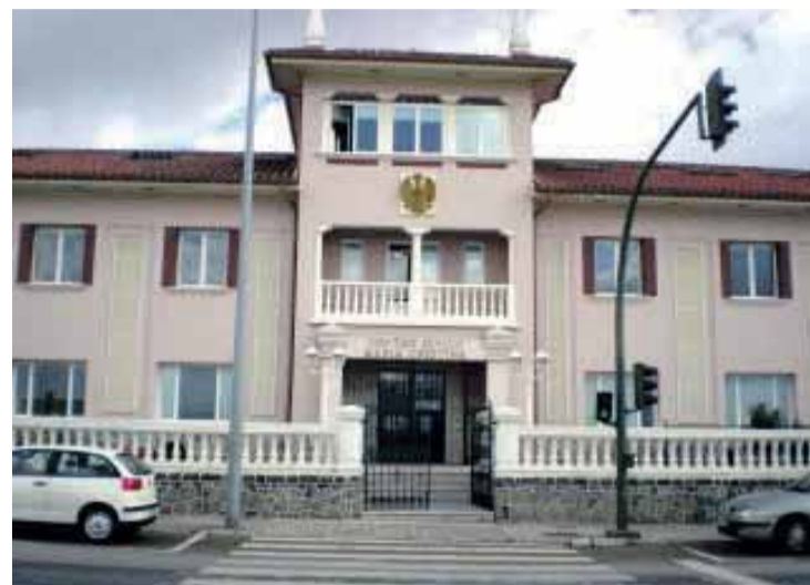
Centro Cívico María Cristina, sede del Servicio de Mediación municipal

Pues bien, el propio equipo de Gobierno municipal sabe que el servicio está en suspenso desde finales del pasado mes de abril.