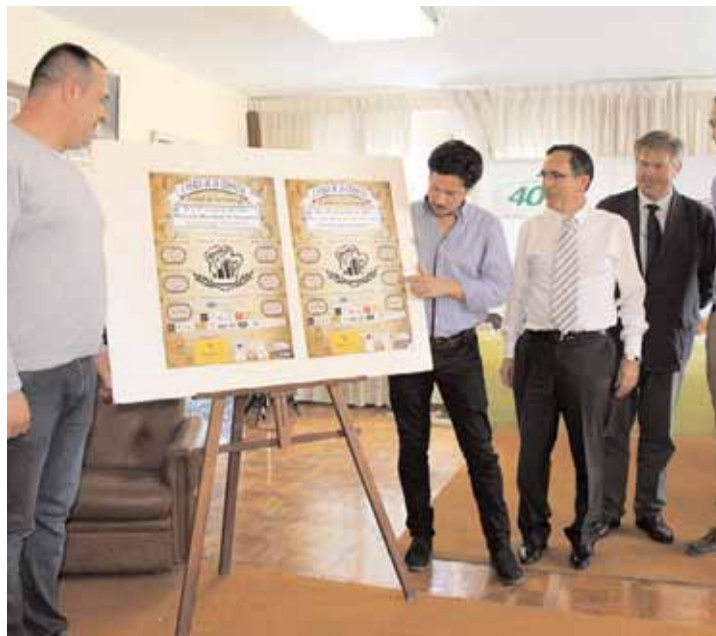
El alcalde en el acto de presentación de la Feria.

El evento, según explicaron los organizadores, aglutinará en torno a