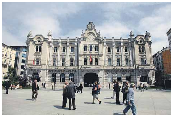
Nunca ha ondeado la bandera arco iris en el Ayuntamiento