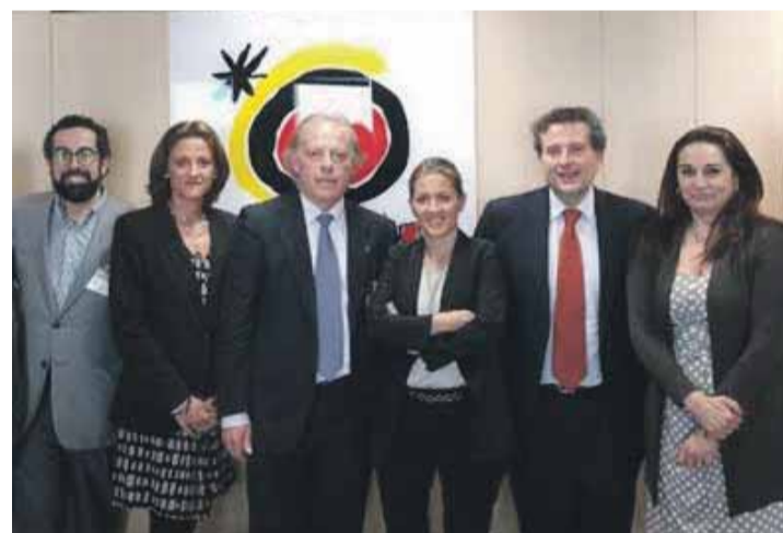
Miembros de la Asociación de Comerciantes del Casco Viejo

sido una nota de prensa en la que anuncia que, como todos los años, desde 2013, el Ayuntamiento participará en los actos organizados por ALEGA (Asociación de Gays, Lesbianas, Transexuales y Bisexuales de Cantabria), lo que consistirá en su presencia en el izado de la bandera arco iris, en el barrio y no en el Ayuntamiento, y la lectura del manifiesto estatal del Orgullo 2015, que tendrán lugar en Tetuán el sábado 27 de junio, a partir de las 21:30 horas.