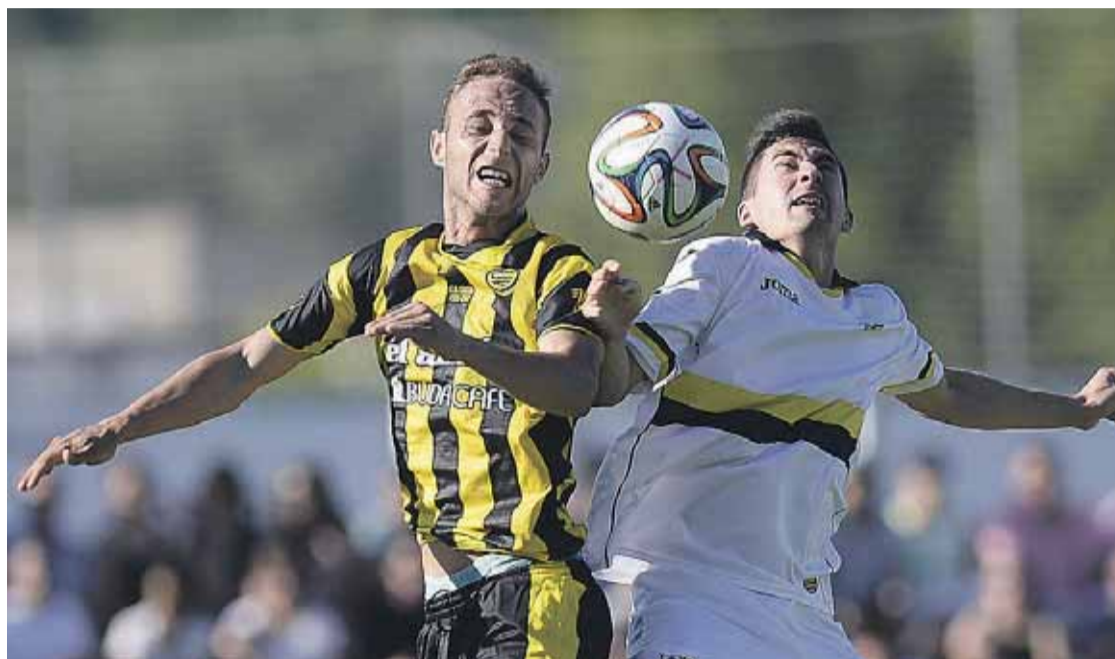
Momento del partido de ida que finalizó con empate a cero

La jornada dominical arrancará desde las 12:00 horas con unos actos en forma de fanfarria y animación popular. El núcleo se prepara con la comida popular para 300 comensales que se celebrará en la Plaza La Rantxe, a partir de las 14:30 horas. La Kalejira se inicia después de la consiguiente sobremesa, desde las 16:30 horas, en forma de subida hacia el campo de La Florida, ubicado en la loma de la Villa. La venta anticipada para la comida y para las entradas el partido más importante de la temporada se despachan en el Bar Txiru,