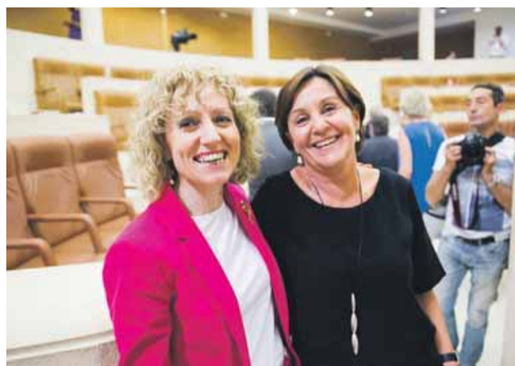
Presidenta y, con toda probabilidad la próxima semana, vicepresidenta regional