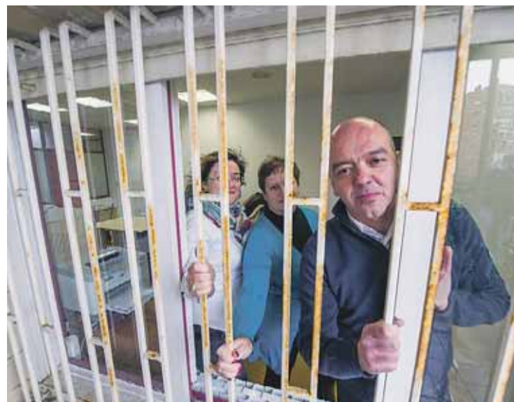
Los dos médicos y la secretaria en las instalaciones de la Unidad de Farmacología