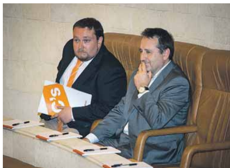
Salvo sorpresa mayúscula, C's votará en contra, alineándose junto al PP