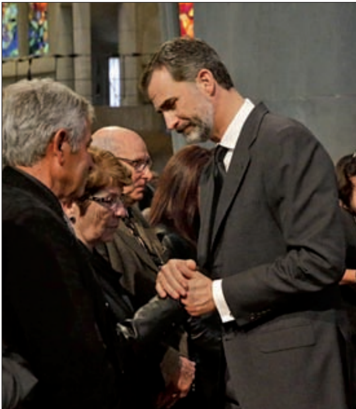
EN LOS MOMENTOS DIFÍCILES: El monarca acompañó a los familiares de las víctimas mortales del accidente de avión de German Wings durante el funeral de Estado que se celebró en Barcelona.