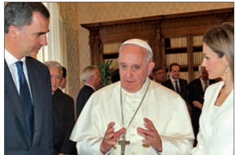
CON EL PAPA: Los Reyes tuvieron una audiencia con el Pontífice en junio de 2014 en el que Don Felipe explicó el relevo de la Corona, "muy intenso", pero "tranquilo". Doña Letizia vistió de blanco, haciendo uso del privilegio que tienen las reinas católicas.