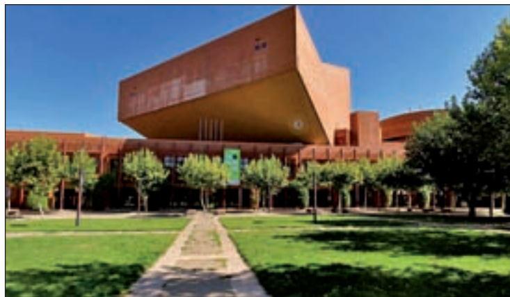
Campus de Leganés UC3M

Las enseñanzas impartidas en el marco de esta ‘universidad de