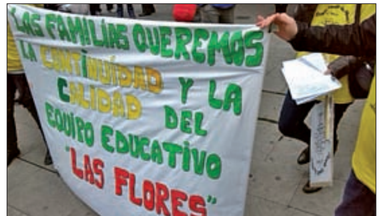
Manifestación que hicieron las familias de la escuela

"Los vecinos que vengan a pasar el día a la piscina pueden tomar el sol en el césped y utilizar los merenderos que hay al aire libre, pero a la hora de bañarse deberán hacerlo en la cubierta", han confirmado a GENTE trabajadores de la instalación municipal.