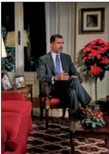
MENSAJE DE NAVIDAD: Felipe VI se dirigió al país en el tradicional discurso, cuyos ejes fueron Cataluña y la corrupción.