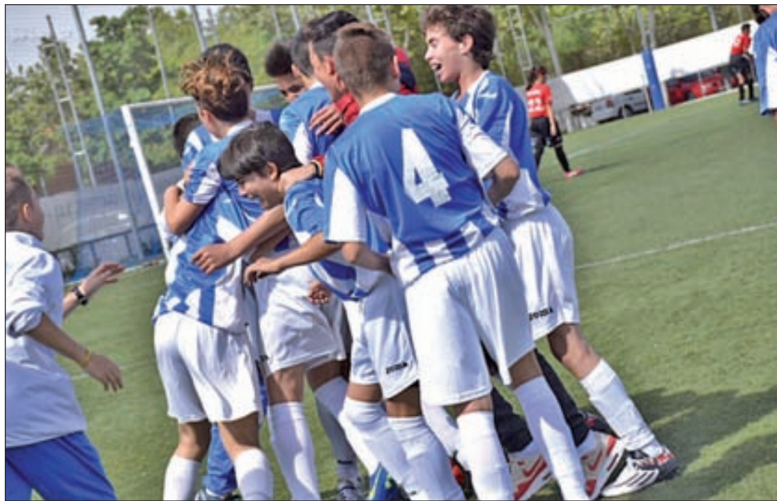
Niños de la Escuela del Lega CD LEGANÉS

Por otro lado, Dani Carvajal estrena Campus de Verano en Leganés y se suma a una larga lista de internacionales que en esta época intentan que los niños y niñas disfruten y aprendan de los profesio-