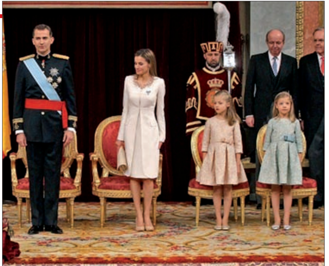
UN AÑO DE REINADO: Don Felipe se convirtió en monarca el 19 de junio de 2014 ante las Cortes y acompañado de su mujer y sus hijas tras la abdicación de su padre. A partir de ese momento, la Infanta Leonor pasó a ser Princesa de Asturias y la Familia Real, a estar compuesta por los reyes, las infantas y Don Juan Carlos y Doña Sofía.