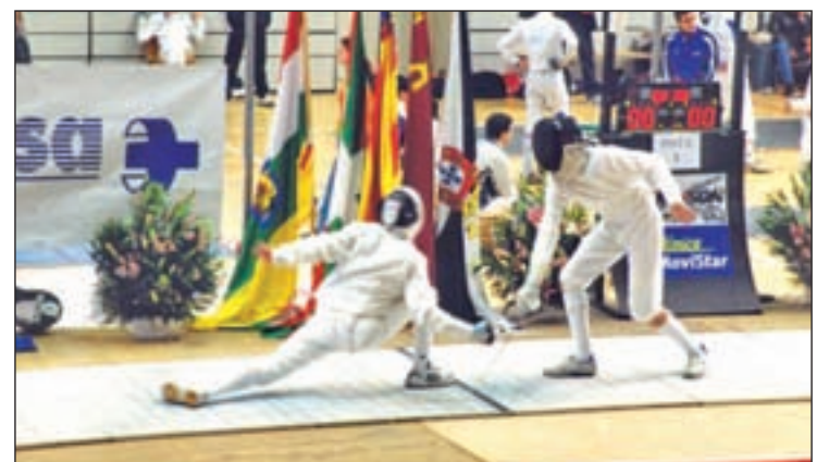
Competición de Esgrima

cer una competición ordenada, segura y atractiva, que sirva de ejemplo organizativo y permita que cada vez más personas estén interesadas en practicar nuestro deporte". Por ello, todos los participantes deberán usar el traje de esgrima completo y todas las competiciones se realizarán con material eléctrico desde la ronda de poules. Mientras, el Club El Salvador de Leganés se alzó con una meritoria medalla de bronce en el Campeonato de España infantil M15 a las 6 armas individual y por equipos, celebrado el pasa-