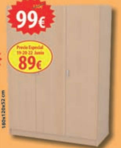
Armario 2 puertas correderas