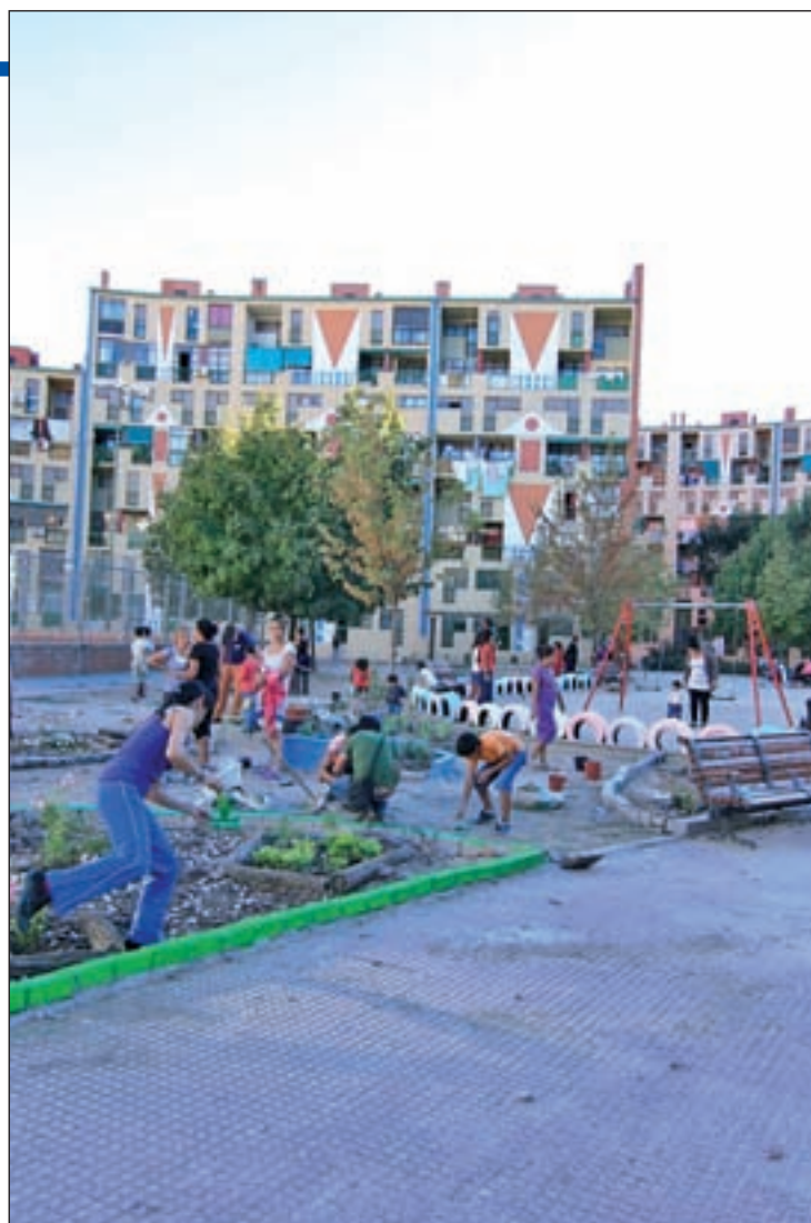
Proyecto OASIS, en otro barrio de Madrid en 2010

“A través de la metáfora del OASIS se pretende rescatar la idea de lugares satisfactorios, llenos de ilusión y alegría. Tiene una base muy similar a la Indagación Apreciativa, un conjunto de principios relacionados con el funcionamiento de los sistemas y organizaciones humanas, en donde se colabora en la búsqueda de lo mejor de las personas, de su organización y del mundo a su alre-