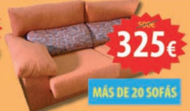
Sofá 3 plazas, extraíble, reclinable, tela nirvana. Varios colores