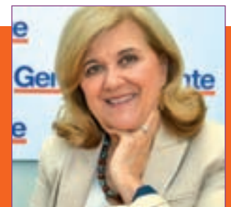
iGente TIEMPO LIBRE Pág. 16

La formación naranja ha negociado 80 medidas con la candidata del PP para permitirle asumir la Presidencia autonómica. Entre ellas, las que se firmaron en el acuerdo de regeneración democrática y las que pasan por los puntos económicos y sociales.