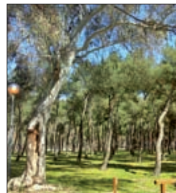
Parque de los Frailes

de agua y un sinfín de actividades que culminarán a las 21 horas con una barbacoa y el posterior baile promovido por una orquesta. El domingo 21 habrá una paella popular a las 14:30 horas, de la que podrán disfrutar los vecinos de Leganés por el precio de 2,50 euros.