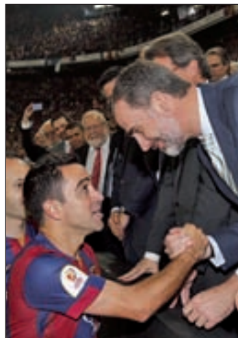
MOMENTOS DIFÍCILES: La sonora pitada de la final de la Copa del Rey fue uno de los momentos públicos más complicados para Felipe VI.