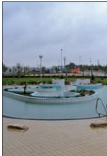
Piscina de verano

Fuentes municipales del anterior Gobierno, responsabilizaron de esta situación a la Intervención municipal, que decidió "paralizar la aprobación del gasto para el arreglo de la piscina, al en-