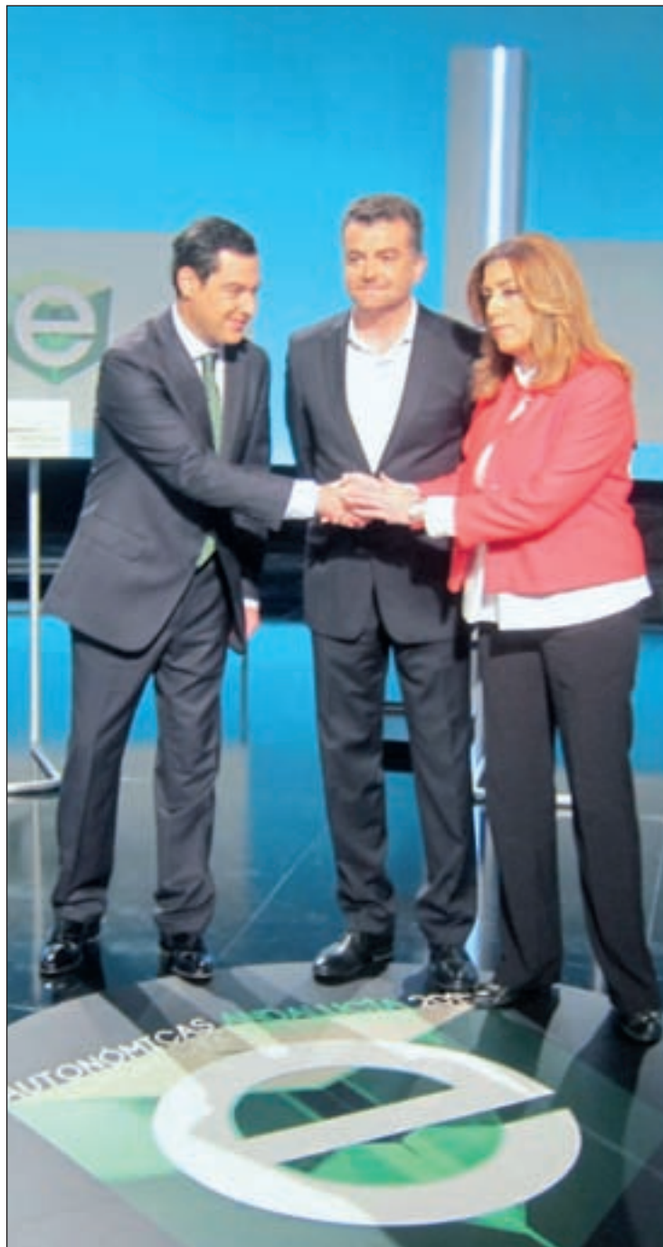
Los candidatos de PP, PSOE e IU, en el debate