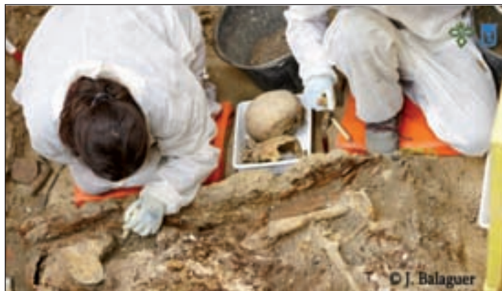
Las excavaciones han durado más dos meses J. BALAGUER

No hay pruebas científicas que lo corroboren debido al mal estado de los fragmentos óseos encontrados y a la falta de referentes familiares con los que contrastar los hallazgos. Sin embargo, el equipo de investigadores del proyecto 'Cervantes: búsqueda, localización y estudio de los restos mortales de Don Miguel de Cervantes' no duda en asegurar que los restos mortales del escritor se encuentran enterrados bajo la cripta del Convento de las Trinitarias de Madrid. Con esta palabras