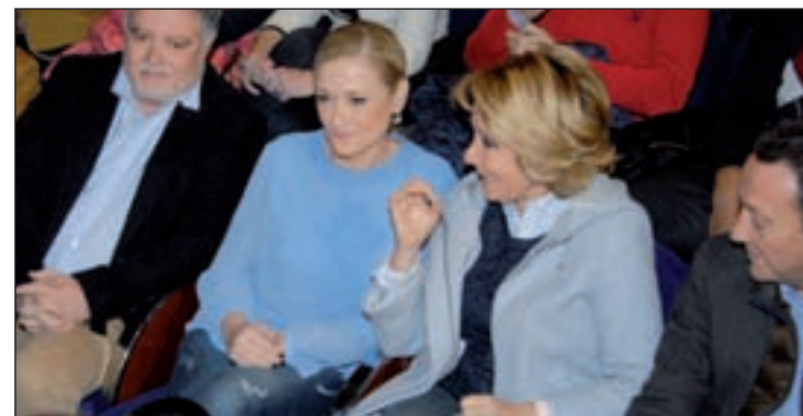
Esperanza Aguirre, en un acto de precampaña

bertad que reclama para elegir nombres. El vicesecretario de Política Autonómica y Local del PP dio una respuesta genérica para dejar claro que los números uno tienen "un peso específico", pero que el Comité Electoral Nacional tiene unas competencias que cumplir.