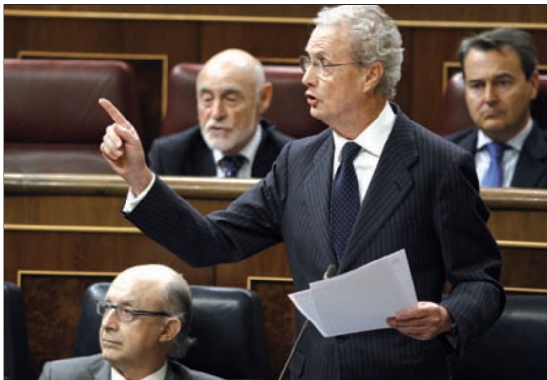
Pedro Morenés, ministro de Defensa, en el Congreso de los Diputados

Tras la polémica suscitada la pasada semana con la aparición de Cantera en el Congreso, el ministro de Defensa, Pedro More-