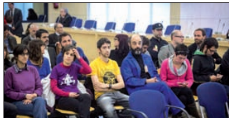
Acusados durante el juicio

Los hechos se remontan al 15 de junio de 2011, cuando una concentración convocada por el 15M ante el Parlament derivó en el asedio a más de una decena de parlamentarios, entre ellos el presidente del Govern, Artur Mas, al que se le impidió el paso cuando viajaba en su vehículo oficial.