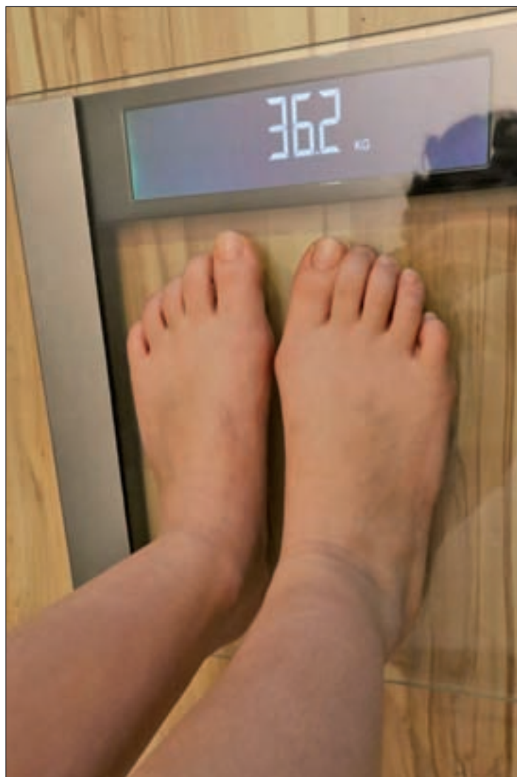
La pérdida de peso es uno de los síntomas

Paralelamente, Amella consiguió lo que parecía, en un primer momento, impensable: su iniciativa se coló en el Senado la pasada semana. Gracias a UPN, se votó la inclusión de esta iniciativa en la reforma del Código Penal con un