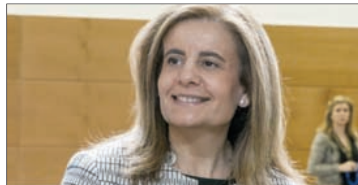
Fátima Báñez, ministra de Empleo y Seguridad Social

"El mercado de trabajo está cambiando para bien. Se crea empleo, baja el paro y aumentan las oportunidades", ha asegurado la ministra de Empleo y Seguridad Social, Fátima Báñez, que ha afirmado que estos datos demuestran que el objetivo del Gobierno de crear tres millones de empleos en los próximos años es "más que alcanzable".