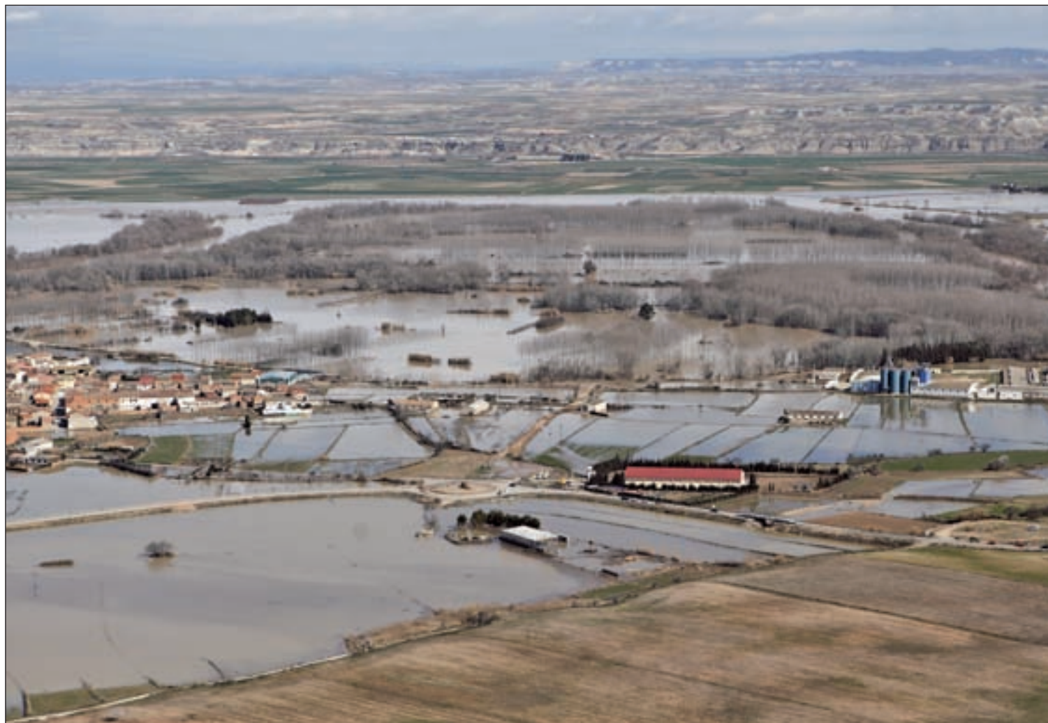
Imagen aérea de una de las zonas sumergidas por la crecida del Ebro

decreto que incluirá medidas, como el dragado del río, y subvenciones por valor de 60 millones de euros, según anunció Isabel García Tejerina, ministra de Agricultura. PÁG. 3