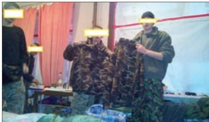
LAS ASOCIACIONES se coordinan con voluntarios sobre el terreno, como el conocido como Fondo de Santamaría, para mandar la ayuda bajo pedido y así responder a las necesidades reales. Todo lo adquieren gracias a donaciones particulares y a acciones como mercadillos solidarios o conciertos.

de militares españoles retirados”, confirma.