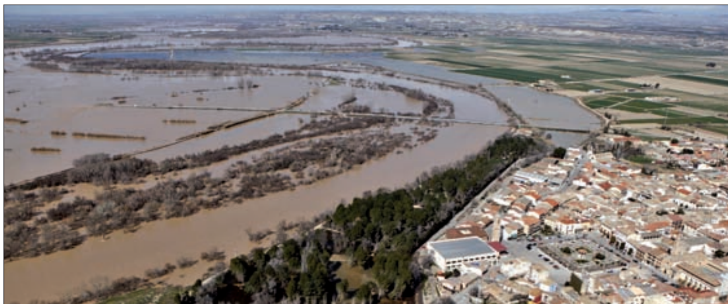
Efectos de la crecida del río Ebro