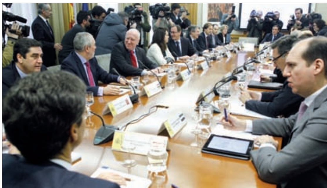
Reunión informal entre los Ministerios de Sanidad y de Hacienda con las comunidades autónomas

Además, el consumo diario sube dos décimas respecto a las anteriores encuestas entre la población de 15 a 64 años, lo que supone que alrededor de 620.000 personas fuman esta sustancia todos los días, siendo especialmente hombres los consumidores. Sin embargo, la prevalencia del consumo ha descendido ligeramente ya que, por ejemplo, el 9,2 por ciento reconoce que lo ha probado alguna vez en el último año, frente al 9,6% del estudio anterior.