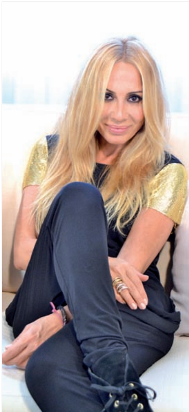
CHEMA MARTINEZ / GENTE

Me enorgullece muchísimo. Primero, porque algo tendré que ver yo para que la gente esté pendiente de mí, y luego, porque la música está en un momento complicado, y es un regalo.