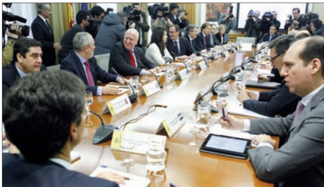
Reunión informal entre los Ministerios de Sanidad y de Hacienda con las comunidades autónomas

Además, el consumo diario sube dos décimas respecto a las anteriores encuestas entre la población de 15 a 64 años, lo que supone que alrededor de 620.000 personas fuman esta sustancia todos los días, siendo especialmente hombres los consumidores. Sin embargo, la prevalencia del consumo ha descendido ligeramente ya que, por ejemplo, el 9,2 por ciento reconoce que lo ha probado alguna vez en el último año, frente al 9,6% del estudio anterior.