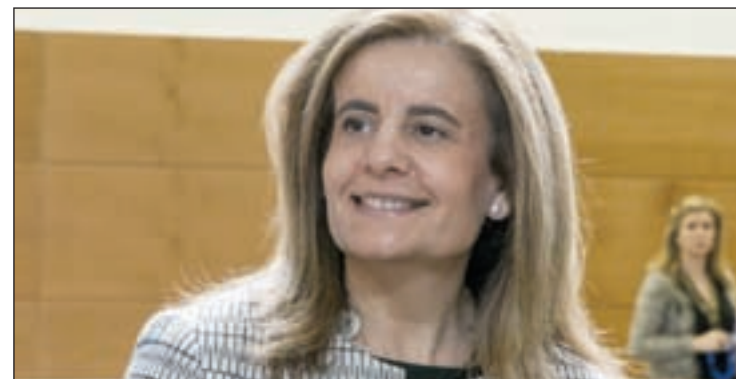
Fátima Báñez, ministra de Empleo y Seguridad Social

"El mercado de trabajo está cambiando para bien. Se crea empleo, baja el paro y aumentan las oportunidades", ha asegurado la ministra de Empleo y Seguridad Social, Fátima Báñez, que ha afirmado que estos datos demuestran que el objetivo del Gobierno de crear tres millones de empleos en los próximos años es "más que alcanzable".