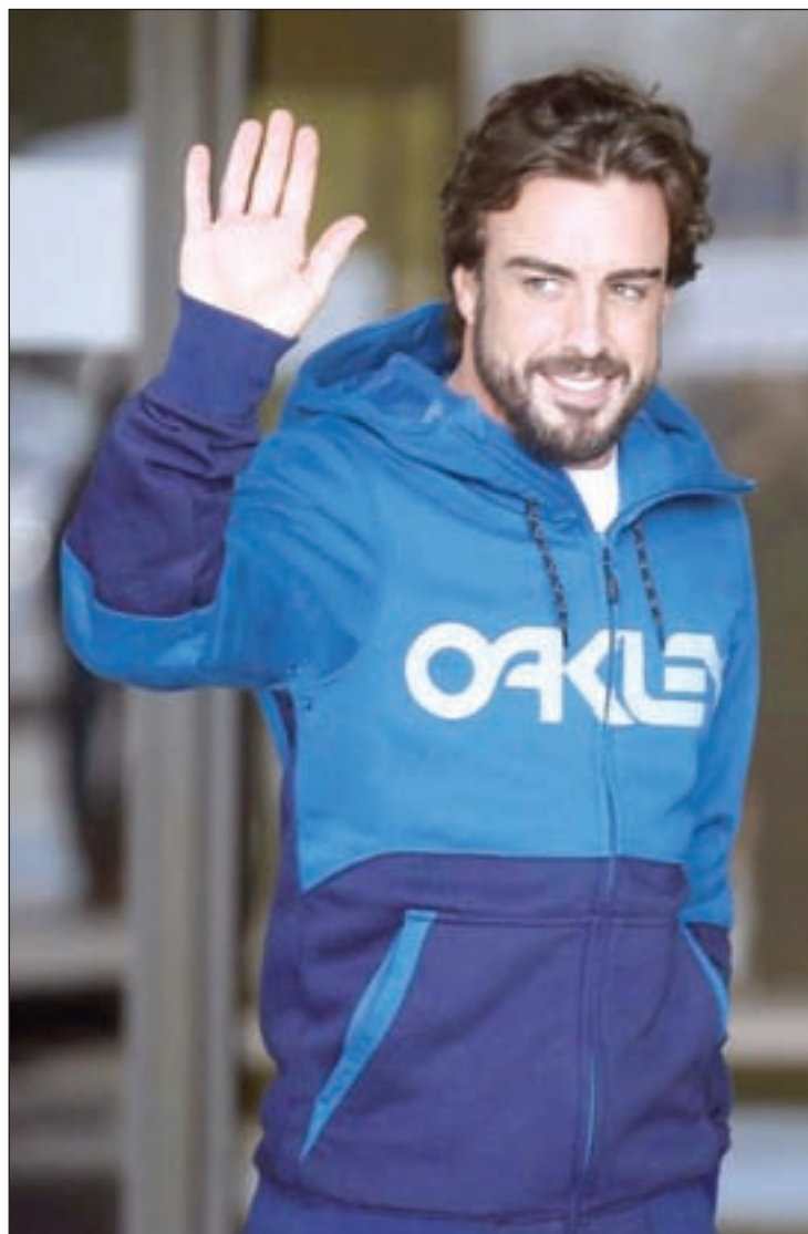
Alonso, a su salida de una clínica barcelonesa

tratiempo confirma la pretemporada tan extraña que ha vivido Fernando Alonso. Después de unos aciagos años en Ferrari, los aficionados españoles esperaban que su fichaje por McLaren-Honda supusiera un cambio de aspiraciones, colocando al asturiano a la misma altura que otros favoritos como el británico Lewis Hamilton. Sin embargo, las primeras dudas llegaron con los entrenamientos celebrados en tierras españolas. Los bólidos de McLaren-Honda fueron de los que menos vueltas pudieron completar, de