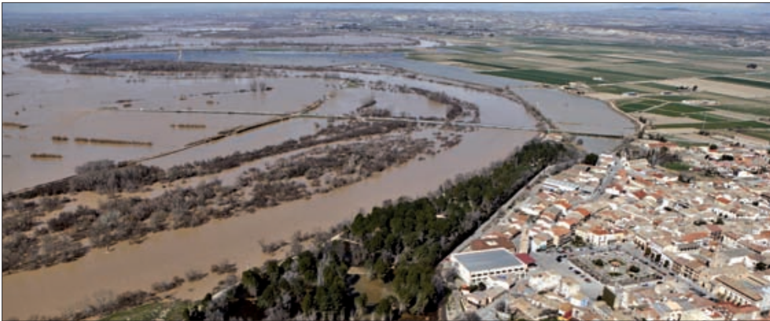
Efectos de la crecida del río Ebro