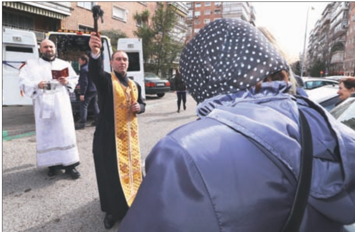
Un reverendo ortodoxo, en el acto de bendición de la ambulancia