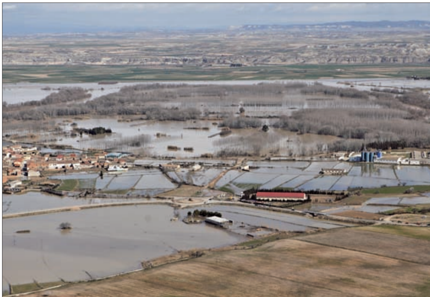
Imagen aérea de una de las zonas sumergidas por la crecida del Ebro

decreto que incluirá medidas, como el dragado del río, y subvenciones por valor de 60 millones de euros, según anunció Isabel García Tejerina, ministra de Agricultura. PÁG. 5