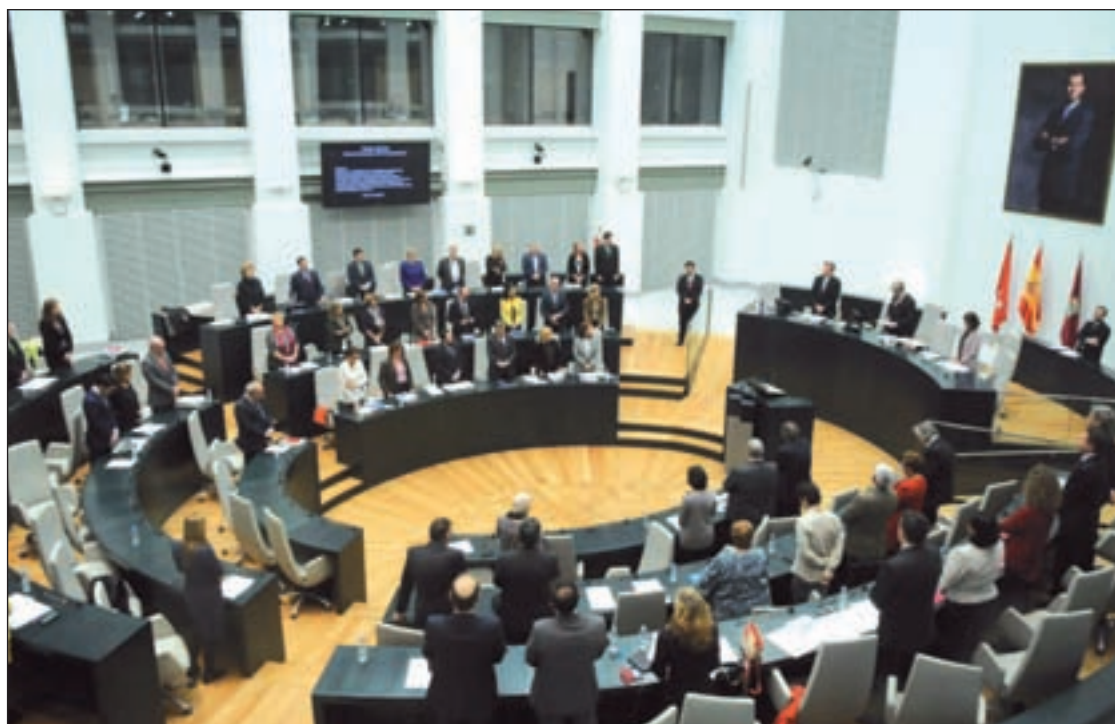
El Pleno del Consistorio puede cambiar su composición

Esa incertidumbre también está presente en la designación del sucesor de la que ha sido hasta ahora la alcaldesa de Madrid. Ana Botella anunciaba el pasado 9 de septiembre que no se presentaría a la reelección, abriendo una carrera de la que todavía no se conoce al ganador. Soraya Sáenz de Santamaría, Esperanza Aguirre o Cristina Cifuentes son algunos de los nombres que han aparecido en las quinielas de futuribles, pero al cierre de esta edición la decisión aún no era pública. Mientras, varios asuntos como la aprobación de la Ordenanza de Convi-