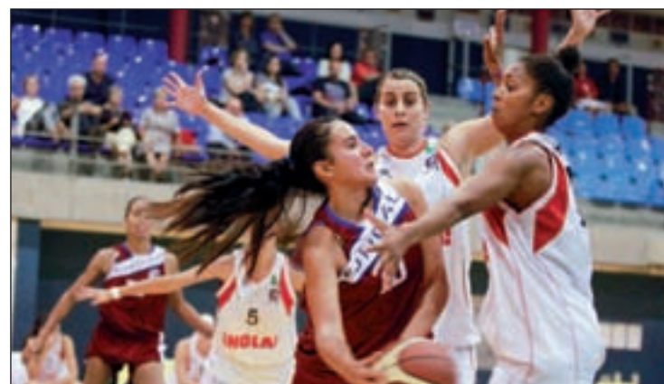
Las jugadoras del CREF ya comandan la clasificación

Por otro lado, los representantes de la capital dentro de la Liga ACB deberán jugar este fin de semana a domicilio. Concretamente, el Real Madrid visitará en la tarde del domingo (19:45 horas) al penúltimo clasificado, La Bruixa d'Or Manresa, con la necesidad de ganar para asegurarse la condición de cabeza de serie en el