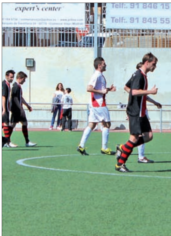
El Adarve ocupa la séptima posición GENTE