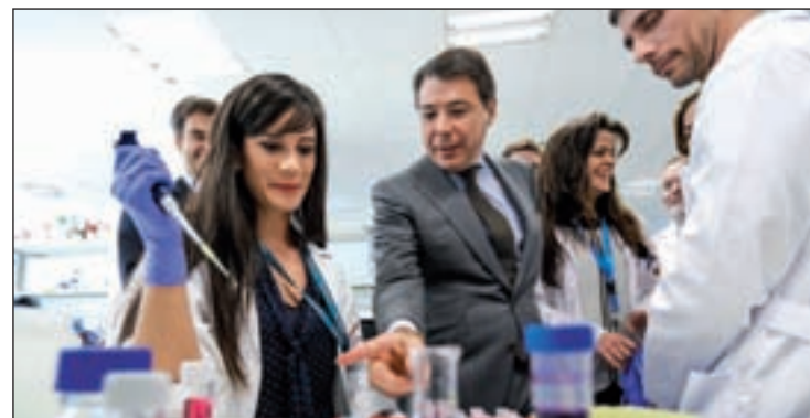
Ignacio González, durante la visita a IdiPAZ

gadora en la que participan más de un millar de profesionales. Su actividad se divide en seis áreas: Neurociencias, Cardiovascular, Enfermedades infecciosas e inmunidad, Patologías de grandes sistemas, Cáncer y genética molecular humana y, Cirugía, trasplantes y tecnologías de la salud.