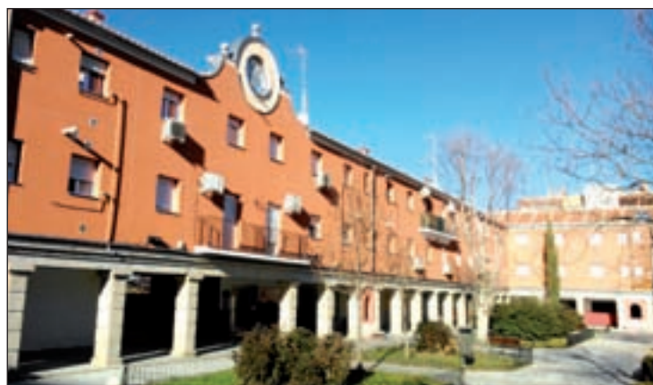
Imagen de la plaza

Para dar más valor a esta idea, la asociación ha realizado un informe en el que se asegura que “la puesta en valor de la Plaza de Nuestra Señora de Loreto pasa por reencontrarse con el uso con el que fuera concebida en el proyecto original de 1949: centro neurálgico social y comercial de la también llamada Colonia Iberia”. Para ‘Barajas, distrito BIC’, “el Ayuntamiento de Madrid no pue-