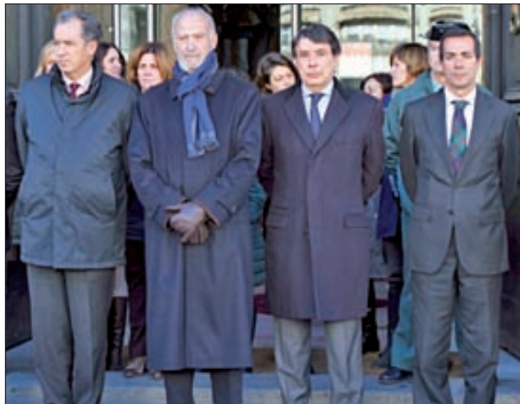
El Gobierno regional guardó un minuto de silencio

Por su parte, el ministro del Interior, Jorge Fernández, anunció