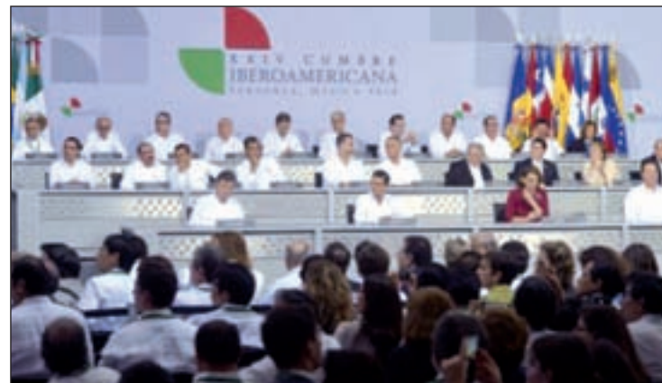
Presidentes y jefes de Estado durante la inauguración

Los países miembros aceptarán aumentar su cuota del 30 al 35 por ciento durante 2015 y 2016, para que la Península Ibérica baje la suya del 70 al 65 por ciento. De esta manera, en el horizonte de 2018 España se ahorraría unos 400.000 euros en su cuota a la Se-