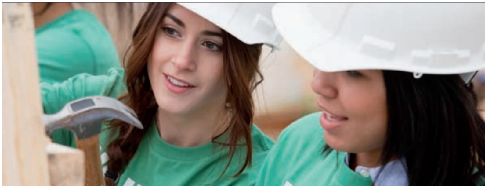
Voluntarias de la plataforma