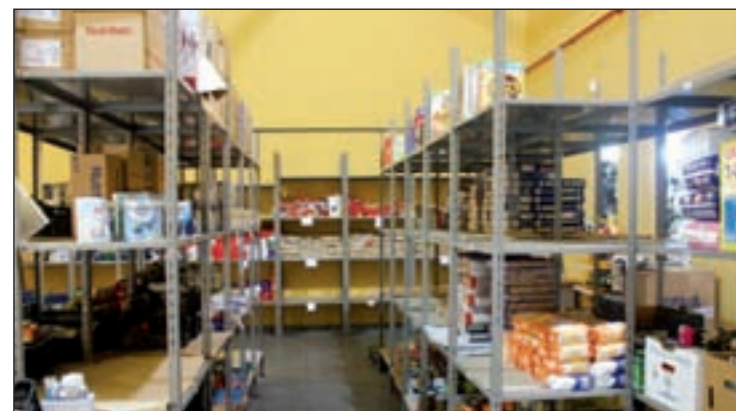
Almacén de recogida de alimentos

laborando en la inserción laboral de mujeres en riesgo de exclusión, mientras que Mensajeros de la Paz, fundada en 1962, coopera con proyectos internacionales en más de cincuenta países para ayudar a personas sin recursos. A estas labores voluntarias se suman las de Cáritas, Banco de Alimentos y Cruz Roja.