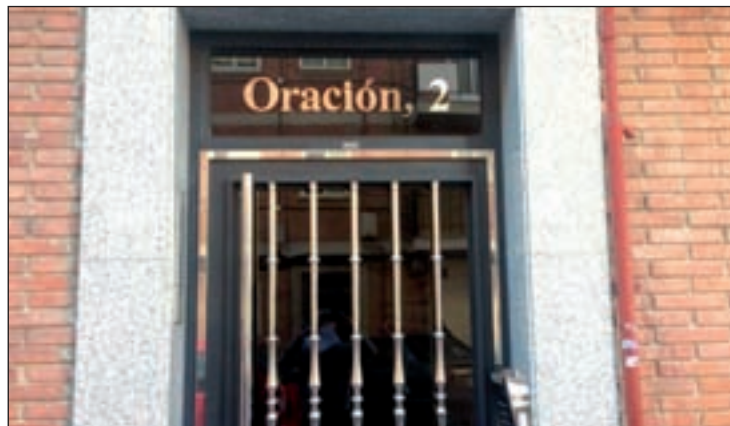
Imagen del portal de la vivienda donde ocurrieron los hechos

Tras llegar al lugar de los hechos, los agentes encontraron los cadáveres de las dos víctimas. Además, hallaron en poder del