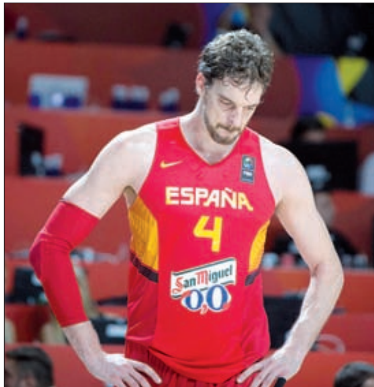
Pau Gasol, una de las dudas de cara al próximo torneo

positivo para los intereses españoles. Alemania, Italia, Serbia, Turquía e Islandia serán los rivales dentro de una primera fase que se jugará en Berlín. Los cuatro primeros del grupo obtendrán un billete para una segunda fase en la que se verían las caras con los equipos más potentes del grupo A, conformado por Francia, Finlandia, Bosnia, Polonia, Israel y Rusia.