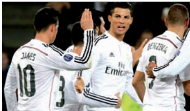
Los blancos ganaron la Intercontinental en 2002

Este torneo, conocido como Mundial de Clubes de la FIFA, arrancó el pasado miércoles con la disputa de un choque entre el equipo representante del país anfitrión, el Moghreb Tetuan, y el