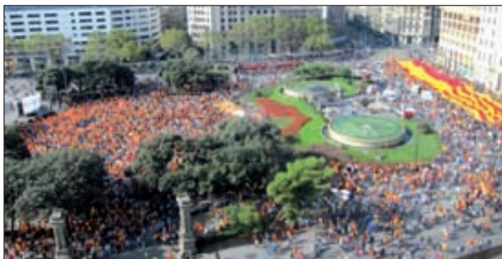
Imagen de archivo de una manifestación por la unidad

El secretario general del PSOE, Pedro Sánchez, insistió el pasado martes en que no habrá una gran coalición de gobierno con el Partido Popular tras las elecciones generales del próximo año, porque "no sería buena para el sistema democrático ni para los españoles", y negó que ambas formaciones estén manteniendo "contactos discretos" para tratar esta cuestión. Sánchez añadió que respeta "todas las opiniones", también las de aquellos líderes empresariales que desean ese pacto, porque está "convencido de que lo que quieren es lo mejor para el país". Sin embargo, subrayó que "la alternativa al PP es el PSOE" y que representa a "la izquierda responsable que apela a reformas radicales pero también a otras moderadas y al consenso".