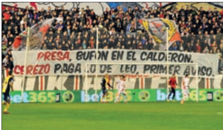
Imagen de archivo de un partido entre el Rayo y el Atlético

El presidente de la Liga de Fútbol Profesional (LFP), Javier Tebas, ha entonado el 'mea culpa' asegurando que se equivocó "al no ver esto como un problema en el fútbol y no voy a volver a equivocarme. Hemos engordado a un monstruo que hay que quitarse. Se ha tomado esa decisión y seguiremos en esa línea". La decisión cuenta con el respaldo de las esferas políticas. Así, el ministro