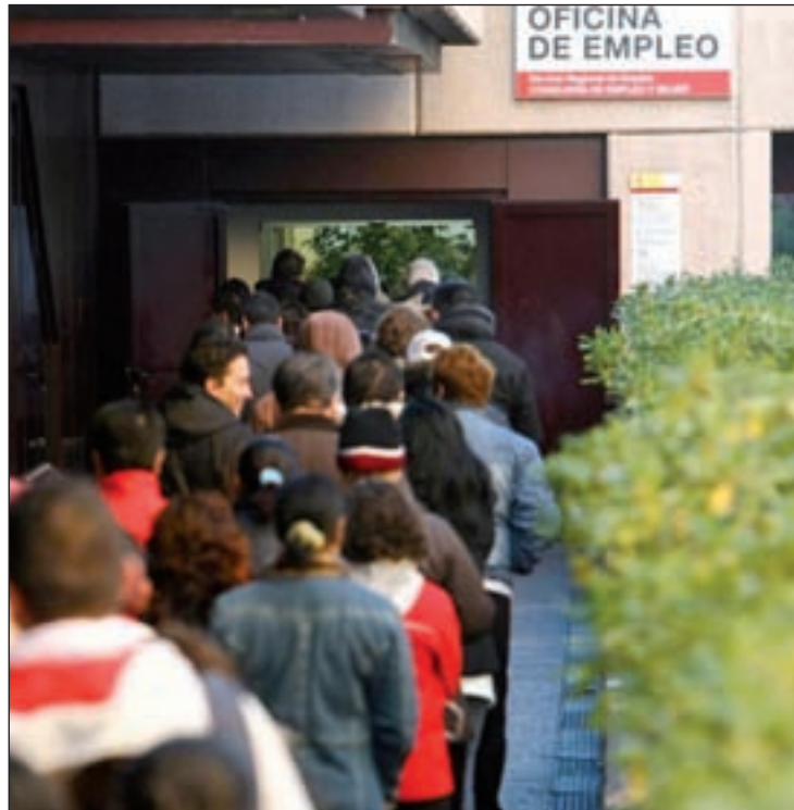
Imagen de una oficina de empleo

Los posibles beneficiarios de esta ayuda son los parados de larga duración que hayan trabajado por cuenta ajena en algún momento, que estén inscritos como demandantes de empleo a fecha 1 de diciembre de este año, que hayan dejado de recibir prestaciones al menos seis meses antes de solicitar la ayuda incluyendo el Prodi, el Prepara y la Renta Activa de Inserción (RAI), que tengan cargas