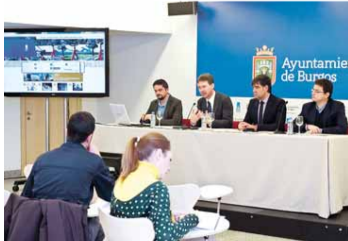
Acto de presentación de la nueva web en el Fórum Evolución.

La elaboración de la nueva herramienta, a la que se puede acceder desde cualquier formato digital, ha precisado de un año de trabajo en el que se ha elaborado un diseño que nada tiene que ver con el anterior. De este mo-