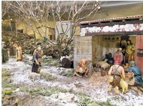
El Nacimiento podrá visitarse hasta el 6 de enero.