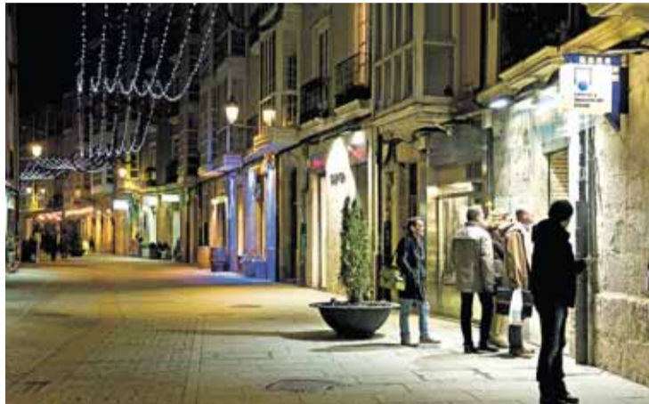
La capital burgalesa cuenta con 13 administraciones de lotería.