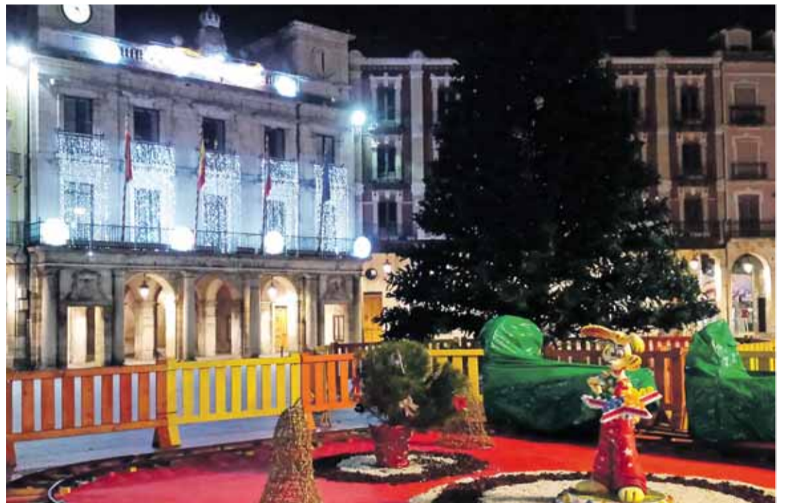
El encendido del árbol navideño instalado en la Plaza Mayor tendrá lugar el viernes 12 a las 19.30 horas.

Aunque hace ya varios días que el espíritu de la Navidad se asoma por las calles y plazas de la ciudad -desde el 28 de noviembre está abierta la Feria de Navidad en la Plaza del Rey San Fernando-, será este viernes día 12, a las 19.30 h., cuando arranque oficialmente la programación, con el encendido del árbol de 12 metros instalado en la Plaza Mayor. Previamente, a las 18.00 horas, las corales infantiles de los colegios Círculo Cató-