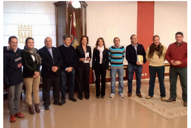
Firma del convenio en el Ayuntamiento.

Este proceso comienza en el mes de abril con la recogida de sugerencias y que en el periodo establecido este año, hasta junio, supuso la recepción de 4.376 propuestas que luego fueron remitidas a la asociación de vecinos correspondiente, que las estudió con el resto de colectivos de cada barrio y eligió en torno a una decena de ellas. Esta selección fue enviada a las Juntas de Distrito, para su conocimiento y refrendo, y a los servicios técnicos municipales, que emitieron un informe que fue nuevamente trasladado a las Juntas de Distrito para su priorización. Es finalmente la Junta de Gobierno Local la que incluye las propuestas que considera oportunas, atendiendo a sus características y