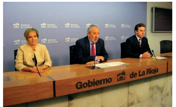
Anuncio del certificado en rueda de prensa.