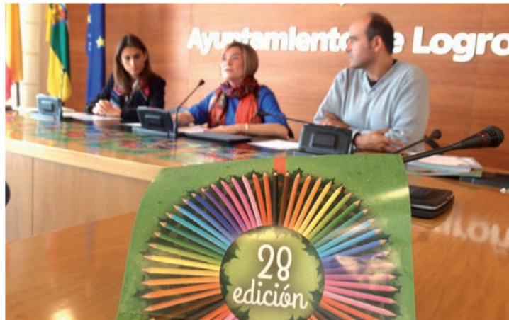
Presentación del concurso de tarjetas de Navidad.

El concurso de tarjetas está dirigido a los alumnos de los centros