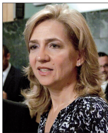
La infanta Cristina

inobjetable" al fraude que supuestamente cometió su esposo, Iñaki Urdangarín, a través de Aizoon (la empresa que compartían al 50 por ciento) y que se benefició de ello. Sin embargo, el Tribunal sobreseyó la causa contra ella por blanqueo de capitales.