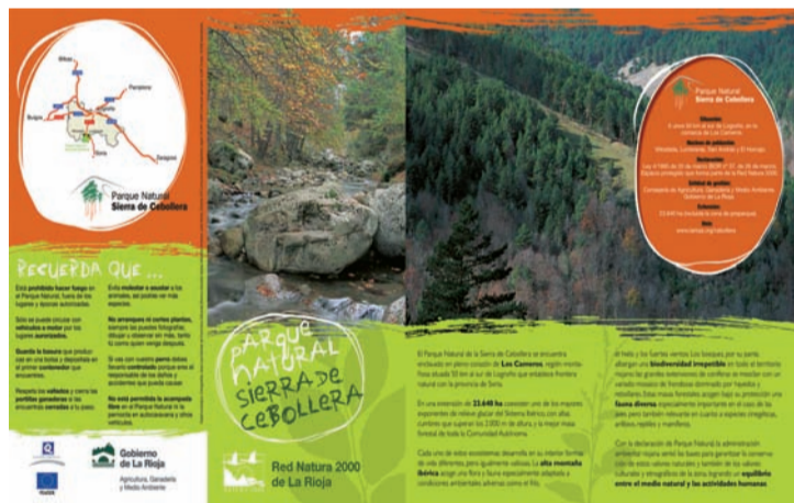
Nuevo folleto del parque.