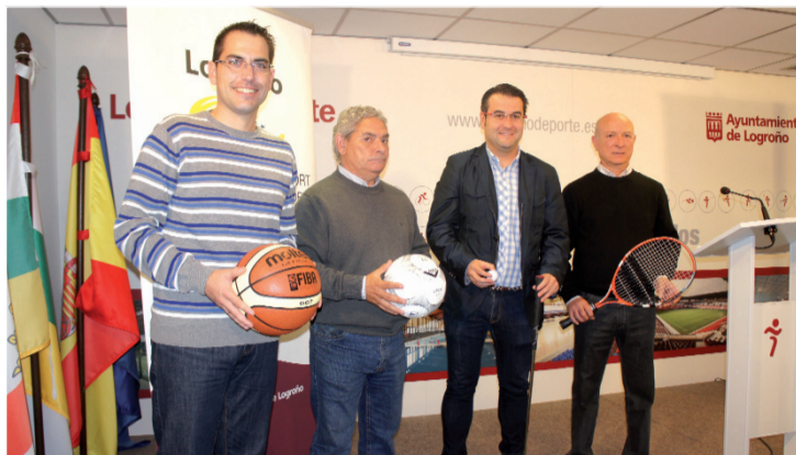
Presentación de los torneos en rueda de prensa.

to celebra su cuarta edición, comenzó el 11 de noviembre y se extenderá hasta el mes de mayo en los polideportivos municipales de Bretón de los Herreros y Caballero de la Rosa.