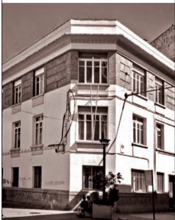
Vista del edificio.

Casi todos recordamos la primera vez que hicimos algo importante, importante para uno mismo, aunque para los demás sea una nimiedad. Casi todo el mundo recuerda su primera comunión; la primera vez que sus padres le dejaron ir a una verbena solo y volver a las 12 de la noche a casa o el primer beso. Yo tengo un recuerdo muy especial de mi primera exposición. La hice en un edificio que lo había conocido años atrás como sede de la OJE, pero que anteriormente tuvo otros usos. Estaba en el cruce de la calle General Zurbano, hoy Calvo Sotelo, con Adoratrices, actualmente Juan XXIII y se había construido en 1936 para albergar las oficinas de la Delegación de Hacienda de la Provincia de Logroño. Al construirse la actual Delegación de Hacienda, en la calle Víctor Pradera, cuya inauguración fue en el año 1956, este edificio de Calvo Sotelo pasó a ser la sede de instituciones de carácter político, la llamada Jefatura Provincial del Movimiento. En sus últimos años y hasta su demolición, ocurrida en el año 2000, el desaparecido edificio proyectado por el arquitecto Agapito del Valle también fue sede de varias instituciones, como el Instituto de Estudios Riojanos o la Consejería de Cultura de la Comunidad Autónoma. Actualmente, sobre su solar, hay una edificación destinada a viviendas. Ya sé que no se puede conservar todo, pero en este Logroño de mis amores, siempre tengo la sensación de que lo tiramos todo.