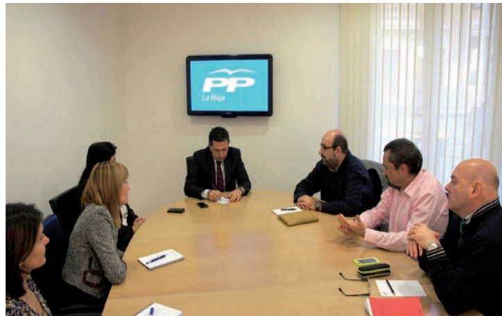
Reunión en la sede del PP en Logroño.