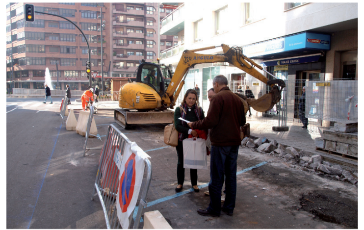
Visita a las obras en la Avenida de La Rioja.

La tarjeta ganadora se convertirá en la felicitación oficial del Ayuntamiento de Logroño para esta Navidad. La fecha límite para presentar los trabajos será el 20 de noviembre.