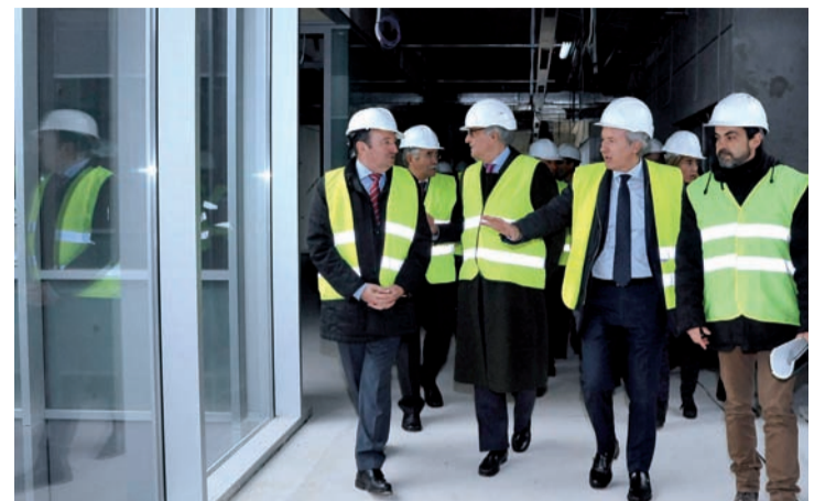
Visita a las obras del Palacio de Justicia.