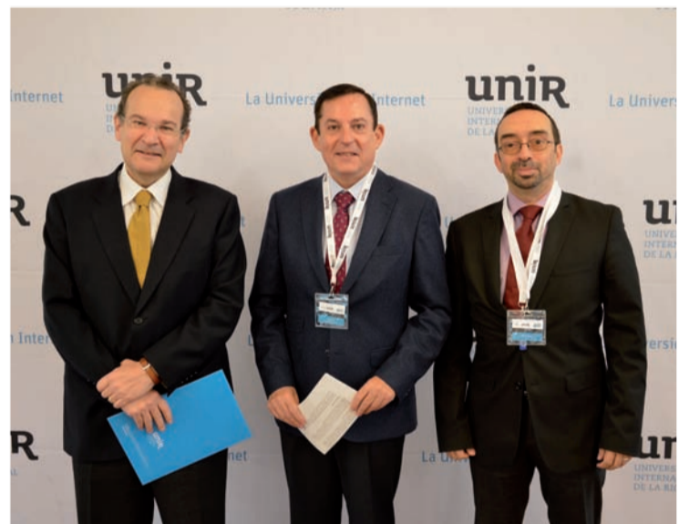
Inauguración del simposio.

"El 50% de la formación del futuro será online", indicó Javier Erro, consejero de Industria, Innovación y Empleo del Gobierno de La Rioja, durante la inauguración.