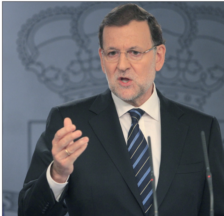
Mariano Rajoy, durante su intervención en el Palacio de La Moncloa

Durante su intervención, Rajoy aseguró que "no ha habido una consulta. Hemos asistido a un simulacro electoral. Ha sido un acto de propaganda política".