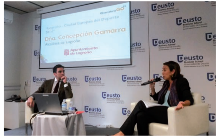
Intervención de la alcaldesa de Logroño.