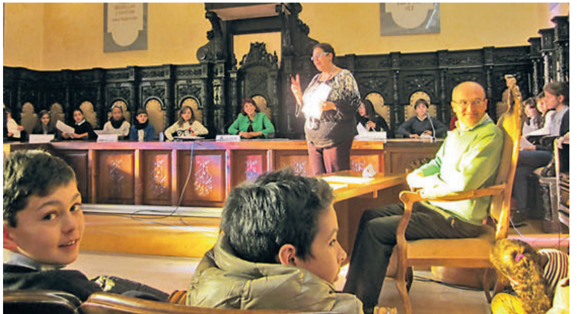
Al Pleno Infantil que tendrá lugar por tercer año los días previos a la Constitución (6-D) le precede un taller.