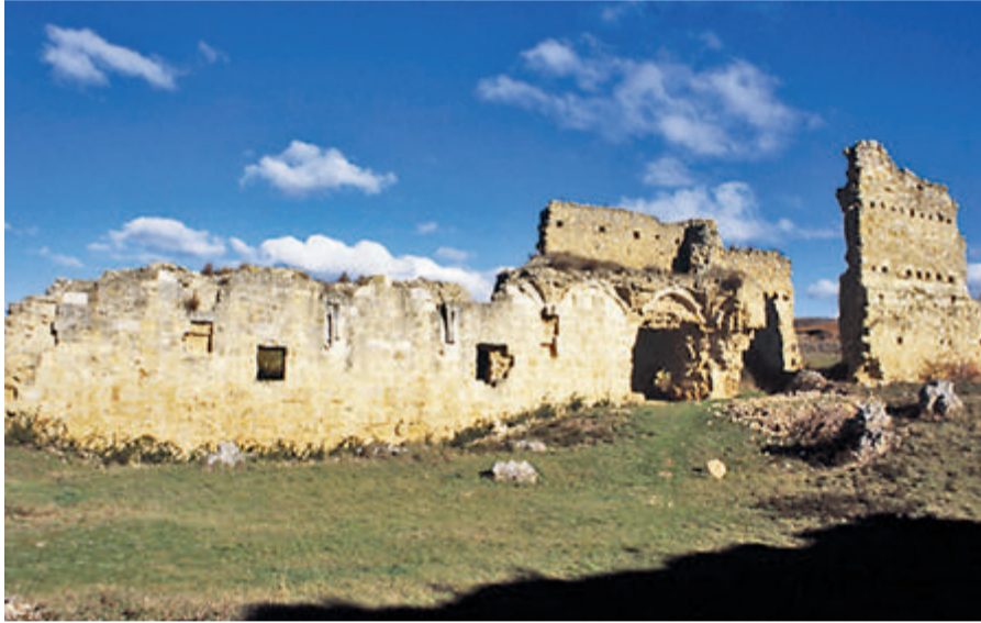
Vista actual del Monasterio, fundado en el 912, que cuenta con declaración BIC.

El Ministerio de Fomento ya aprobó destinar 176.127,75 euros al proyecto de consolidación de las ruinas del Monasterio de San Pedro de Eslonza, en Santa Olaja de Eslonza, con cargo a los fondos que se generan para el 1%