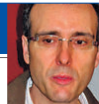
Secretario general de UGT en León

Que nos diga la ministra qué quiere hacer y nosotros le diremos qué queremos como ciudadanos para esta provincia que necesita un futuro. No queremos más soluciones provisionales. No se puede jugar con una ciudad, su gente y su futuro. Pastor tiene que poner las cartas sobre la mesa"