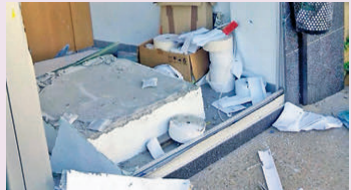
Detalle del hueco dejado por el cajero automático tras su robo.