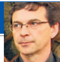
Presidente de la Unión Autónoma de CSI-F León

No se pueden utilizar los presupuestos con fines partidistas; hay que dejar trabajar a los técnicos para que apuesten por una solución definitiva. Pastor tiene que dejar de esconderse en los túneles y venir a León a dar la cara"