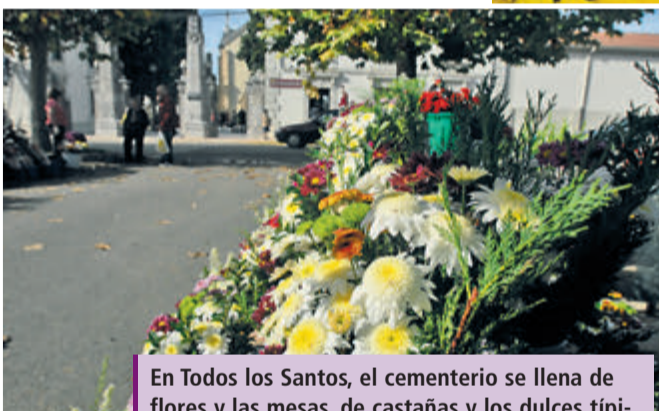
En Todos los Santos, el cementerio se llena de flores y las mesas, de castañas y los dulces típicos en forma de buñuelos de viento, huesos de santo y los catalanes 'panellets'.