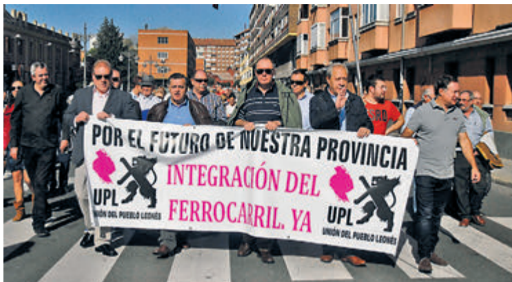
La integración del AVE por la ciudad y la defensa de un ferrocarril moderno centraron la protesta del domingo 26 de octubre.