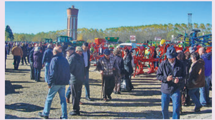
La Feria Multisectorial o de Maquinaria Agrícola es todo un reclamo.