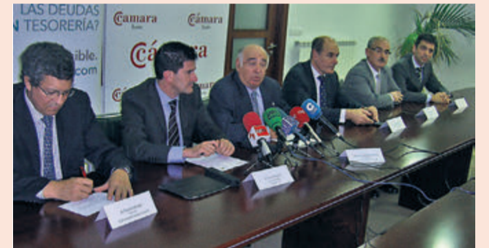
El presidente de la Cámara, Manuel Lamelas, firmó el convenio con Everis.