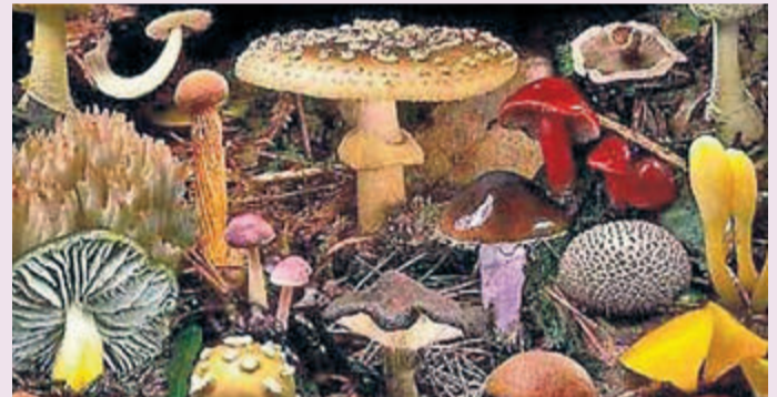
La salida al campo a recoger setas tendrá lugar de 10 a 14 horas.