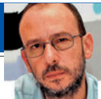
Secretario general de CCOO en León

Tras tres años en el Gobierno no saben la significación de la palabra diligencia que tanto usan porque la diligencia es agilidad y ya ha habido tiempo para quitarse la berencia de encima"