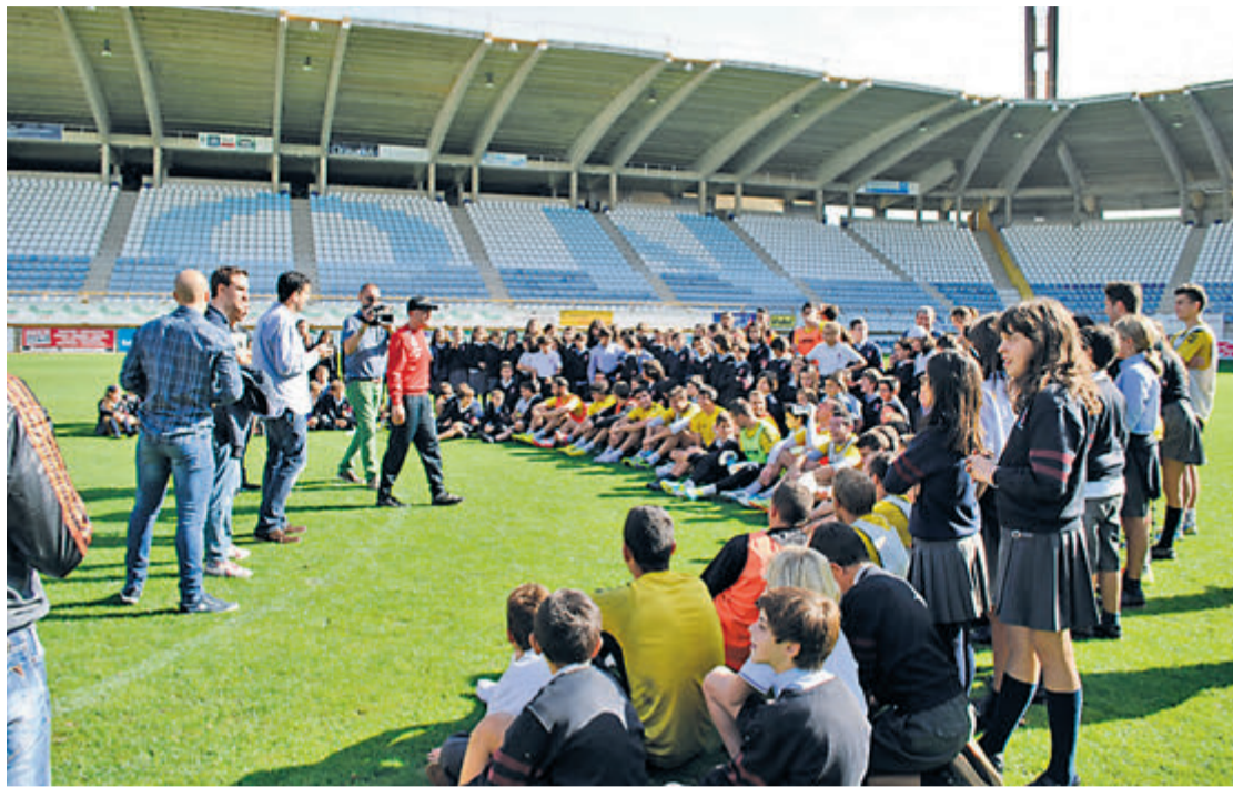
Los alumnos del Colegio Sagrado Corazón Jesuitas, durante su visita al 'Reino de León'.

FÚTBOL 2ª B / LA CULTURAL LEONESA RECIBE AL UD LOGROÑÉS EL 2 DE NOVIEMBRE