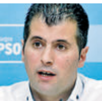
Secretario general de PSCyL