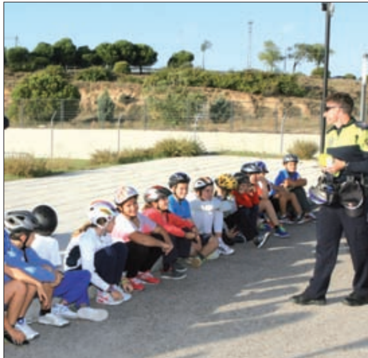
Los niños atienden a las indicaciones

Otra de las intenciones que tienen las clases prácticas que se realizan es, según el director del Ciudad de Nejapa, "crear conciencia. Aprenden que la bicicleta es un