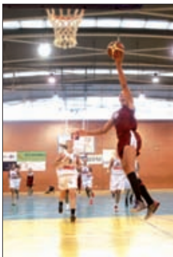
El Fundal, favorito

En la tarde del sábado (18:30 horas), el pabellón de Magariños se vestirá de gala para acoger el primer partido de la temporada del Tuenti Móvil Estudiantes como local. El equipo colegial cayó en la jornada inaugural por 73-59 ante el Snatt's Femeni Sant Adriá, pero llega muy ilusionado a la próxima cita ya que, al margen de