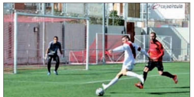
El Colmenar en un partido de esta temporada

que actualmente son penúltimos con tan sólo cuatro puntos. En cuanto al encuentro de la semana pasada ante el Villanueva del Pardillo, derrota por dos goles a cero. Además, la cifra de goles en contra sigue creciendo, 18, siendo el segundo más goleado del Grupo VII de Tercera División.