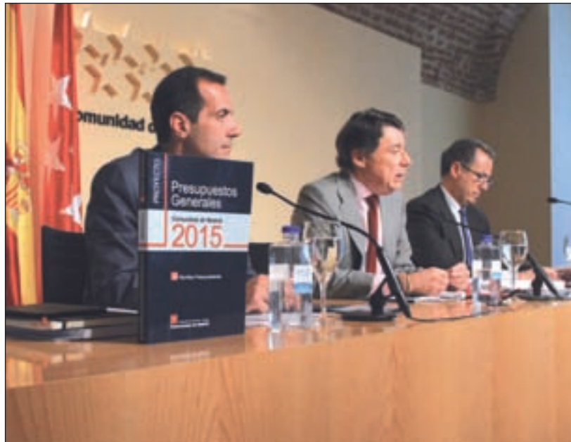
Los presupuestos se presentaron en el Consejo de Gobierno

Gracias al Plan PRISMA, dotado con 49,3 millones, las localidades verán mejoras en su territorio. En concreto, se contempla un aumento de las inversiones del 5% con respecto a 2014. Así lo dio a conocer el presidente de la Comunidad, Ignacio González, el