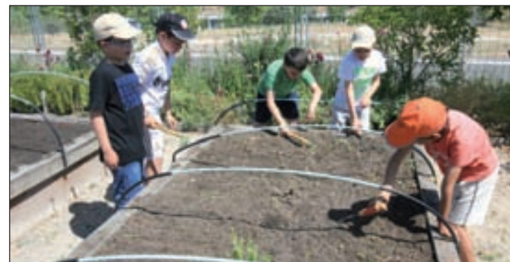
Alumnos trabajando en la huerta

nidad educativa de Tres Cantos y se ha convertido en un referente para colegios de poblaciones cercanas, que ya han visitado 'La Huerta del Cole' tricantina, para conocer su desarrollo y funcionamiento. En sus inicios participaban seis, y ahora ya son un total de 11 centros.