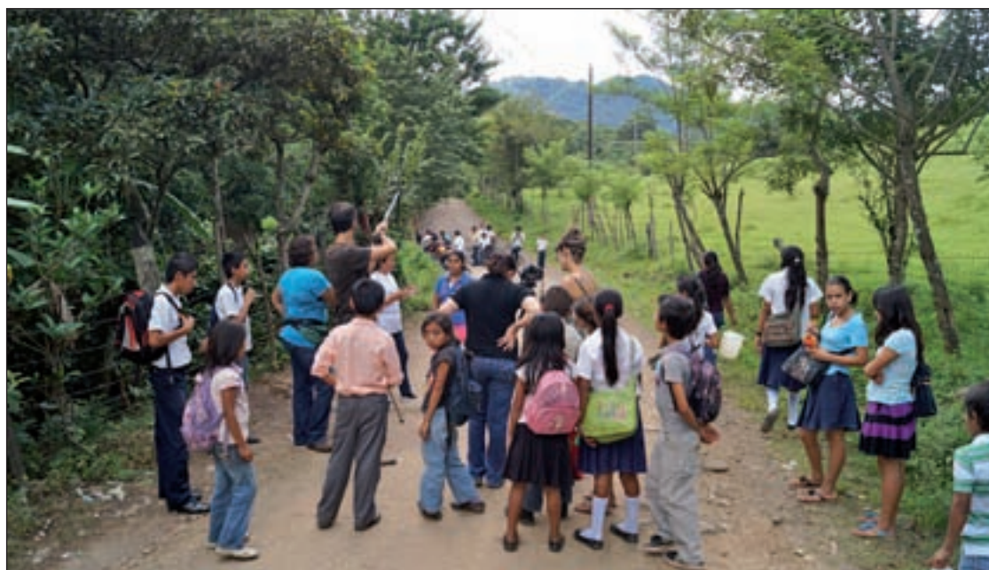
Pequeños nicaragüenses durante el rodaje del documental INFANCIA SIN FRONTERAS

Para obtener acceso a este nuevo servicio, es necesario estar en posesión de la tarjeta ciudadana o del carné de usuario de la Red de Bibliotecas de Tres Cantos y rellenar un impreso de solicitud. Para acceder a 'eBiblio' se precisa, además un correo electrónico. Una vez dado de alta, el usuario recibirá un 'email' con su número y una clave de acceso. Los libros en préstamo se pueden leer en 'streaming' o a través de cualquier ordenador o dispositivo conectado a Internet.