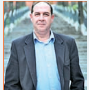
JOSÉ CARLOS BOZA ALCALDE DE VALDEMORO (PP)