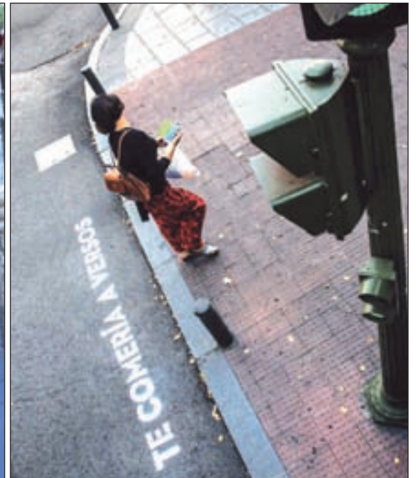
Algunos de los versos que pueden leerse en los pasos de peatones BOA MISTURA Y RAFA HERRERO/GENTE

cen que están detrás de esto, Boa Mistura, hay un mapa con los 22 puntos que un día amanecieron llenos de poesía. Y si el dicho dice que "de Madrid al cielo", esta vez merece la pena mirar al suelo para ver dónde se pisa.