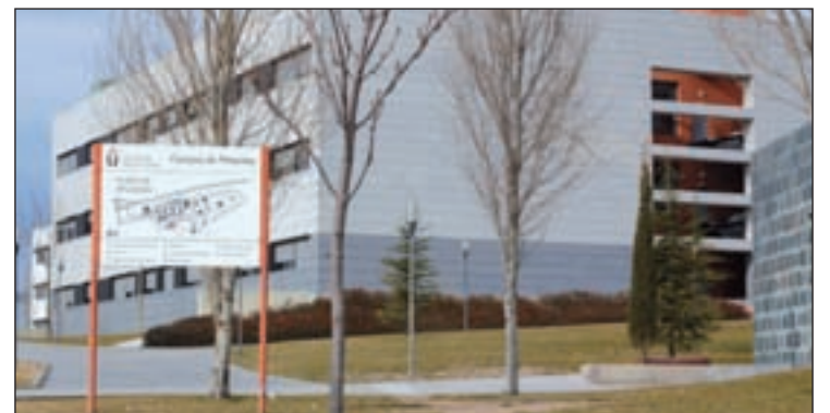
Campus de Móstoles de la Universidad Rey Juan Carlos GENTE

la intervención en las mismas de las Fuerzas y Cuerpos de Seguridad del Estado. El protocolo, que ya está redactado, está previsto que se firme en los próximos días por el rector de la Universidad de Alcalá de Henares y la delegada del Gobierno en Madrid, Cristina Cifuentes.