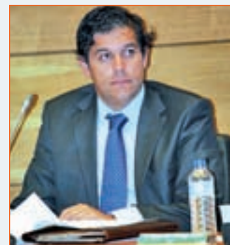
AGUSTÍN JUÁREZ ALCALDE DE VILLALBA (PP)