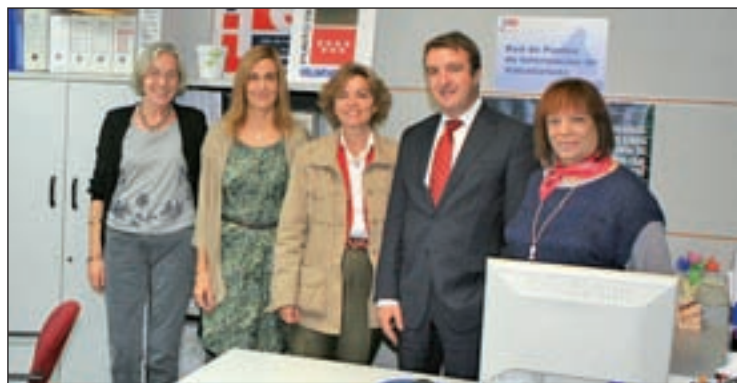
La directora de Voluntariado de la Comunidad, junto al alcalde

En definitiva, un problema medioambiental grave, pero que no pone en peligro la salud de nadie. Eso sí, lo mejor "es retirarlo cuanto antes, ya que si permanece ahí más tiempo puede llegar a contaminar acuíferos que van a dar al pantano de Santillana", apunta.