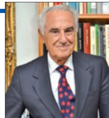
CHEMA MARTÍNEZ / GENTE

rar”. “Debe aplicarse la ley, porque un país donde se da este tipo de corrupción no avanza, está podrido como los árboles del Retiro que se caen”, alerta el periodista.