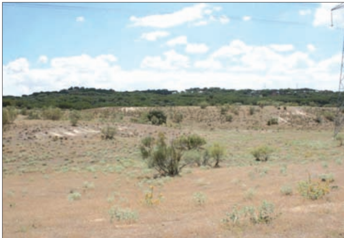
La finca de Valdeloshielos en donde se pretende levantar el cementerio

En el informe se proponen dos ubicaciones. La finca de Los Quemados, en el nuevo desarrollo, y la finca de Valdeloshielos, situada en suelo urbano, a la altura del kilómetro 23 de la M-607. Está última, limita con otra finca y con parte del Monte del Pardo por el