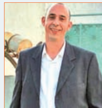
DAVID RODRÍGUEZ ALCALDE DE CASARRUBUELOS (PP)