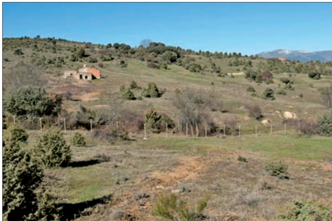
La antigua explotación minera ubicada cerca del Cerro de San Pedro, entre Colmenar y Guadalix

Pero, ¿cómo afecta la presencia de arsénico a la zona? Para Garrido, la existencia de este mineral es "preocupante". Los residuos que se han encontrado en la zona trabajada "sobrepasan los