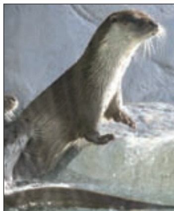
Son una especie en extinción