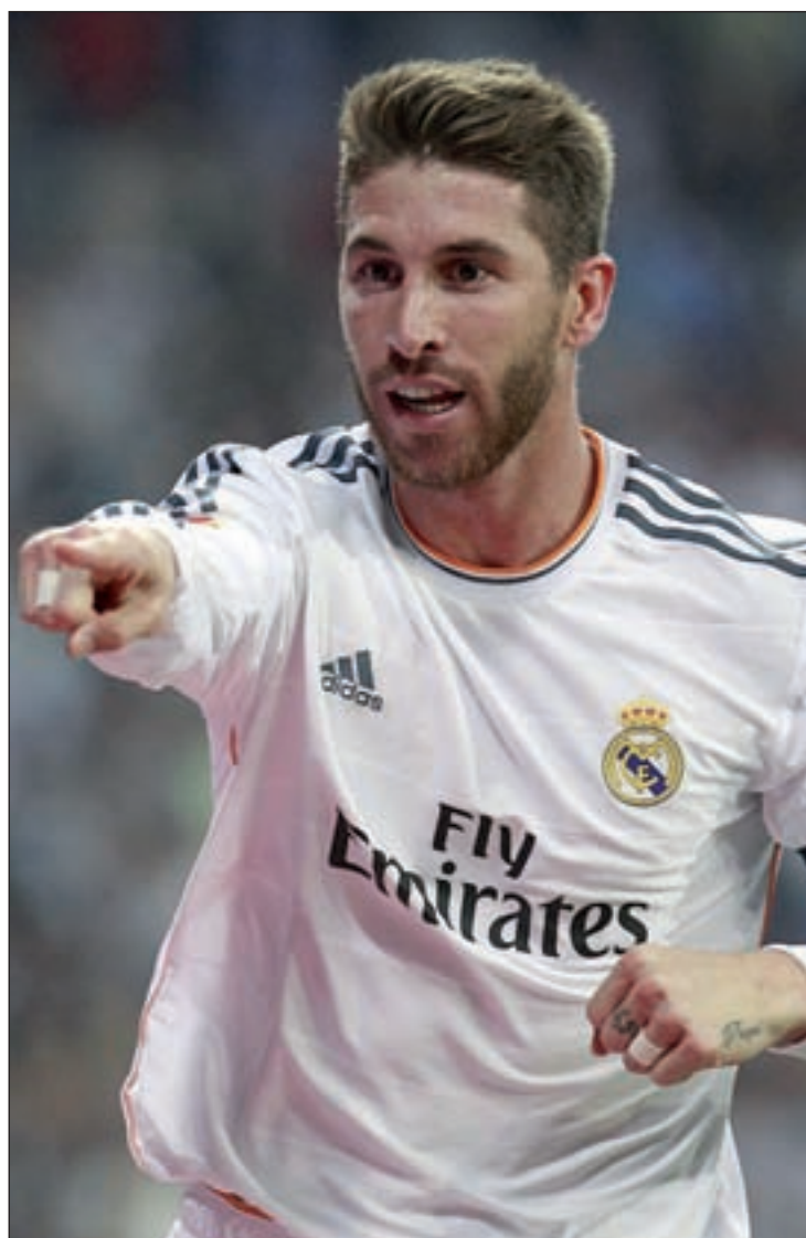
Sergio Ramos ha pasado los últimos días entre algodones

Sin embargo, su trayectoria como visitante sigue siendo algo errática, una circunstancia que intentará aprovechar un Atlético de Madrid que perdió su lugar entre los cuatro primeros clasificados después de caer derrotado en su visita a Valencia. El italiano Cerci será baja por sanción.