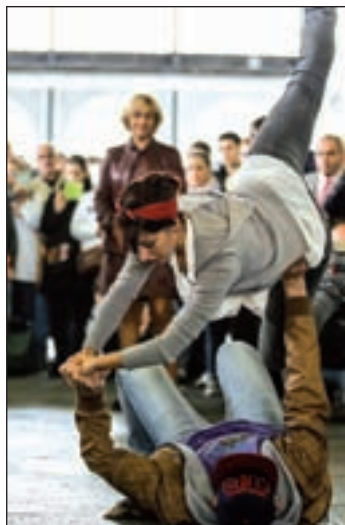
Un momento de la presentación

Madrid se convierte así en el ojo de un huracán de arte que acogerá las últimas propuestas