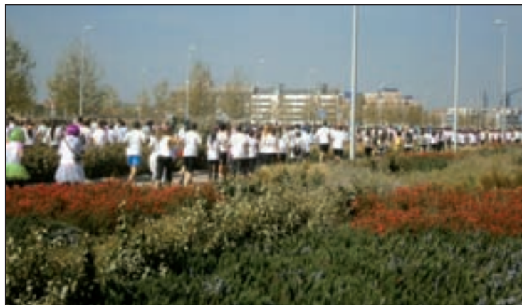
Participantes de la pasada edición de la Holi Run en Madrid

Para competir o para pasárselo bien, con fines solidarios o buscando la mera diversión. El completo calendario de carreras que atañe a la capital de España ofrece este domingo dos pruebas muy diferentes entre sí. Por un lado, la Carrera en Marcha contra el Cáncer se presenta ante los aficionados con el objetivo de "promover la mayor participación ciudadana en un evento solidario, uniendo a voluntarios, socios, pacientes, familiares, entidades, instituciones y a toda la sociedad civil,