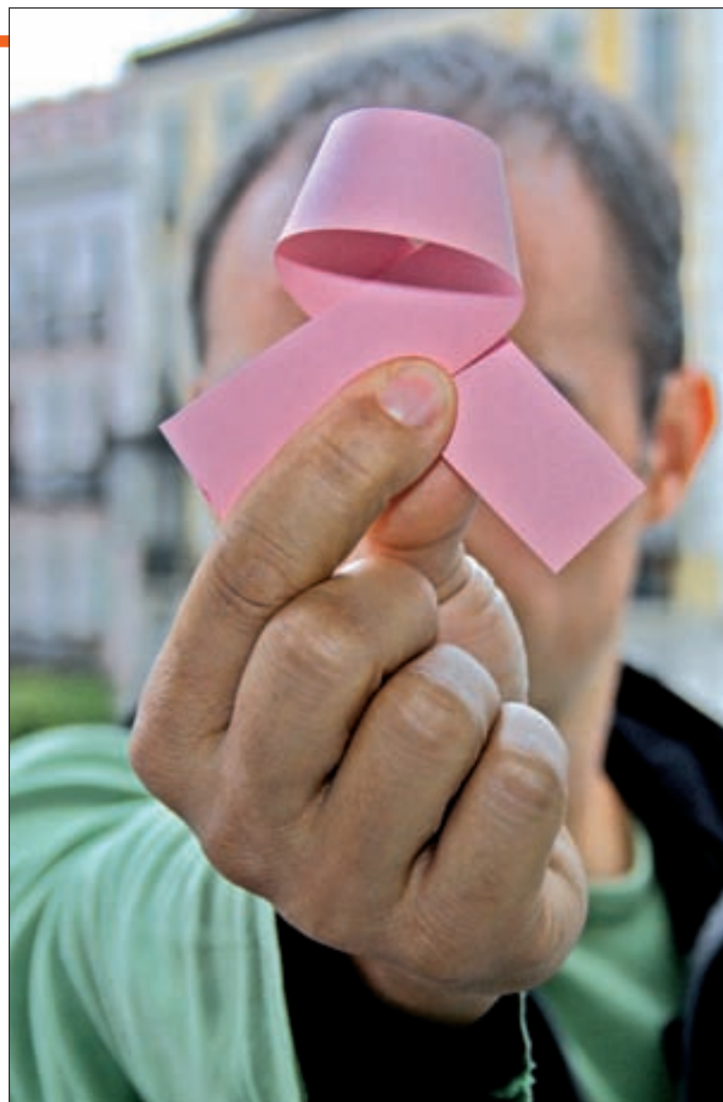
El lazo rosa simboliza la lucha contra el cáncer de mama

Asimismo, si se tiene en cuenta que "un número muy importante de mujeres con cáncer de mama lleva un tratamiento de hormonoterapia durante cinco o diez años", en el caso de los hombres, "por el nivel de estrógenos en su cuerpo, de las cuatro pastillas que existen de hormonoterapia sólo pueden recibir una", matiza Muñoz. En la gran mayoría de los casos, una mutación genética es el factor más importante en los hombres que tienen cáncer de mama. De esta manera, la doctora cuenta que "si están alterados el gen BRCA1 o el BRCA2 en