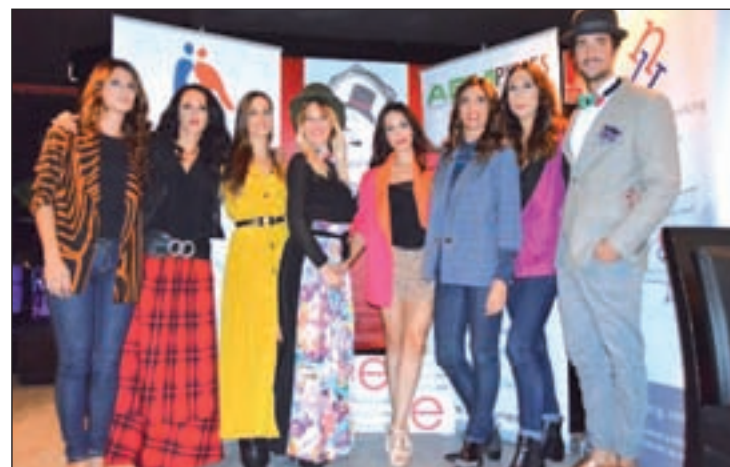
Participantes en el desfile de La Bohemia