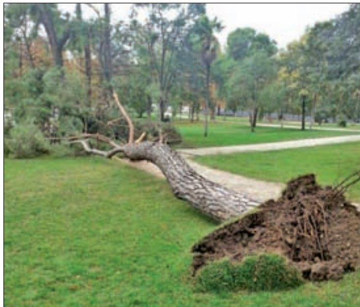
Ejemplar caído el pasado martes

En dicha presentación, los especialistas explicaron que un radar para conocer el estado de las raíces, resistógrafos para los troncos y tomógrafos de sonido y on-