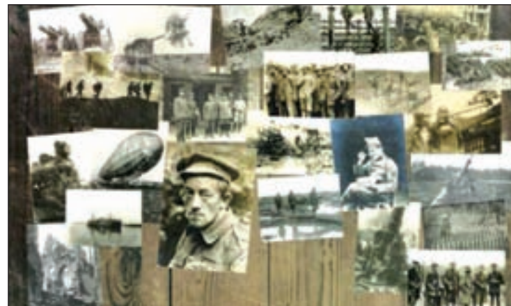
Parte de la muestra

A lo largo de cuatro semanas, tanto artistas consolidados como nuevos talentos serán capaces de hacer vibrar al público al fusionar las raíces de la danza tradicional para convertirla en actual en un certamen que también dirige la mirada al trabajo de coreógrafos madrileños.