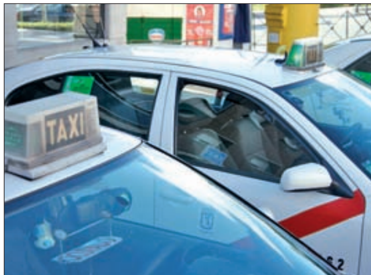
Se pretende reducir los viajes en vacío de los vehículos GENTE

La tarifa fija al aeropuerto (tarifa 4) en los trayectos desde y hacia el interior de la M-30 se mantendrá en 30 euros, mientras que la tarifa 3, que incluye una cuantía mínima de salida de Barajas, quedaría en 20 euros cuando no se aplique el precio fijo, una cantidad que se incrementará si el servicio se realiza en horario nocturno, es decir, de nueve de la noche a siete de la mañana.