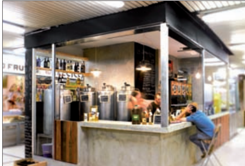
Puesto de LaSiempreLlena en el Mercado de San Fernando

En las estanterías de LaSiempreLlena figuran veinte variedades de vino, blancos y tintos, la