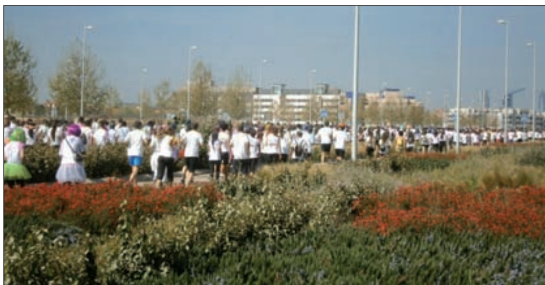
Participantes de la pasada edición de la Holi Run en Madrid