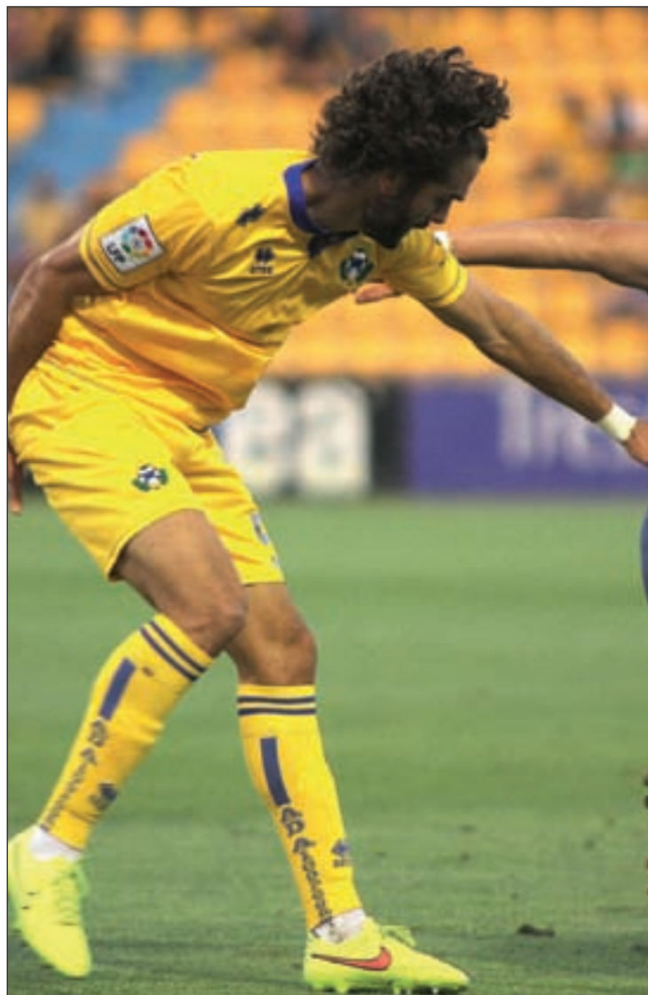
El Alcorcón, en uno de sus encuentros

En este punto, Bordalás insistió en que ha sido el mejor encuentro del conjunto alfarero hasta la fecha. Para los alcorconeros es un resultado “justo y muy importante”, ya que acumulaban únicamente nueve puntos y dos partidos perdidos en casa. “Necesitábamos una victoria”, aseveró Bordalás.