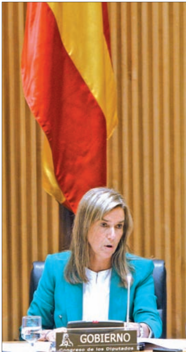
LA MINISTRA DE SANIDAD Ana Mato aseguró en el Congreso que, en el momento en el que termine la investigación, los resultados "serán públicos" y permitirán "tomar medidas" para evitar situaciones similares.

Asimismo, durante su intervención en la Comisión de Sanidad en el Congreso el pasado miércoles, Mato reconoció, por primera vez, que, en la gestión de la crisis del ébola, "probablemente, no hemos hecho todo bien y hay muchas cosas que mejorar", ya que este suceso "no tenía por qué haberse producido", por lo que es preciso "analizar las causas y atajar la situación". Al mis-