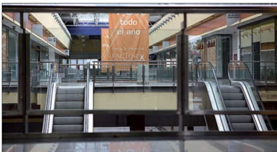
Estado actual del centro comercial