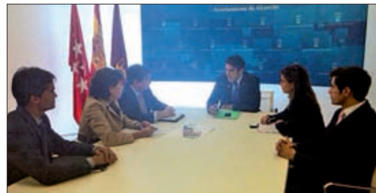
Imagen de la reunión

debe presentar a continuación los proyectos de urbanización y de reparcelación del ámbito", han dicho fuentes municipales. Pérez ha puesto a su disposición el "impulso e interés municipal para garantizar el buen desarrollo del nuevo barrio de Retamar de la Huerta", según ha señalado..