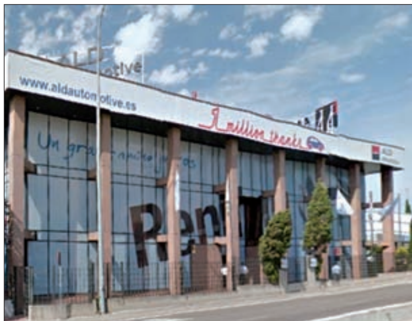
La sede roceña de ALD Automotive, activa en materia social

Así comenzó una relación que se ha estrechado con los meses. En lo que va de año, además de