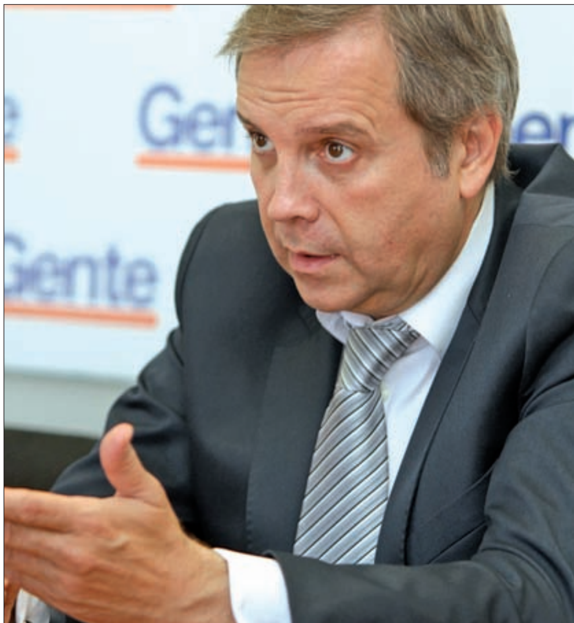
RAFA HERRERO / GENTE

En primer lugar, devolver Madrid a los madrileños. Voy a descentra-