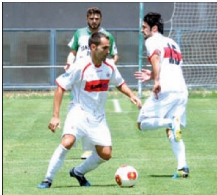
El Pozuelo se enfrenta al Sanse en la quinta jornada

Por su parte, el Villanueva del Pardillo, uno de los novatos de la liga, suda para mantener el nivel. Aunque permanece en los últimos puestos, empezó con energía y sin titubeos. Tras dos derrotas llegó a conseguir un empate contra el Real Madrid C en la tercera jornada (1-1), un resultado que sentó bien a los del Noroeste.