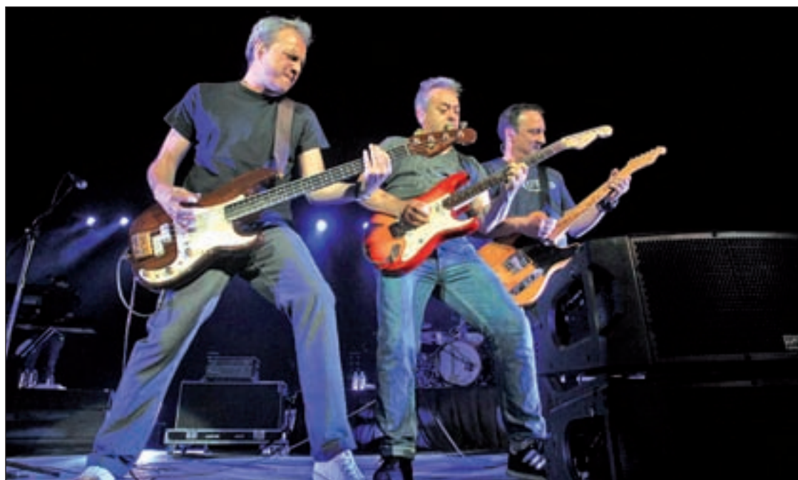
Los Hombres G tocarán el día 3 de octubre en el Recinto Ferial de Boadilla