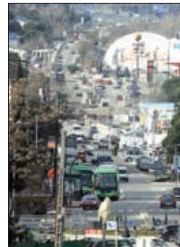
Imagen del centro de Villalba

Así, el concejal destacó que en 2015 el impuesto de vehículos bajará un 5 por ciento, además de los precios públicos de actividades deportivas y culturales que disminuirán un 0,5. Se mantendrá, sin embargo, la reducción de un 30 por ciento de la tasa de basura, un anuncio que la oposición criticó "pues no se trata de una bajada, sino que el año pasado estaba un 30 por ciento más cara y han obligado al Ayuntamiento a rebajarlo, al sobrepasar el tope legal estipulado", denuncian desde