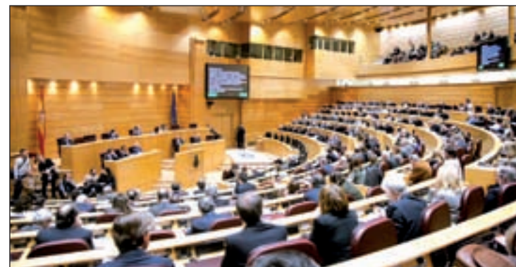
Pleno del Senado

133.712 millones de euros (+4,3%) y un objetivo de déficit de 30.959 millones (2,9%), cantidades a las que hay que restar la financiación de las administraciones territoriales (32.941 millones) y unos ajustes de contabilidad nacional de 2.670 millones. Este es el primer paso para la aprobación de los Presupuestos de 2015, que deben entrar en el Congreso como máximo el 30 de septiembre, según establece la normativa vigente en cuanto a la tramitación.