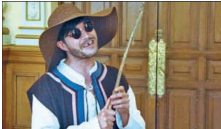
Uno de los actores que participan en las rutas

Valladolid fomenta el turismo y presenta su oferta de visitas guiadas. Veinte itinerarios distintos a los que podrán optar los viajeros hasta el 28 de septiembre. Rutas teatralizadas, nocturnas, para familias, por la naturaleza, excursiones o paseos en autobús y barco. El objetivo es dar a conocer la ciudad, su patrimonio y su cultura. Para ello, se ofrece un completo recorrido por los principales monumentos, museos, exposiciones y espacios naturales que ofrece la ciudad. Entre los más destacados se encuentra el titulado 'Lí-os y amoríos en el Valladolid de la Corte.' "Un tiempo histórico en el que también hubo momentos pa-