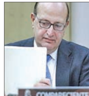
Ramón Álvarez de Miranda

zó algunas medidas que pondrá en marcha para "dotar de mayor transparencia" al Tribunal, tales como incrementar la información publicada en la página web sobre los contratos de obras de mantenimiento (incluyendo contratos menores) y "dotar de transparencia" a todos los nombramientos, publicando los currículos de los adjudicatarios. Además, se dará publicidad a la Relación de Puestos de Trabajo (RPT), aprobada en el año 1989.