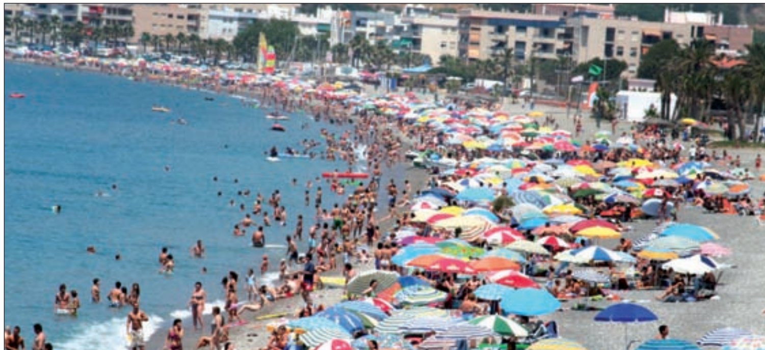
Las costas españolas son los destinos más demandados durante las vacaciones de verano

El precio medio por semana en primera línea de playa se sitúa en 552 euros