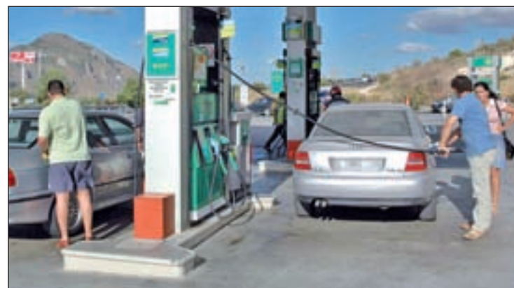
Los viajeros pagan un 2,5% más de media por el litro de gasolina

ción General de Tráfico para la operación especial de verano, que culminará el 31 de agosto y que comenzó el pasado fin de semana dejando ocho muertos en seis accidentes de tráfico. La cifra reduce los fallecidos en el mismo periodo de 2013, cuando 11 personas perdieron la vida durante la primera fase del dispositivo.