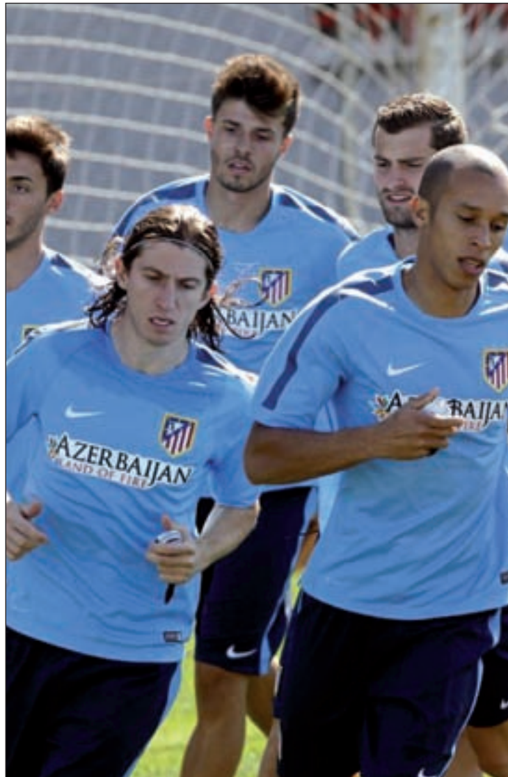
El Atlético, uno de los primeros en iniciar la pretemporada

Este lunes también supondrá el estreno de Luis Enrique como entrenador del Barcelona. El club azulgrana esperará menos para jugar su primer partido, ya que el día 19 se medirá al Recreativo.