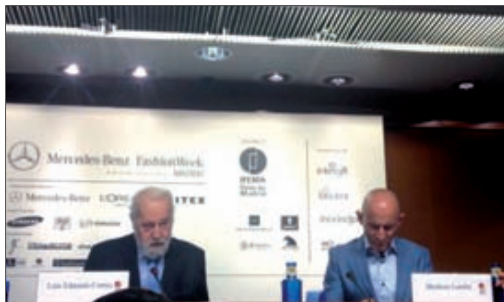
Presentación de la 60 edición de MBFWM

que tradicionalmente se desarrollaba en cinco días, y que en esta ocasión contará con una jornada más. El motivo es la incorporación de la firma española Desigual a la pasarela, quien abrirá esta nueva cita con la moda el jueves 11 de septiembre a las 20 horas. Los días posteriores, como ocurre habitualmente, lo harán el resto de los diseñadores. Primero los consagrados, que presentarán un total de 30 colecciones, y después los jóvenes creadores EGO, que mostrarán sus propuestas en 10 desfiles. Concretamente, nue-