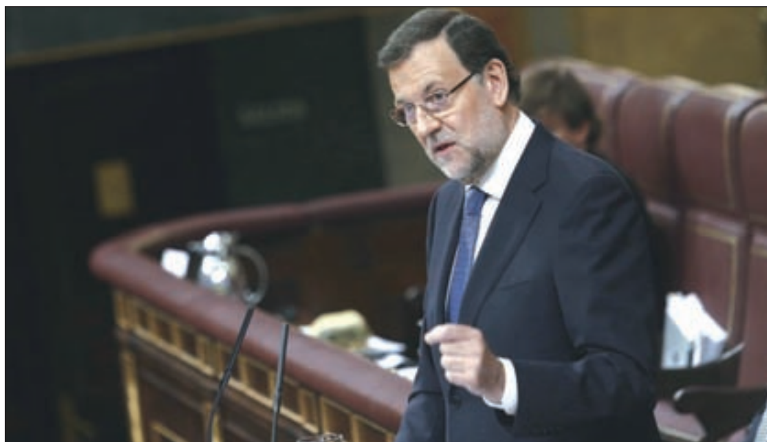
El presidente del Gobierno durante la sesión de control al Ejecutivo en el Congreso de los Diputados

El Ejecutivo siempre ha defendido la "urgencia" en la tramitación y ha mantenido que se trata de una reforma "parcial" de la Ley de Propiedad Intelectual, cuyo objetivo es adecuar la legislación española a dos directivas comunitarias pendientes. Se trata de una normativa europea de 2011 que amplía de 50 a 70 años el plazo de protección de artistas de obras musicales con letra, así como otra de 2012 por la que se establecen garantías jurídicas para las 'obras huérfanas'. Además, la reforma conlleva también la puesta en marcha de la 'tasa Google', una compensación a los editores por el uso de sus contenidos en agregadores de noticias.