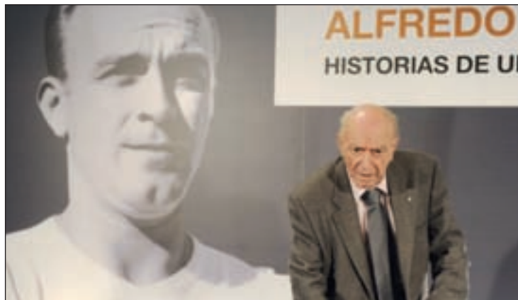
La capilla ardiente quedó instalada en el Santiago Bernabéu

Después de pasar varios días ingresado en el madrileño hospital Gregorio Marañón a causa de un infarto, Alfredo Di Stéfano falleció el pasado lunes a los 88 años de edad. Nada más conocerse la noticia, se sucedieron reacciones de diversas personalidades del mundo del fútbol. Así, el presidente del Real Madrid, Florentino Pérez, declaró durante un acto celebrado en el antepalco del Santiago Bernabéu que "Alfredo di Stéfano cambió la historia del club y del fútbol, ayudó a transformar al