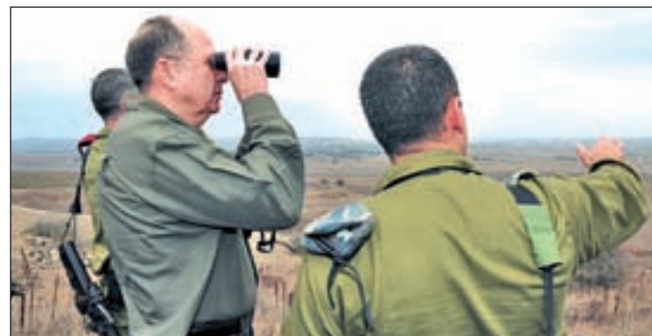
Moshe Yaalon, ministro de Defensa de Israel

mandos de las milicias. Desde el comienzo de la operación, el Ejército ha alcanzado más de 400 objetivos en la Franja, mientras que 225 cohetes han sido disparados desde este enclave palestino hasta territorio israelí, según el balance hecho público el pasado miércoles por la mañana.