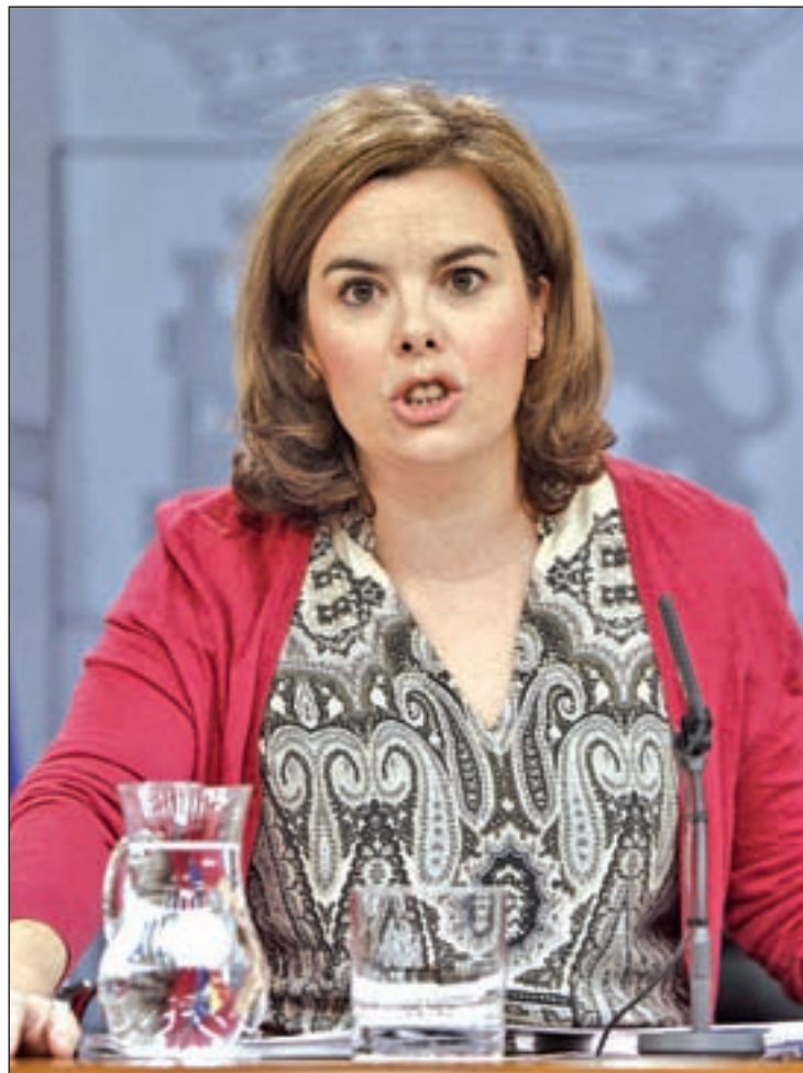
Soraya Sáenz de Santa María, durante la rueda de prensa

El Gobierno también ha creado la figura de 'Entidad Capital-Riesgo Pyme', que destinará más del