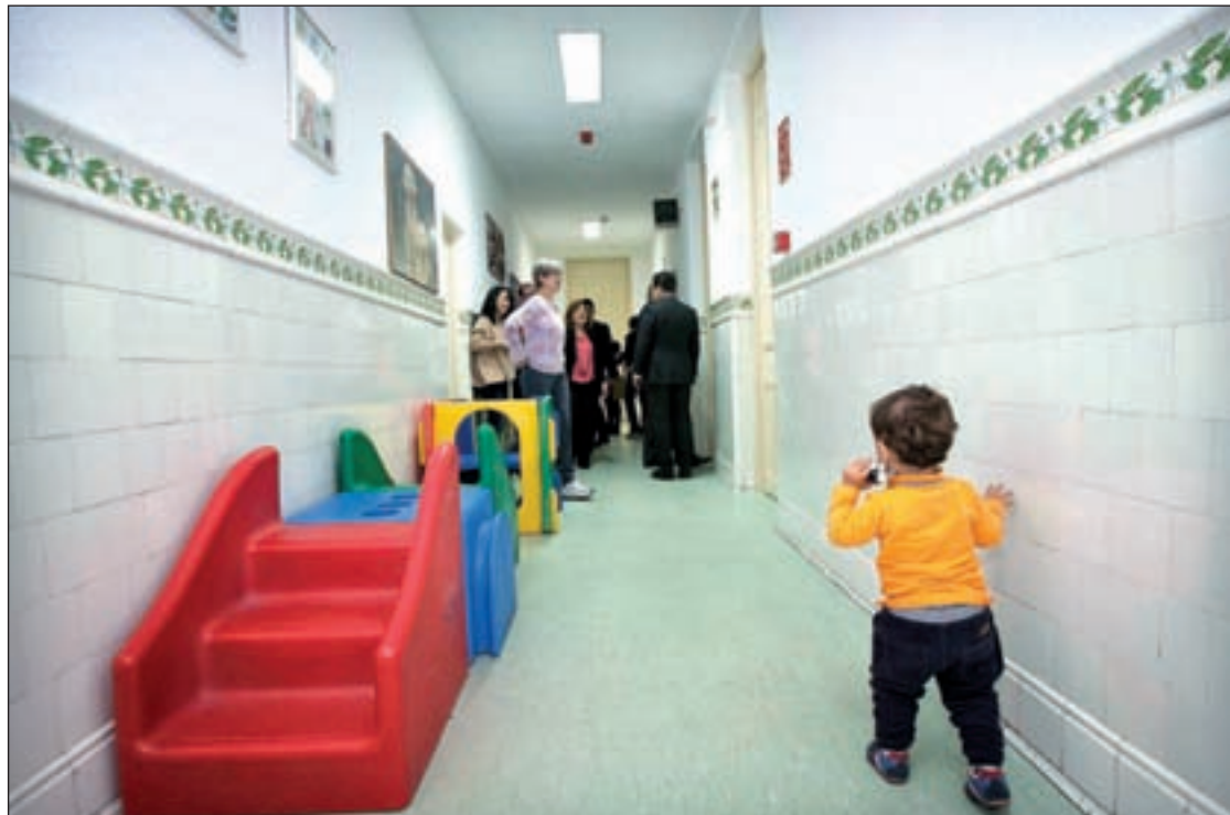
En la actualidad, el centro acoge a 25 menores

El consejero traduce en cifras esta situación tan peculiar que viven algunos niños: "Dentro de los 4.000 niños que tiene la Comunidad de Madrid con alguna medida de protección, 1.600 están en