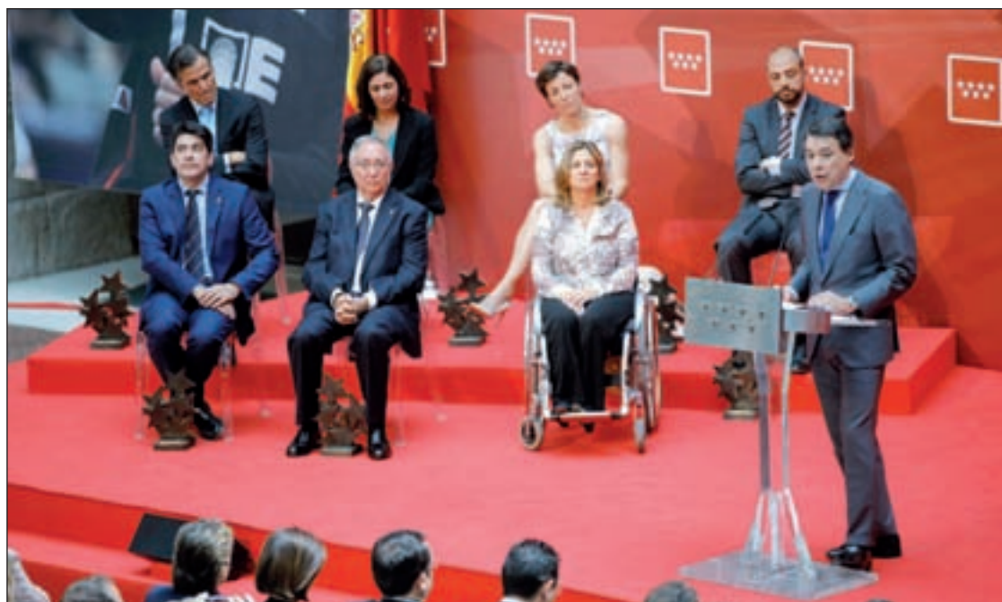
Foto de los premiados junto al presidente Ignacio González