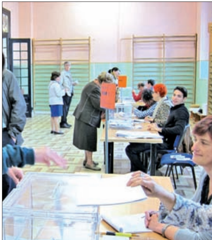
Los madrileños pasaron por las urnas GENTE

La ascensión de UPyD e IU contrasta con el descenso de los dos