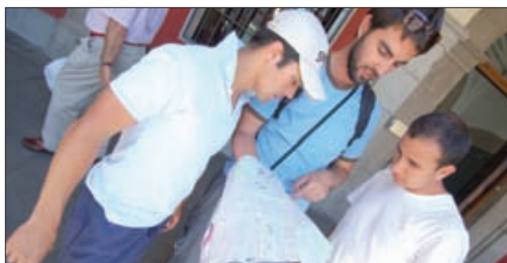
La Comunidad recibió 1,3 millones de turistas hasta abril GENTE