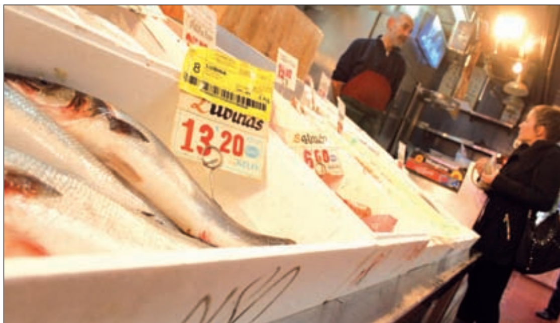
El etiquetado debe ofrecer una información detallada

Asimismo, en el primer trimestre del año, el número de viviendas hipotecadas se redujo un 24,2% en relación al mismo periodo de 2013.