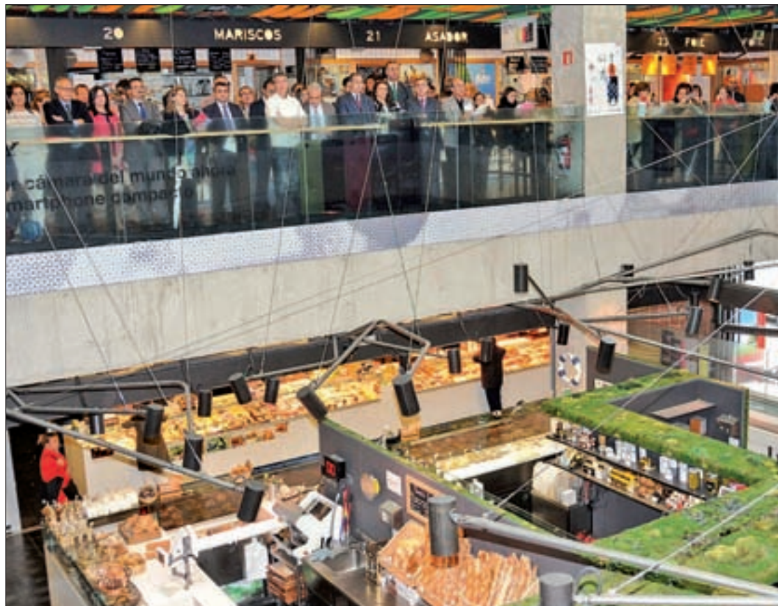
El Mercado de San Antón en un momento de la inauguración del ciclo de conciertos

La compañía Camerata Lírica de España concluirá este ciclo el próximo 20 de junio en el Mercado Maravillas, con 'Lo Mejor de la Zarzuela', con canciones tan po-