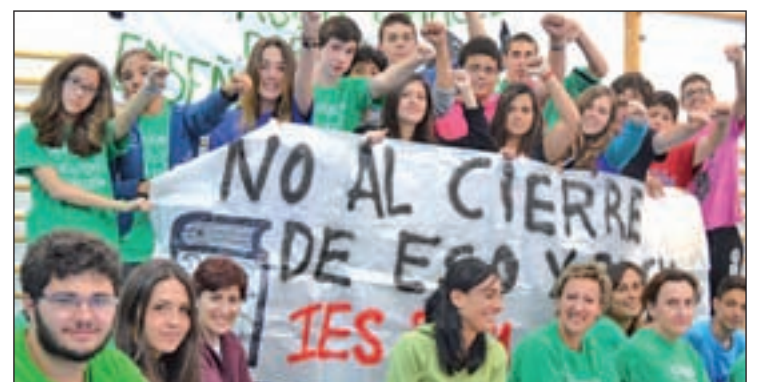
La AMPA del centro no tira la toalla

de batuca Sambaleza, los manifestantes quisieron mostrar, nuevamente, su rechazo al cambio en la oferta educativa del Rosa Chacel. El pasacalles dio comienzo en los alrededores del instituto para recorrer calles como las de Santa Adela, Santa Susana o Virgen del Carmen.