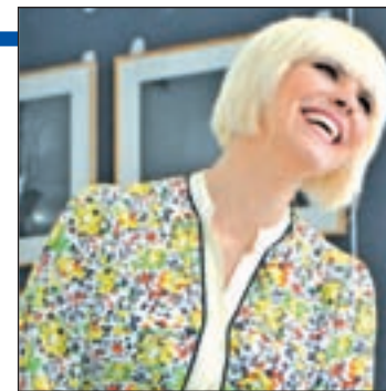
Pasión Vega, en Madrid

es la voz de Pasión Vega”, a lo que añade que “lo que realmente es tu estilo es tu forma de decir, tu forma de contar y tu forma de expresarte”.