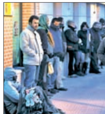
La inserción laboral, un reto

El acompañamiento brinda, entre otras actividades, tutorías individuales para diseñar un iti-