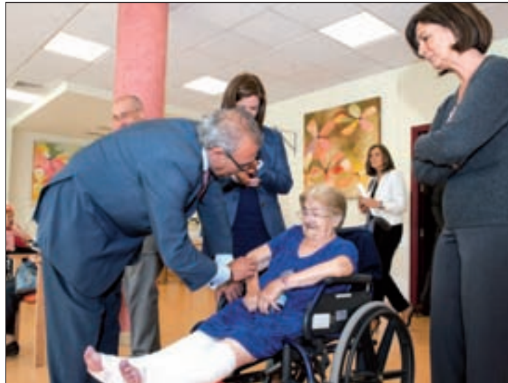
Fermosel presenta el portal en una acto en Pozuelo

Respecto al comunicado que el sindicato CCOO publicó el día anterior en el que se denunciaba la situación de pobreza en la que viven 155.000 mayores de la Comunidad de Madrid (14,7 por ciento de la población que supera los 65 años), el Consejero respondió que el Gobierno ha aumentado un 4,3 por ciento (53 millones de euros) la partida de este departamento y de los 1.303 millones dedicados a Servicios