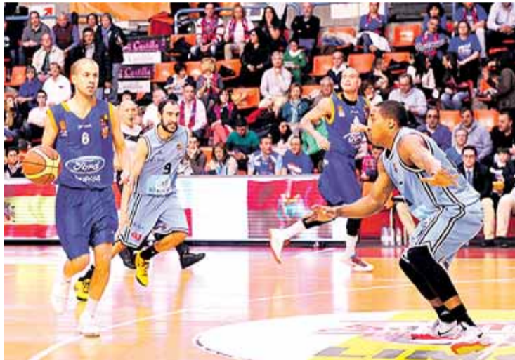
El encuentro se disputará el viernes 2 a las 21.00 horas. (María González).

La exhibición de los jugadores de Casadevall en el segundo encuentro de semifinales, que suponía el 2-0 en la serie, ha dolido mucho al conjunto gallego. Un Breogán Lugo que buscará recortar diferencias gracias al regreso de Michel Diouf, principal arma ofensiva esta temporada. Por su parte, el equipo burgalés descarta euforias y sólo piensa en el partido.