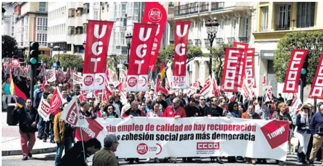
Cabeza de la manifestación del 1º de Mayo en la capital burgalesa.

1º DE MAYO 'SIN EMPLEO DE CALIDAD NO HAY RECUPERACIÓN', LEMA ESTE AÑO