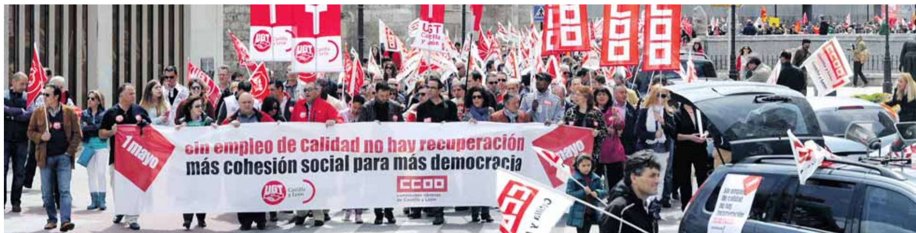
La manifestación del 1º de Mayo recorrió las principales calles del centro de la capital.

1 DE MAYO, DÍA INTERNACIONAL DEL TRABAJO EN UN CONTEXTO DE PARO Y DESEMPLEO, CCOO Y UGT NO CONSIDERAN QUE SE ESTÉ SALIENDO DE LA CRISIS