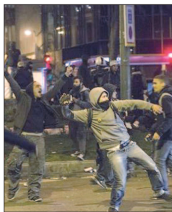
Disturbios del 22-M

que el Gobierno tiene intención de hacer frente con "firmeza, con la ley en la mano y con el Estado de Derecho". Según ha dicho, la Policía tiene "información" sobre estrategias para "provocar" a sus agentes y aventura que existe una táctica definida "de caza al policía".