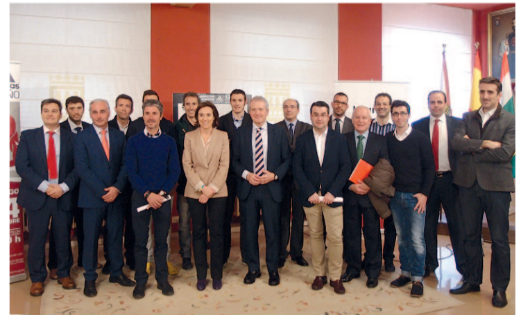
Presentación de la I Maratón 'Ciudad de Logroño'.

Se entregará una medalla conmemorativa de la carrera a todos los participantes que finalicen con éxito la prueba.