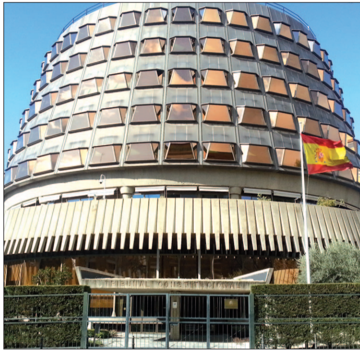
El TC estima parcialmente la impugnación del Gobierno

En síntesis, rechaza que el pueblo catalán sea "sujeto político soberano" aunque declara constitucionales las referencias del texto a su "derecho a decidir" como una aspiración política, pero desligado del derecho