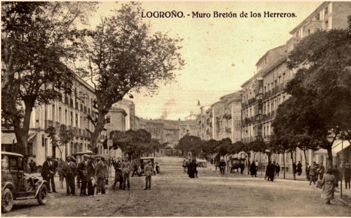
LOGROÑO. - Muro Bretón de los Herreros.