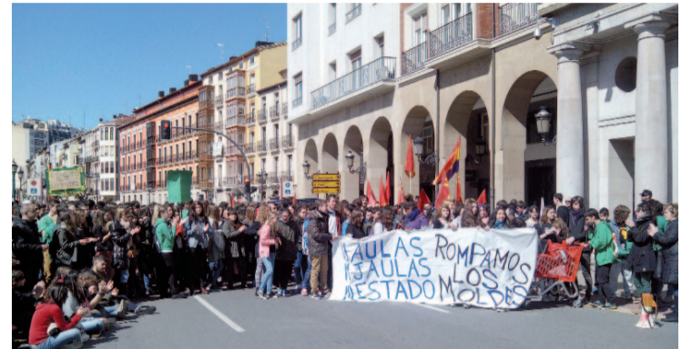
Un millar de estudiantes de enseñanzas medias y universitarias salen a la calle a protestar contra la Lomce Pág. 9