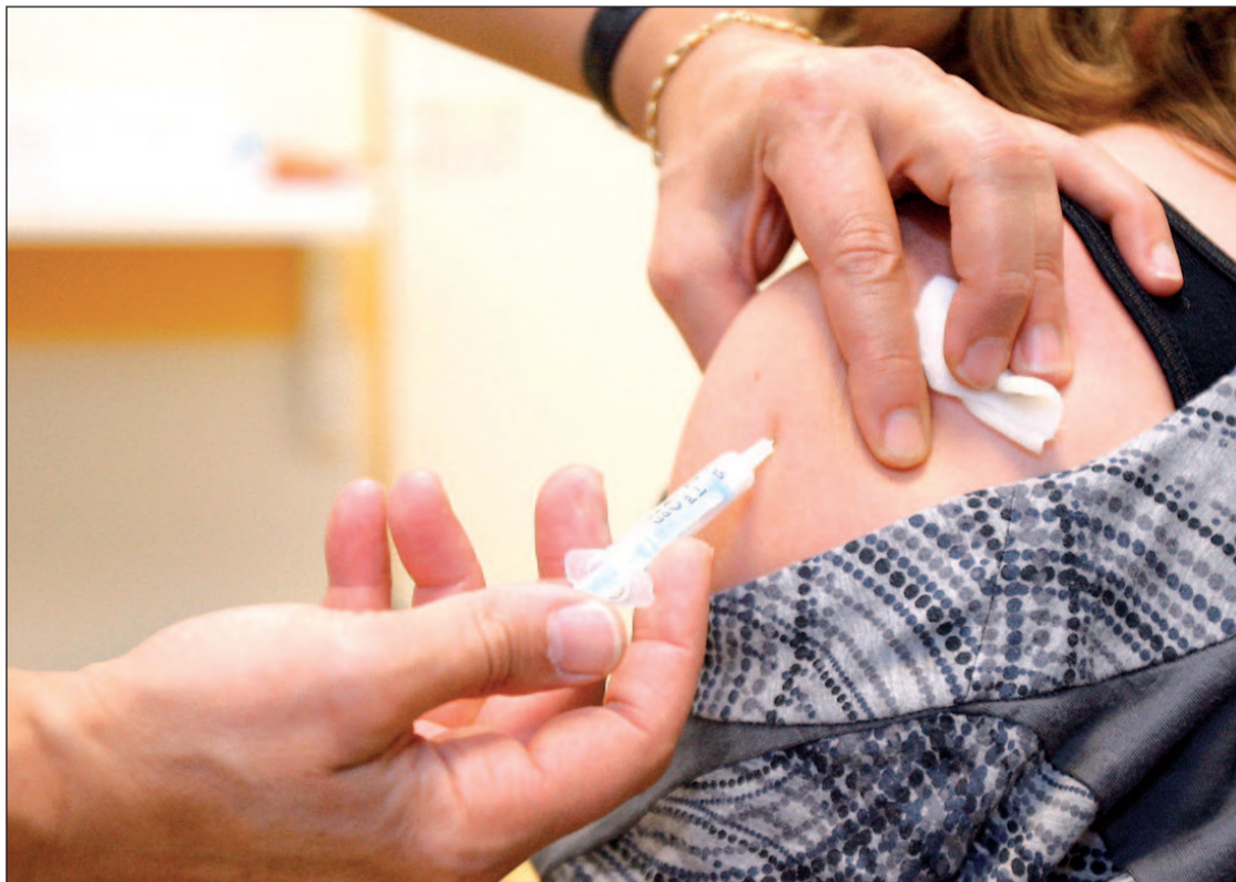
En la Comunidad de Madrid se vacunaba hasta el pasado 1 de enero

Este hecho, que no sucede con otras como la que previene el neumococo, ha provocado las críticas de la Asociación Española de Vacunología, de la Asociación Española de Pediatría y de la Sociedad Española de Medicina Preventiva, Salud Pública e Higiene, que consideran que “la vacunación frente a la varicela en la primera infancia, es decir, desde los 12 meses de edad, ha demostra-