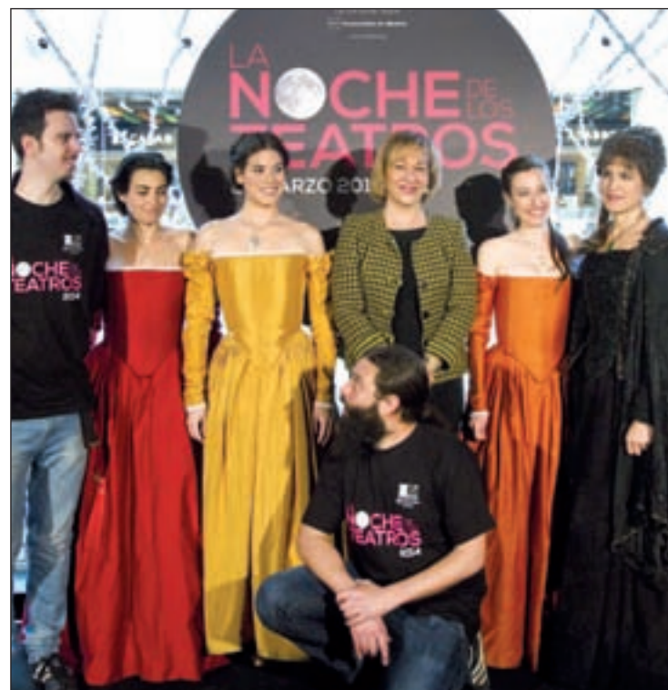
Presentación de la Noche de los Teatros

Las actividades en los espacios públicos y las plazas tendrán también un especial protagonismo en esta nueva edición con un duelo de esgrima a cargo de la compañía La Irremediable Escuela de Esgrima Ateneo de Madrid y Barrio de las Letras. Será en la Plaza de Santa Ana, a las 18 horas. Una hora antes, a las 17 horas, en la calle Fuencarral, cinco compañías