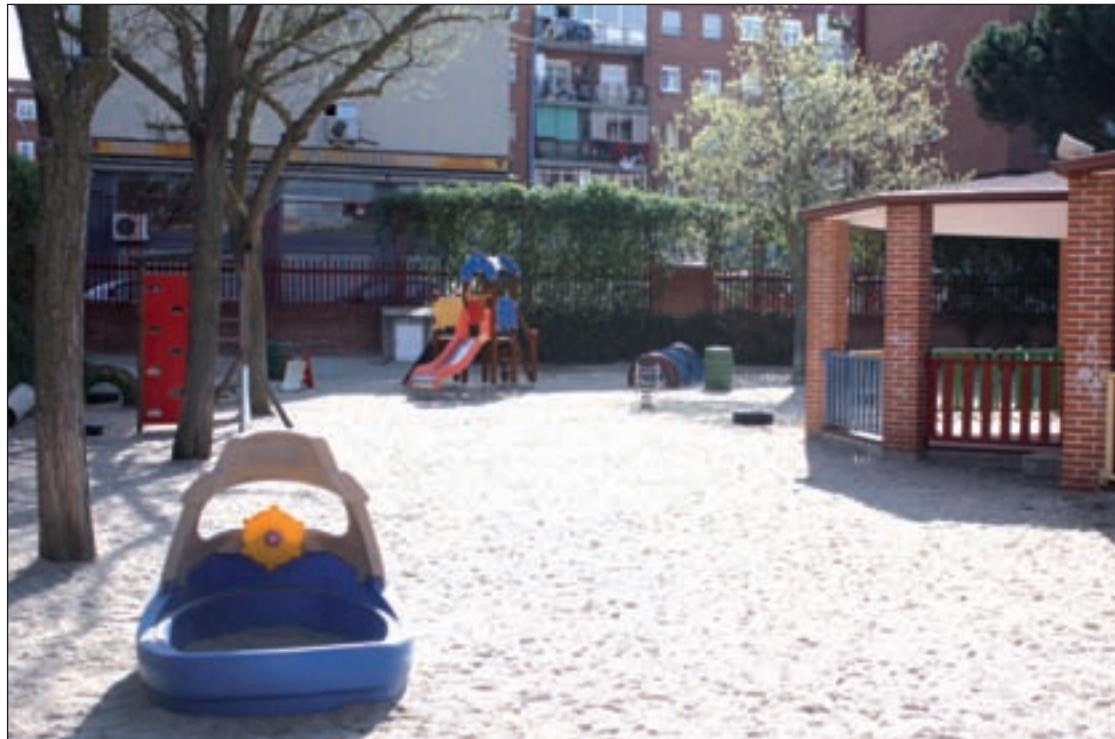
Escuela Infantil Lope de Vega GONZALO VIALÁS

Desde la Comunidad de Madrid alegan que “las familias mayoritariamente prefieren matricular a sus hijos en colegios de infantil y Primaria” y que “ha bajado mucho el número de niños escolarizados”. Miembros del equipo directivo de la escuela han asegura-