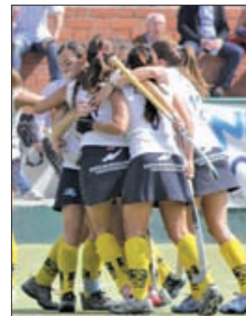
El Club de Campo, campeón

Esta tradición hace que el torneo que se disputará hasta este domingo en Madrid se presente como una buena oportunidad para seguir las evoluciones de jóvenes que, tal vez en un futuro próximo, puedan vivir de cerca el sueño olímpico. Los campos de la Comunidad, situados en el kilómetro 1,8 de la carretera que une Madrid con El Pardo, acogen desde el jueves el campeonato de España cadete autonómico, en el que se dan cita las mejores selecciones masculinas regionales. Como no podía ser de otra manera, Cataluña parte como favoritita, pero la selección madrileña espera