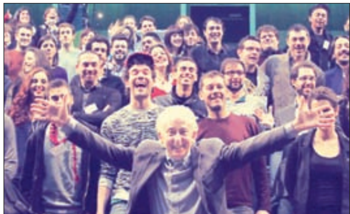
La última edición de Talent Madrid

TEATROS DEL CANAL A partir del 23 de abril