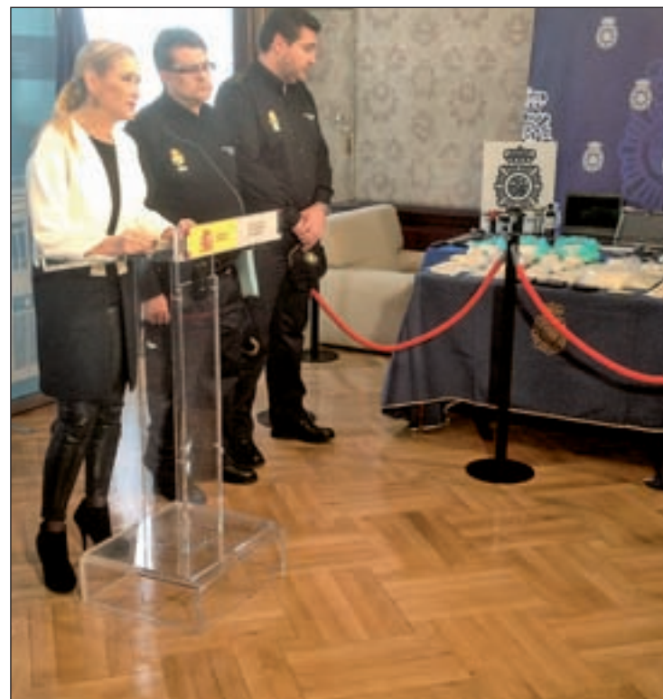
La delegada del Gobierno junto a la Policía Nacional

Tras el registro de 24 viviendas, en Madrid, Murcia y Barcelona, un trastero y dos bares abiertos al público, que se empleaban como lugar de entrega y compra de la sustancia, han sido incautados ocho kilos de la misma, 4,7 de ellos en Madrid, 15.000 euros en efectivo, varias armas y diferentes útiles para que los clientes pudiesen consumir la droga. De los 42 detenidos, de origen español, filipino y africano, sólo 22 se encuentran en prisión acusados de delito contra la salud pública, entre otros. Todos empleaban una empresa de compra venta de vehícu-