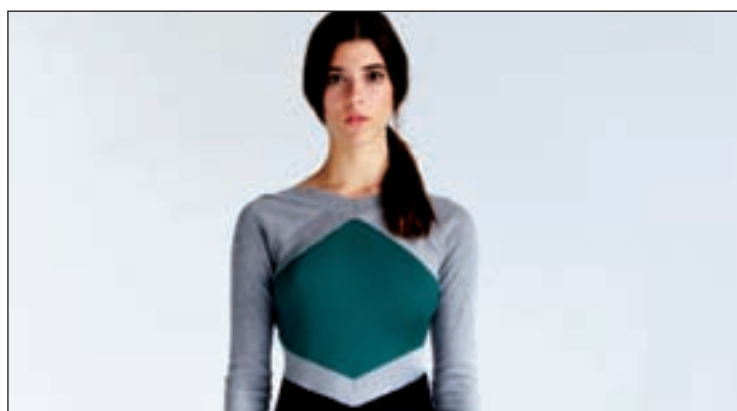
Colección de la firma Lifegist

'STREET STYLE' Los diseños se dirigen a una mujer que quiere vestir cómoda