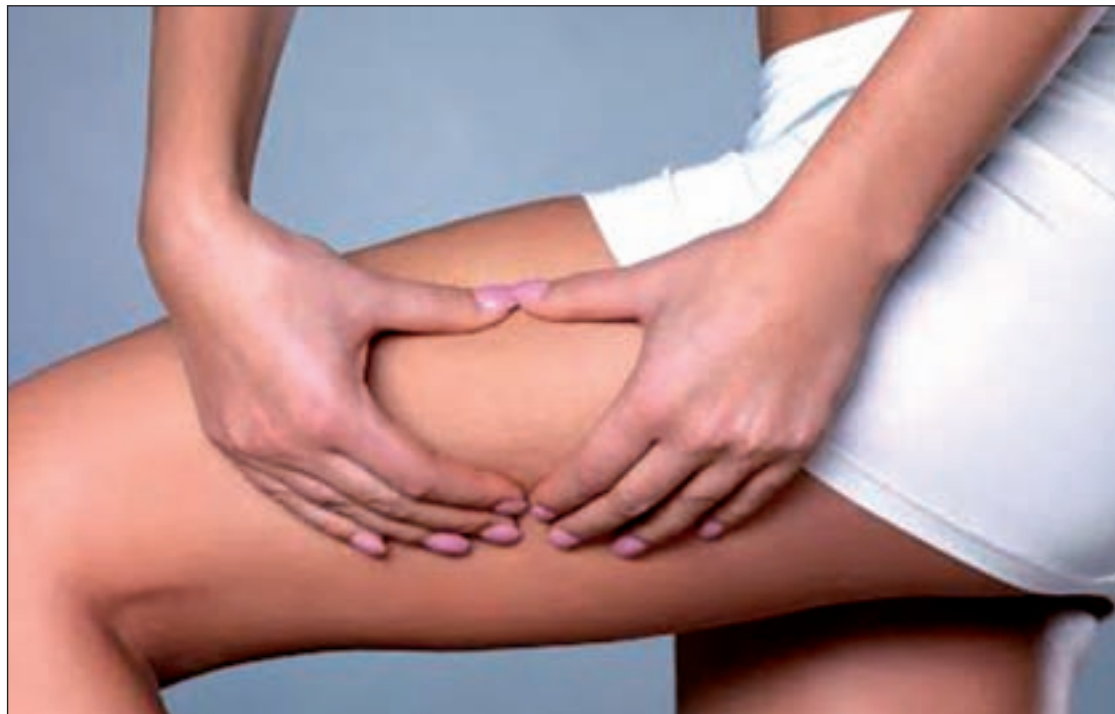
Celulitis localizada en la zona lateral de los muslos

En cuanto a las verduras, el brócoli, la zanahoria, el aguacate o las espinacas son buenos alia-