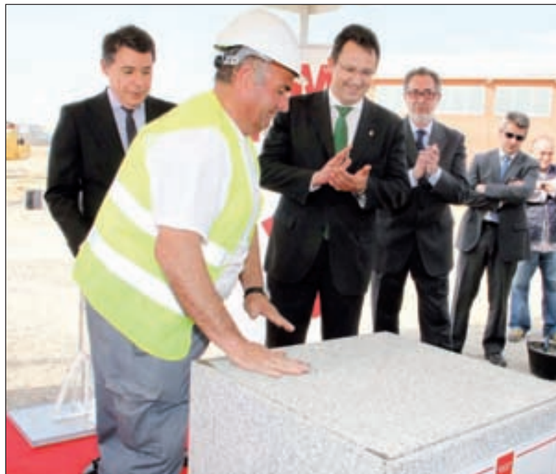
Presidente y Alcalde colocan la primera piedra del centro

10.000 habitantes que, en su mayoría, son parejas jóvenes y familias con niños que necesitarán ofertas educativas en un futuro cercano. El instituto se suma a los centros que ya hay en el barrio, y es importante que los padres ten-