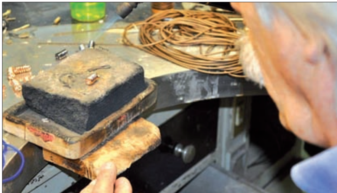
Uno de los joyeros en el taller donde se fabrican las pulseras 'Cayomalayo'