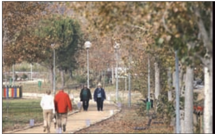
En mayo predominará el polen de las gramíneas

Este mes finaliza una época de arizónicas, muy frecuentes en los setos de urbanizaciones, parques