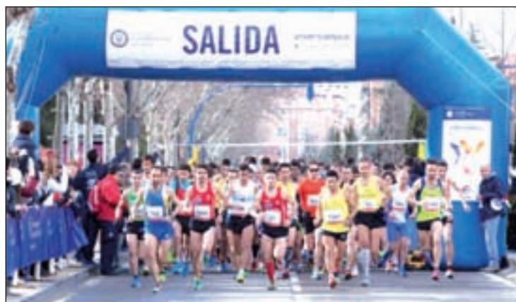
Carrera Intercampus 2013

El tiempo máximo es de 75 minutos para ambas pruebas, y con un límite de paso en el kilómetro 5 de 35 minutos para la carrera oficial. Por razones de seguridad, todos los participantes que no consigan pasar por este control en el tiempo límite indicado deberán entregar su dorsal a la organiza-