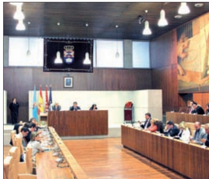
Pleno en el que se rechazaron presupuestos