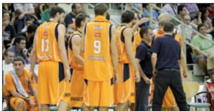
El Fuenlabrada en su último partido contra el Leganés

Además, esta vez cuentan con el respaldo de un nuevo patrocinador: la empresa Eurest, "que apuesta como nosotros por la juventud y el deporte", concluyeron.