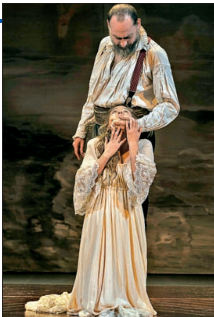
Otelo, en un momento de la obra