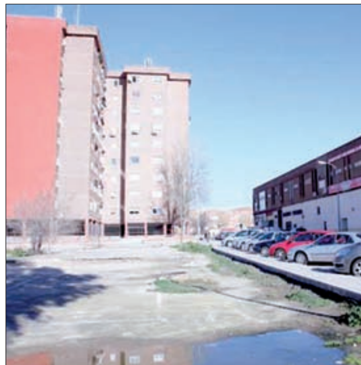
Paseo Estoril en Fuenlabrada

La última de las mejoras se realizará en el paseo Estoril, donde también se reorganizará el tráfico, además de modificar las aceras de los interbloques. "En este punto mejoraremos los espacios