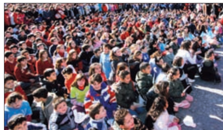
Niños de Fuenlabrada durante un acto