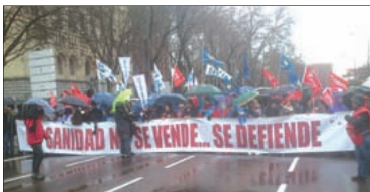
La manifestación del domingo estuvo pasada por agua