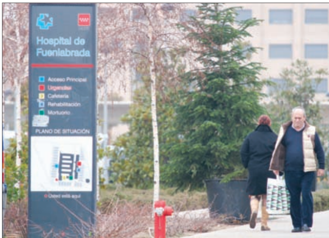
Hospital de Fuenlabrada GENTE

La misma opinión comparte el consejero de Sanidad de la Co-