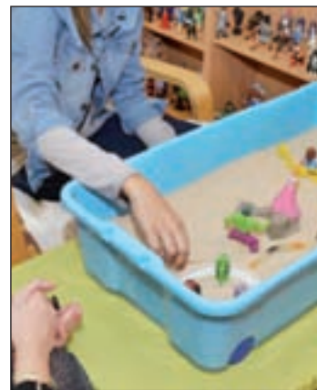
Taller sobre violencia

El foro, que tendrá lugar de 11 a 14 horas en las instalaciones del Hotel de Asociaciones 'Los Arcos' (Plaza de Poniente, 5 Bis), servirá como oportunidad para compar-