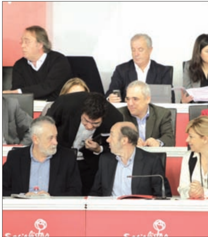
Un momento del Comité Federal del PSOE

Las primarias abiertas para elegir al candidato socialista a la Presidencia del Gobierno tendrán lu-