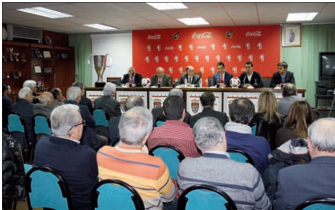
Imagen del acto de presentación

Después de varias semanas de parón, la División de Honor de rugby retoma su actividad este fin de semana y lo hace con citas de altura para los dos representantes madrileños. El Rugby Atlético de Madrid y el Complutense Cisneros se verán las caras con los dos primeros clasificados, el Bathco Rugby y el VRAC Quesos Entrepinares, que están empatados en lo más alto de la tabla. Los rojiblancos reciben a un equipo santanderino que está sorprendiendo a propios y extraños tras su ascenso desde la segunda categoría. Por su parte, el Complutense visita el campo de uno de los clubes con más solera del rugby español.