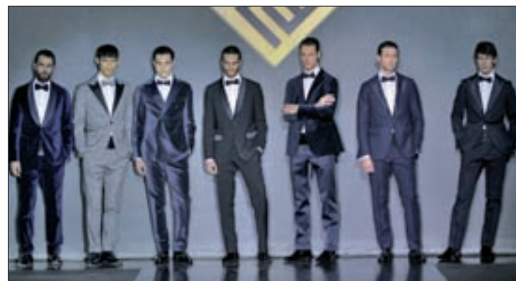
El final del desfile de Emidio Tucci

de, que marcan la luz de tendencia en la colección. Texturas con estructura de tejidos de primera calidad en lana 120S, lana cachemir, lana cotta en la pañería, lana con algodones, algodones en sastrería, tejidos confort de lana y poliamida. El desfile cerraba con una colección muy elegante de trajes de fiesta.