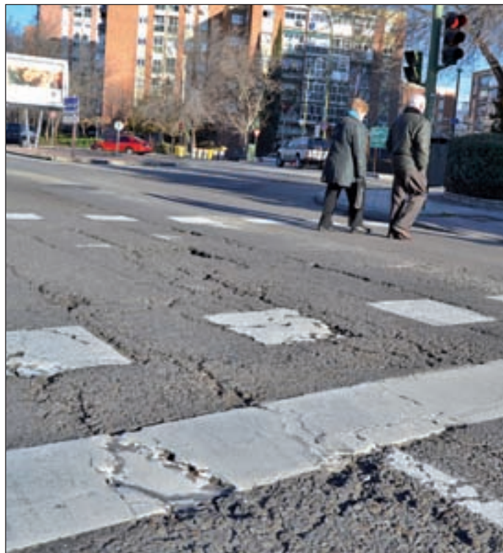
Un tramo de la Avenida de los Poblados

Y en el horizonte de tres años se acometerá también la rehabilitación de toda la calzada de la avenida de Rafaela Ibarra, en Usera, y de la Vía Lusitana, en Carabanchel. Además, se reconstrui-