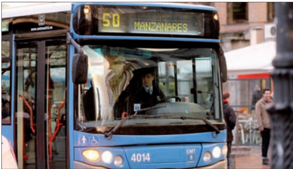
Hasta ahora, las rutas comenzaban entre las cinco y las seis y media de la mañana