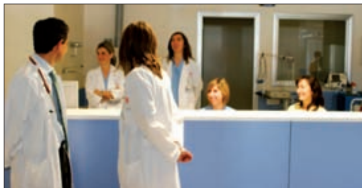
El personal se refuerza por el aumento de casos

por cada 100.000 habitantes. De esta manera, en la Comunidad se supera el umbral epidemiológico de esta dolencia, cifrado en 43 casos por cada 100.000 habitantes. El pasado miércoles se conocía la segunda víctima mortal que la gripe se ha cobrado en la región este 2014. Se trata de un hombre