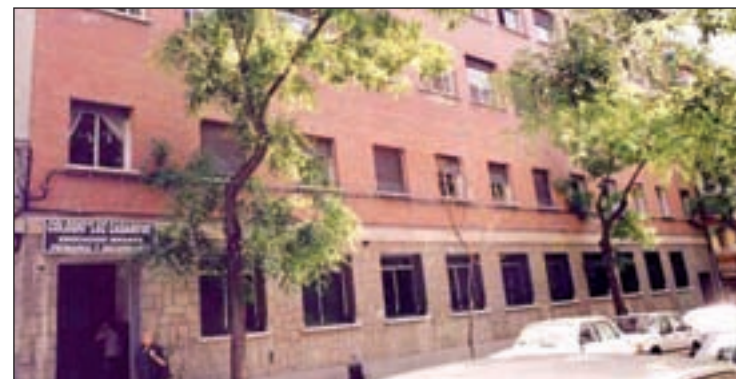
La entrada principal del colegio Luz Casanova

so la situación actual de la Escuela Infantil Roger de Flor "que padece y soporta los problemas especialmente en los momentos de entrada y salida de los niños de sus instalaciones". "Es algo positivo, pero esperemos que no se desvista un santo, para vestir otro", ironizó el edil.