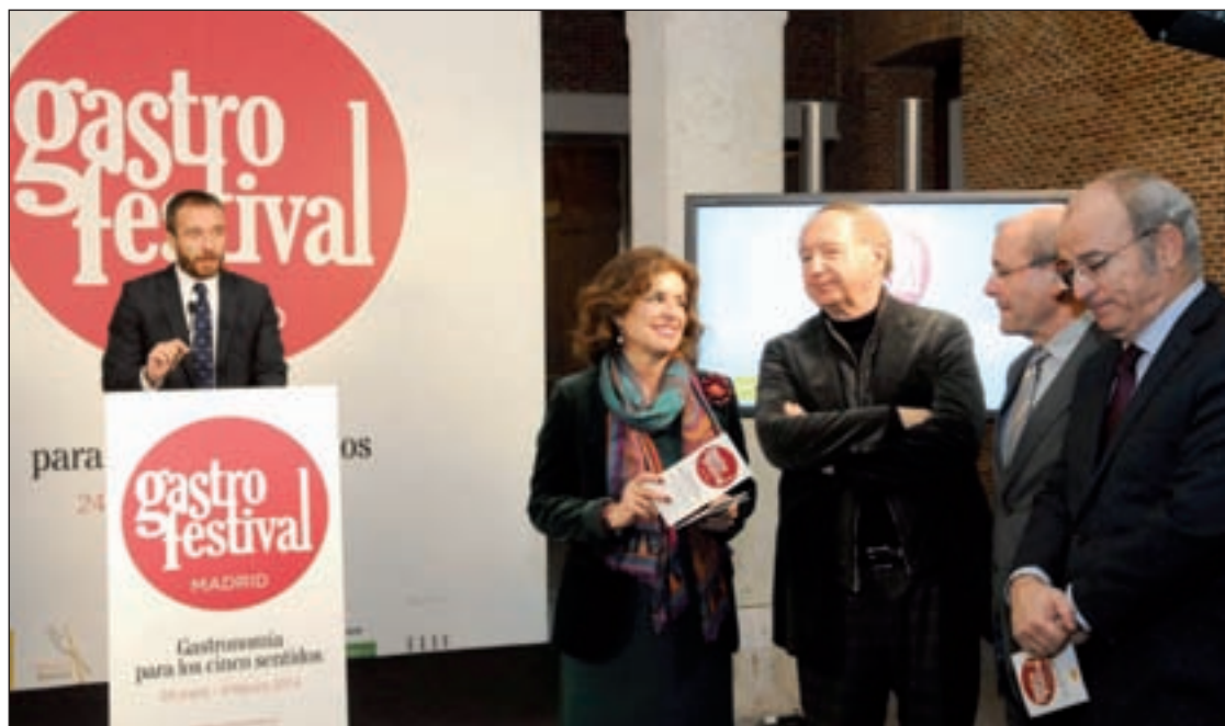
La alcaldesa de Madrid, Ana Botella, en la presentación de Gastrofestival 2014

También será novedad en esta edición el taller 'Bocados decimonónicos', en el Museo Cerralbo. El cocinero Íñigo Carretero, replicará algunos de los platos más célebres del siglo XIX, partiendo de los menús y las cartas conserva-