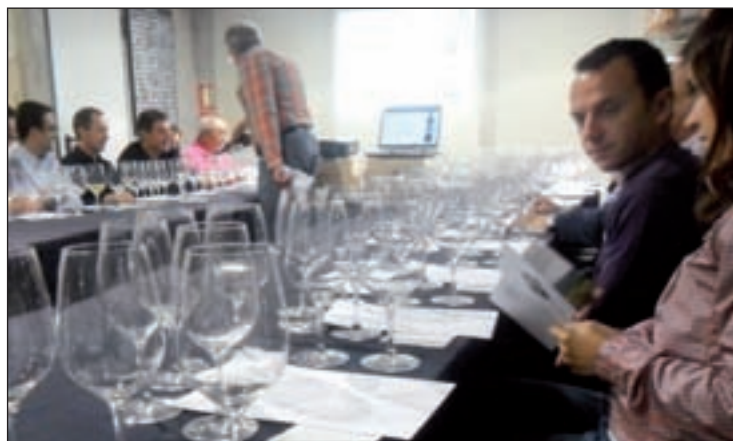
Asistentes a una cata de vinos

Clap&Wine y la galería de arte Dionis Bennassar realizarán una cata comentada de los vinos de la colección particular del Monasterio Cisterciense de San Pedro de Cardena. El evento se celebrará el sábado 25 de enero en la galería de arte Dionis Bennassar, situada a la altura del número 15 de la calle de San Lorenzo en Madrid. Los asistentes podrán acudir, previa confirmación (Tfno. 636898109), en dos pases: uno a las 12 de la mañana y otro a las 6 de la tarde. La selección de caldos será pro-