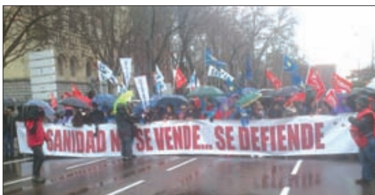
La manifestación del domingo estuvo pasada por agua