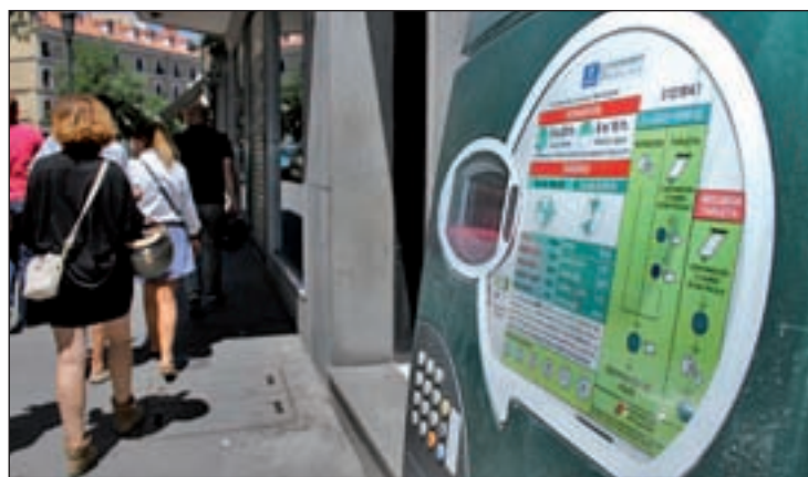
Los parquímetros pierden a sus ‘escultas’