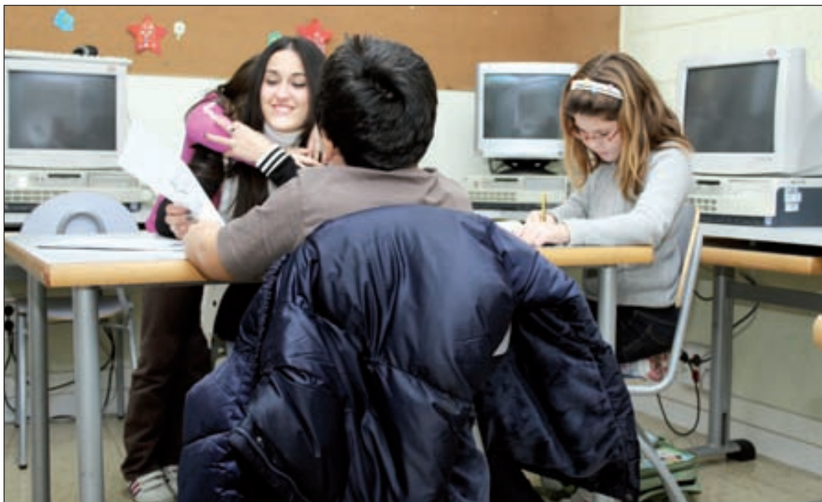
A primera hora de la tarde, los niños del Centro de Día se ocupan de los deberes escolares