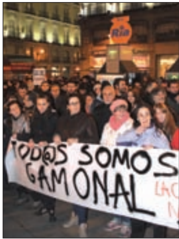
Protestas en el centro R. HERRERO