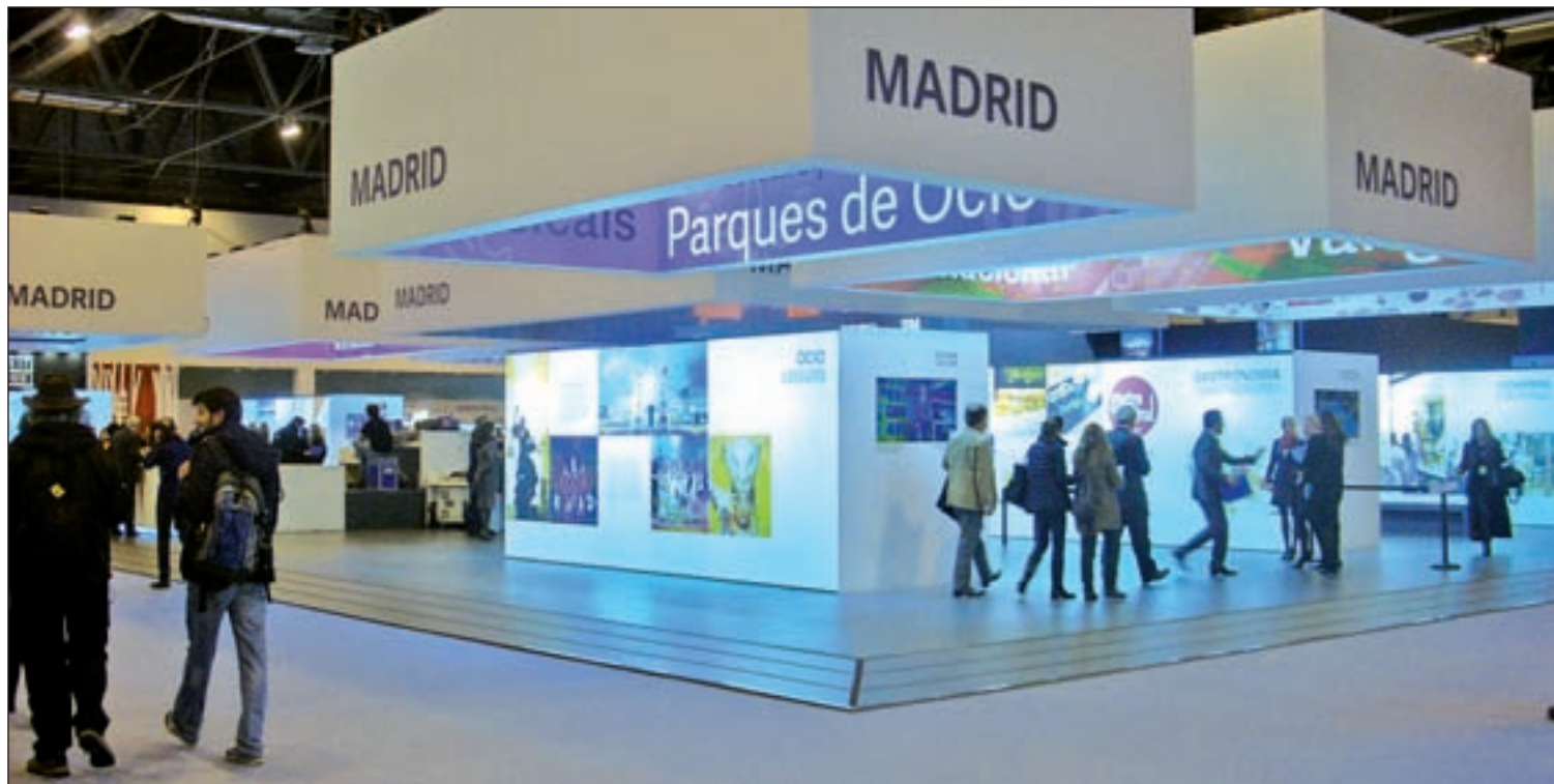
Ifema acoge la Feria Internacional de Turismo hasta el 26 de enero. En la imagen, el stand de la Comunidad de Madrid ANTONIO MARTÍNEZ