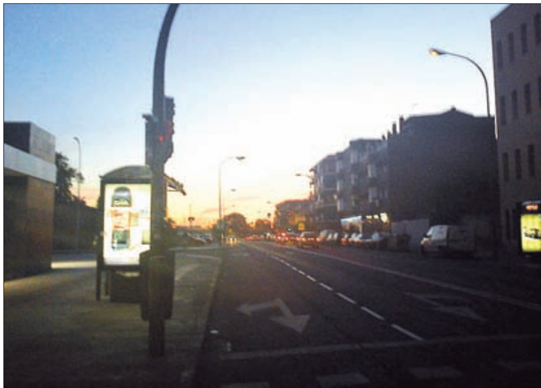
La calle de Domingo Párraga, a la altura del acceso al intercambiador de Villaverde Alto

"Además de la reducción de puntos de luz llevada a cabo el pasado año, se suman las modificaciones del alumbrado existente y la actual sustitución de lám-