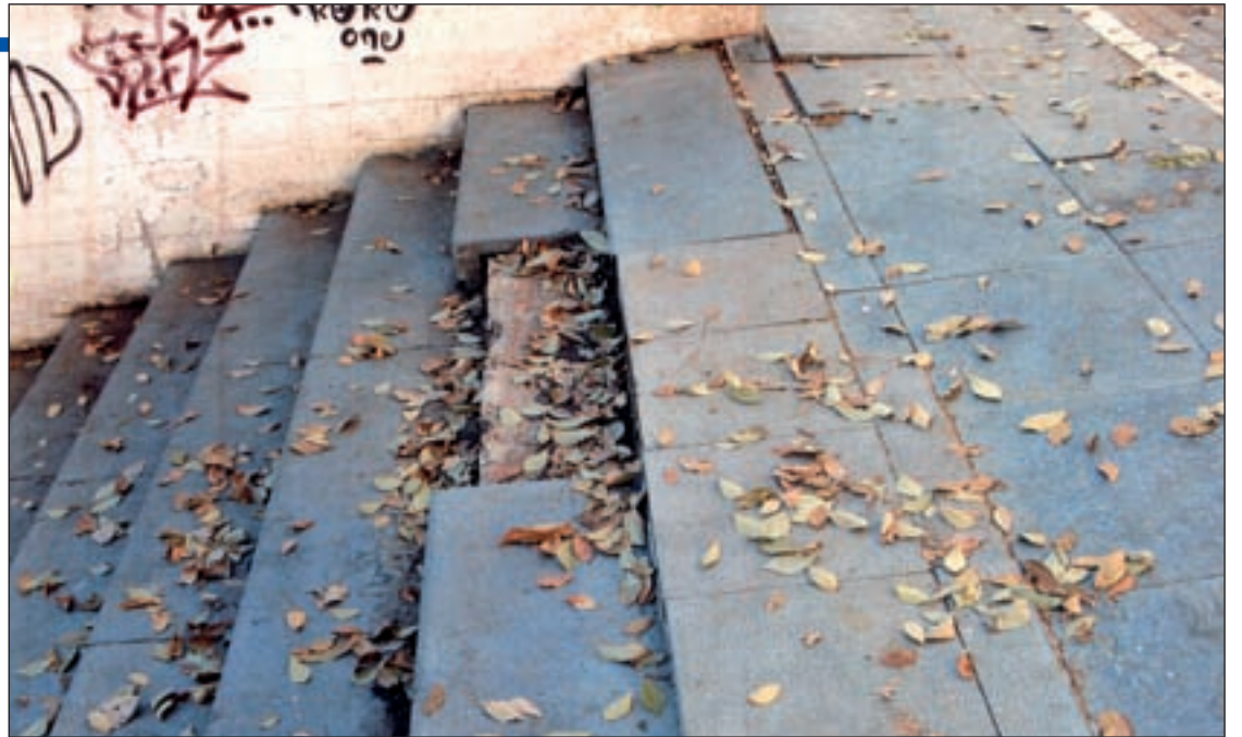
Estado de una de las escaleras del barrio del distrito de Latina