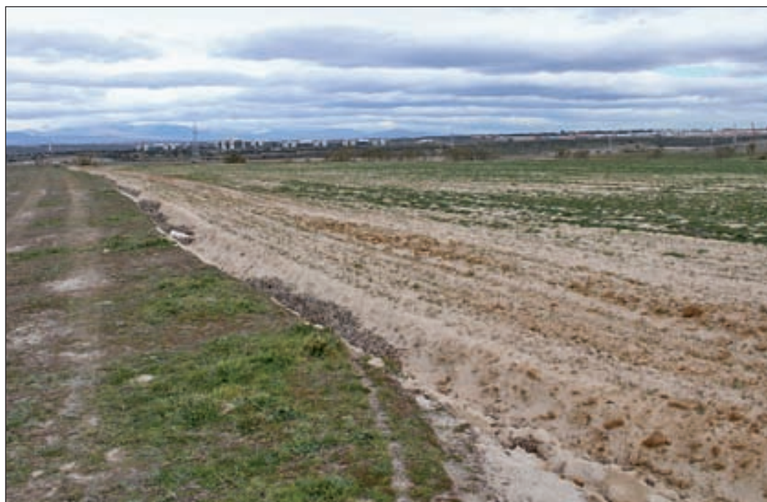
El terreno destinado a Eurovegas

Desde 2003 Metrosur conecta entre sí a cinco municipios: Alcorcón, Leganés, Móstoles, Getafe y Fuenlabrada y a estos con la capital, a través de la línea 10.