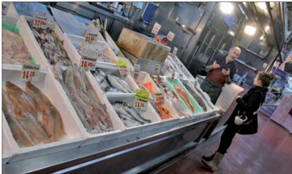
El precio del pescado es más bajo con respecto a hace tres años

En las charcuterías, los ibéricos han cedido el primer puesto al jamón cocido y al queso. “Si tenemos en cuenta las ventas, se podría decir que estas fiestas los madrileños van a comer sandwiches mixtos”, bromea uno de los ven-