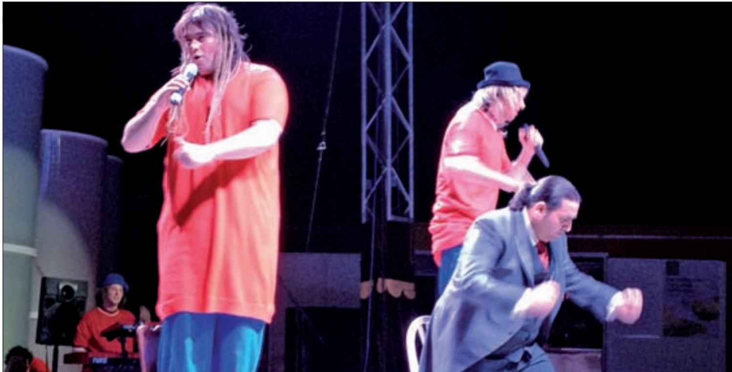
Un momento del espectáculo