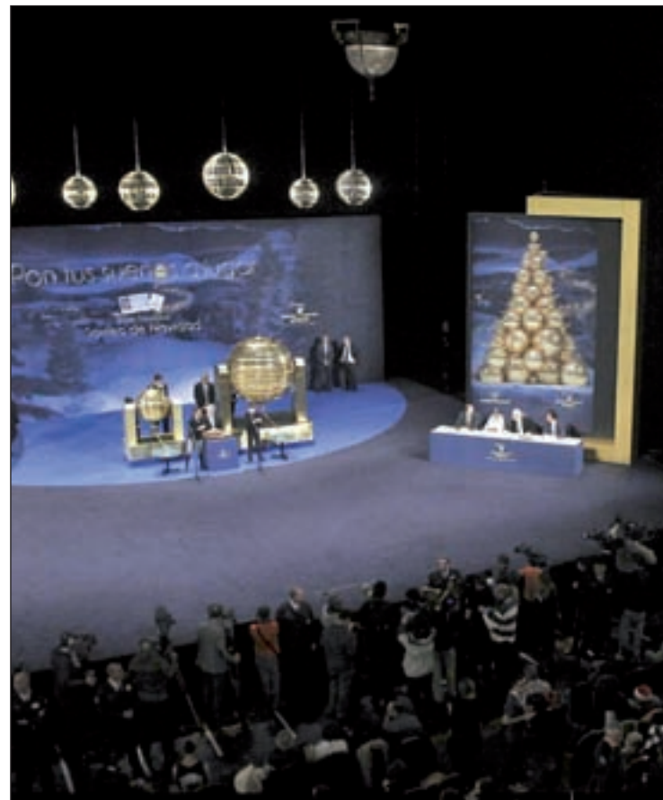
Escenario del Teatro Real donde tuvo lugar el Sorteo de Navidad