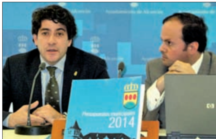
Presentación presupuestos 2014

siendo la primera vez que se incrementan en la legislatura, con un 8,48 por ciento en el capítulo de ingresos y un 7,65 por ciento en gastos. A este respecto, Pérez afirma que son unos presupuestos muy austeros y que garantizan las inversiones, ya que en 2014 se incrementan un 209,05 por ciento, es decir se "triplican" con un montante total de 35,1 millones de euros para generar inversión y atracción de empleo. "Se centra en el cuidado y mantenimiento de la ciudad, de los colegios, de los barrios, de las instalaciones deportivas y de las instancias que más usan los vecinos", explicó. A todo ello habría que añadir la construcción de infraestructuras urbanas y desarrollos clave, como la finalización del centro Hermanos Laguna, la recuperación de