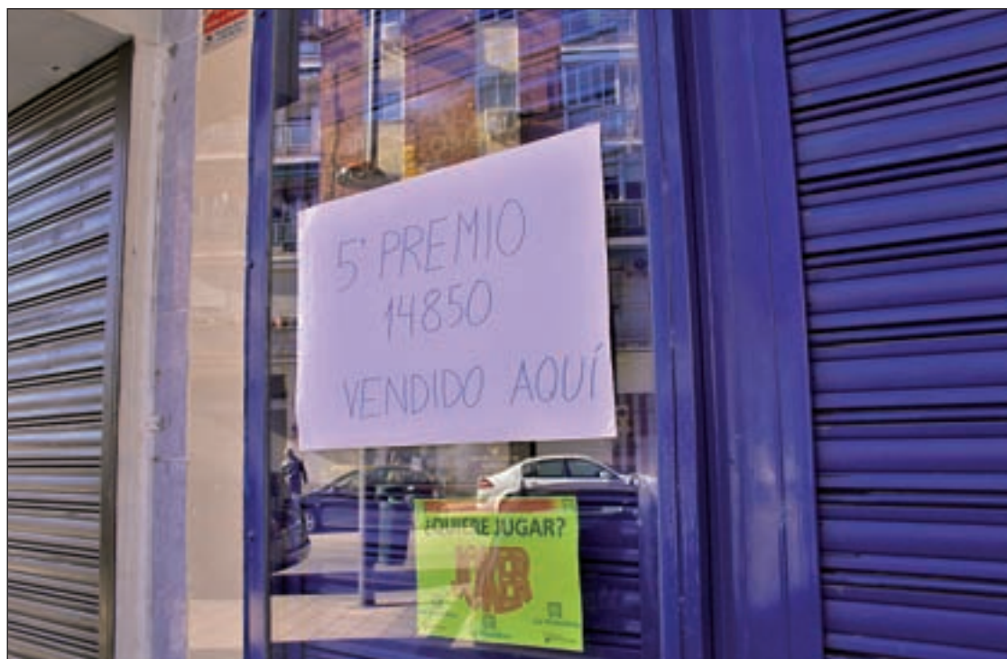
Administración de Lotería de Parla, que ha vendido parte de un quinto premio

pio del Noroeste, y la número 1, situada en la calle Manzanares de Alcobendas, donde se vendió parte del 81.156, que hacía su aparición sobre las 11:30 horas. A pesar de ello, ninguna de estas dos administraciones abrió sus puertas durante la mañana para celebrar el premio.