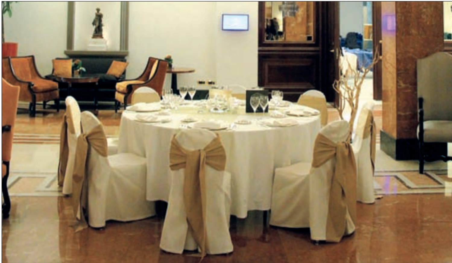
Mesa montada para Navidad en el hotel Intercontinental de Madrid