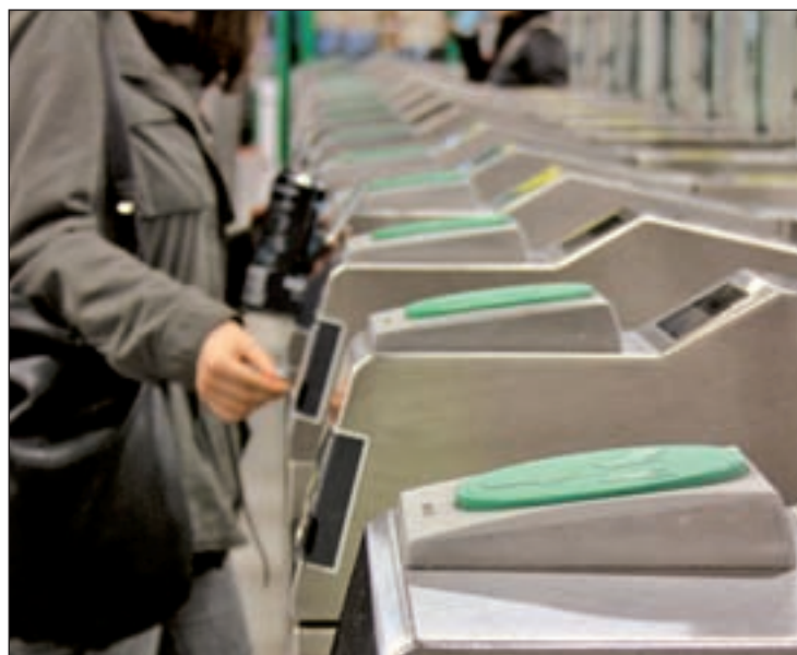
El transporte público sólo subirá el IPC

Hace escasos días, el ministro de Industria, Energía y Turismo, José Manuel Soria, cifró en torno al 2% el repunte energético, aunque ahora, con la guerra abierta entre las eléctricas y el Gobierno,