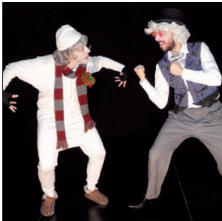
'Scrooge. Un cuento de Navidad'

'The good, the bad and the sheep' es una de las apuestas del Teatro Cofidis. Un espectáculo en inglés