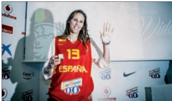
La jugadora posa con la camiseta de la selección FEB

Considerada la mejor jugadora española de todos los tiempos, Amaya Valdemoro anunció el pasado día 17 que cuelga las botas. La internacional española reconoció que “los dos últimos años han sido un auténtico calvario, todos los días con algún dolor y pensando en dejarlo”, al mismo tiempo que demostraba su amor por el que considera su club de toda la vida, la selección: “Una de las cosas de las que me siento más privilegiada es de haber vestido la camiseta de España 258 veces. Se