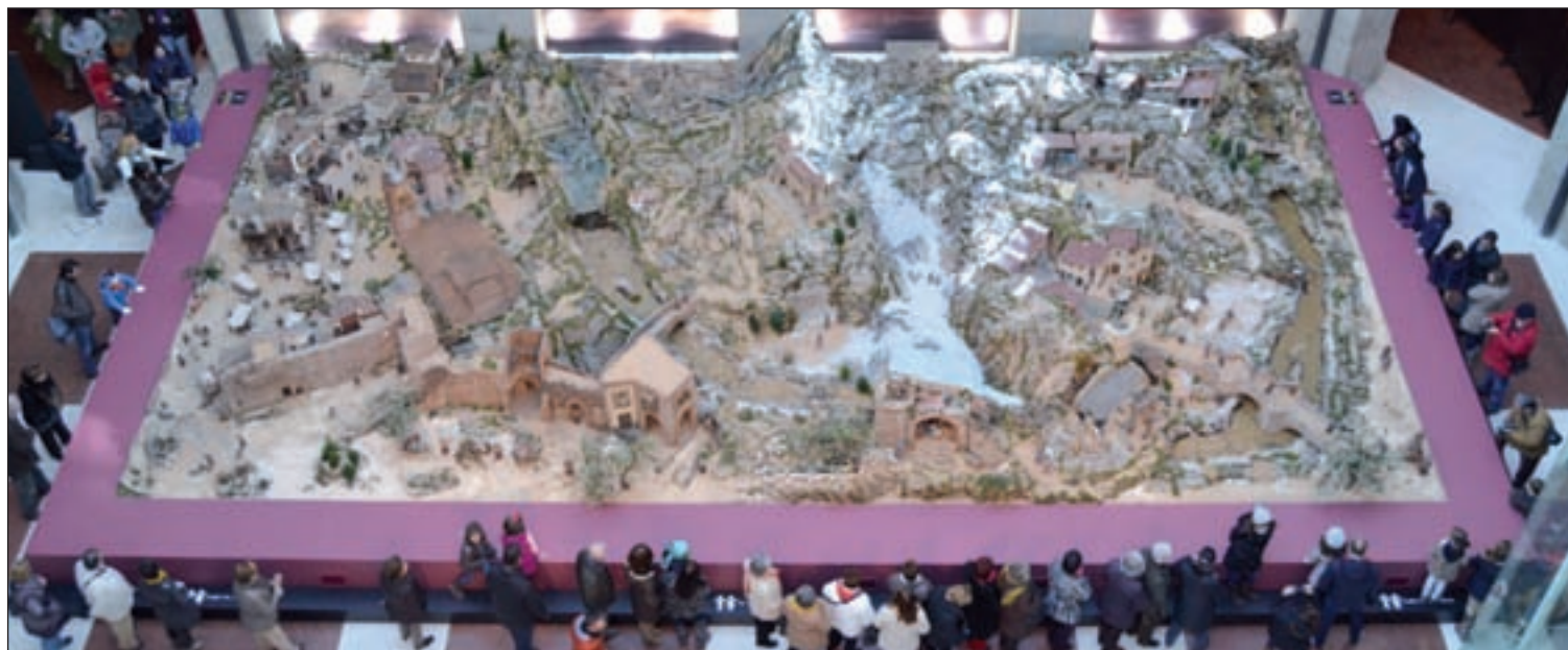
Panorámica del belén de la Real Casa de Correos

El nacimiento se puede visitar hasta el 6 de enero de 10 a 21 ho-