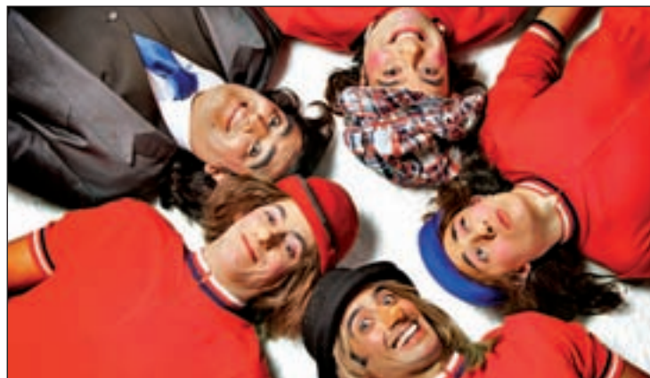
LOS GABYTO s llevan años en el mundo del espectáculo perpetuando la tradición de la farándula, pero con una mezcla especial, ofreciendo los antiguos éxitos familiares a modo rock, junto con canciones propias.