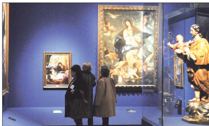
Exposición en CentroCentro, en Plaza de Cibeles, 1

Se trata en total de un conjunto de 63 piezas entre las que se pueden admirar la 'Virgen con el Ni-