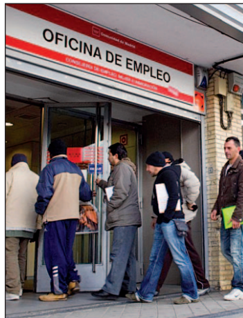
Oficina de Empleo GENTE

En industria, construcción y servicios se produjeron las contrataciones que han hecho que la cifra de desempleo disminuya y, por niveles de estudios, la mayor bajada del paro se experimentó