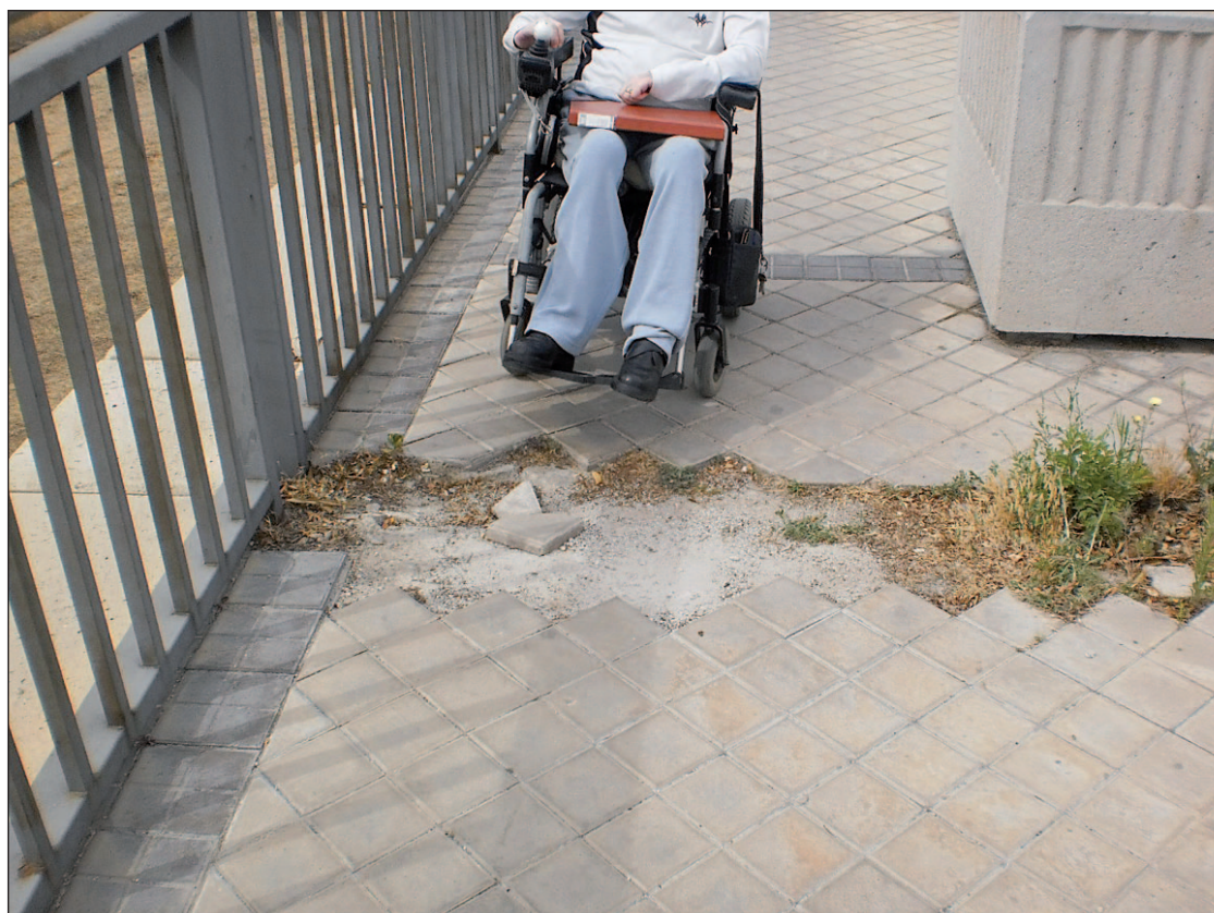
Uno de los múltiples obstáculos existentes en la Gran Vía de Villaverde