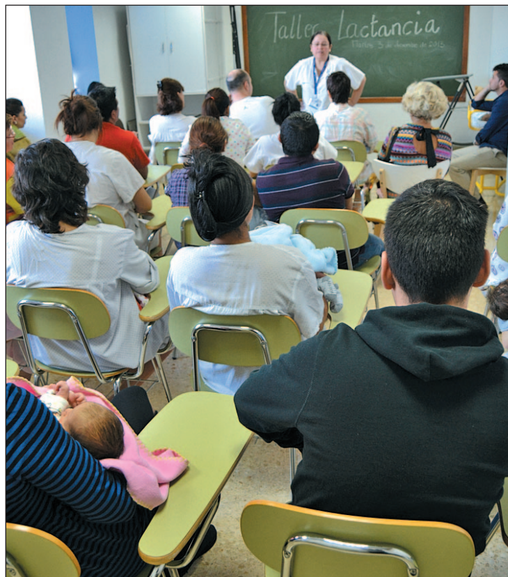
Un momento del taller de lactancia

La doctora hace una valoración positiva de los datos del sondeo, pero asegura que hay que tratar de reducir aún más el porcentaje de madres que no han podido darles el pecho a sus hijos.