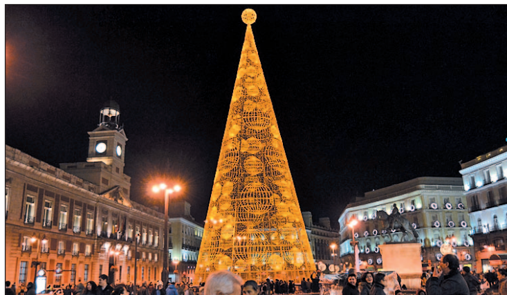
Árbol dorado en la Puerta del Sol

El horario será de 18 a 22 horas de domingo a miércoles. Los jueves, viernes, sábados y vísperas se prolongará hasta las 23 ho-