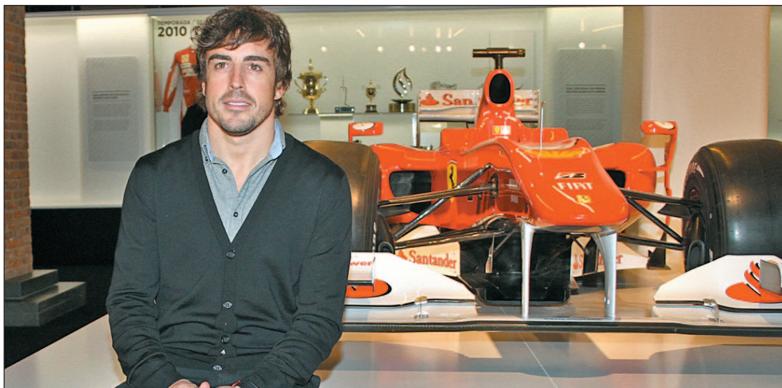
El piloto posa con el monoplaza de Ferrari con el que compitió en la temporada 2010