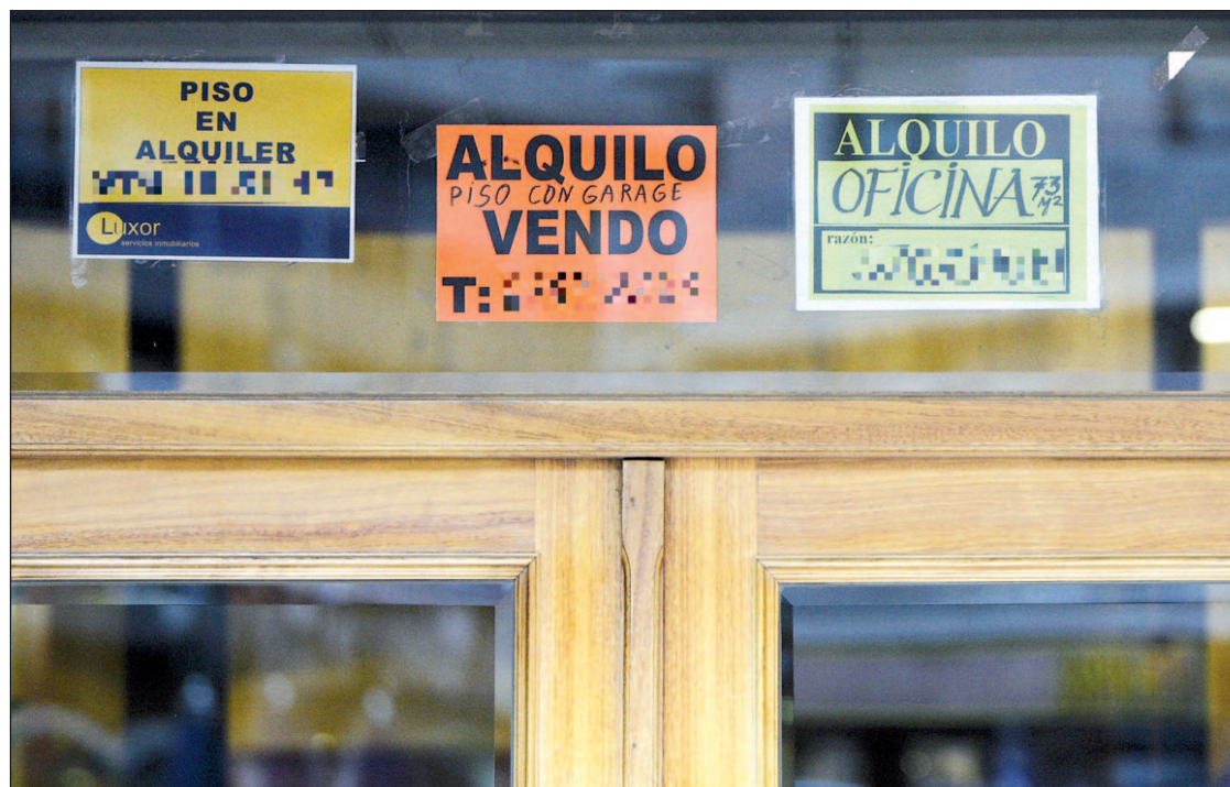
El alquiler supone el 17% del mercado inmobiliario en España, frente al 38% de media de la UE

Podrán beneficiarse de los subsidios al alquiler los mayores de edad con un límite de ingresos inferior a tres veces el Indicador Público de Renta de Efectos Múltiples (IPREM), si bien el importe será "modulable" en función del