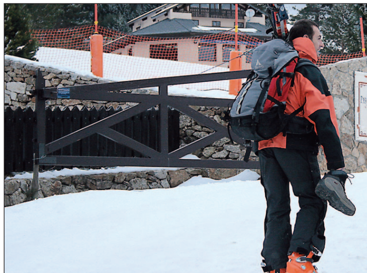
Puerto de Navacerrada

Otro de los planes atractivos para los madrileños en este puente de diciembre son las rutas que propone el Parque Nacional de la Sierra de Guadarrama. Un paraje