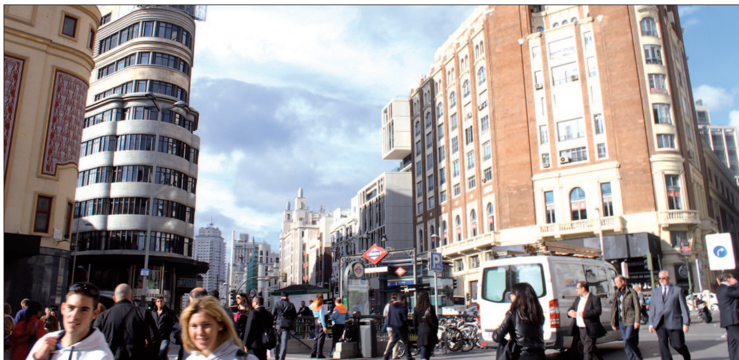
La almendra central se llena de turistas en estas fechas