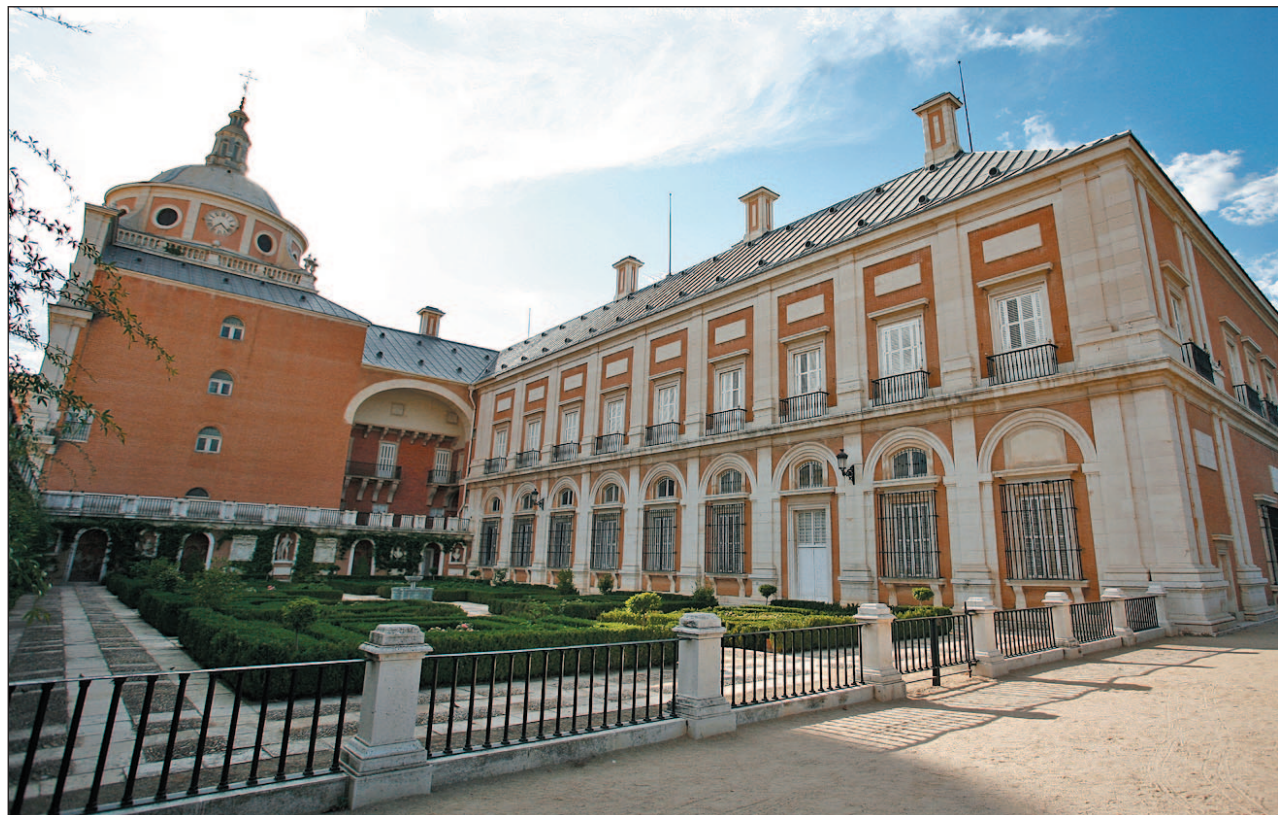
A la izquierda, el Palacio Real de Aranjuez. A la derecha, una de las visitas guiadas por las corralas de Madrid