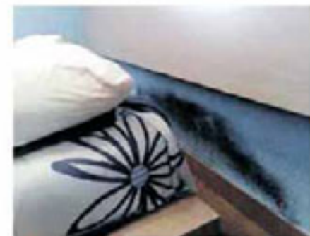
Problemas de humedades por capilaridad