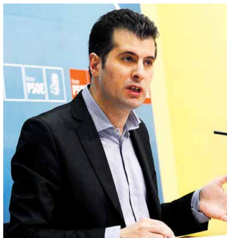
Luis Tudanca, diputado nacional y secretario general del PSOE de Burgos.

Asimismo, garantizó que "no hay ni habrá más subidas de impuestos", y que el próximo año verán la luz algunas reducciones fiscales, como las contempladas en la Ley de Emprendedores.