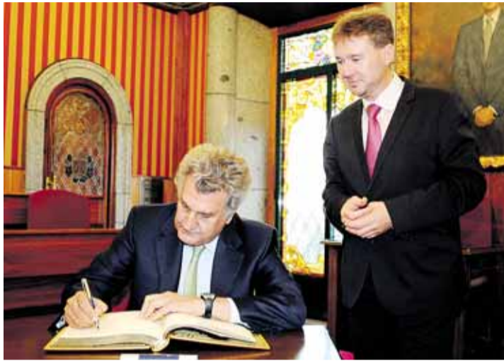
Jesús Posada, durante su visita al Ayuntamiento de Burgos.

En relación al MEH, el responsable del Congreso declaró que se "ha dado un impulso muy importante y una enorme proyección de futuro a la capital", al tiempo que mostró su sorpresa por el número de visitas que ha recibido desde su apertura. Durante su visita, García destacó que en este tiempo alrededor de 800.000 personas ya conocen los entresijos del MEH, un espacio que han visitado figuras del mundo de la política, la cultura, el deporte y las artes.