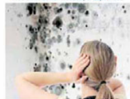
Problemas de humedades por condensación

MÁS INFORMACIÓN EN EL TLF. GRATUITO 900 809 939 www.acuasec.com