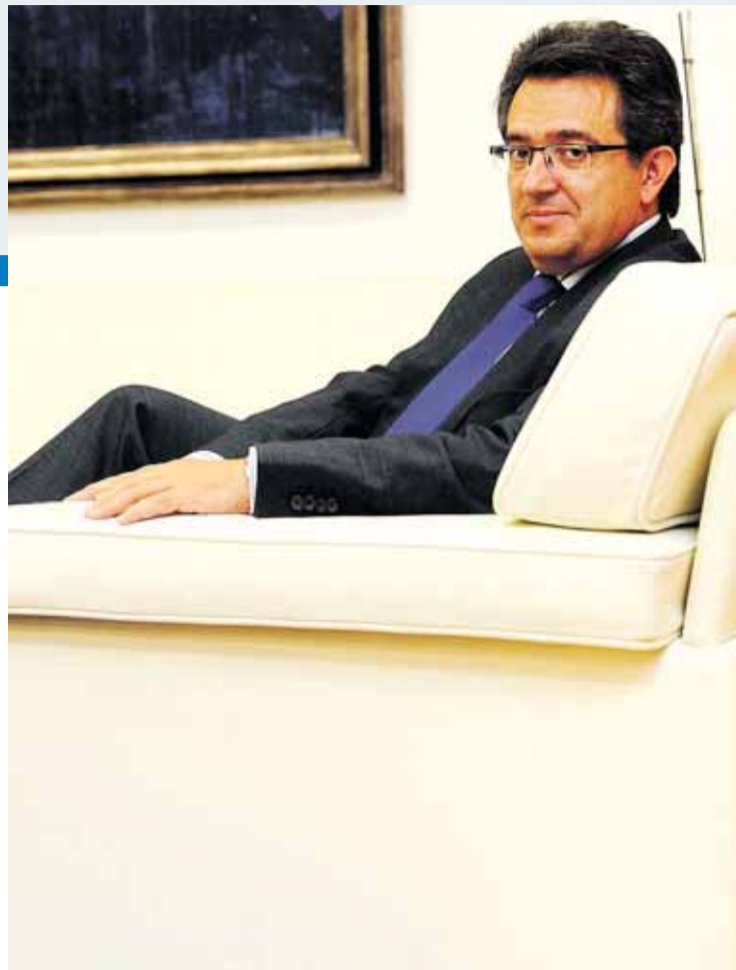
El rector espera que en los próximos años la universidad siga creciendo.

“Creo que es coherente que según vayan mejorando los ingresos de la Junta se reflejen aquí”