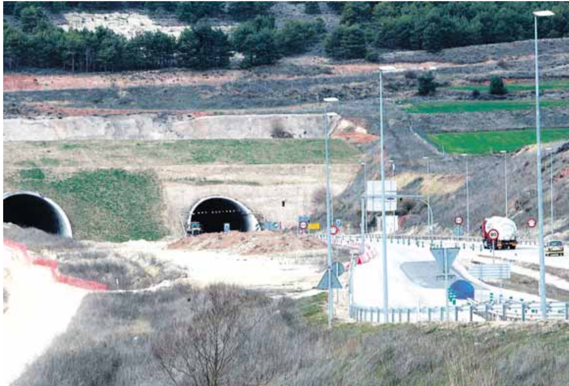
El alcalde quiere concentrar el esfuerzo inversor en el tramo de la circunvalación más avanzado.

En relación con la partida destinada a las obras de la circunvalación -10,6 millones para el tramo norte, de Quintanadueñas a Villatoro, y 8,4 para el tramo de Villalbilla a Quintanadueñas-, y puesto que la ronda norte está ejecutada en un 70% y la ronda noroeste únicamente en un 15-18%, el alcalde, como hemos señalado, se mostró partidario de que "la inversión que se vaya a ejecutar se concentre en el tramo de la circunvalación que está más avanzado". Ade-