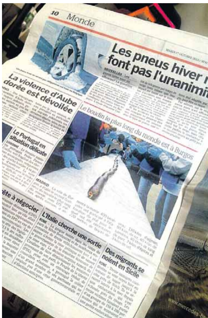
Un periódico gratuito europeo, L'Essentiel, recogió el récord en sus páginas el martes 1.

ha servido, para que más de 4.000 ciudadanos y visitantes prueben uno de los manjares más preciados de la gastronomía burgalesa, y para proyectar la imagen de Burgos en todo el mundo. No es de extrañar ya que hasta los alrededores del Paseo de Atapuerca se concentraron el domingo 29 cámaras de