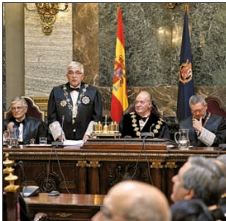
El rey Juan Carlos presidió el acto en el Tribunal Supremo

En su memoria, la Fiscalía destaca que si no se lleva a cabo "una actuación lo suficientemente decidida y enérgica" se corre el riesgo de aumentar la sensación de