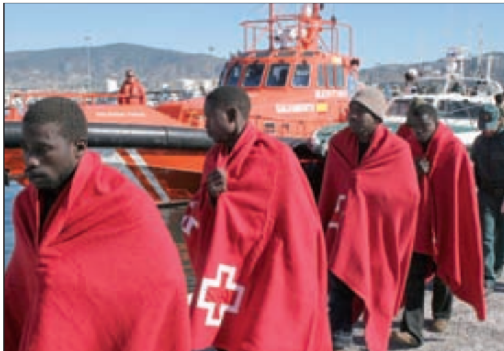
Inmigrantes llegados a España de manera irregular

Algunos de los inmigrantes presentaban síntomas de hipotermia por lo que fueron trasladados al Hospital Universitario para ser atendidos, mientras que otros están siendo tratados de magulladuras y golpes ocasionados, según manifestaron algunos de ellos, por agentes de la gendarmería marroquí.