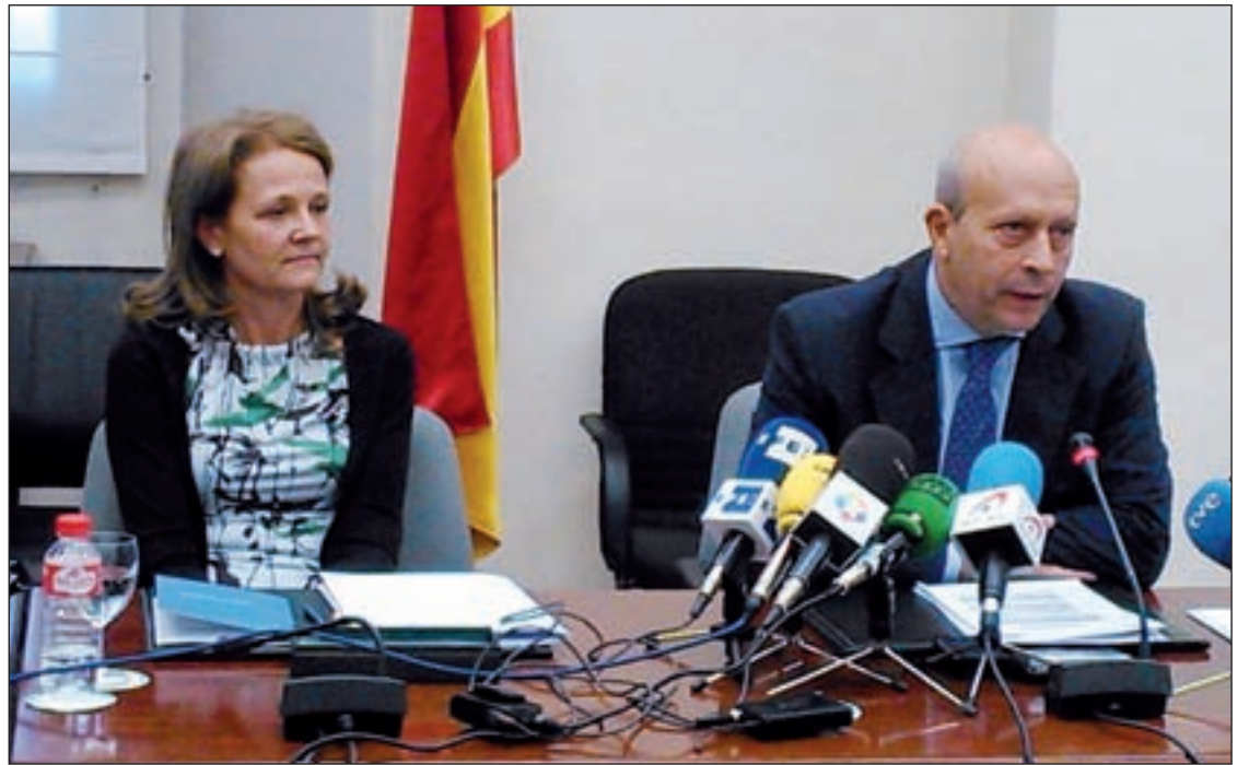
José Ignacio Wert, ministro de Educación, Cultura y Deporte, presentó el informe

El titular de Interior subrayó que el perfil más frecuente es una mujer, de 20 a 32 años, de nacionalidad rumana y en situación administrativa regular.