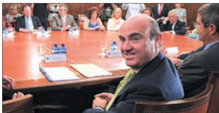
Luis de Guindos, ministro de Economía y Competitividad

El Gobierno, que prevé que la Seguridad Social cierre todos los ejercicios hasta 2016 en déficit, asegura que con este nuevo indicador el sistema podría reducir sus desequilibrios en 809,6 millones en 2014, en 1.640 millones en 2015, en 2.490 millones en 2016, en 3.359 millones en 2017 y en 4.242 millones en 2018.