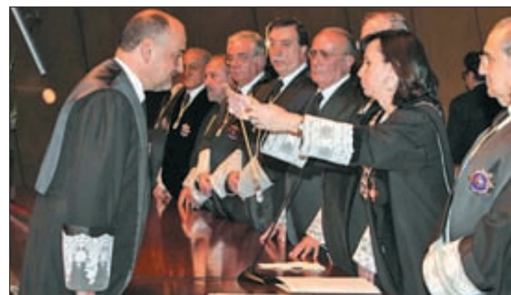
Francisco Pérez de Cobos, presidente del Constitucional

La militancia política de Pérez de los Cobos ha servido de base para que el Parlamento regional y el Gobierno catalán sospechen de su imparcialidad a la hora de intervenir en reclamaciones planteadas por el Partido Popular. “No deja de ser chocante que un recurso interpuesto por el PP lo deba dirimir un militante del PP”,