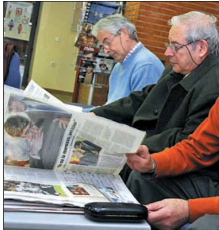
El nuevo indicador de revalorización comenzará a utilizarse en 2014

De aprobarse en los próximos meses el texto del anteproyecto de Ley sin cambios de calado, está previsto que en 2014 ya se aplique este nuevo indicador de revalorización, que sustituirá al IPC y que tendrá en cuenta no sólo la evolución de la inflación, sino también los ingresos y gastos del sistema para garantizar en todo momento que el sistema paga a los pensionistas el importe que puede soportar.