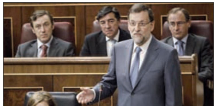
El presidente del Gobierno, Mariano Rajoy, en el Congreso

líticas; la reforma de la Ley de Contratos del Sector Público; la modificación de la Ley de prevención de blanqueo de capitales y de financiación del terrorismo; y la reforma del Código Penal, que incluye entre sus principales novedades la prisión permanente revisable para terroristas.