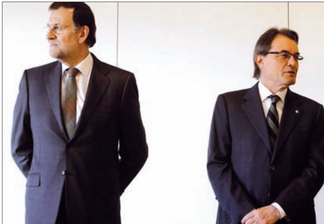
El presidente del Gobierno, Mariano Rajoy, junto al presidente de la Generalitat, Artur Mas

Así, Cataluña perdería el euro, el mercado único, los fondos del Banco Central Europeo, los Fondos de Cohesión y el Tratado de Schengen, lo que significaría, según explica Foro Europa Ciudadana, la creación de una nueva moneda con la “consecuente devaluación que traería consigo”, mayores dificultades para las entidades financieras catalanas, el pago de aranceles para la exportación e importación y la posible huida de empresas para ahorrar costes, así como la pérdida de la libre circulación de personas y la