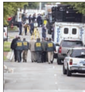
Policía en el lugar de los hechos

Casa Blanca, quien consideró que ello demuestra que "no tenemos un sistema de verificación de antecedentes lo suficientemente fuerte". "Y eso es algo que nos hace mas vulnerables a este tipo de ataques masivos", advirtió. Interrogado directamente sobre la disponibilidad de armas de fuego