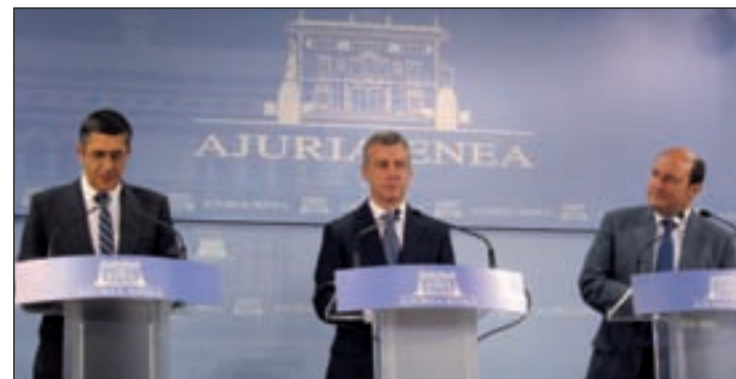
El lehendakari presentó el pacto entre PNV y PSE

El lehendakari, Iñigo Urkullu, se mostró convencido de que Euskadi remontará la crisis con el 'pacto de país' alcanzado entre el PNV y el PSE-EE sobre fiscalidad y reactivación económica, y que ambos partidos suscribieron el pasado lunes.