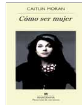
CÓMO SER MUJER Caitlin Moran. Ensayo.