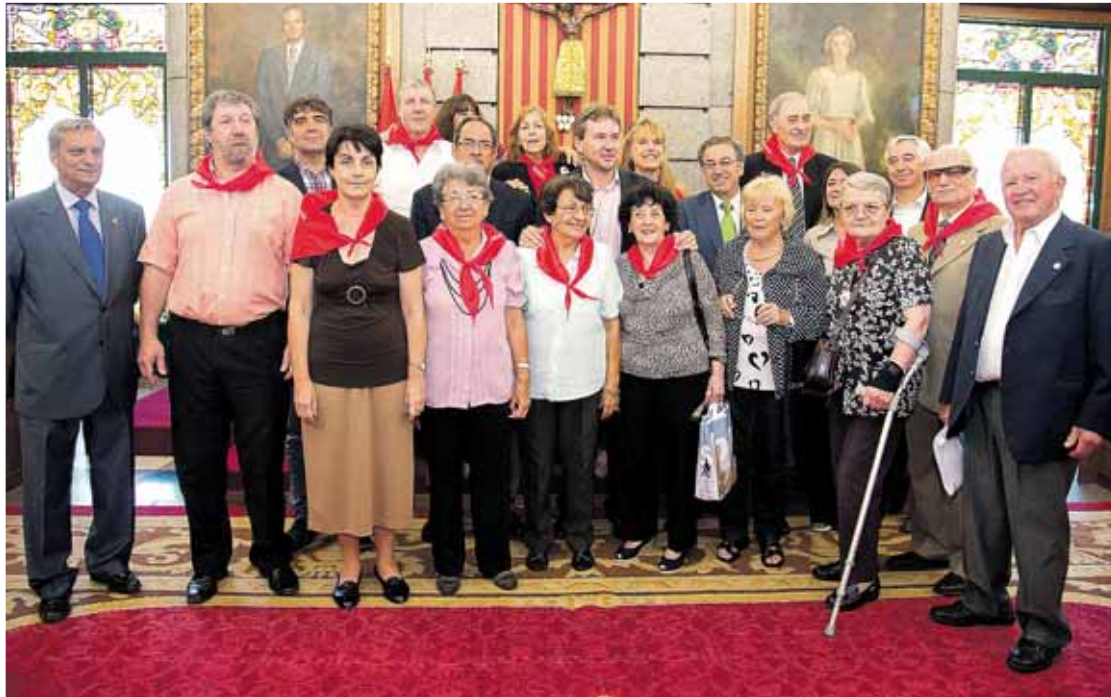
Los doce descendientes de burgaleses fueron recibidos por el alcalde de Burgos, Javier Lacalle, en el Ayuntamiento.

Los protagonistas de este viaje de emociones fueron recibidos el jueves 4 en el Ayuntamiento de Burgos por su alcalde, Javier Lacalle, en un acto en el que el regidor dio la bienvenida a estos burgaleses de corazón, que no de pasaporte. Llegados desde Argentina, Cuba y Chile, se mostraron sumamente agradecidos con la invitación que llevará a muchos de ellos a conocer los pueblos que tantas veces nombraron en sus cartas y en sus recuerdos sus padres o abuelos.