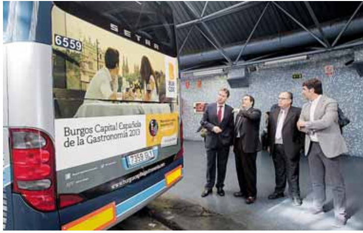
Los autobuses de Alsa anuncian ya Burgos Capital de la Gastronomía.

TURISMO PROMOCIÓN DE LA CAPITALIDAD POR ESPAÑA