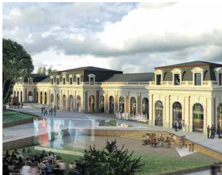
Recreación del aspecto exterior de la vieja estación una vez remodelada.

Respecto al interior del inmueble, De la Mata Medrano y su equipo apuestan "por la funcionalidad y la sectorialización dentro del