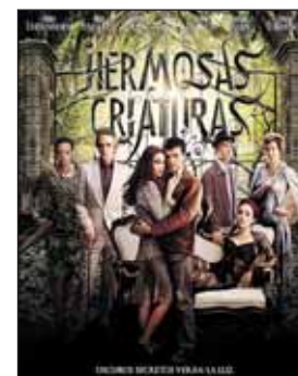
HERMOSAS CRIATURAS Dir. Richard LaGravenese. Int. Alden Ehrenreich, Alice Englert, Jeremy Iron. Drama/Fantástico.