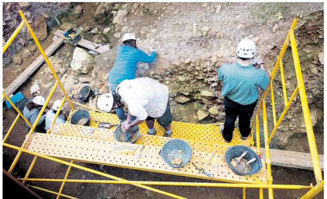
Los trabajos en los yacimientos de Atapuerca se prolongarán durante todo el mes de julio, menos que en 2012.

Después de que en 1993 aparecieran los famosos cráneos de la Sima de los Huesos, Arsuaga y Carbonell asumen el reto de conocer cómo vivieron las personas que perecieron en aquella cavidad y poder saber cómo fue su vida en el campamento que ubicaron en Gran Dolina, donde también se han hallado restos de la especie. "Al final de esta campaña podremos reconstruir un cuadro de la vida, de cómo era ese grupo humano", apostilló Arsuaga.