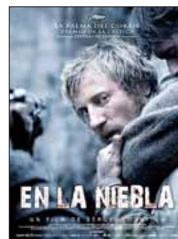
EN LA NIEBLA Dir. Sergei Loznitsa. Int. Vladimir Svirski, Vlad Abashin, Sergei Kolesov. Drama.