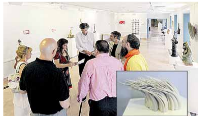
El jurado dio a conocer el fallo el jueves 4. La pieza ganadora está elaborada en cerámica y destaca por su originalidad.

En cuanto a los datos por provincias, el desempleo desciende en 50, principalmente en Barcelona (-15.869), Madrid (-14.716) y Málaga (-6.781).