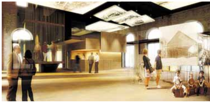
Recreación del vestíbulo según el proyecto diseñado por Bunch Arquitectura.

Tras perder su función ferroviaria, la antigua estación de tren se someterá a una profunda remodelación que la convertirá en un centro de ocio destinado al público infantil y juvenil.