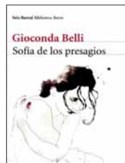
SOFÍA DE LOS PRESAGIOS Gioconda Belli. Novela.

Luz y Vida Arco del Pilar, 8 (Lain Calvo)