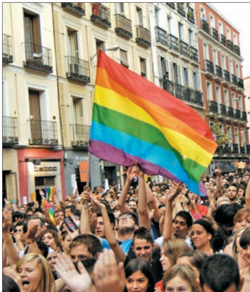
La marcha concluirá este año en la Puerta de Alcalá

La Comisión para la Reforma de la Ley Electoral de la Comunidad de Madrid se reunirá los días 9 y 17 para tratar de sacar algo en claro que ayude a la regeneración de la clase política y a la implementación de la democracia en sus decisiones y prácticas. El socialista Tomás Gómez dice que "no es momento de acuerdos y pactos con la derecha". Quizá por eso se negó a acordar una reducción del número de diputados regionales, y quizá por la misma razón, o la contraria, apoyó poner en marcha algún tipo de reforma electoral, que debería incluir, sin duda, las primarias, abiertas o no a los simpatizantes, para todos los partidos y los derechos del parlamentario a pensar por cuenta propia sin necesidad de cumplir los mandamientos y rezos diarios ordenados por los capos de turno. Gómez, que lleva demasiado tiempo persiguiendo la corrupción del PP, cada vez habla menos de otros golferíos como los de los ERE de Andalucía, cuyo presidente anuncia unas primarias con nombre fijo, aparentando un gesto democrático que es una huida hacia adelante. No será que el destinatario de sus mensajes es Rubalcaba, que recientemente acordó con Rajoy no sé qué sobre Europa. Da la sensación que Gómez habla cada vez más para sí mismo como si fuese el centro de la nada.