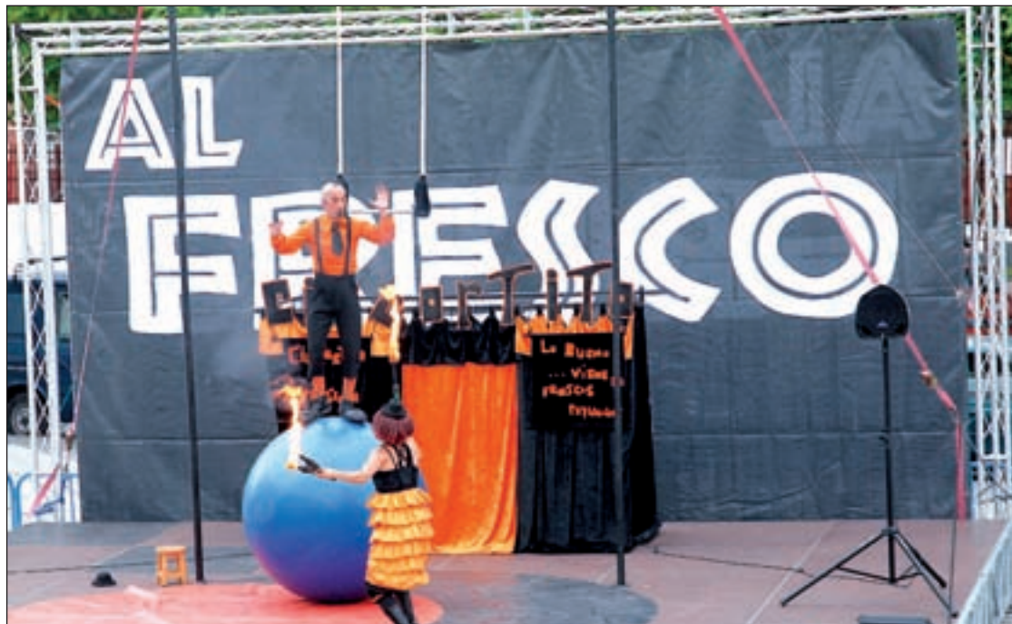
Actividades en las plazas

Durante el 13 y el 14 de julio, el municipio se llenará de baile con una mezcla explosiva de danzas urbanas como break dance y locking con jazz clásico y estética swing de los años 20. Todo ello aderezado con un toque de hu-