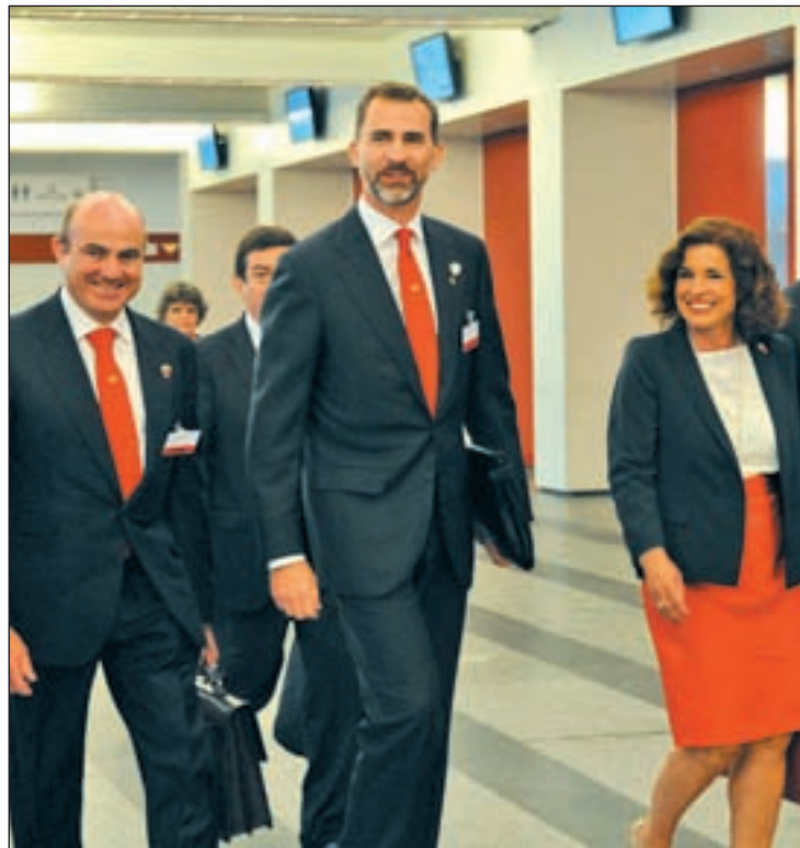
De Guindos, junto al Príncipe Felipe y a la alcaldesa Ana Botella

ticipa en la candidatura no como "una formalidad ceremonial", sino en su condición de atleta olímpico. "Pocas cosas han sido tan importantes en mi vida como representar a España en los Juegos de Barcelona. No gané una medalla, sino algo más valioso: conocer los valores humanos en los que se basan los Juegos y que unen a personas de todo el mun-