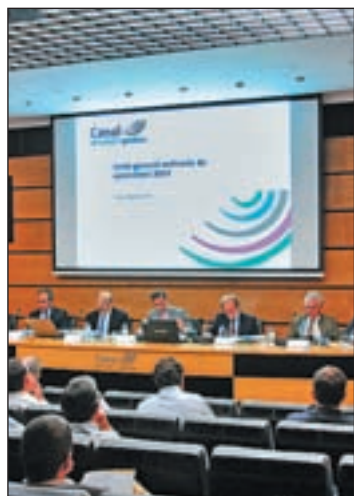
La primera Junta del Canal

De esta cifra, 69,5 millones fueron distribuidos como dividendo a cuenta a finales de 2012, mientras que los 48,8 restantes se aprobaron en la Junta como dividendo complementario, que será percibido por la Comunidad de Madrid y por los 111 ayuntamientos que ostentan el 17,6% del capital social del ente.