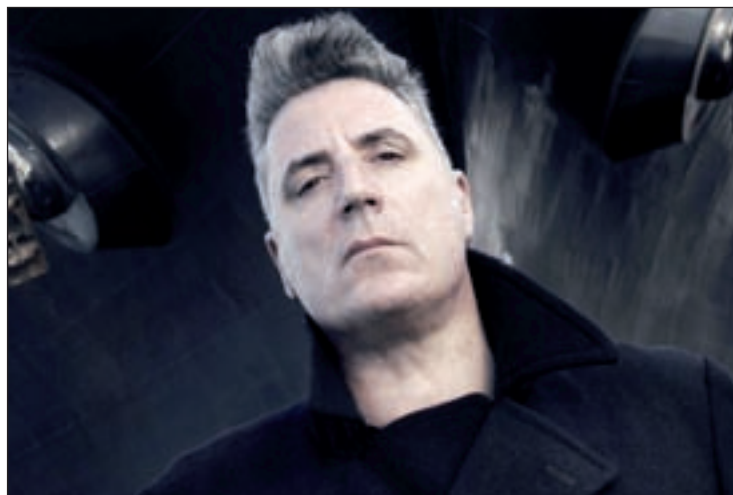
Loquillo también actuará en 'Músicos en la Naturaleza'

Venta de billetes en vayaentradas.com y en musicosenlanaturaleza.es