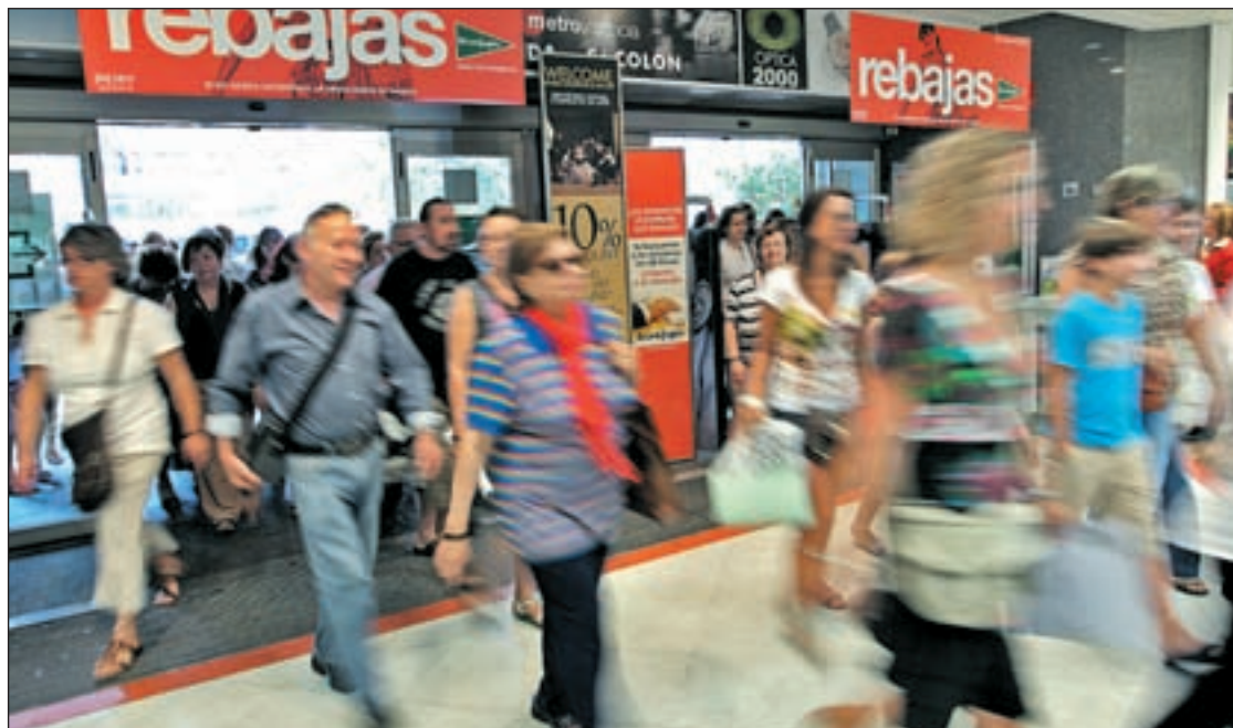
Los establecimientos notaron una mayor afluencia de gente el primer día de julio GENTE

En una zapatería, un grupo de señoras se escandaliza con esta