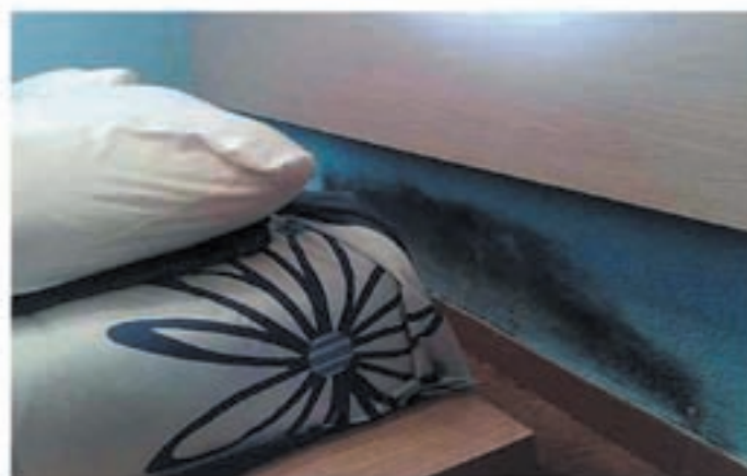
Problemas de humedades por capilaridad

Se han realizado estudios científicos sobre adolescentes que sufren afecciones respiratorias, dando como resultado un 83% de asma, bronquitis asmáticas y bronquitis crónicas y un 87% de rinitis crónicas, que alcanzan a jóvenes que viven en habitaciones demasiado húmedas. De un 20 a un 30% de nosotros sufrimos alergias respiratorias, ¡dos veces más que hace 20 años!. Edouard Drouhet, jefe de