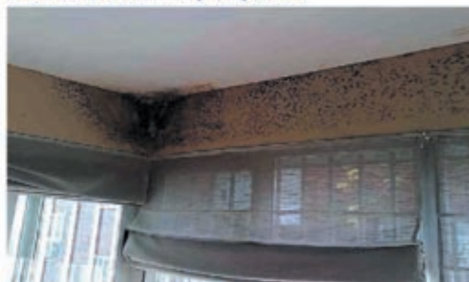
Problemas de humedades por condensación

micología en el instituto de la Salud Pública Louis Pasteur, explica este aumento por nuestro modo de vida: "Vivimos más en el interior, en casa o en el despacho. Desde los años 60, tendemos a un exceso de aislamiento para no dejar escapar el calor y además no se airea suficientemente".