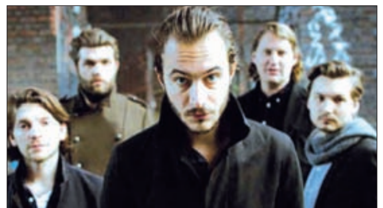
La banda británica

El primer álbum de la banda, 'An end has a start' (2005), vendió más de medio millón de copias en Reino Unido.