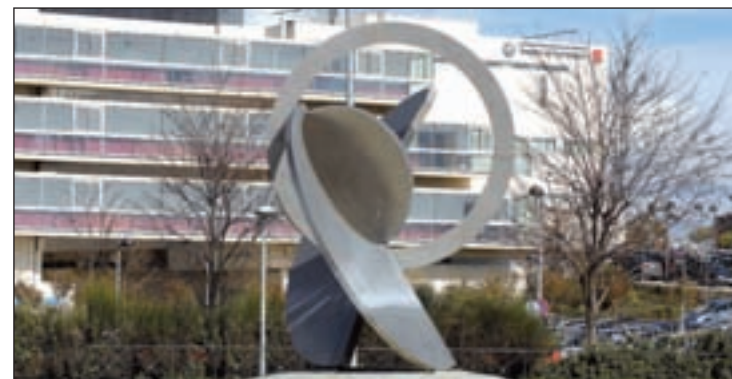
Hospital Universitario de Fuenlabrada