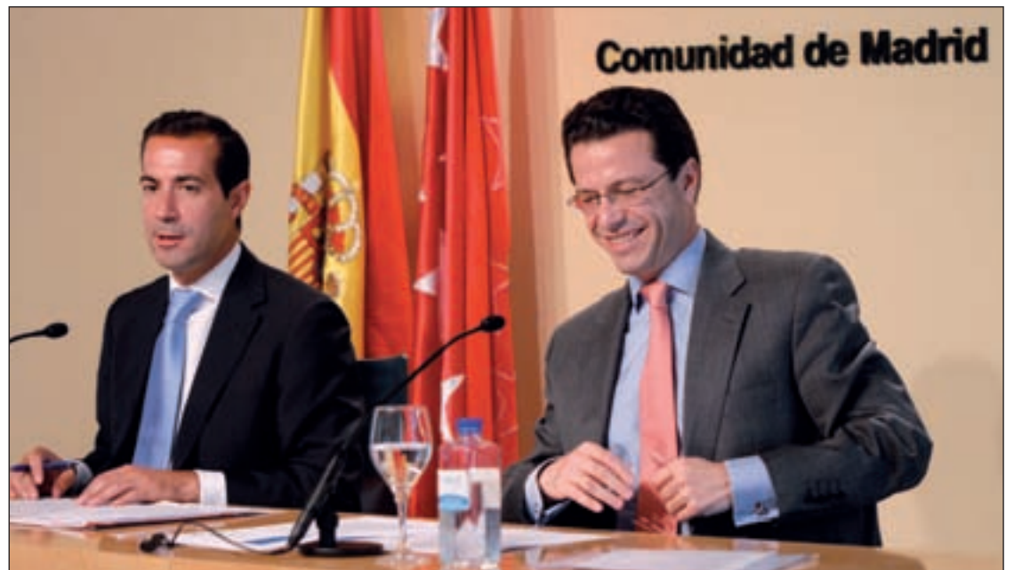
Los consejeros de Presidencia y Sanidad, tras el Consejo de Gobierno

la primera vez que esta cifra crece en un mes de junio desde el inicio de la crisis. Por tipo de régimen, 2.313.438 cotizantes pertenecen al general, 351.648 al de autónomos, 3.979 al del mar y 12 al del carbón. Dentro del general, 2.390 pertenecen al Sistema Especial Agrario y 107.390 al Sistema Es-