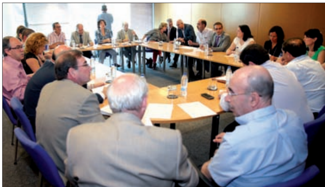
El alcalde y la responsable regional junto a medio centenar de empresarios

Según datos de las agencias especializadas, los préstamos afectados por esta circunstancia estarían entre el 10 y el 15% del total de hipotecas en vigor, que sumarían un millón y medio de préstamos.