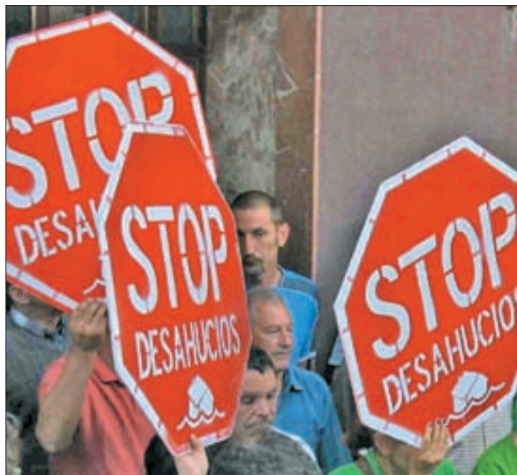
Miembros de la plataforma Stop Desahucios