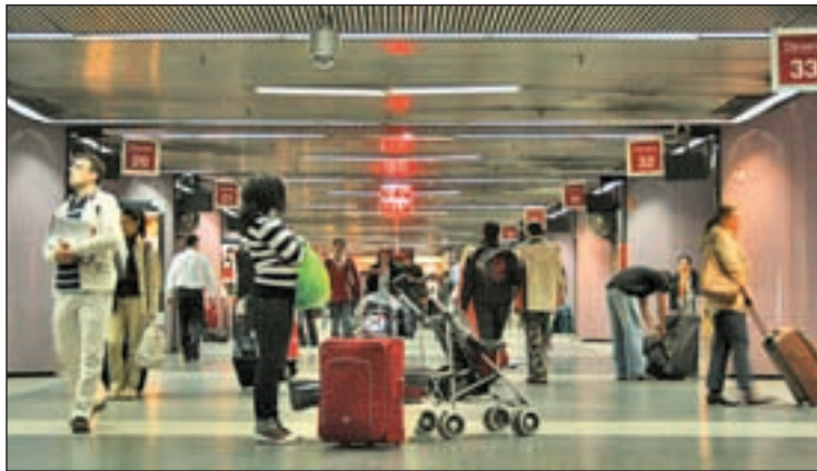
El intercambiador de Avenida de América GENTE

matizado. También se ha reformado la zona comercial y se han cambiado las escaleras interiores por unas más anchas, rápidas y de menor pendiente, lo que mejora los tiempos de trasbordo y la accesibilidad general de unas instalaciones que registran diariamente más de 156.000 viajeros. Tras esta remodelación, ya han comenzado las obras en todo el nivel -2, que se prevé que concluyan el verano de 2014. El coste de toda esta reforma supera los 40 millones de euros.