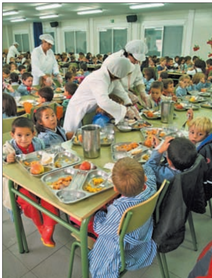
Comedor de una escuela infantil de Fuenlabrada

"Este curso las becas de comedor se redujeron a la mínima expresión por parte de la Comunidad de Madrid y esto posibilita que existan niños en situación de mala nutrición", critica la delegación de la FAPA. "Aunque no llegan casos particulares de familias en dificultades, nos consta que se acercan a los servicios sociales que les derivan a campamentos urbanos y colonias para que la manutención de los niños corra a su cargo", reconocía la FAPA.