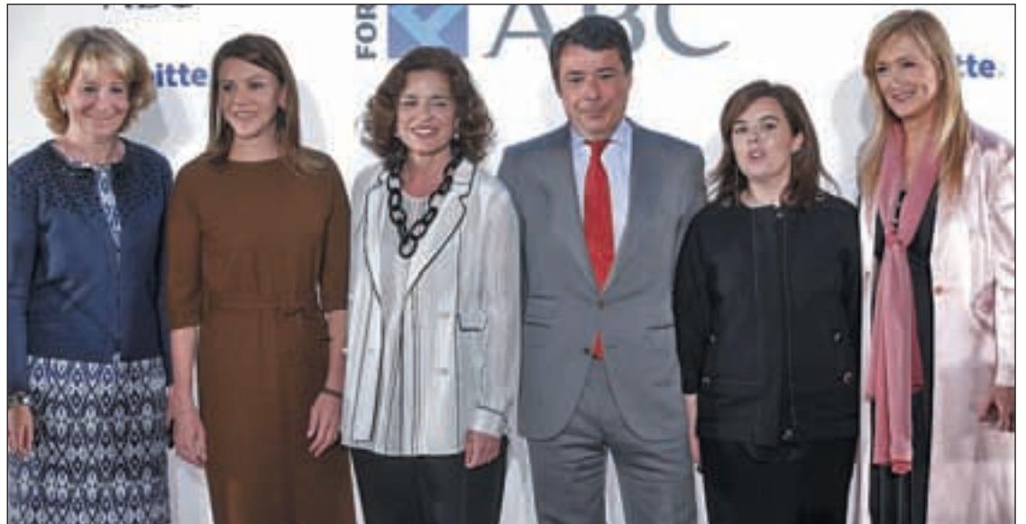
Ignacio González acompañado de las principales dirigentes del PP en el Foro ABC-Deloitte

Esta declaración de intenciones se produce en una semana en la que se ha abierto el debate, tras unas declaraciones de la presidenta del PP madrileño, Esperanza Aguirre, sobre la necesidad o no de hacer elecciones primarias en los partidos políticos para elegir a los candidatos. "Es imprescindible que los representantes atiendan a sus representados y que no estén tan preocupados por las cúpulas de los partidos que les presentan a una elección", ha señalado Aguirre, para defender las elecciones primarias en las formaciones políticas (aunque sin nombrarlas directamente) como