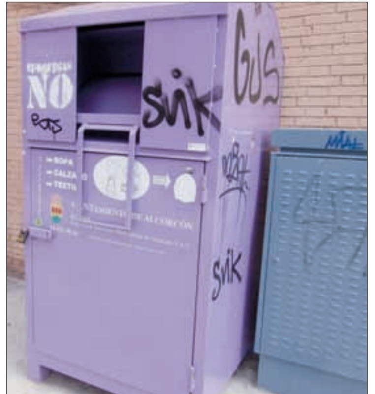
Los contenedores se encuentran ubicados en toda la ciudad GENTE

"La adjudicación a la empresa que recoge la ropa se hizo a través de un pliego que tuvo lugar en el mes de noviembre y fue aprobado por el partido socialista en el Consejo de Administración de ESMASA. Ellos lo aprobaron y sabían en qué consistía. En este pliego la empresa está obligada a donar toda la ropa que sea solicitada a través de la Concejalía de Asuntos Sociales, requerida por cualquier ONG o vecinos particulares con necesidades en vesti-