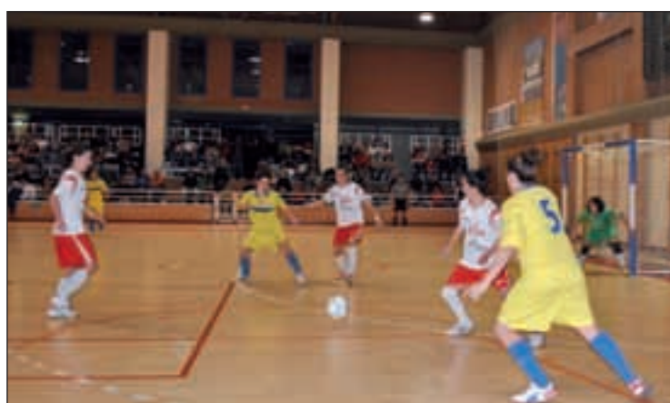
Las alfareras derrotaron al Móstoles

FÚTBOL SALA EL LACTURALE, RIVAL EN CUARTOS DE FINAL