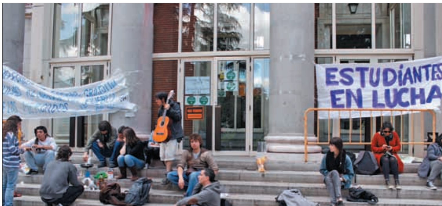
Estudiantes acampados en la puerta del Rectorado de la Universidad Complutense