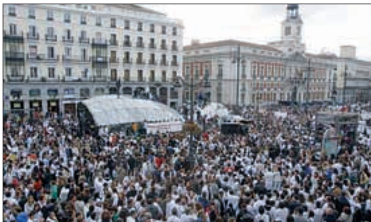
Marea Blanca