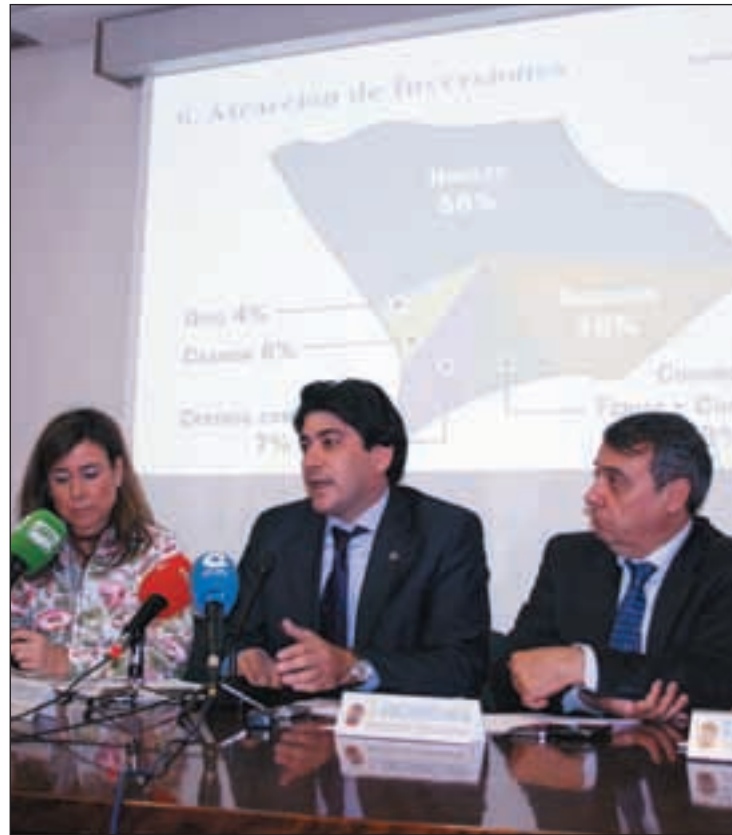
Coloquio con Agentes de la Propiedad Inmobiliaria de Madrid

Desde el Consistorio insisten además en que a día de hoy no ha habido negociaciones con la empre-