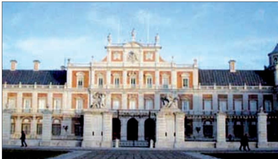
Farinelli sonará en el Palacio de Aranjuez