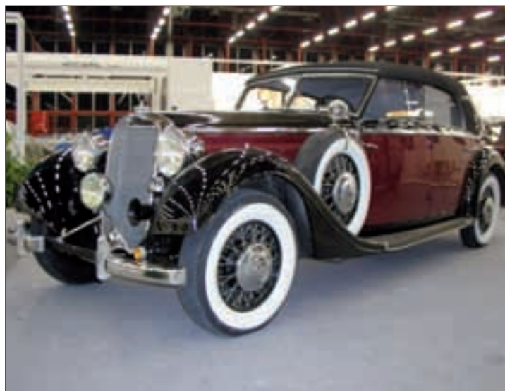
Un vehículo antiguo que estará en la exposición

Los precios de la entrada son ajustados y oscilarán entre diez y cinco euros. Además habrá descuentos para los miembros de los clubs y el público general si realiza una compra igual y superior a treinta euros en el centro comercial Tres Aguas. Para los menores de doce años es gratuita. Pueden adquirirse en taquilla o en entradas.com .