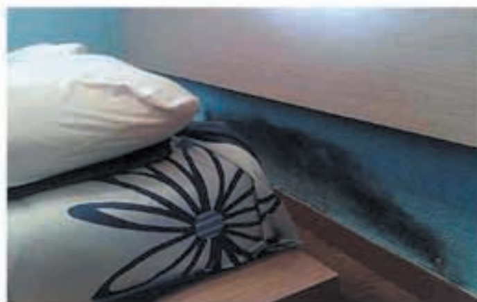
Problemas de humedades por capilaridad

Se han realizado estudios científicos sobre adolescentes que sufren afecciones respiratorias, dando como resultado un 83% de asma, bronquitis asmáticas y bronquitis crónicas y un 87% de rinitis crónicas, que alcanzan a jóvenes que viven en habitaciones demasiado húmedas. De un 20 a un 30% de nosotros sufrimos alergias respiratorias, ¡dos veces más que hace 20 años!. Edouard Drouhet, jefe de