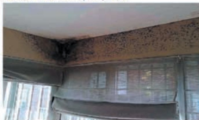
Problemas de humedades por condensación

micología en el instituto de la Salud Pública Louis Pasteur, explica este aumento por nuestro modo de vida: "Vivimos más en el interior, en casa o en el despacho. Desde los años 60, tendemos a un exceso de aislamiento para no dejar escapar el calor y además no se airea suficientemente".