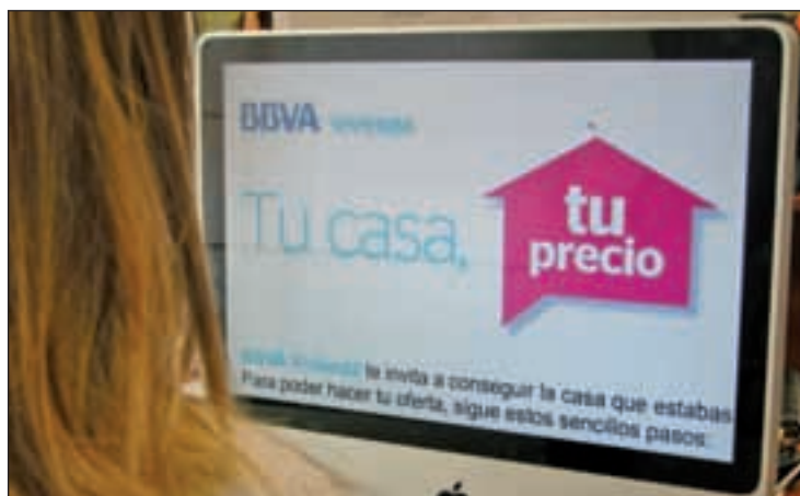
La primera parte de la campaña ha durado dos meses

Anida, la inmobiliaria de BBVA, ha lanzado la campaña 'Tu precio', con gran una gran acogida del público durante los dos primeros meses de la misma. Con esta campaña, Anida ofrece a sus clientes la posibilidad de negociar el precio de los inmuebles identificados con tu 'precio' en su web bbvavivienda.com mediante un sencillo cuestionario por inmueble. Si la oferta es aceptada por Anida contacta directamente con el cliente. Además, siempre que el precio no supere la tasación fijada, BBVA financia hasta el cien