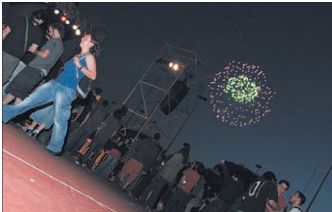
Fiestas de Getafe del 9 al 26 de mayo

Un total de 44 establecimientos ofrecerán botellín más tapa por tan solo dos euros durante el fin de semana del 10 al 12 de mayo, en la quinta edición de la Ruta de la Tapa de Getafe. Durante el acto de presentación, que tuvo lugar el pasado día 8 de mayo en el Hospitalillo de San José, se dieron a conocer los nombres de los bares participantes y algunas de las succulentas tapas que elaborarán como Foie de pato sobre millojas de manzana del Avenida 63, Roger variado con crema balsámica de frambuesa del Dolce Vita o Croquetón negro con sepiá y ali oli del bar De Olvido.