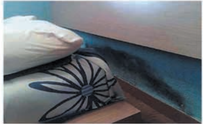
Problemas de humedades por capilaridad

Se han realizado estudios científicos sobre adolescentes que sufren afecciones respiratorias, dando como resultado un 83% de asma, bronquitis asmáticas y bronquitis crónicas y un 87% de rinitis crónicas, que alcanzan a jóvenes que viven en habitaciones demasiado húmedas. De un 20 a un 30% de nosotros sufrimos alergias respiratorias, ¡dos veces más que hace 20 años!. Edouard Drouhet, jefe de