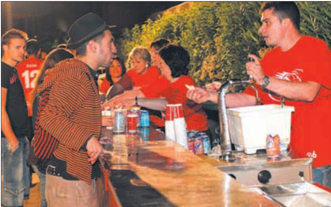
Jóvenes bebiendo en la calle durante las fiestas patronales