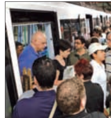
Metro de Madrid