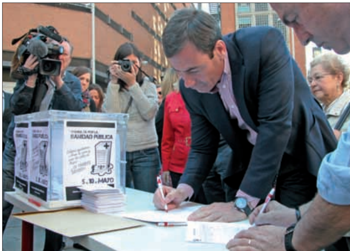
Tomás Gómez rellena la papeleta de la consulta en la Plaza de Callao

Una de las mesas consultivas se ha situado en la Plaza de Callao, frente al edificio en el que se encuentra la sede de los socialistas madrileños. El lunes, el secretario general del PSM, Tomás Gómez, acompañado de varios miembros de su Ejecutiva, votaba en esta mesa. Allí advertía de