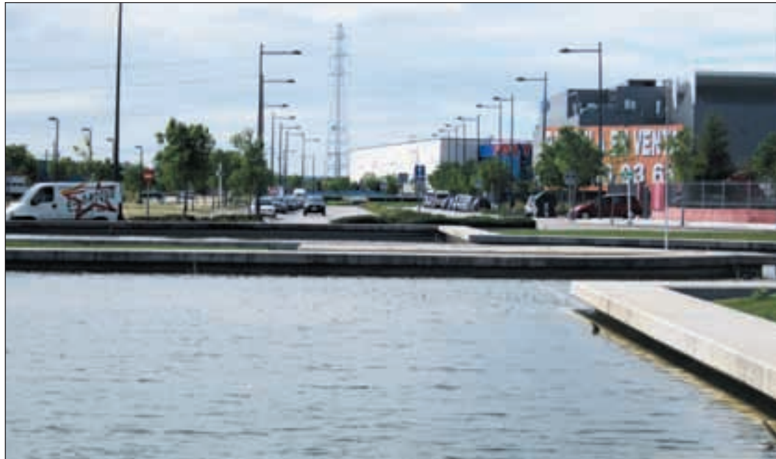
Parque empresarial La Carpetania

Una buena noticia para el municipio porque, según Soler, la ampliación en más de tres millones de metros cuadrados de superficie de la zona “va a aliviar a muchas familias de la localidad que se encuentran en una situación crítica, ya que la crisis nos tiene atenazados. Podemos alegrarnos porque con operaciones como ésta podemos tener algo más de esperanza”. IU, por su parte,