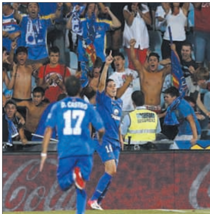
El Coliseum se llevó una alegría ante la Real Sociedad