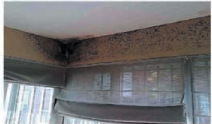
Problemas de humedades por condensación

micología en el instituto de la Salud Pública Louis Pasteur, explica este aumento por nuestro modo de vida: "Vivimos más en el interior, en casa o en el despacho. Desde los años 60, tendemos a un exceso de aislamiento para no dejar escapar el calor y además no se airea suficientemente".