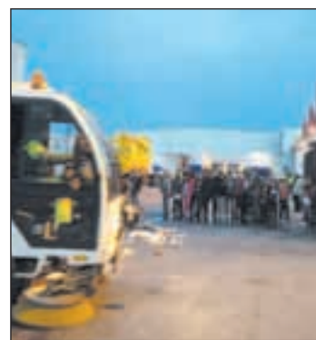
Un equipo de limpieza de LYMA

Sin embargo, dentro de las inversiones la oposición considera