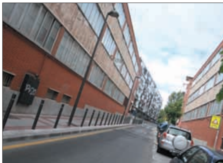
Viviendas municipales

Comunidad de Madrid la autorización para declarar formalmente que las viviendas quedan desvinculadas de uso o servicio público con el objetivo de que se regularice su situación. En la actualidad y, según el acta de la Junta, se estaría haciendo uso indebido de las viviendas que “están ocupadas por personas que no ostentan actualmente el derecho a casa-habitación”. En concreto, se trata de los pisos ubicados en los números 19 y 20 de la calle Buenavista, junto a los cole-