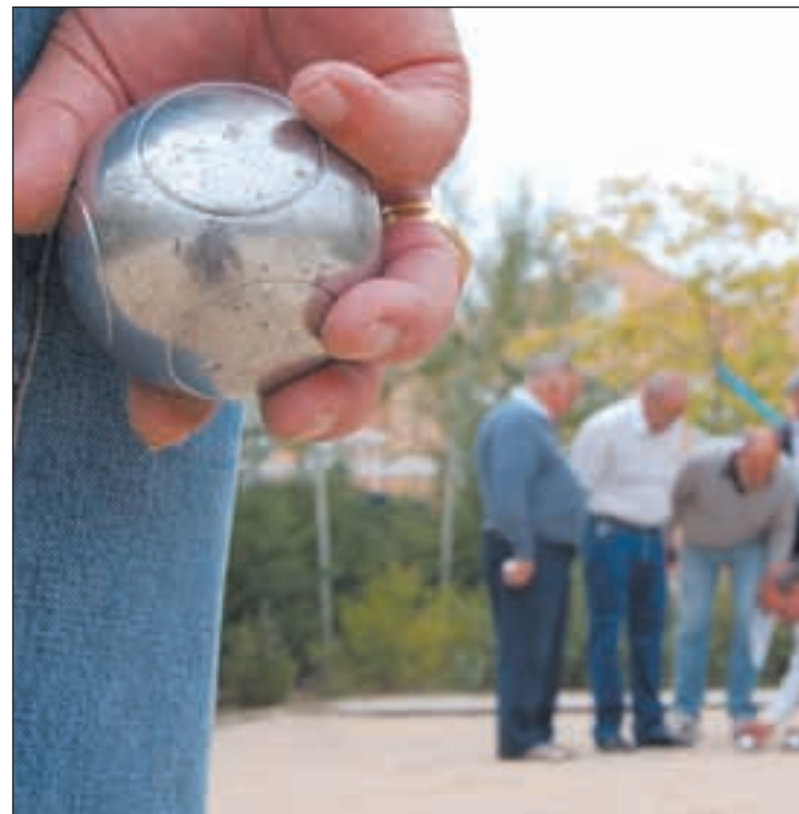
Mayores disfrutando en las calles de Getafe

Esta no es la primera vez que un colectivo o asociación pide al Gobierno municipal que ponga en marcha los órganos de participación ciudadana y se quejan de la