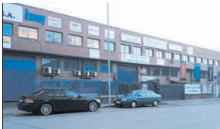
Polígono industrial de Getafe