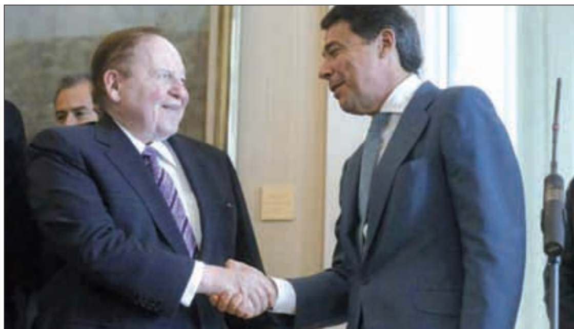
El presidente del Gobierno regional, Ignacio González, junto al magnate Sheldon Adelson