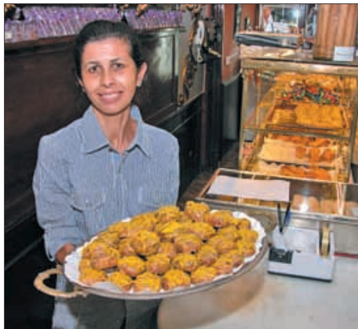
Venta de rosquillas en la pastelería 'El Riojano'

Muy cercana a la tienda anterior se encuentra El Horno de San Onofre, en el Mercado de San Miguel. En esta pastelería tradicional sólo hacen estos dulces durante el mes previo y el posterior a las fiestas del patrón de la capital. Pero llevan 60 años haciendo rosquillas, por tanto experiencia en este menester no les falta. Desde allí aseguran que las preferidas por los turistas son las 'Listas'. "Vienen con sus guías de hostelería y vienen con una idea fija". 'El Riojano' es un acogedor local dónde poder charlar con un té y una buena rosquilla en la mano.