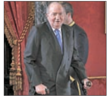
El Rey vuelve al trabajo

cibió al primer ministro eslovaco, Robert Fico, pero deberá esperar algunas semanas más antes de retomar las actividades públicas fuera de Palacio.