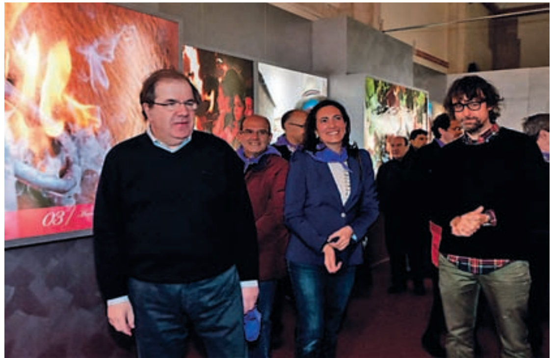
El presidente de la Junta, Juan Vicente Herrera, y la presidenta de las Cortes de Castilla y León y de la Fundación Villalar, María Josefa García Cirac, participaron activamente en los actos organizados en Villalar.

"Nuestro objetivo es acrecentar el sentimiento de pertenencia de los castellanos y leoneses a una Comunidad Autónoma con identidad propia"