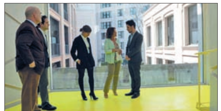
El Medialab-Prado en la antigua Serrería Belga

Medialab da continuidad a líneas de trabajo ya abiertas en su etapa anterior como la plataforma Inclusiva-net, dedicada a la cultura de redes; el Laboratorio del procomún, conformado por varios grupos de trabajo que abordan los bienes comunes desde ámbitos muy diversos.