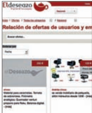
Una web muy especial