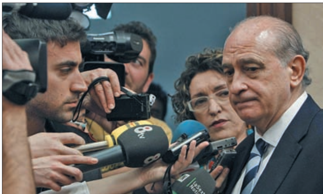
El ministro del Interior fue el encargado de confirmar los detalles de la operación