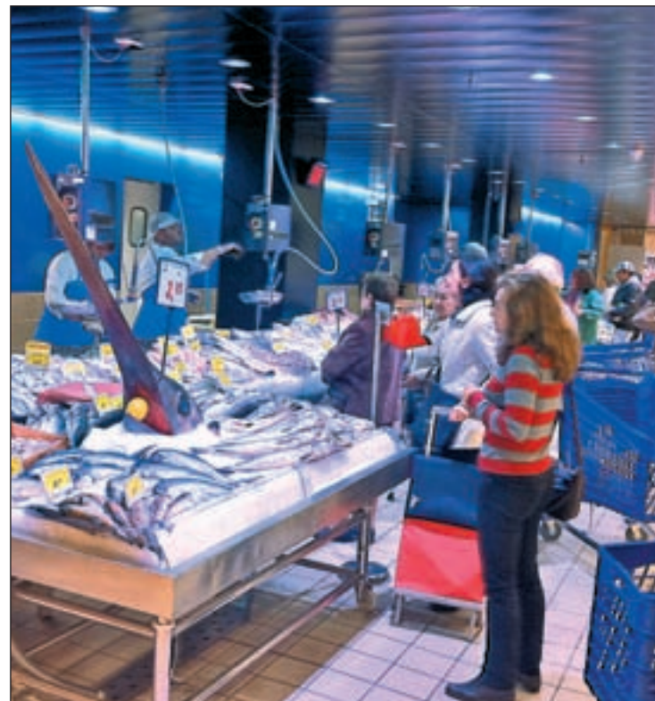
Los resultados avalan la propuesta de E.Leclerc Vallecas

El objetivo de esta iniciativa es dotar a estos niños de un alimen-