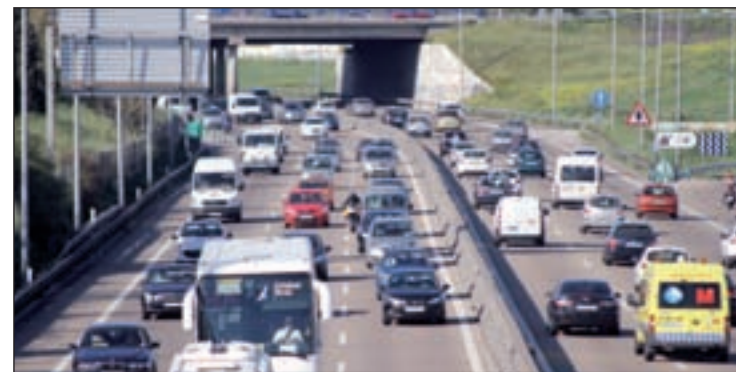
En 2012, los españoles pasaron 25 horas de media en un atasco

respecto al mismo período de 2012. De los 13 países europeos analizados, aquellos que han sufrido más la crisis son los que han registrado más caídas. "Siempre ha existido correlación entre el estado de la economía y el nivel de congestión de tráfico en las carreteras", reza el comunicado.