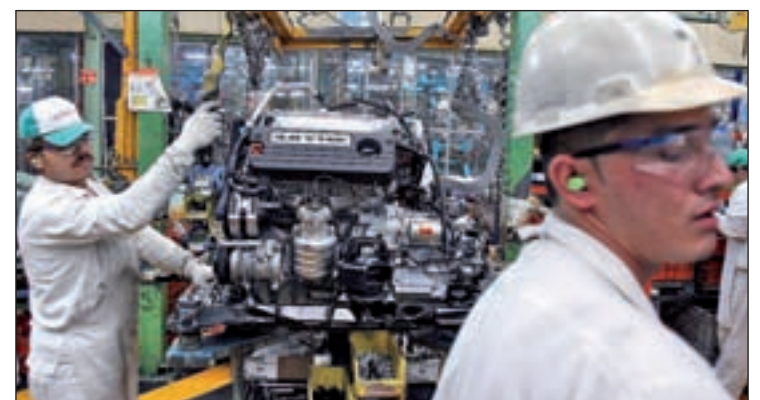
El Gobierno planea elevar la edad de jubilación más allá de los 67

der adquisitivo de las prestaciones. Tras los cambios aprobados en 2011, la ley ya establece que la edad de jubilación se vaya retrasando de forma paulatina desde los 65 años hasta alcanzar los 67 en 2027. También se estableció una ventana para revisar cada cinco años los principales factores del sistema de prestaciones.