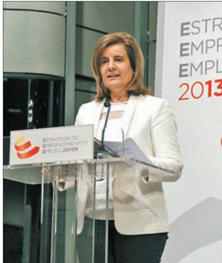
Del total de autónomos, 266.000 son menores de 30 años

Este colectivo está formado por más de tres millones de personas. De este total, más de 266.000 son menores de 30 años. Sólo en 2012, y a pesar de que éste fue el segundo peor año desde el inicio de la crisis, el número de autónomos con asalariados se incrementó en más de un 10 por ciento con respecto a 2011. Y en lo que llevamos de 2013, el número de personas por cuenta propia también ha crecido: 164.392 trabajadores se dieron de alta como autónomos, la mayor cifra desde el inicio de la crisis. "Los autóno-