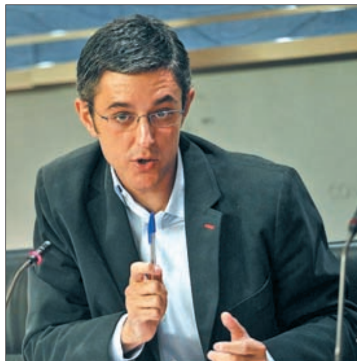
Eduardo Madina suena como candidato a las primarias del PSOE

Parecía que la calma había vuelto a las filas socialistas. Pero no es así y la sombra de la celebración de las primarias planea de nuevo sobre la calle Ferraz. Son muchas voces las que cuestionan el liderazgo de su secretario general, Alfredo Pérez Rubalcaba, aunque desde el centro del partido intenten transmitir una idea de unidad. "La convocatoria de las primarias la decidirá el órgano del PSOE que corresponda". "El momento de celebrarlas lo decidirá el PSOE, en función de sus intereses electorales". "Se harán cuando le interese al PSOE". Son las mil y una respuestas que utilizó la vicesecretaria socialista, Elena Valenciano, para zanjar el asunto: el partido no va a entrar en el debate del calendario de las primarias porque está centrado en la profunda revisión de su proyecto y su programa.