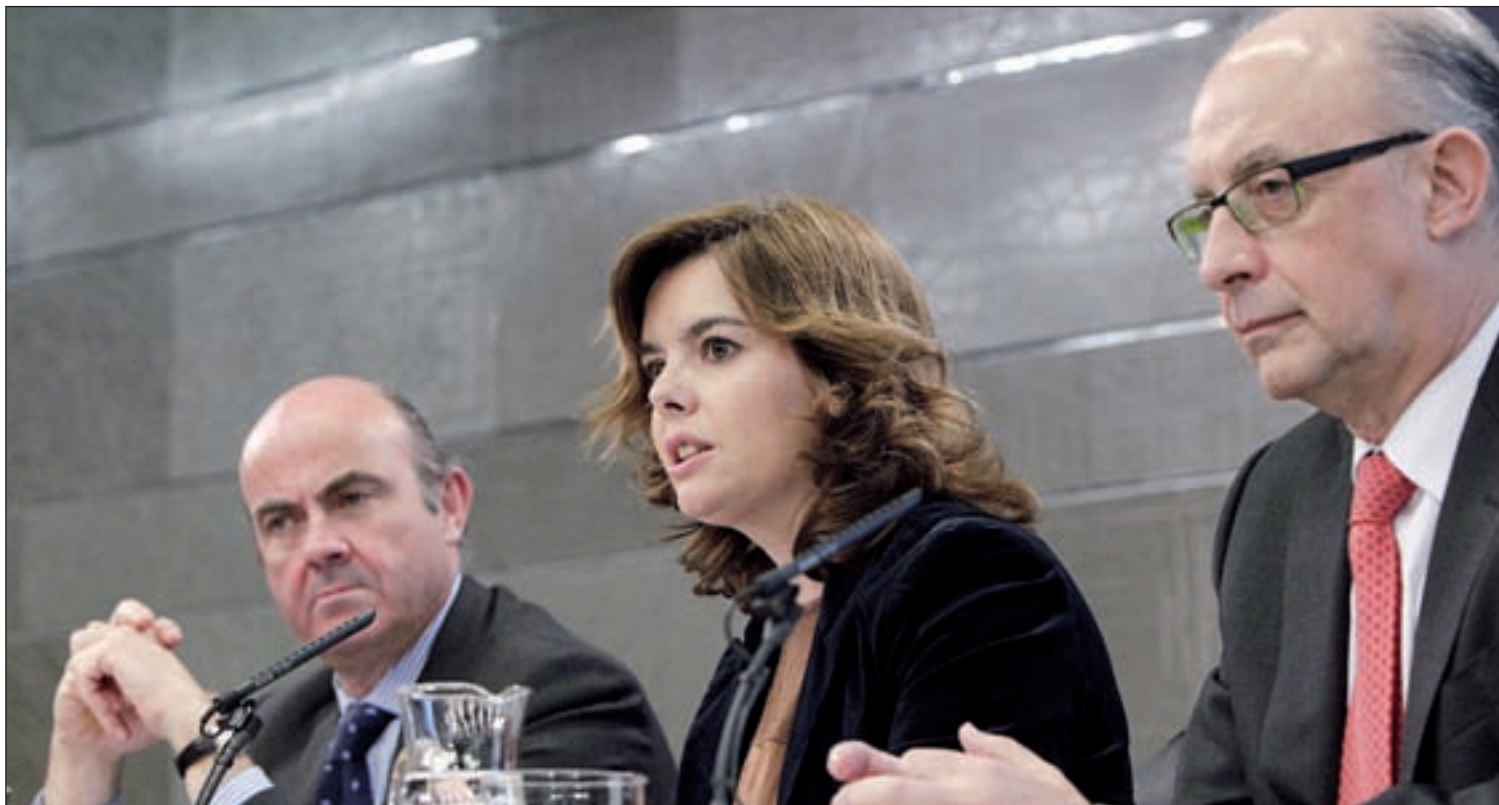
El Ejecutivo no descarta que se presenten nuevas medidas de austeridad a corto plazo