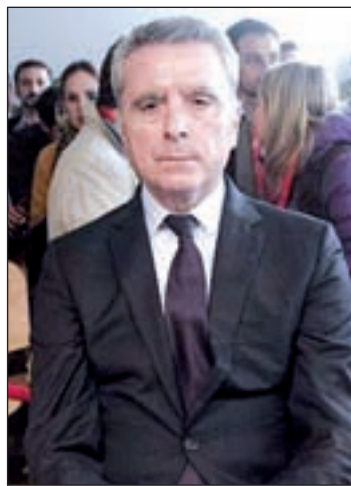
El extorero Ortega Cano

Ortega Cano ya tiene sentencia: dos años y medio de cárcel por el accidente mortal ocurrido la noche del 28 de mayo de 2011. El torero ha sido considerado culpable por un delito de homicidio imprudente y otro de conducción temeraria, aunque ha sido absuelto del delito contra la seguridad vial, ya que la juez no ha tenido en cuenta el análisis de sangre en el que se reflejaba un índice de alcoholemia que triplicaba al permitido por ley. La magistrada rechaza esta prueba ya que se hizo a partir de una muestra de sangre tomada al torero en el hospital en el que fue ingresado horas después del siniestro y, por tanto, no se respetó la cadena de custodia. Con esta decisión da la razón a la defensa de Ortega Cano que siempre mantuvo la ilegalidad de