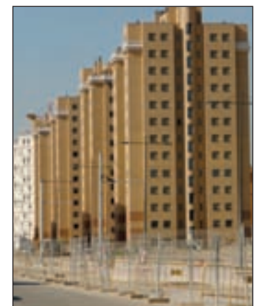
Baja el precio de las viviendas

El estado de conservación del inmueble también influye en su precio de venta, ya que tras comparar las transacciones de las que están en buen estado con las que precisan reformas, se observa que hay una diferencia de 99 euros por metro cuadrado a favor de las casas sin necesidad de actualización. Otra de las cualidades de los edificios que influyen en el precio de vivienda usada es el metro cuadrado, que en los pisos grandes tuvo un precio ligeramente superior al valor del de los pisos pequeños.