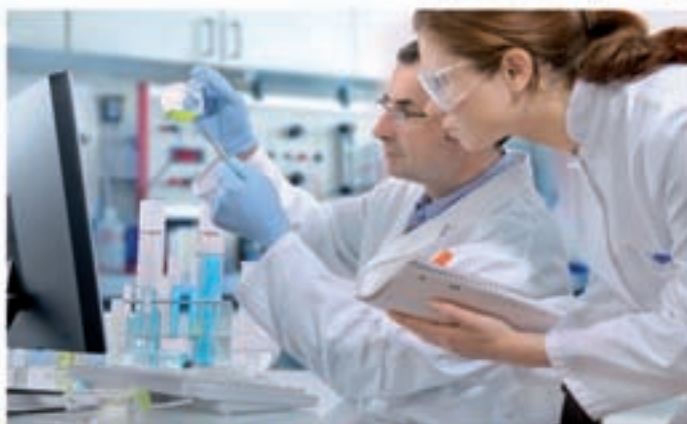
Nuestros laboratorios siempre a la vanguardia

Cuando observe manifestaciones en su vivienda de salitre, manchas negras en la ropa, paredes desconchadas, olor a hongos... ¡Es el momento de actuar! Cualquier problema de humedad que surja en su casa debe ser tomado muy en serio, por eso la mejor opción es acudir a un profesional especializado, ya que con frecuencia los propietarios caen en el error de intentar resolver el problema por sí mismos, siendo numerosos los fracasos, ocasionándoles numerosos gastos sin poder librarse del problema.