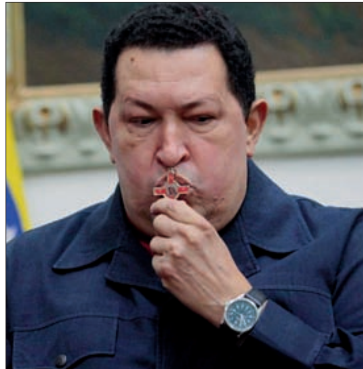
El presidente de Venezuela, Hugo Chávez, muere a los 58 años

Estos son días de luto para Venezuela pero ya todos tienen en la cabeza qué va a pasar ahora que el líder de la revolución bolivariana ha fallecido. Por el momento, Nicolás Maduro ha tomado las riendas de un país que vive con incertidumbre su futuro. La constitución prevé que sea el presidente del Parlamento, Diosdado Cabello, quien asuma el poder y convoque elecciones en el plazo de un mes. En cambio, el ministro de Exteriores, Elías Jaua, ya ha anunciado que será el vicepresidente Maduro, al que Chávez de-