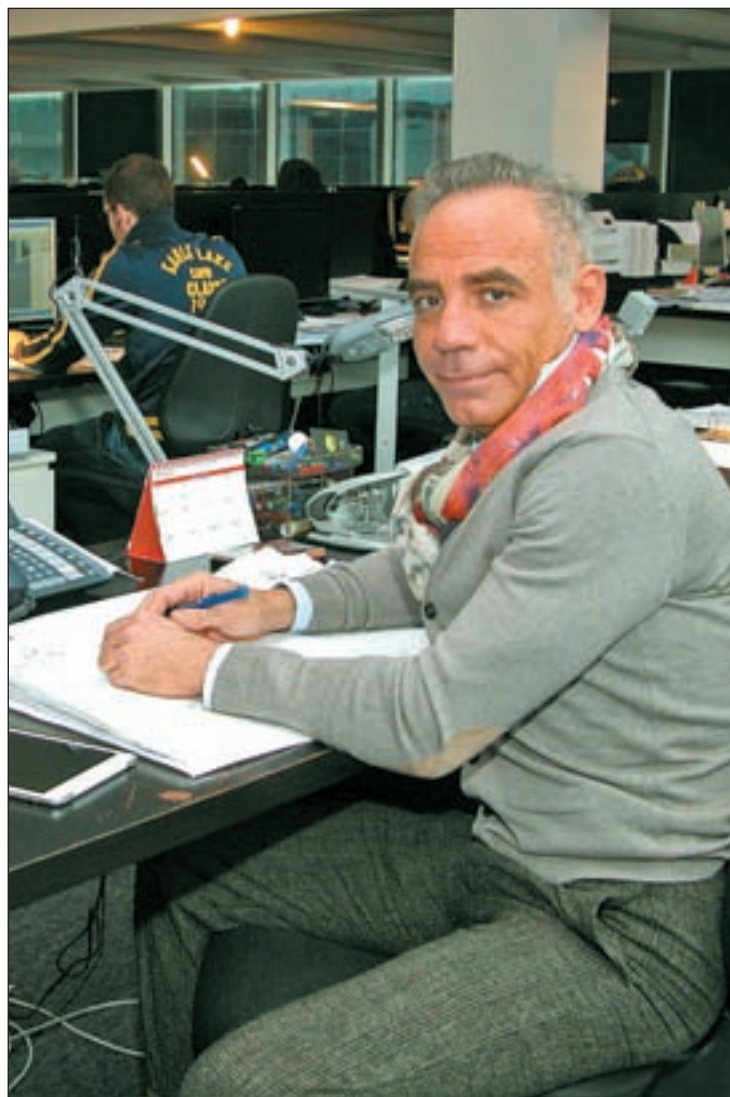
CHEMA MARTÍNEZ / GENTE

No me afectan mucho ni las críticas ni los halagos. Cuando me dicen eres un genio, yo sé perfectamente cómo soy; y las críticas llega un momento en que te afectan. A mí llegó un momento en el que me afectaba y decía cómo