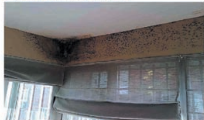
Problemas de humedades por condensación

micología en el instituto de la Salud Pública Louis Pasteur, explica este aumento por nuestro modo de vida: "Vivimos más en el interior, en casa o en el despacho. Desde los años 60, tendemos a un exceso de aislamiento para no dejar escapar el calor y además no se airea suficientemente".