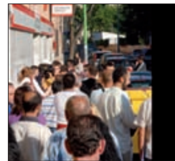
El paro supera los 5 millones

to), y la construcción experimentó un crecimiento de 1.377 parados (+0,18 por ciento). En cuanto a la contratación, se registraron un total de 949.844 contratos.