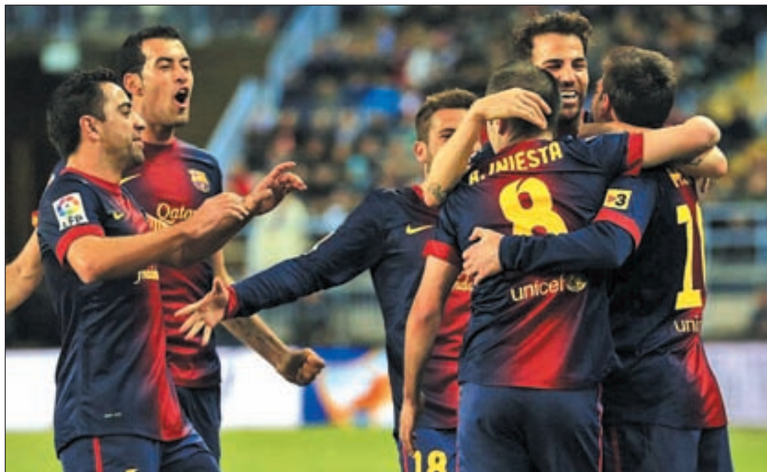
El Barça se conjura para dar la vuelta a la eliminatoria ante el Milan de Allegri

Por todo ello, el partido del próximo martes es considerado como una auténtica final. El Camp Nou se prepara para vivir una noche que, para bien o para mal, marcará la temporada culé. Nunca antes el Barcelona ha remontado un 2-0 adverso en competiciones europeas, lo cual supone un nuevo reto para un equipo que en las últimas semanas ha despertado dudas con su juego, aunque tiene argumentos de sobra para voltear una eliminatoria en la que, a priori, partía como favorito. Esa vitola ha ido a parar