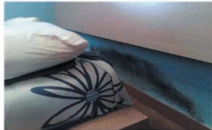
Problemas de humedades por capilaridad

Se han realizado estudios científicos sobre adolescentes que sufren afecciones respiratorias, dando como resultado un 83% de asma, bronquitis asmáticas y bronquitis crónicas y un 87% de rinitis crónicas, que alcanzan a jóvenes que viven en habitaciones demasiado húmedas. De un 20 a un 30% de nosotros sufrimos alergias respiratorias, ¡dos veces más que hace 20 años!. Edouard Drouhet, jefe de