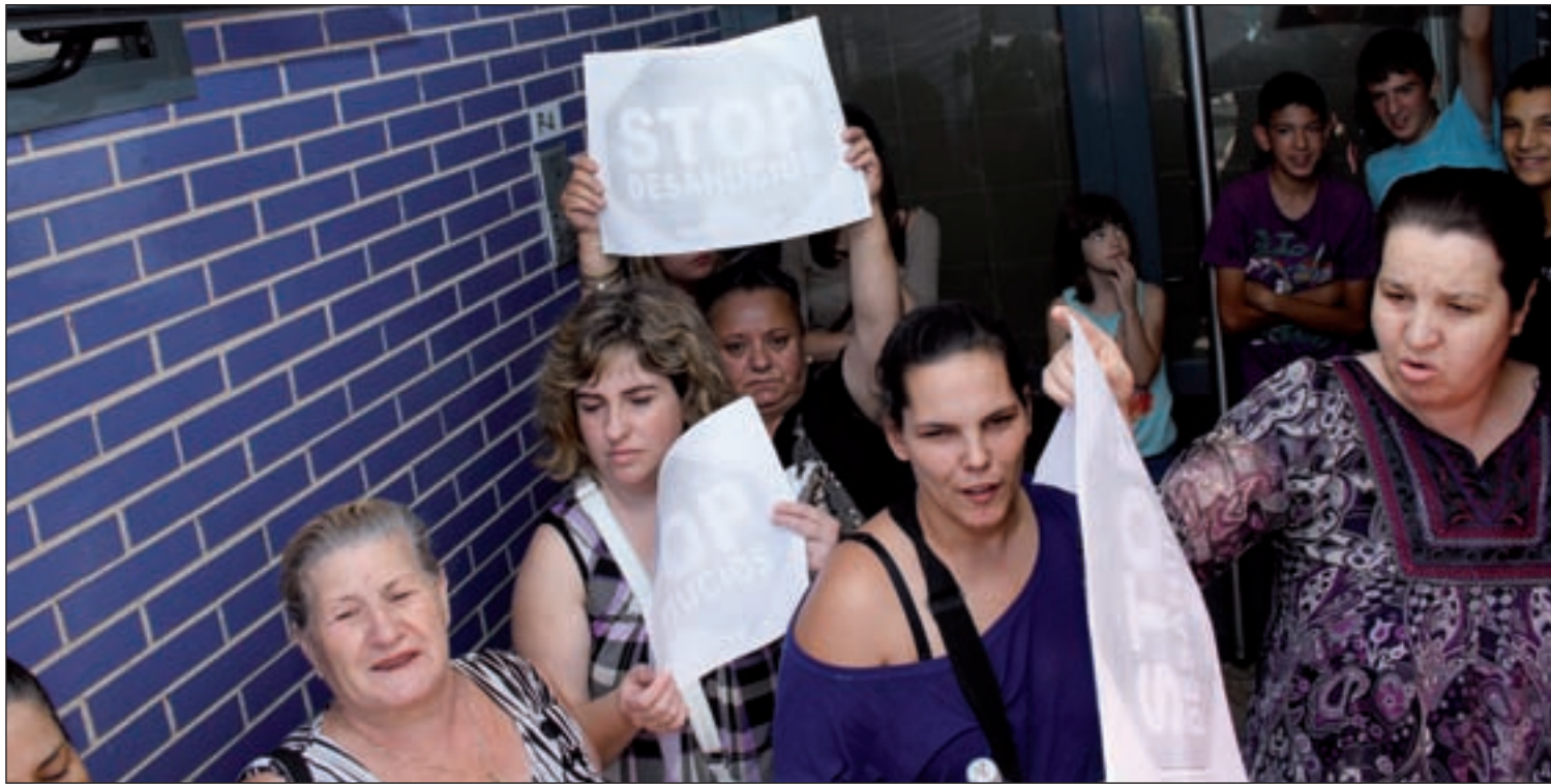
El Gobierno estudia incluir la dación en pago en la nueva ley hipotecaria