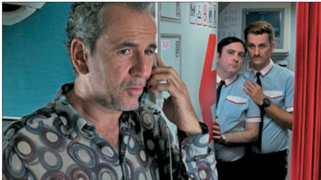
Los actores Willy Toledo, Carlos Areces y Raúl Arévalo durante un momento de la película