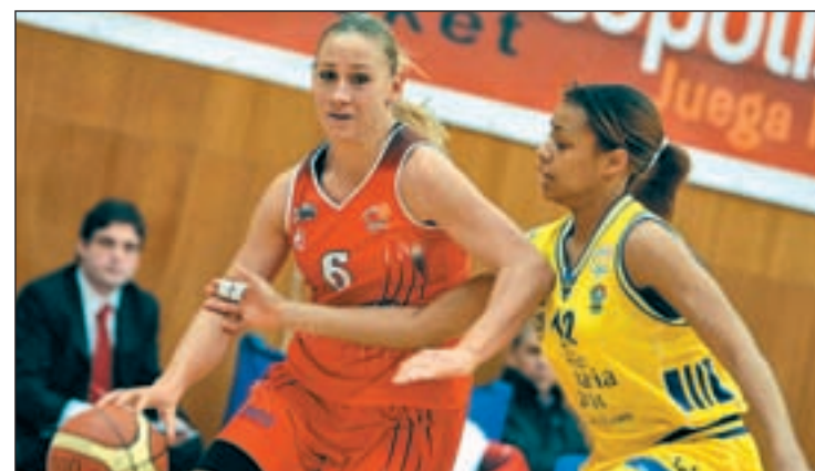
El conjunto madrileño del Rivas lidera el torneo de la regularidad

Al margen de la presunta igualdad deportiva, la segunda semifinal (16 horas) contará con un toque de rivalidad, ya que el vigente campeón de este torneo, el Perfumerías Avenida de Salamanca, se ve las caras con el anfitrión, el Tintos de Toro Caja Rural. A pesar de atravesar un momento bajo de forma, las zamo-