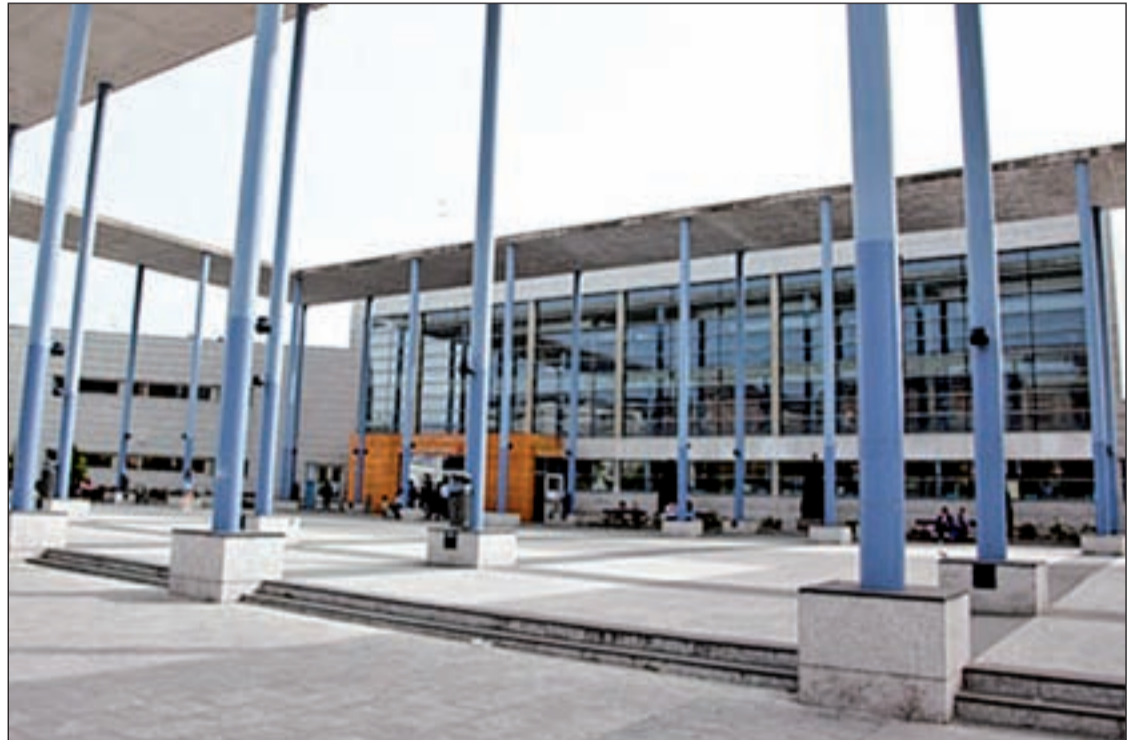
Biblioteca Municipal Miguel Hernández, una de las bibliotecas de Villalba donde se impartirá el programa

El plazo para apuntarse a esta actividad extraescolar se abrió el 10 de enero y el número de plazas por taller es de 20 alumnos. Todos los que se quieran apuntar deberán acudir a las propias Bibliotecas de Barrio. Los inscritos descubrirán a través de juegos de cálculo, lógica y razona-