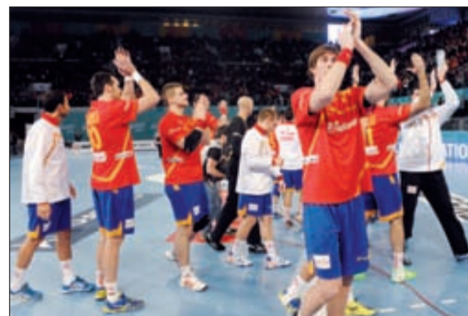
La Caja Mágica ha vibrado con los partidos de España HANDBALL2013