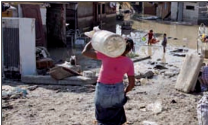
La Cañada Real Galeana

Este nuevo protocolo de actuación será firmado, además, por los Ayuntamientos implicados: Madrid, Rivas y Coslada. "Esta-