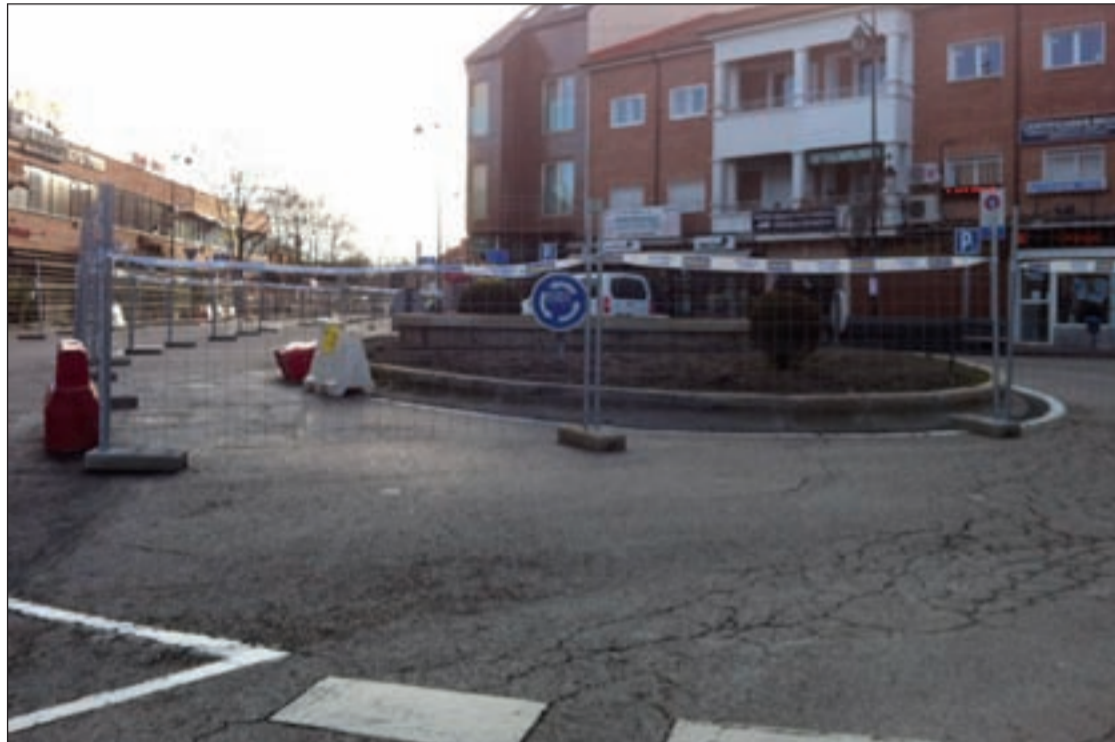
Una de las rotondas afectadas por las obras en el barrio de La Estación, en Pozuelo de Alarcón

Los vecinos se han mostrado satisfechos con los trabajos.