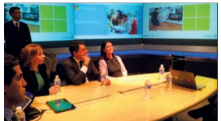
El presidente de la Comunidad y la alcaldesa en la sede de Microsoft

Kinect es un proyecto de Microsoft en colaboración con la Comunidad de Madrid, que está ayudando a mejorar el sector sanitario y educativo de la región.