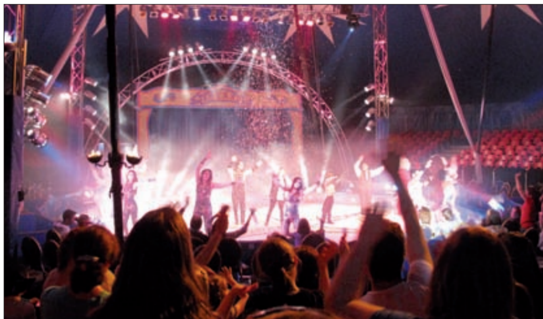
Imagen del espectáculo de Teresa Rabal

Este año el circo de Teresa Rabal ha tenido algunos problemas que le han retrasado su estreno. La propia artista nos cuenta que la tardanza se ha debido al “problema del Madrid Arena, que lo hemos pagado prácticamente todos los espectáculos que han estrenado en Madrid este año”. Pero siempre hay que ver la parte buena de las cosas y la cantante comenta entre risas: “nos hemos convertido en el circo más seguro de toda España, porque nos han hecho poner de todo: pararrayos, mangueras de incendios...”