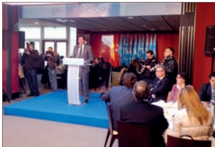
El alcalde de Las Rozas durante la presentación del coloquio