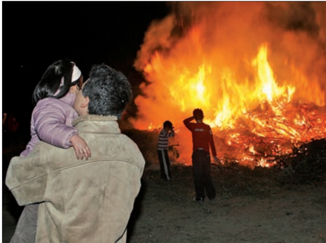
Quema de la iluminaria de San Sebastián en Collado Villalba

El culto a San Sebastián es muy antiguo y está muy extendido. Conocido como 'El Apolo Cristiano', es uno de los santos más venerados por la Iglesia Católica y Ortodoxa. Nació en Narbona, Francia, en el año 256, pero se educó en Milán y llegó a ser