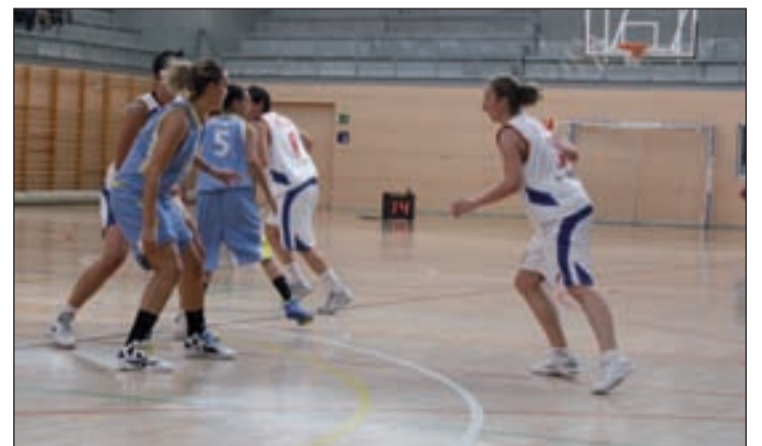
Derrota contundente del equipo roceño en la cancha del Universidad

censo de categoría. Para empezar, las roceñas reciben este sábado (20 horas) al Asefa Estudiantes, un equipo que está a medio camino entre los puestos de promoción de ascenso y la parte baja de la clasificación. Con cinco triunfos en su casillero, las colegiales aspiran a engancharse al grupo de candidatos que sueñan con jugar la próxima campaña en la élite, un honor que el equipo estudiantil ya saboreó anteriormente. Como aval, las colegiales presentan el segundo mejor porcentaje de puntos por partido de este grupo B. Por su parte, el cuerpo técnico