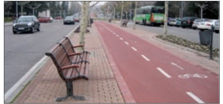
Uno de los bancos que se han colocado en la Avenida de España

nicipal. De esta forma, se colocarán bolardos retráctiles en zonas peatonales, junto con cámaras conectadas con la Policía Local para facilitar el tránsito de vehículos de emergencia, seguridad y también el de particulares.