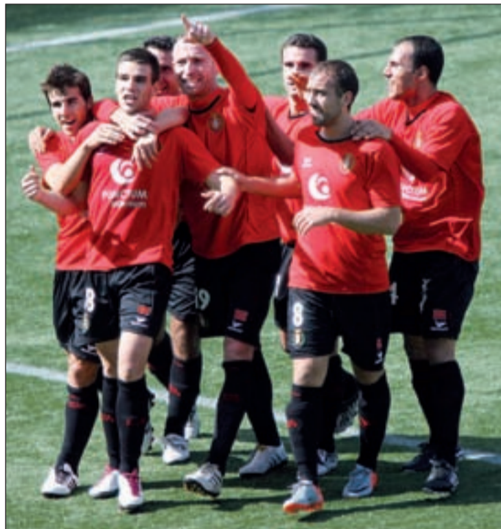
El Pinto llega necesitado de puntos a esta cita