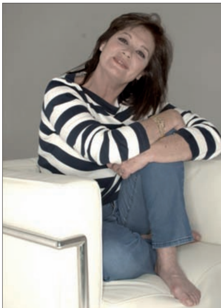
Foto de la cantante y actriz Teresa Rabal

Esta edición es novedosa porque "son diferentes canciones y diferentes números", pero "siempre tienen la misma tónica y yo creo que eso es importante por la propia personalidad del circo". Pero si hay algo que año tras año no puede faltar "es Veó Veó, porque ha sido la que me ha permitido catapultarme en el tiempo y