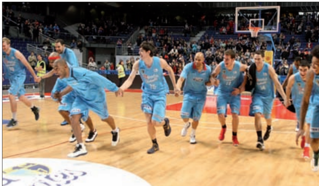
Los colegiales celebraron con sus aficionados su pase al torneo que se disputará en Vitoria

LIGA ACB ASEFA ESTUDIANTES Y REAL MADRID COMIENZAN LA SEGUNDA VUELTA