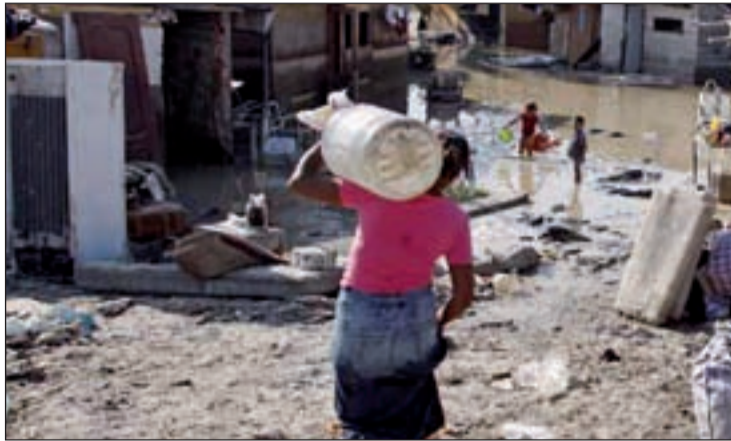
La Cañada Real Galeana

Este nuevo protocolo de actuación será firmado, además, por los Ayuntamientos implicados: Madrid, Rivas y Coslada. "Esta-