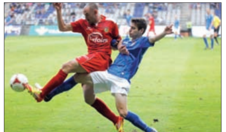
El Fuenlabrada juega el primer partido de 2013 ante su público