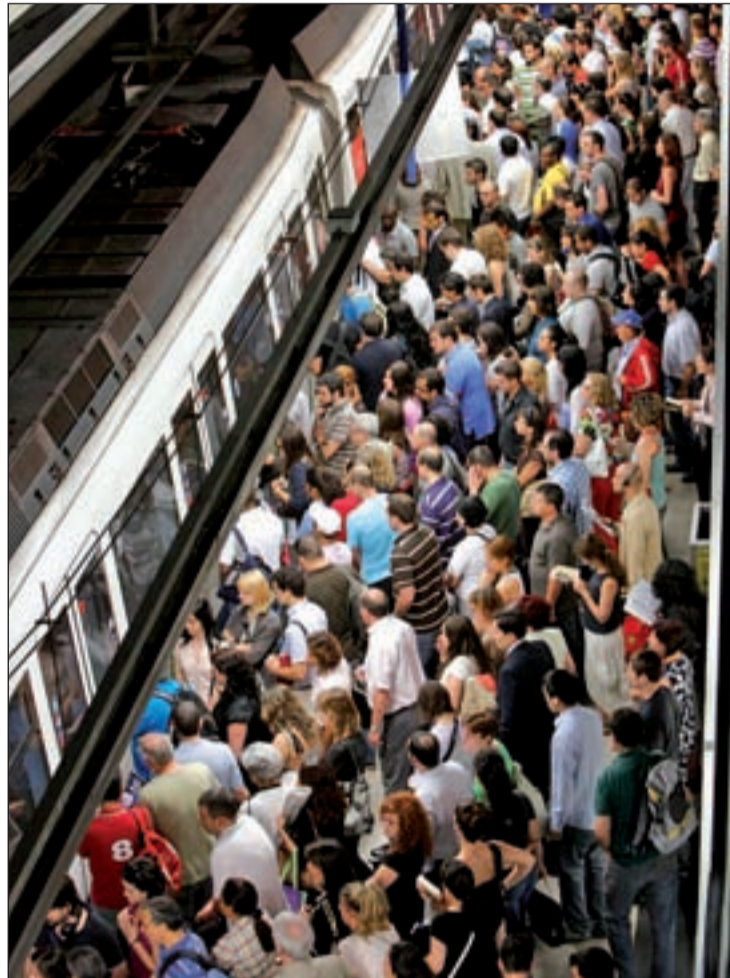
Los andenes llenos ha sido la tónica de los días de huelga

Además, el consejero de Transportes ha atribuido la caída del número de viajeros en el transporte madrileño al aumento del desempleo.