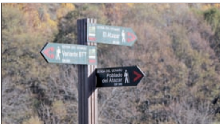
Uno de los carteles que pueden encontrarse en la senda

RUTA PARA PRACTICAR DEPORTES QUE RODEA LA PRESA DE 'EL ATAZAR'