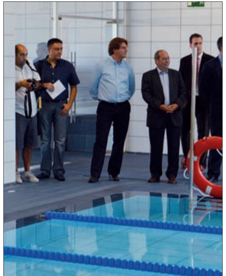
Visita del alcalde a Forus tras la finalización de las obras