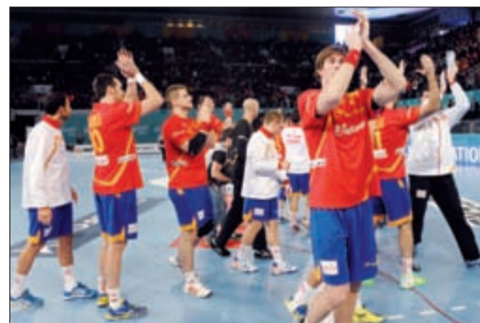
La Caja Mágica ha vibrado con los partidos de España HANDBALL2013

Ajenos a esa tensión competitiva, los clubes de la Liga Asobal siguen con interés y cierto temor el desarrollo del campeonato. Este es el caso del Balonmano Atlético de Madrid que ya lamenta la lesión del internacional polaco Mariusz Jurkiewicz. El lateral sufrió una rotura en su mano derecha y se espera que esté alejado de las canchas entre seis y ocho semanas. Sin duda, una baja notable para el equipo de Talant Dujshbaev.