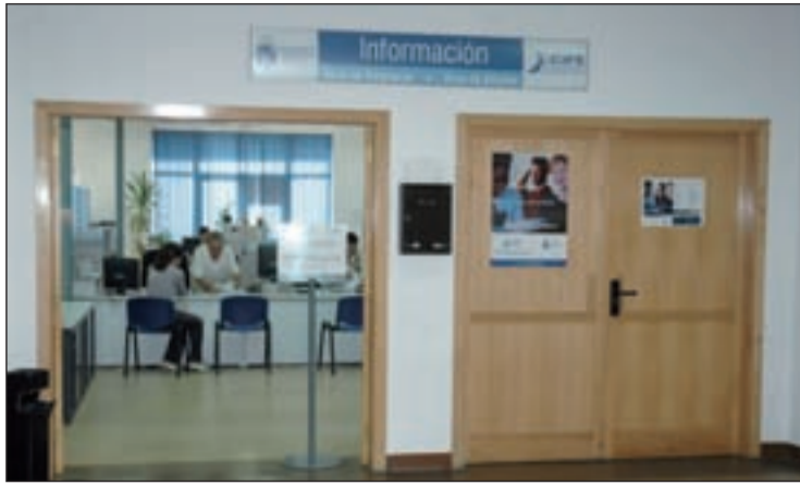
Oficina del Centro de Iniciativas para la Formación y el Empleo

EMPRESAS CONTRATACIÓN DE PARADOS FUENLABREÑOS