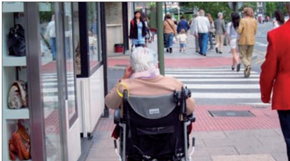
Los mayores y dependientes cuentan con una pulsera que les comunica con un servicio telefónico