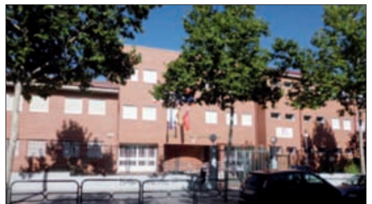
Fachada del IES Barrio de Loranca

El instituto apostó por el francés desde el año 2006 y además es bilingüe en inglés desde hace un par de años.