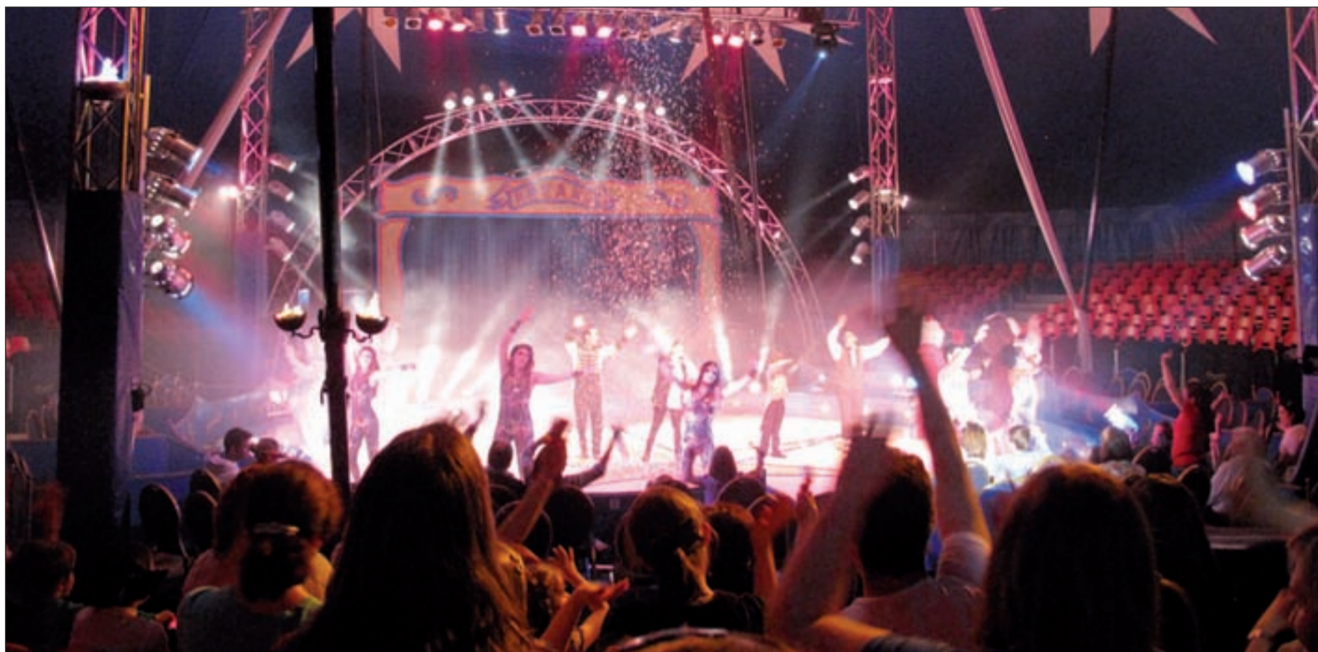
Imagen del espectáculo de Teresa Rabal