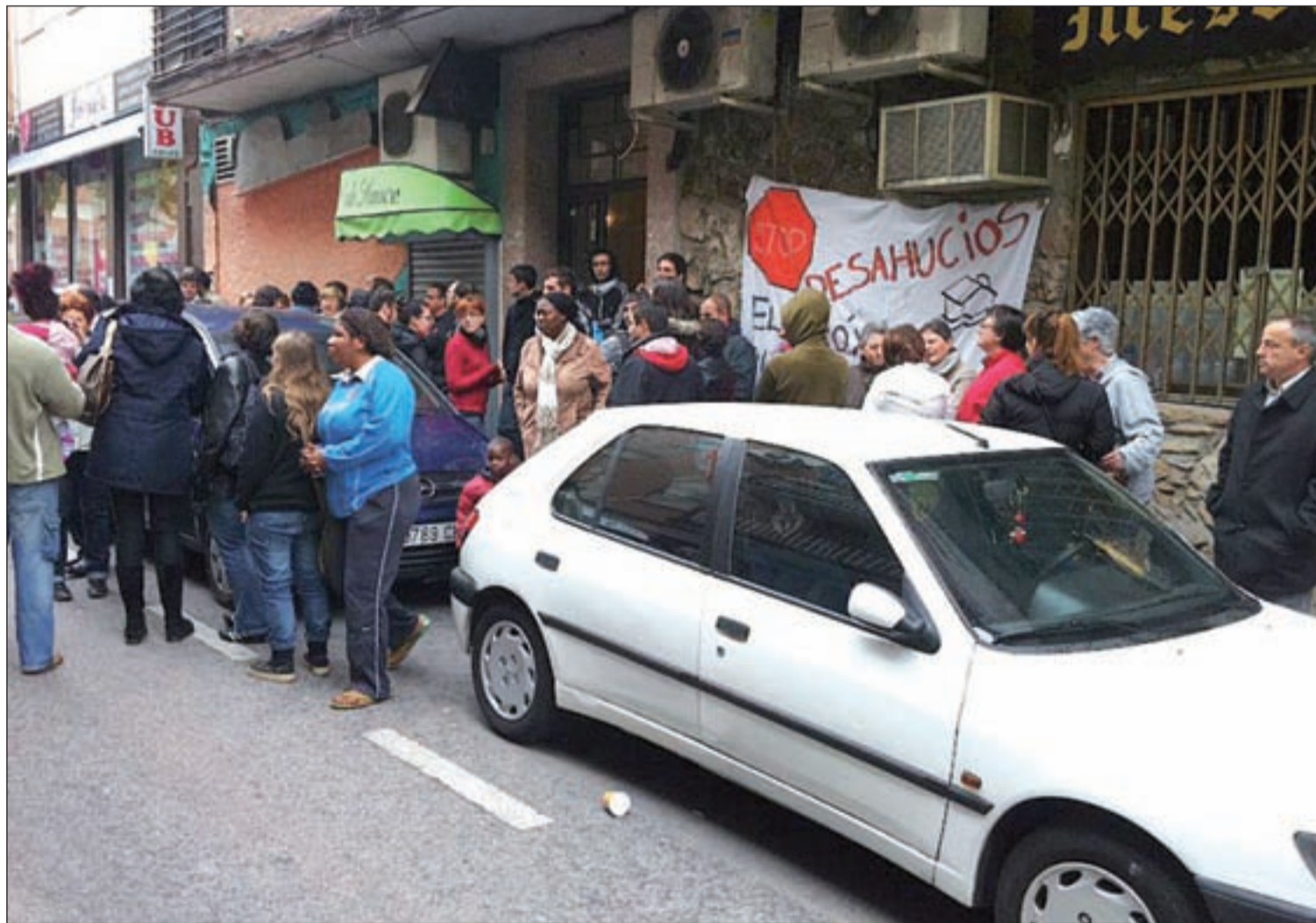
Protesta para evitar un desahucio en el municipio

Los afectados deben acudir a Consumo, donde actúan de mediadores y les derivarán a las distintas áreas • El colectivo 15M critica la falta de una oficina física y reclama información concreta Pág. 10