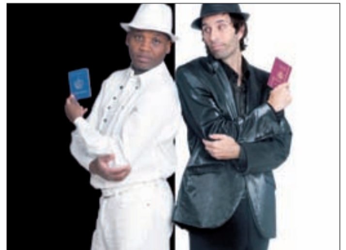
Imagen del espectáculo.

Todos los desempleados que quieran disfrutar del espectáculo tendrán un regalo: la segunda entrada será gratis al presentar la cartilla del INEM.