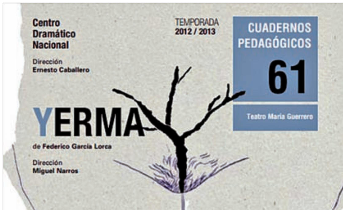
Cartel retirado de los autobuses turísticos para no molestar a los niños

La obra con la que se inaugurará el festival será 'Come dolce quell'ardor'. El turno de los madrileños llegará el sábado 16 de febrero. 'Concerto delle donne' es la pieza que interpretará el conjunto local Hippocampus. Por último, María Espada es otra de las representantes nacionales del festival y presentará 'Dramma in Música' el día 23.