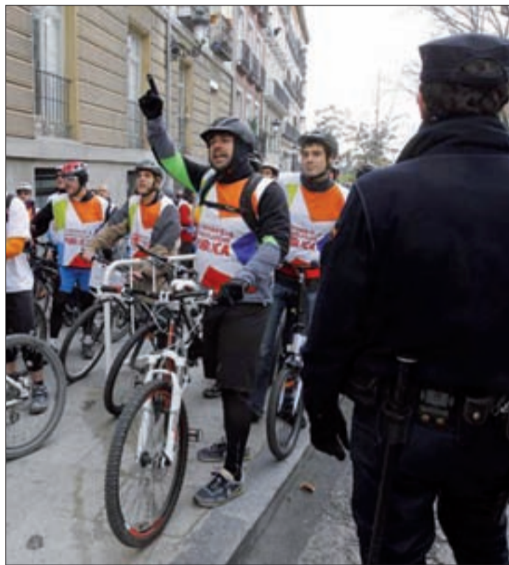
Trabajadores de Telemadrid en una protesta

A su juicio, "no tiene sentido" que Antena 3 o Telecinco, con una media de ocho canales, tengan plantillas de 700 trabajadores y Telemadrid, con apenas un canal, cuente con una plan-