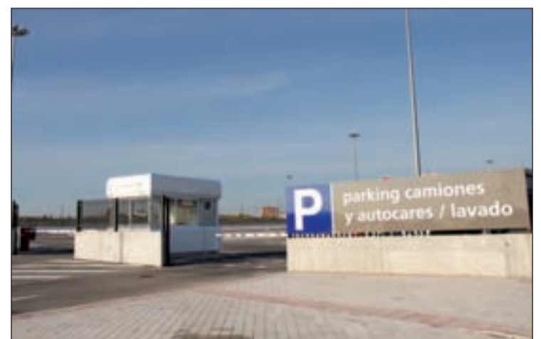
El aparcamiento se encuentra en el Camino del Álamo

"Cumplimos así nuestro compromiso con muchos ciudadanos y entidades vecinales que nos pedían una menor presencia en las calles de la ciudad de este tipo de vehículos de gran to-