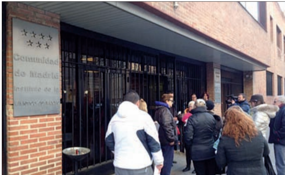
Última concentración de la Plataforma de Afectados por la Hipoteca frente al IVIMA

En las dependencias municipales de Atención al Consumidor se les atiende, se hace un seguimiento de su situación concreta y se les deriva a Servicios Sociales, al Colegio de Abogados para la designación de un abogado de oficio o a Servicios Jurídicos