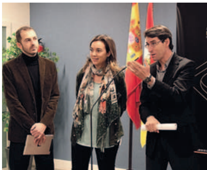
Presentación del ciclo de música.

La programación cinematográfica de 'Actual IMPAR 2013', elaborada por la empresa riojana FC35 Consultores de Cine y la Fil-