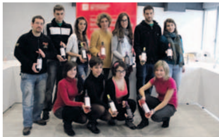
Los alumnos con los vinos.