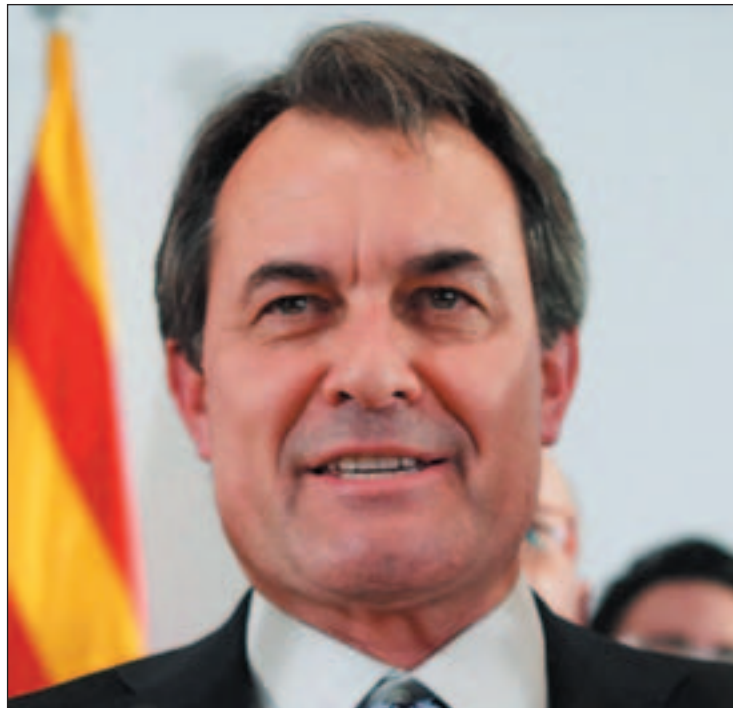
El presidente de la Generalitat, Artur Mas

Artur Mas consiguió cerrar el martes el acuerdo con Esquerra Republicana que le mantendrá en la presidencia de la Generalitat. Y ese pacto llegó a cambio de aceptar algo que en un principio no contemplaba CIU: ponerle fecha a la consulta soberanista. El referéndum será en 2014, como quería ERC, y sólo podrá retrasarse si así lo acuerdan las dos partes. Tres semanas de intensas negociaciones es lo que le ha costado al partido que lidera Oriol Junquera lograr su propósito e imponer la mayoría de sus demandas. "Ha llegado el momento. Tendremos muchos adversarios y muchos de ellos son muy poderosos y actúan sin muchos escrúpulos". Con palabras similares se ha expresado el presidente de ERC sobre la futura consulta. "Pre-