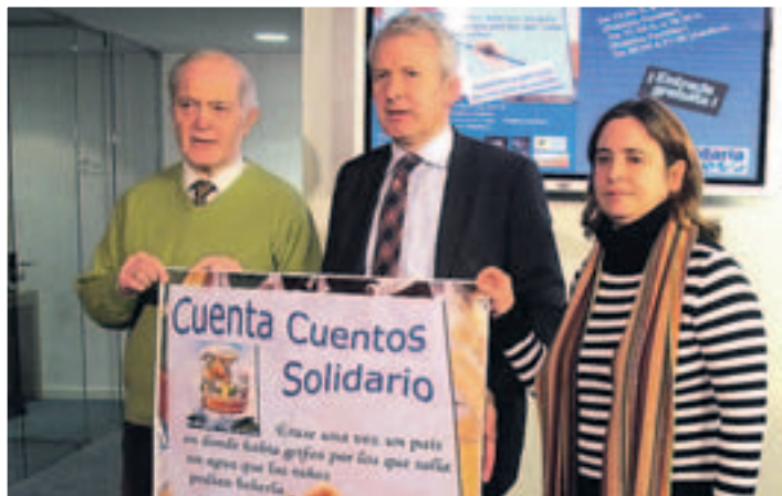
Presentación del Maratón.