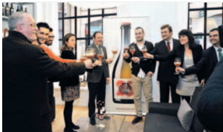
Presentación de la nueva bebida.

La producción, "pequeña todavía", se encuentra actualmente en torno a los 50.000 litros, aunque con las exportaciones podría llegar a duplicarse. En este sentido, ha señalado Pacheco, la I+D está orien-