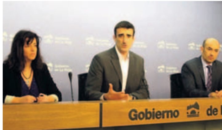
Presentación de los campeonatos.

Gente Los campeonatos universitarios y preuniversitarios arrancaron el pasado 17 de diciembre en el campus riojano con el objetivo de fomentar la actividad física y el deporte entre los estudiantes universitarios y preuniversitarios, favorecer las relaciones interpersonales y el desarrollo de valores como el compañerismo, el respeto a las normas o el espíritu de la superación; y estrechar los lazos entre los estudiantes de la Universidad, los de Bachillerato y los de Ciclos Formativos de Grado Medio y Superior.