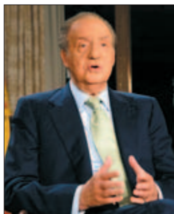
Todos los discursos, en la Red

pués de la renovación de la página web de la institución. Estos cambios en el área de las nuevas tecnologías de momento se quedarán aquí, pues no hay intención de abrirle por ahora ninguna cuenta oficial en la red social Twitter a ningún miembro de la Familia Real.