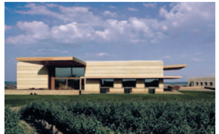
Bodegas Campo Viejo en Logroño.