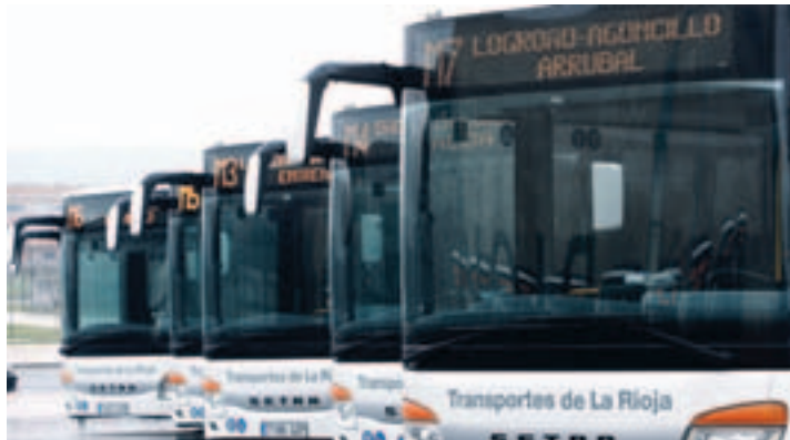
Transporte Metropolitano del Gobierno de La Rioja.

Los días 24 y 31 de diciembre los últimos servicios saldrán entre las 18:25 y las 19:39 desde Logroño y entre las 18:45 y las 19:35 horas del resto de