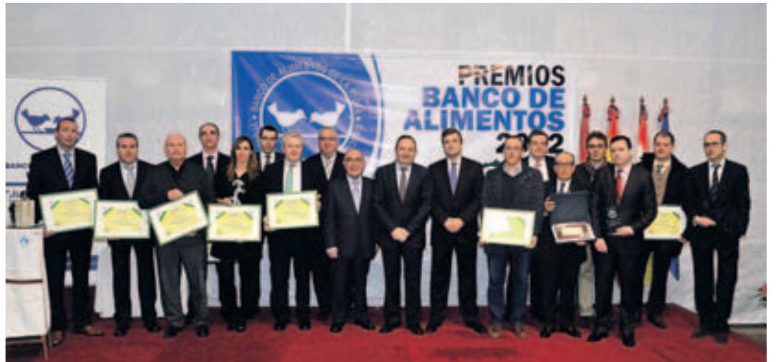
Premiados por el Banco de Alimentos.

El presidente del Ejecutivo riojano, Pedro Sanz mostró su satisfac-