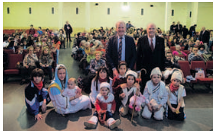
Multitud de público en Jesuitas.