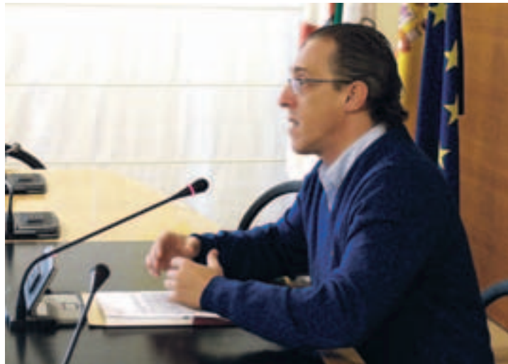
Presentación de las obras.

La obra consiste en la mejora de la urbanización, eliminando las barreras arquitectónicas; remodelando la red de sumideros con una nueva canalización del saneamiento y construyendo una nueva red de agua potable mediante una nueva conducción de fundición dúctil. Además, el proyecto incluye la creación de una nueva canalización de alumbrado público enterrada, la ampliación de la