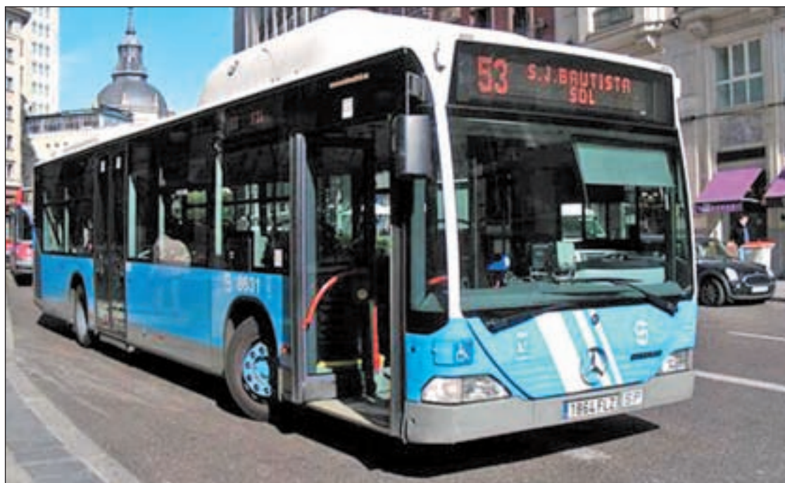
Autobús de la EMT circulando por la capital

La otra cara de la moneda para el SUMMA 112 son los recortes: el dispositivo se queda sin un helicóptero de emergencia según contemplan los presupuestos del Gobierno popular de Ignacio González. El secretario general del PSM y portavoz del grupo socialista, Tomás Gómez, ha denunciado que esta supresión es "un nuevo desastre en materia sanitaria" que hará "poner en riesgo la vida de mucha gente". El Gobierno regional no ha confirmado que esto vaya a ser así.