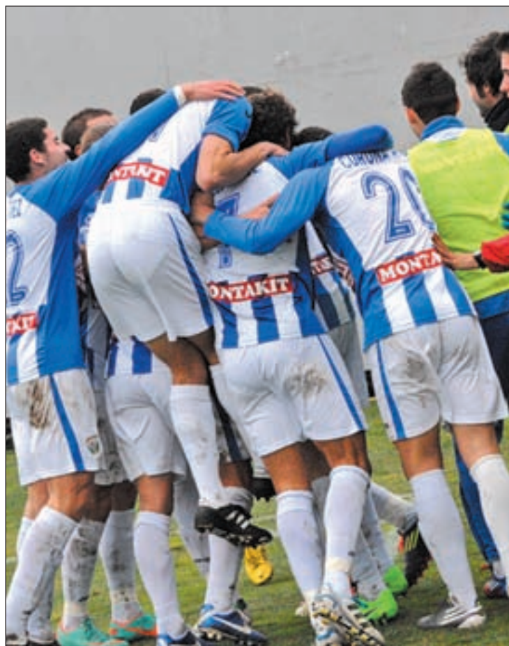
Los pepineros son sextos en la clasificación

Sin embargo, ese mérito no está sólo en manos del Leganés. Los pepineros necesitan hacer sus deberes, es decir, ganar en el campo del Caudal, y esperar a que el cuarto clasificado, el Fuenlabrada, caiga derrotado en su propio estadio ante el Coruxo.