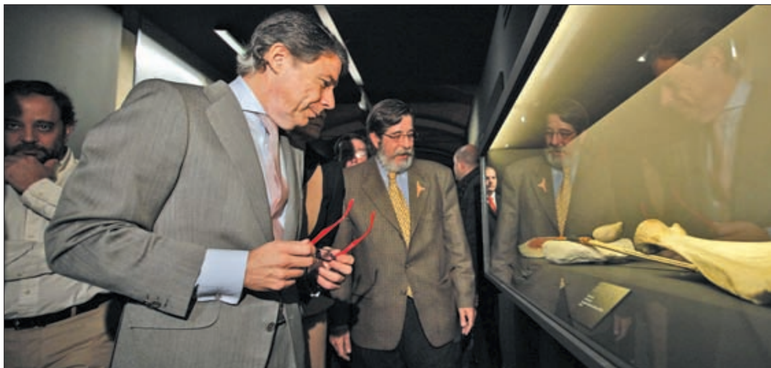
El presidente de la Comunidad de Madrid, Ignacio González, durante la inauguración de la exposición