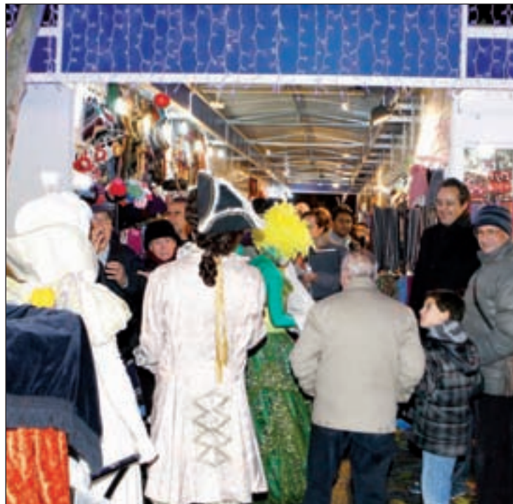
El Mercado de artesanía está en Fuente Honda

Los eventos deportivos de estas fechas también tendrán carácter solidario, y así el Torneo de Navidad de Karate (22 de diciembre en el Pabellón Europa),