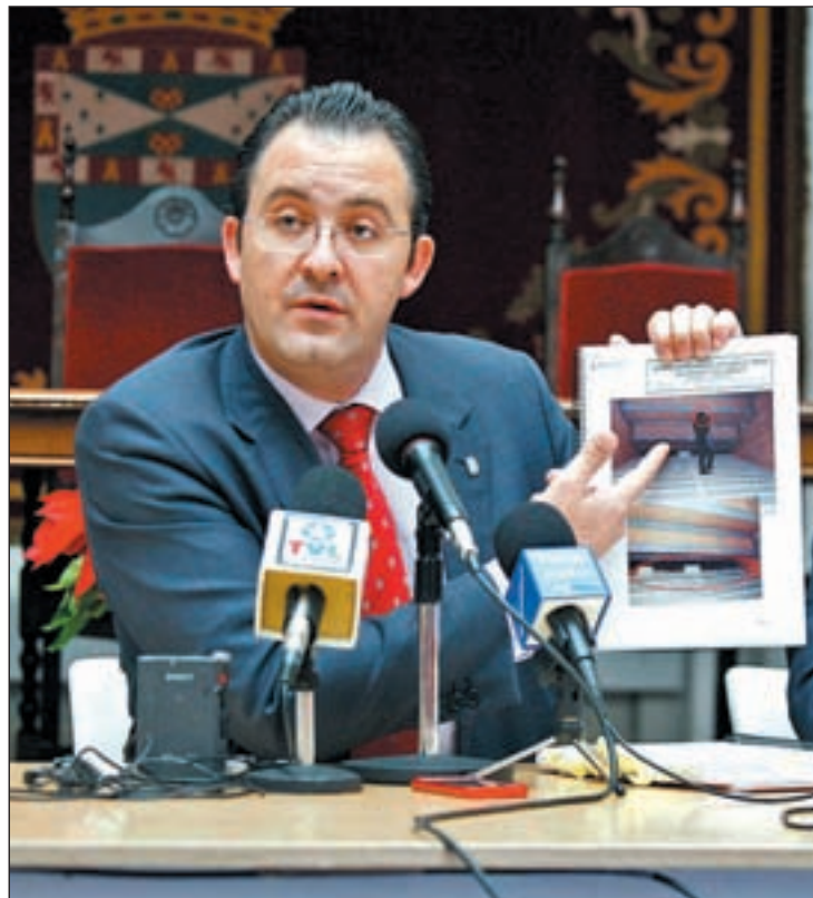
El alcalde muestra el informe de la inspección en rueda de prensa

La inspección se llevó a cabo los pasados días 12 y 13 después de que el empresario de 'Asuntos