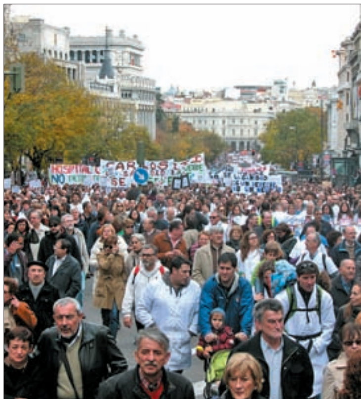
Miles de personas se manifestaron el domingo en la capital