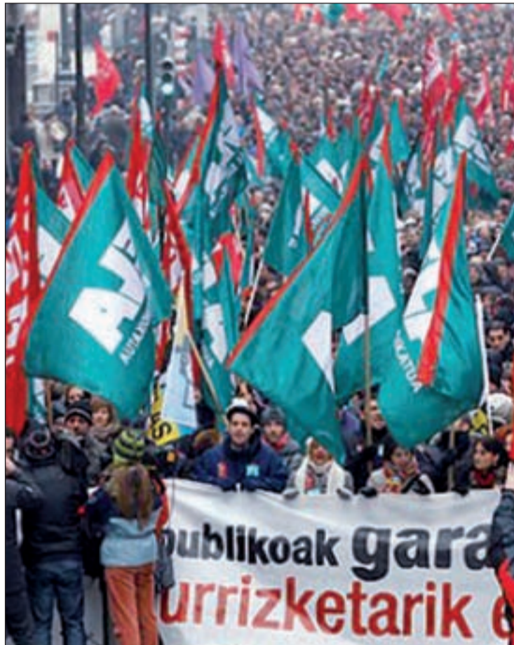
Los funcionarios vascos no cobrarán la paga extra

El Gobierno decidió recurrir el pago de la extra de Navidad des-