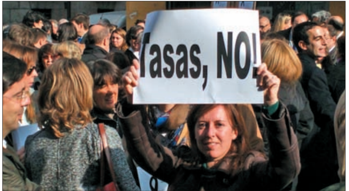
Las protestas se han sucedido en los últimos días en varios puntos de España