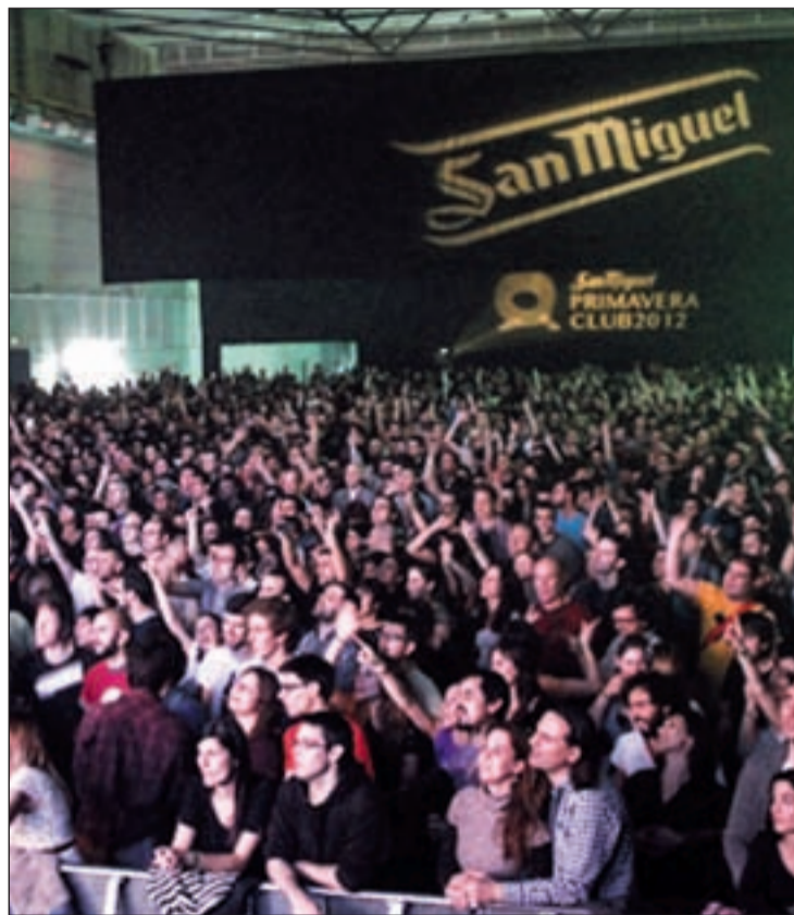
Aistentes a la edición celebrada la semana pasada en Madrid

Los amantes del Festival Internacional de Benicàssim (FIB) pueden respirar tranquilos porque este espectáculo al aire libre se celebrará el próximo año. Los seguidores se temieron lo peor cuando unos rumores apunta-