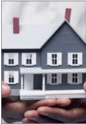
Pocos cambios en este sector