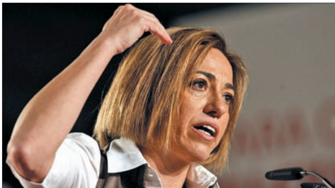
La diputada del PSC, partidaria de un cambio en la dirección de su partido

En virtud del acuerdo, los sindicatos con representación en el ferrocarril logran desbloquear la negociación de los nuevos convenios colectivos de las tres sociedades ferroviarias públicas. Asimismo, consiguen un compromiso de mantenimiento del empleo en el ferrocarril por parte del Ministerio de Fomento. Este Departamento garantiza la participación de los representantes en la reestructuración que prevé realizar en los servicios de trenes regionales.