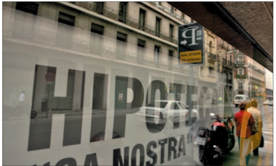
El índice da un respiro a los bolsillos de los hipotecados