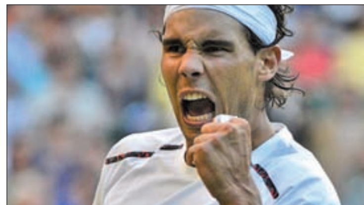
El balear jugará un torneo de exhibición

rado desde el pasado mes de junio, cuando fue eliminado por el checo Lukas Rosol en la segunda ronda de Wimbledon, por una lesión en su rodilla izquierda. Junto a él, también estarán en Abu Dhabi el alicantino David Ferrer, que se medirá al checo Tomas Berdych y el número uno, el serbio Novak Djokovic.