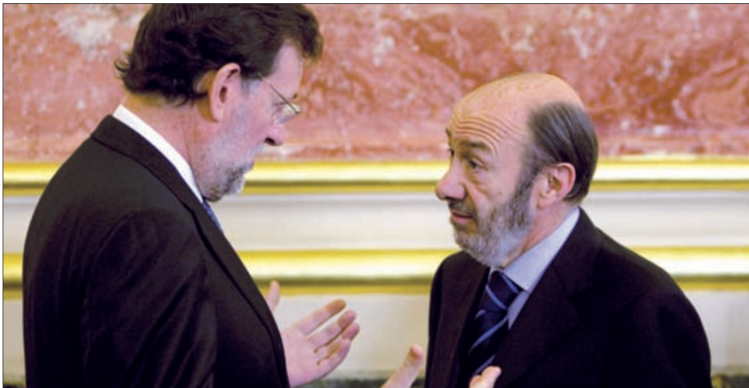
Gobierno y oposición han vuelto a tener un enfrentamiento dialéctico a causa del déficit