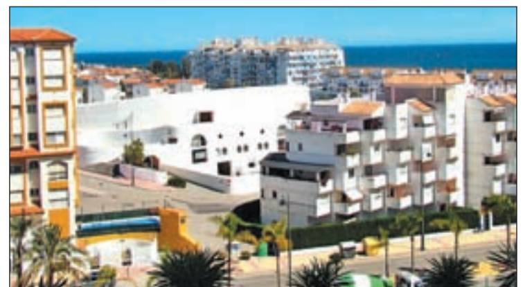
Mercado emergente en España

Triángulo de Oro-Marbella, Estepona y Benahavís-lo cual puede ser el "inicio de diferentes negocios". Para fomentar las alianzas con este mercado emergente, un grupo hotelero ha cedido de manera gratuita un suelo de su propiedad, de 700 metros cuadrados, para la construcción de una iglesia ortodoxa.