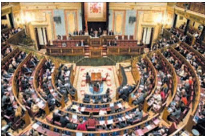
Los gastos oficiales, al alcance de los ciudadanos

Para el cálculo de las dietas, se tomará como referencia la hora de salida de los vuelos desde el aeropuerto de Madrid y la hora de llegada de los mismos a Barajas "con independencia de la hora a la que se requiera la presencia en el aeropuerto". El mismo criterio se aplicará en los desplazamientos a través de otros medios de transporte.