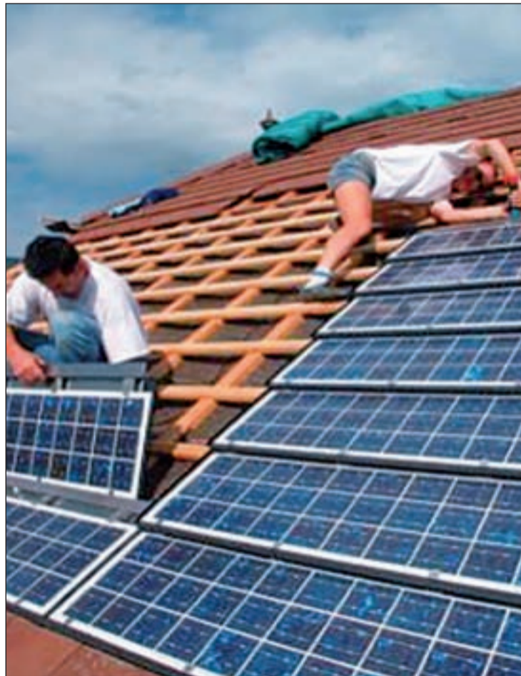
Las placas solares son una buena fuente de aprovisionamiento

Sin embargo, son muchas las comunidades de vecinos que residen en viviendas de construcción anterior a la legislación que obliga a la implantación de placas solares. Para ellas, la salida pasa por controlar minuciosamente los aislamientos de sus hogares y así evitar una posible