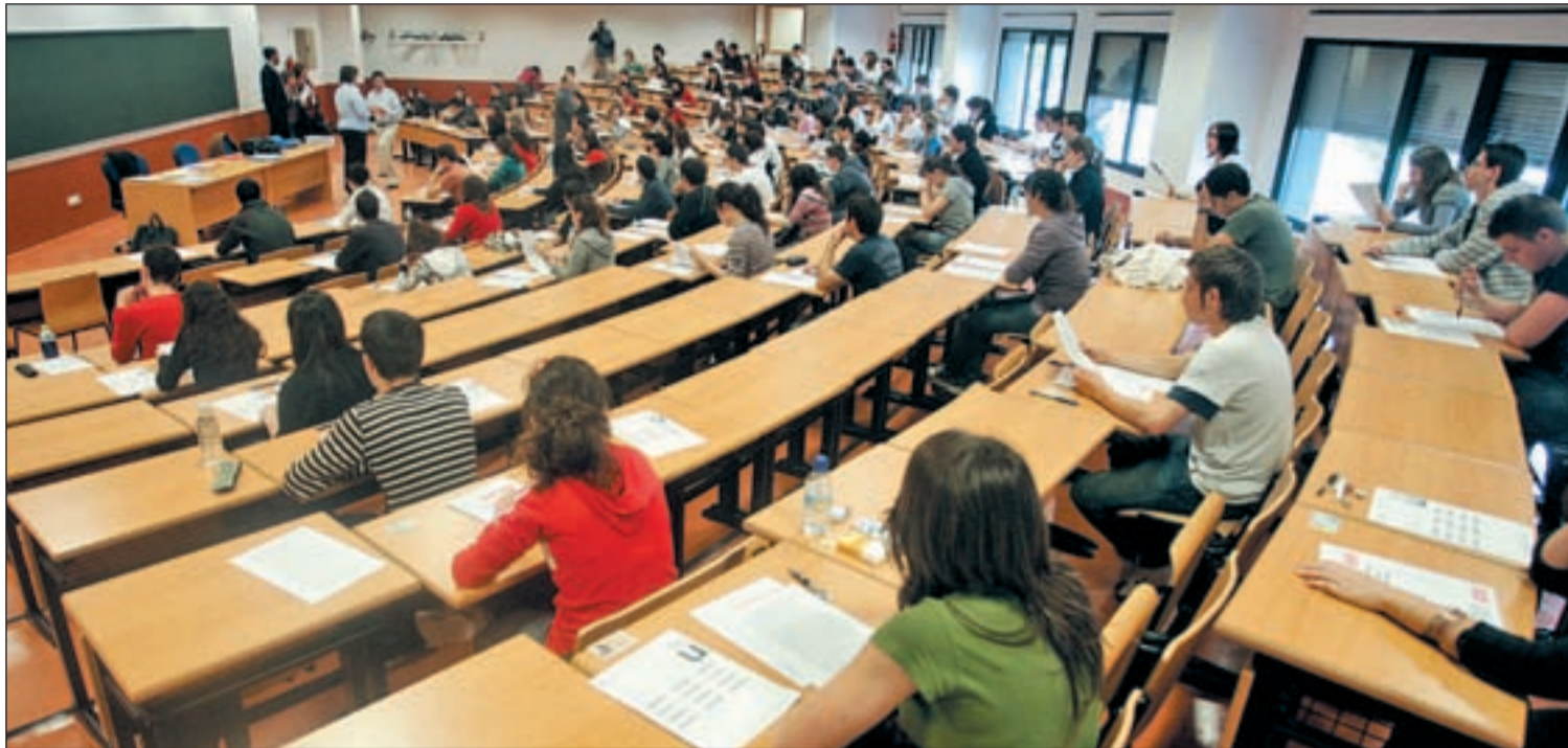
Las universidades también protestan por las políticas de recortes