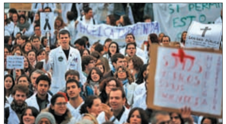
Los facultativos especialistas también se sumaron a las protestas

mo turno y de este lunes, cuando se retomó la huelga indefinida interrumpida por el puente de la Constitución. Este lunes el seguimiento se situó en el 23,68 por ciento, durante el mismo turno. El paro indefinido de los facultativos especialistas ha coincidido con huelgas de 48 horas de todos los trabajadores.