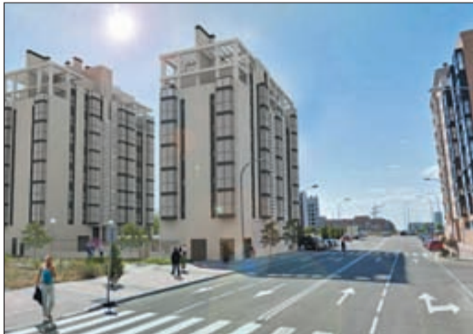
El Ensanche de Vallecas, emplazamiento de varias viviendas

Por otro lado, este grupo también oferta unas fantásticas viviendas ubicadas en la calle Méndez Álvaro, propiedad de Anida Operaciones Singulares SL. Con muy buenas conexiones, la promoción, que se encuentra en fase de construcción, consta de 109 viviendas con trastero 154 plazas de garaje y local comercial. Se distribuyen en 2 sótanos, semisótano, 7 plantas sobre rasante y 2 plantas ático.