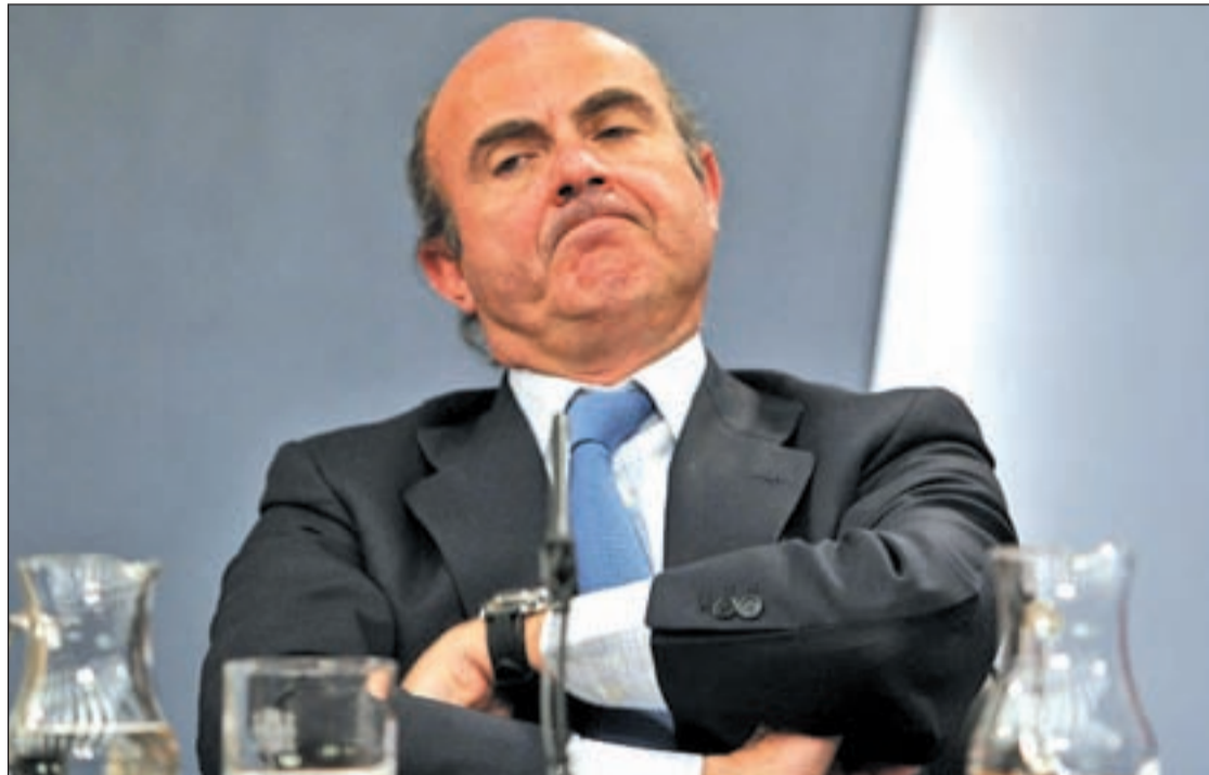
El ministro de Economía y Competitividad, Luis de Guindos

La primera mala noticia vino del informe semestral de los economistas de la Organización para la Cooperación y el Desarrollo Económico (OCDE). La peor parte del desastre se la lleva el mercado laboral. Las previsiones de la OCDE apuntan a que el desempleo cerrará 2012 en el 26,3 por ciento, lo que, con la población activa actual, ya supondría superar el listón de los seis millones de parados. Pero aunque se evitase ese nivel en este trimestre, el paro, seguirá subiendo el año que viene, cuando tanto la tasa media como la de