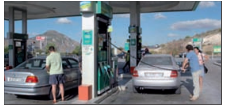
Llenar el depósito del coche sale un poco más caro GENTE

un 3% por encima del precio de hace un año. Tras las nuevas subidas, los precios de la gasolina y del gasóleo siguen en niveles parecidos, apenas separados en 2,4 céntimos, algo que no se daba desde comienzos de año.