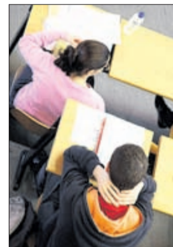
Las becas Erasmus peligran

Esta deuda podría saldarse con el presupuesto de 2013, pero