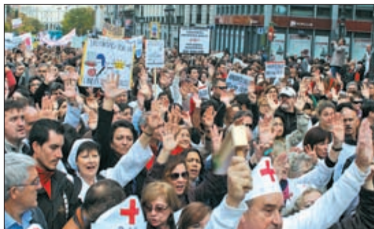
Los trabajadores de Sanidad se echaron a la calle

Esta manifestación fue el punto y final de la segunda jornada de huelga sanitaria convocada por los sindicatos presentes en la Mesa Sectorial. Los dos días de huelga transcurrieron con el cumplimiento de los servicios mínimos y con la habitual guerra de cifras entre Comunidad y convocantes. Éstas se refieren tanto al personal sanitario como no sanitario de los hospitales y centros de salud de la región madrileña. Los sindicatos con-