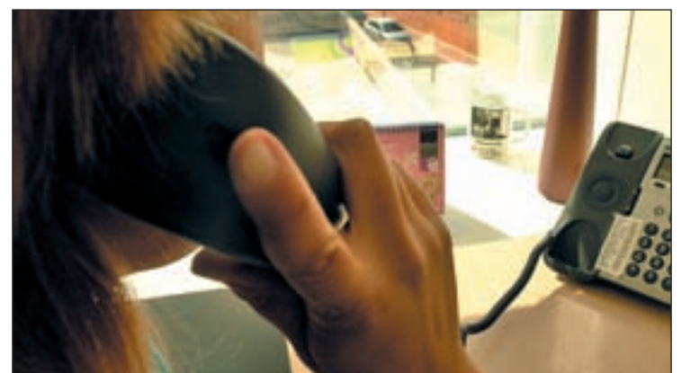
La violencia de género, asignatura pendiente

go cada uno vamos en una dirección distinta—ha precisado el secretario de Estado de Servicios Sociales e Igualdad, Juan Manuel Moreno—. Hemos llegado a un principio de acuerdo con la Comunidad Autónoma de La Rioja para aglutinar todos los recursos públicos y trabajar en la misma dirección”. Respecto al uso del 016 los datos arrojan datos esperanzadores e indican que tiene casi 5.000 llamadas mensuales de mujeres que buscan ayuda o asesoramiento.