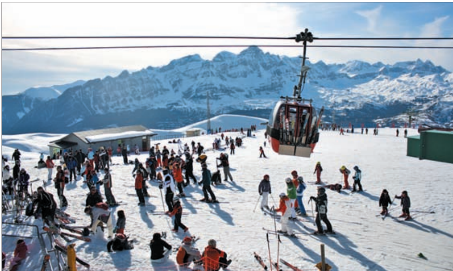
Los amantes de los deportes de nieve tienen a su alcance una oferta de lo más variada

LAS ESTACIONES DE ESQUÍ PRESENTAN SUS APUESTAS PARA LA NUEVA CAMPAÑA