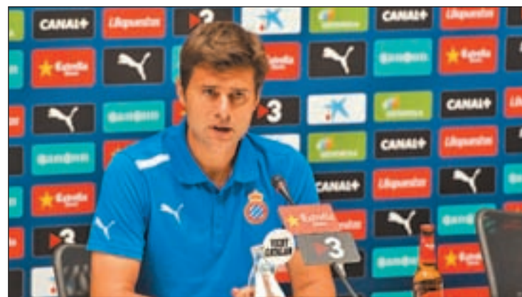
El argentino abandona el club barcelonés tres años después