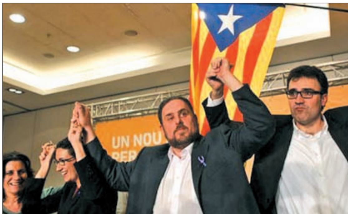
El líder de ERC, Oriol Junquera, durante la celebración el pasado domingo

sas y del coste de abogado y procurador. Además, el ministro de Justicia ha considerado "profundamente insolidaria" e "insuficiente" la petición formulada por la diputada socialista Carmen Montón para que las mujeres maltratadas no paguen tasas judiciales en procesos civiles, como casos de separación y divorcio.