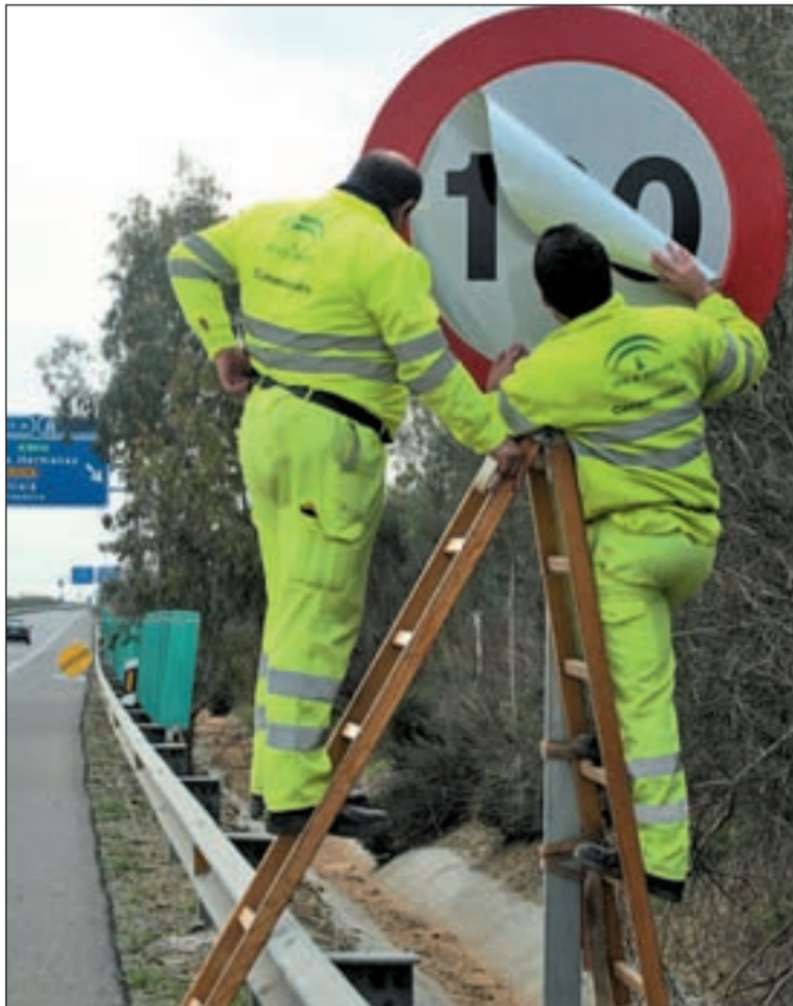
Actualmente el límite de velocidad está fijado en 120

Los conductores dan el visto bueno a esta propuesta. Concretamente, nueve de cada diez