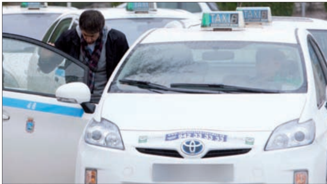
La lluvia de estos días no ha supuesto, como era habitual, muchos más pasajes para los taxistas.