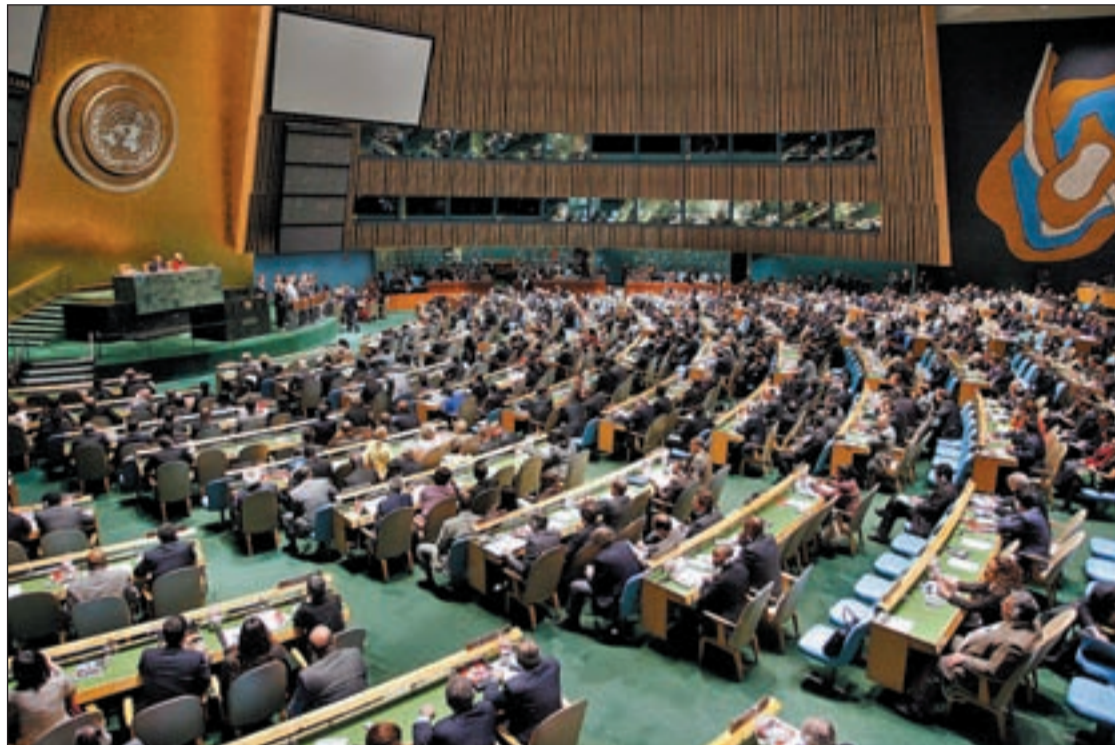
La votación dejó un acuerdo histórico en torno a Palestina

Los días previos a la votación han sido momentos de incertidumbre debido a las posiciones