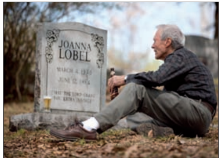
Una escena del film.

Exposición de la historia del abastecimiento al municipio de Santander desde 1874 hasta nuestros días y conocer cómo se desarrolla el ciclo del agua desde que se capta en las montañas del interior de la región hasta que es devuelta al Mar Cantábrico. Lugar: Museo del Agua de Santander (Pronillo. 39007, Santander. Tel.: 942 357 399). Precios: Gratis.