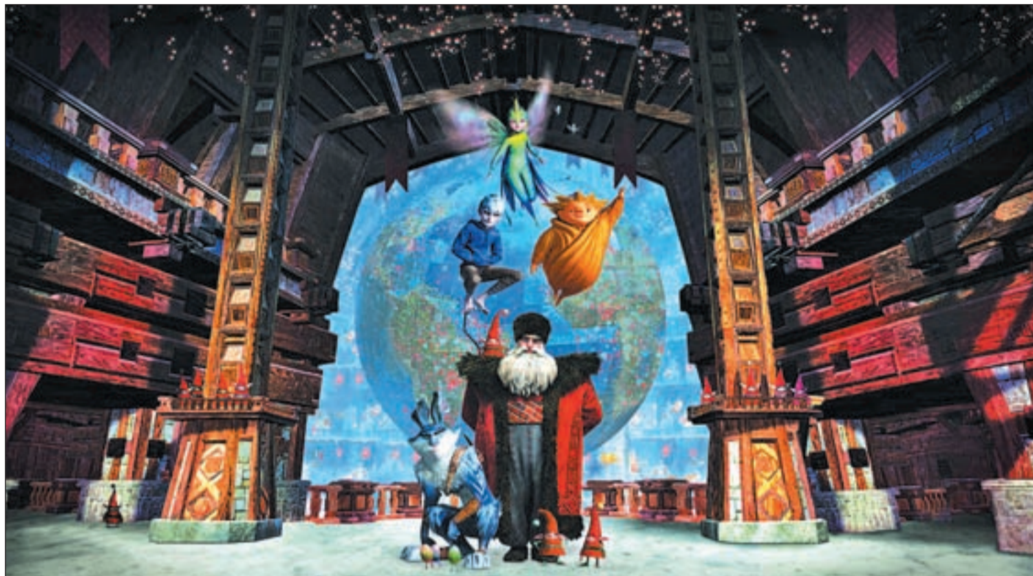
Un fotograma de la película "El origen de los Vengadores"