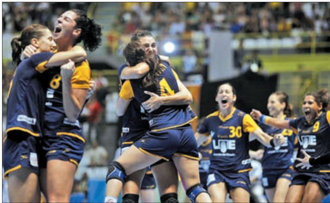
Alemania, Hungría y Croacia serán los primeros rivales de las internacionales españolas