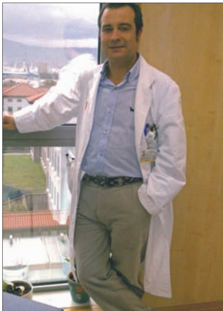
El doctor en su despacho de Valdecilla. GENTE

una veteranía y por tanto un programa con experiencia gracias a la labor de los médicos que han pasado por aquí. Además, aquí se hacen todo tipo de pruebas técnicas y procedimientos en esta materia lo que quiere decir que ningún hospital del mundo está por encima, habrá muchos que estén igual que nosotros pero no por encima.