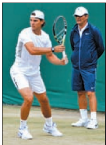
El balear sigue en el dique seco

Sobre su proceso de recuperación, Nadal fue claro: "El objetivo ha sido intentar que la rotura parcial del tendón se recuperara, el proceso ha sido algo más lento, pero seguimos unos plazos en que todos estamos contentos. Mi objetivo es volver a jugar lo antes posible, pero empezar con la certeza de que la lesión está recuperada y que puedo volver a disfrutar del tenis", comentó.