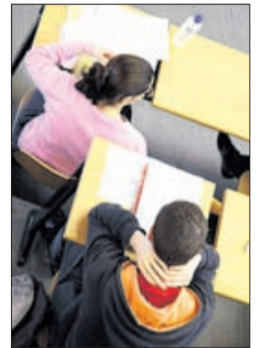
Las becas Erasmus peligran

Esta deuda podría saldarse con el presupuesto de 2013, pero