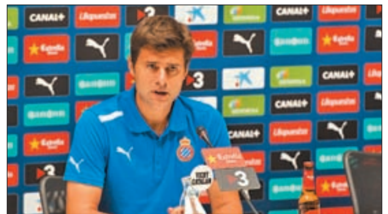
El argentino abandona el club barcelonés tres años después