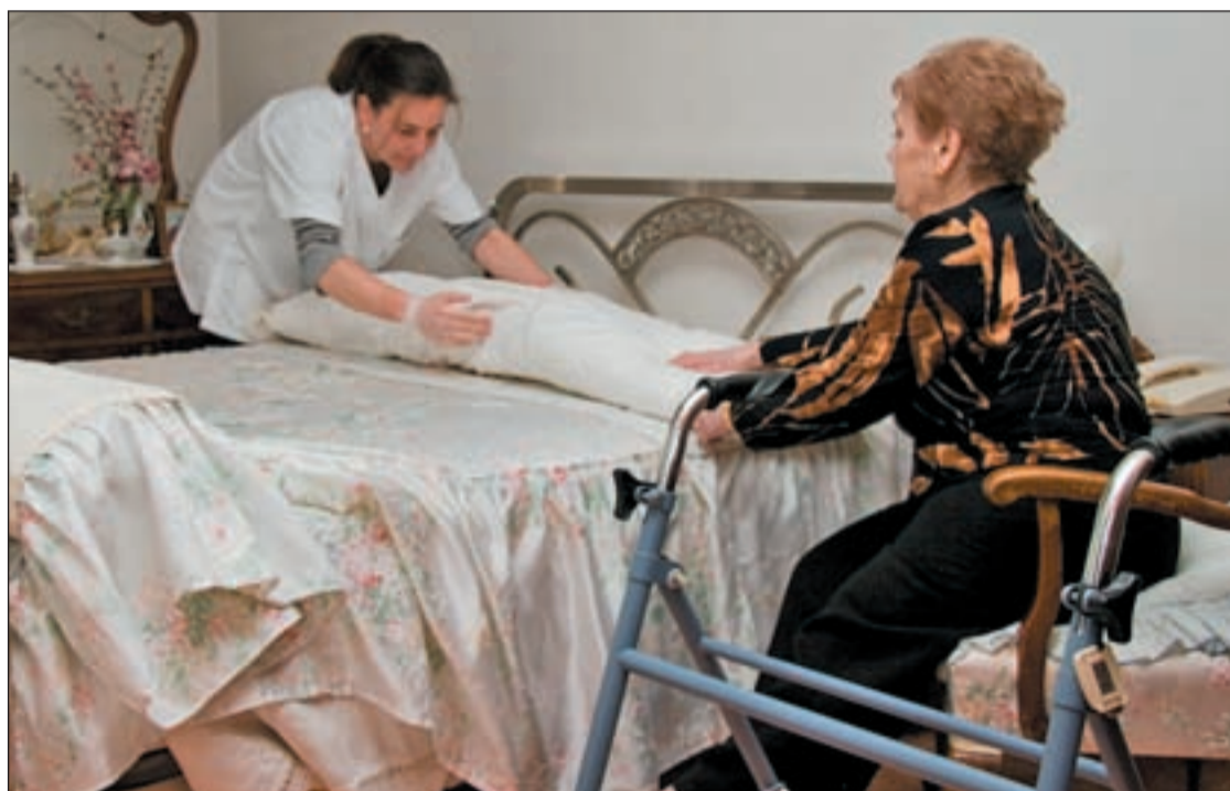
El Gobierno ha recortado 3.300 millones de euros en la Ley de Dependencia

En España hay más de cuatro millones de personas con algún tipo de discapacidad, lo que representa un 10 por ciento de la población. Los recortes sufridos en los Presupuestos Generales del Estado dejan a este colectivo desamparado y sin ningún tipo de protección. Las ayudas se reducen y con ellas, la capacidad de estas personas de integrarse en la sociedad y “la posibilidad