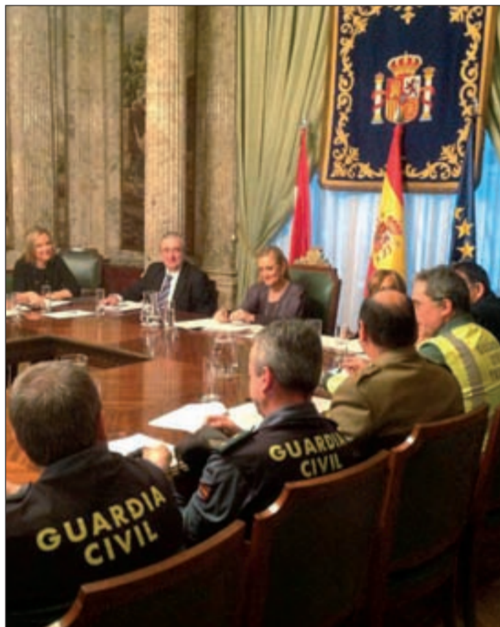
La delegada del Gobierno en la Mesa Técnica del Plan

Por otro lado, el texto recoge los puntos donde se situarán las zonas para estacionamiento de vehículos en el caso del cierre o de restricciones en el tráfico y los centros de conservación y explotación donde se ubican las máquinas quitanieves y otros equipamientos. A este respecto, hay