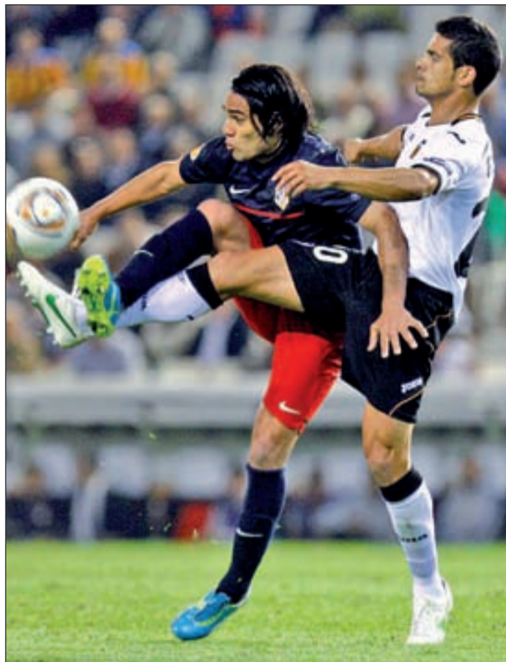
Falcao suma ya diez goles en el campeonato

Lo que sí juega en contra del Atlético es la estadística, que dice que lleva sin ganar en Liga en Mestalla desde el año 2003.