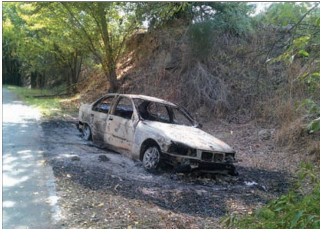
Las dependencias del parque son el lugar elegido para calcinar vehículos robados AVIB

"Lo que podría ser un entorno privilegiado dentro del núcleo urbano de Madrid, se está convirtiendo poco a poco en un espacio degradado y abandonado tanto por la falta de mantenimiento del Ayuntamiento de Madrid como por las actuaciones promovidas desde distintas administraciones", denuncia la asociación.