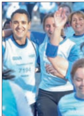
V Edición de la Carrera Solidaria

la iniciativa 'Educar niños', cuyo objetivo es escolarizar a 5.000 niños y niñas refugiados de 12 países africanos. Por su parte, BBVA aportará 60.000 euros. Tanto la salida como la meta se encontrarán en el Paseo de la Castellana 81, junto a la Torre de BBVA. Por otra parte, la competición contará con dos recorridos diferentes, uno más breve de 5 kilómetros y otro más largo de 10 kilómetros.