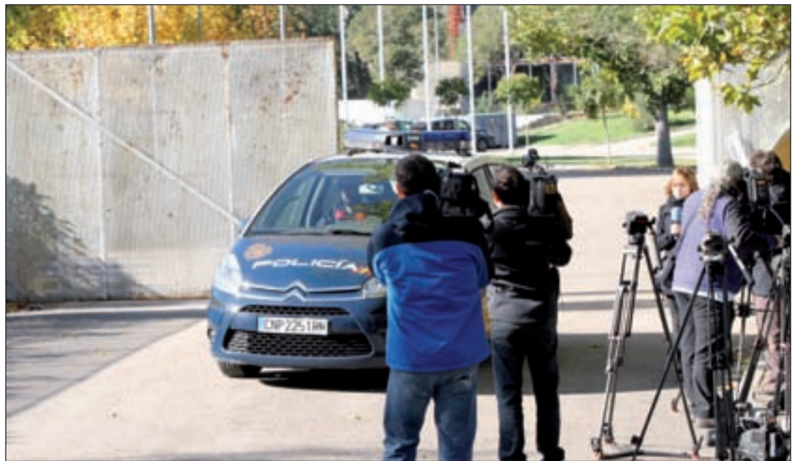
La Policía Nacional investiga lo ocurrido en el pabellón, que acogía 'Thriller Music Park'

del PP, que dice que los diputados de la Asamblea tendrán que hacer una declaración notarial de bienes al llegar y dejar su escudo para ver si se ha producido un enriquecimiento ilícito en su etapa como parlamentarios. Los socialistas consideran esta iniciativa un "ejercicio de cinismo" ya que los diputados podrían mentir al declarar ante notario.