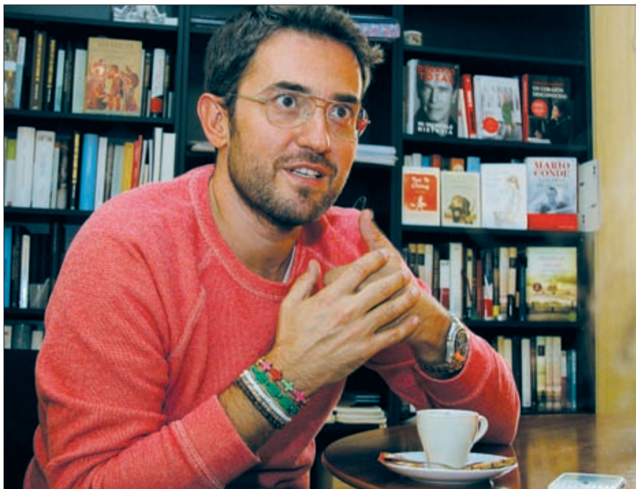
Màxim Huerta durante la entrevista

creo en el azar absolutamente, en el destino y en la casualidad. ¿Alguna vez no has hecho una locura y te has arrepentido? Me he arrepentido mucho de no haber hecho locuras y me hu-