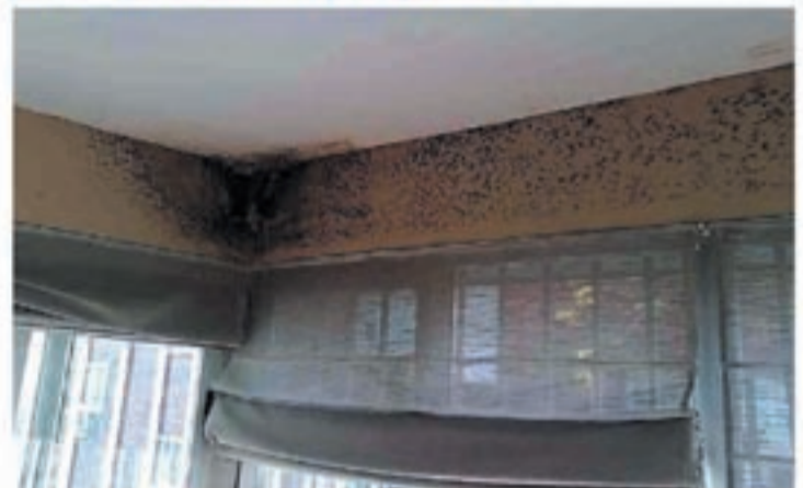
Problemas de humedades por condensación