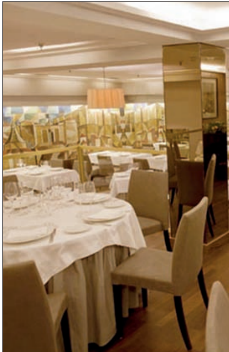
Imagen parcial del restaurante 'El Café de Ópera', uno de los participantes