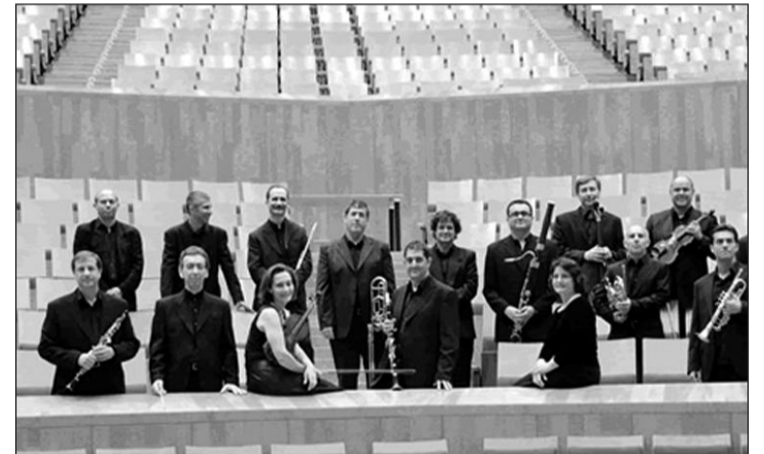
Uno de los grupos participantes en el festival

Los conciertos empiezan a las 12 horas y la entrada será gratuita hasta completar aforo. Los pases podrán recogerse en la puerta media hora antes de que comience la representación.