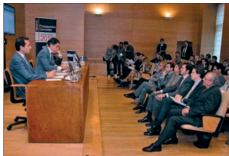
El equipo de Gobierno acompañó al presidente

Finalmente, las Brigadas Especiales de Seguridad Ciudadana, las conocidas BESCAM, se ven afectadas en el presupuesto y es que el Gobierno regional quiere que se dediquen tan solo al obje-