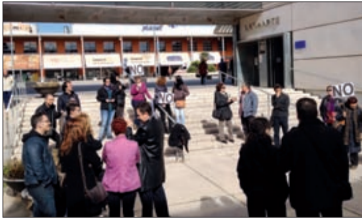
Trabajadores municipales, a las puertas de la Junta de Latina LUCA JIMÉNEZ

CONTRA LA MODIFICACIÓN DE SUS CONDICIONES LABORALES