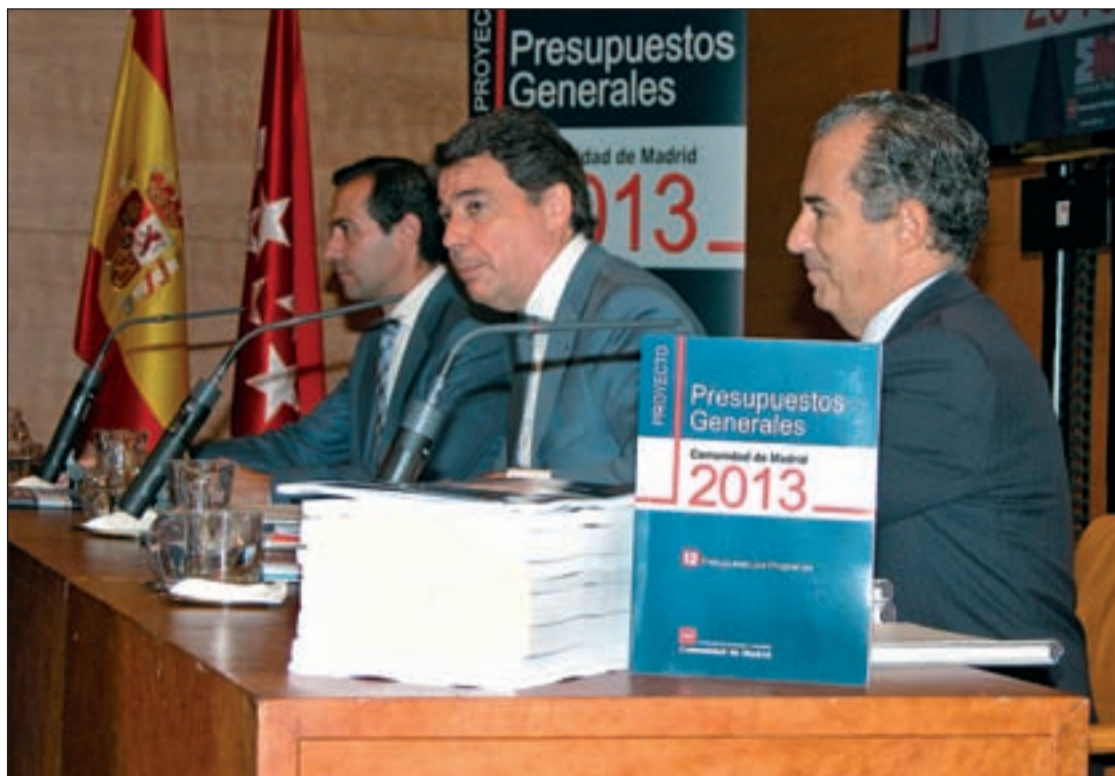
El presidente de la Comunidad junto al portavoz del Gobierno y el consejero de Economía