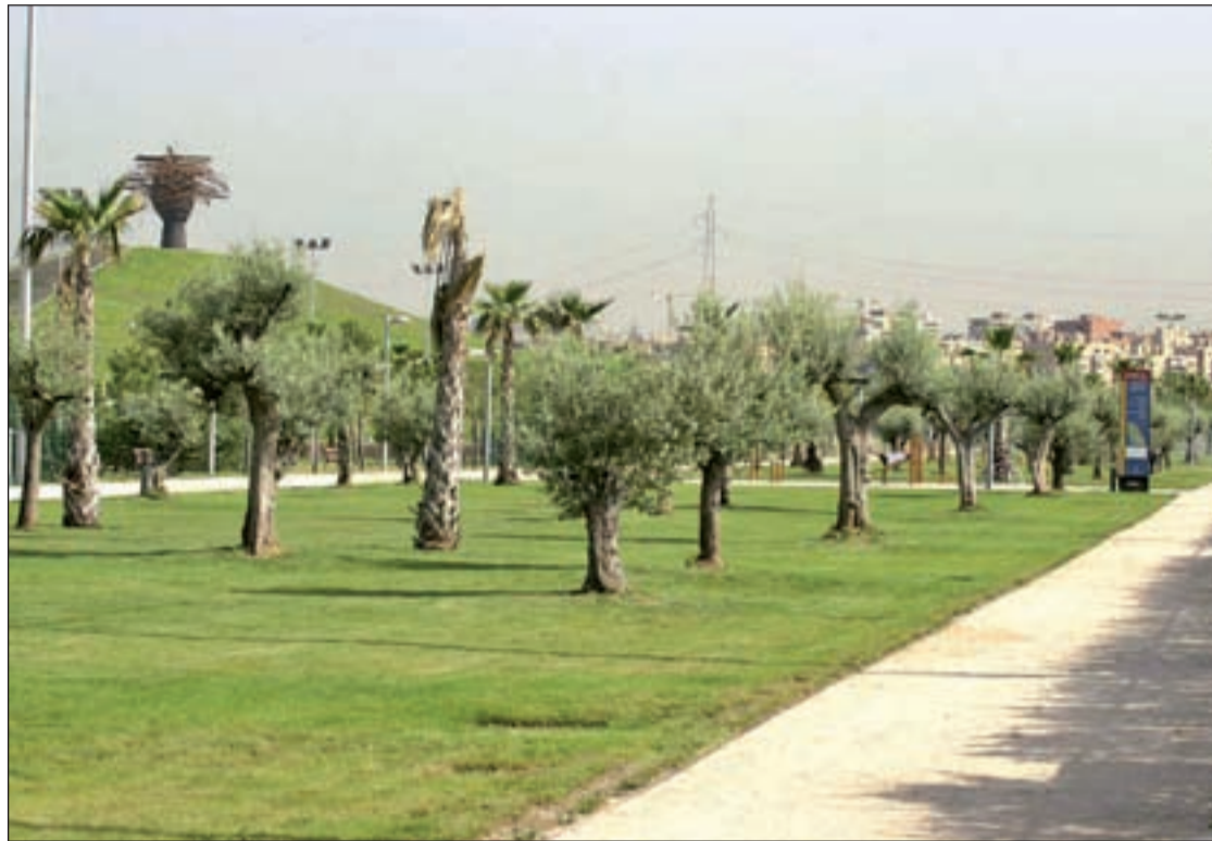
El parque del Manzanares es uno de los lugares elegidos para desarrollar el programa

En Carabanchel, el lugar elegido ha sido el parque Eugenia de Montijo y la cita semanal es en las pistas deportivas del entorno natural. Por su parte, en el vecino distrito de Latina, la actividad transcurre en la Cuña Verde. El punto de encuentro está fijado en la parada de Metro de Laguna. Dos son las opciones que tienen los vecinos de Usera para