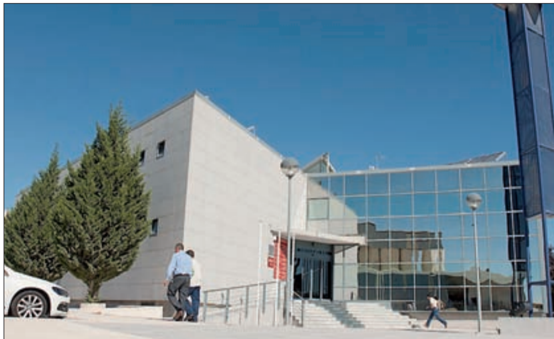
Entrada del Centro de Empresas de Valdemoro