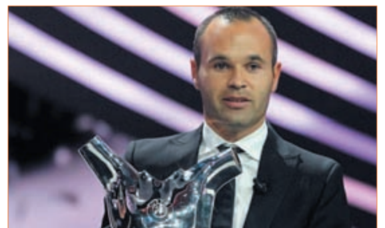
Iniesta ya se alzó con el título de mejor jugador de la UEFA

Los cuatro candidatos estarán seguramente sobre el césped del Camp Nou, después de confirmarse la recuperación del '8' azulgrana, en la que será una de las últimas gran citas futbolísticas antes de que se conozca el nombre del ganador.