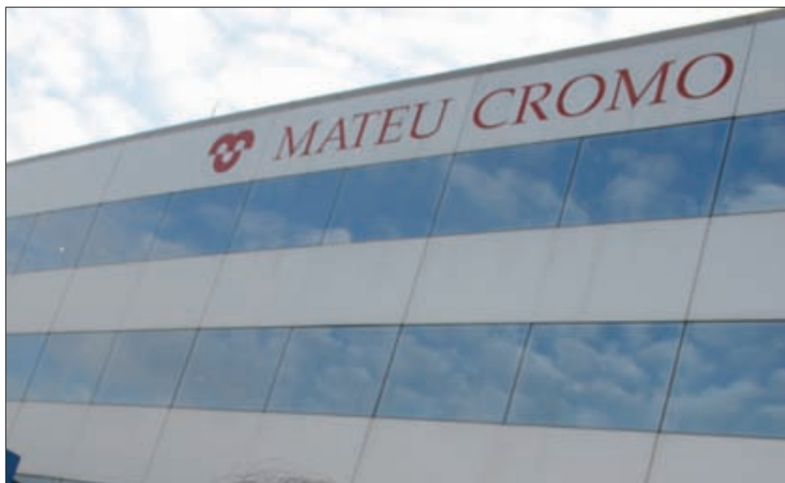
Imagen de archivo de la planta de Dédalo Offset en Pinto

El permiso remunerado de los 190 empleados de Dédalo en Pinto termina el lunes 8, aunque Benítez supone que se prolongará otra semana más hasta que se pueda hacer el cierre definitivo.