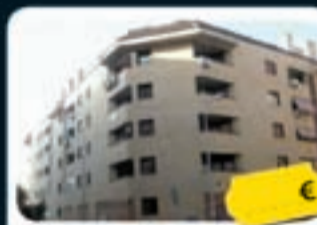
Parla La Presa, 1

Precio actual desde 82.200 € Ref. 10601844