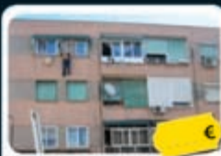
Parla Pablo Casals, 5

Piso de 74 m 2 con 3 habitaciones y 1 baño. Exterior.