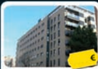
Valdemoro Andalucía, 10

Pisos de 95 m 2 a 114 m 2 con parque y calefacción. Disponen de parking, trastero, piscina comunitaria y zona deportiva.