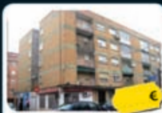
Parla Aranjuez, 9

Piso de 80 m 2 con 3 hab., 1 baño, terraza, tendedero y calefacción. Está situado en la cuarta planta de un edificio con ascensor.