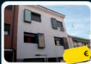
Pinto San Vicente, 16

Precio actual desde 84.000 € Ref. 73105631