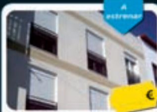
Parla Olvido, 1

Estudios y dúplex de 30 m 2 a 63 m 2 con 1 o 2 hab. Con buenas calidades, cocina amueblada, armarios empotrados y calefacción.