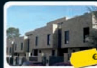
Valdemoro La Rioja, 3A

Pisos de 246 m 2 a 262 m 2 con 4 habitaciones, 3 baños, 1 aseo y terraza. Situados en una zona consolidada de la localidad.