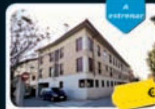
Pinto Fernando VII, 4

Pisos y dúplex de 58 m 2 a 97 m 2 con 1 o 3 hab. y 1 o 2 baños. Disponen de buenos acabados y ascensor.