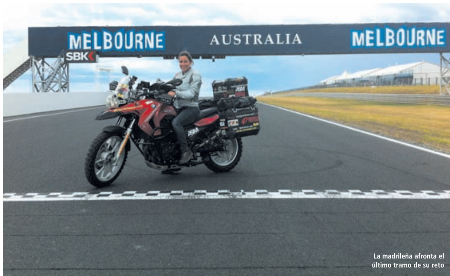
La madrileña afronta el último tramo de su reto