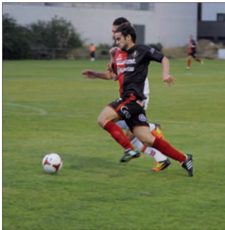
Los de Agustín Vara se llevaron el triunfo de Parla

El triunfo, el primero del curso para los rojinegros, alivia a los visitantes, mientras que los locales lamentan la ocasión perdida para asaltar el liderato.