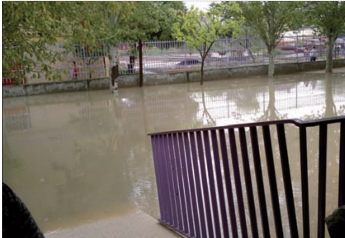
Imagen del patio inundado del colegio Pablo Picasso el pasado viernes

Tras informar al Ayuntamiento de la situación, varios técnicos municipales se acercaron hasta el colegio para liberar el sumidero y que el patio pudiera secarse. Mientras tanto, los alumnos salieron por otro de los cuatro pabellones con los que cuenta el