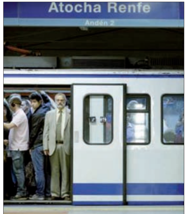
Aglomeración en el Metro

Para el buen desarrollo de la misma, los trabajadores de Metro de Madrid y EMT han reclamado la participación de sus compañeros del transporte co-