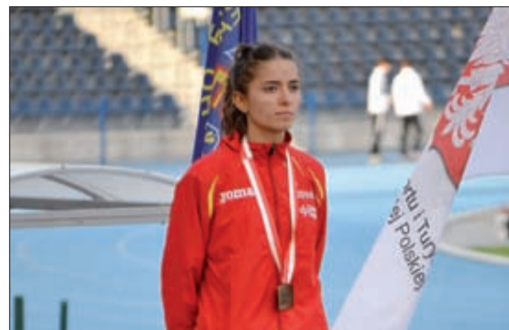
Ugrai subió en tres ocasiones al podio

Por su parte, el Atlético de Pinto recibe a un rival directo por la permanencia como es el filial del Alcorcón. Los jóvenes jugadores alfareros se van reponiendo de un comienzo nefasto en el que acumularon nada menos que cuatro derrotas consecutivas. A pesar de ello, el Alcorcón B ya lleva dos jornadas sin conocer la derrota gracias a un triunfo ante el Villaviciosa y un empate ante el Atlético C.