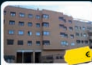
Valdemoro Av. de Europa, 112

Precio actual desde 153.000 € Ref. 10603478